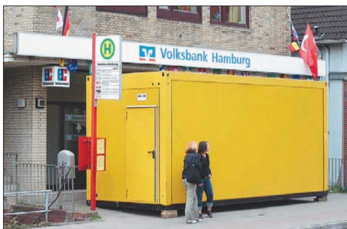
Seit Mittwoch steht dieser gelbe Filialcontainer direkt vor der Zweigstelle