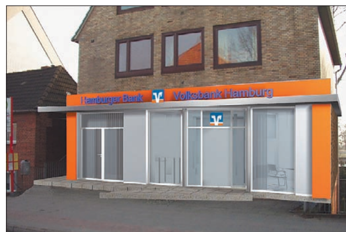
Die visualisierte zukünftige Außenansicht der Gemeinschaftsfiliale, deren Eröffnung am 11. September geplant ist.

ten und haben vor Ort ein noch spezifischeres Berater-Team.