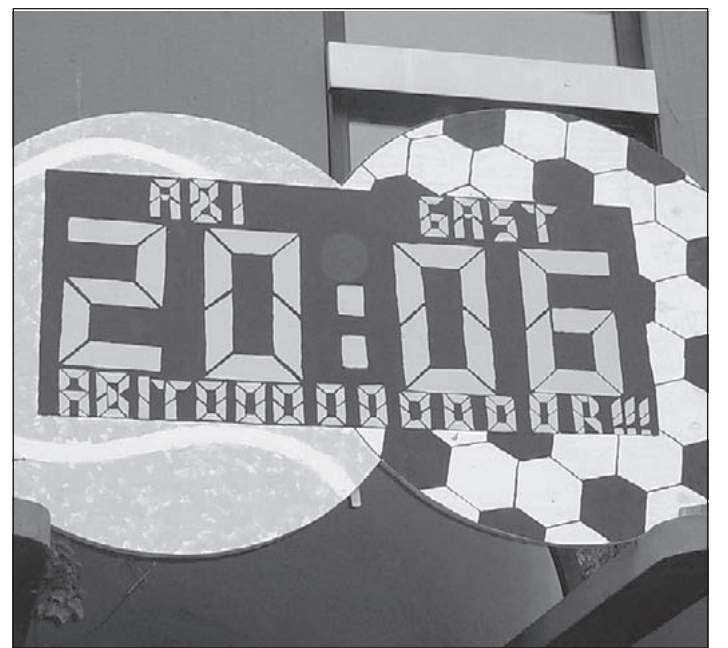
Was soll uns dieses Schild sagen? 20:06, fängt dann das Endspiel der WM an, oder wird es der Spielstand nach dem Elfmeterschießen sein? Interprätationsmöglichkeiten gibt es viele, doch für die Neu Wulmstorfer Abiturienten bedeutet es nur: Geschafft - Abi 2006 ... und nie mehr Schule!

(mk) Neugraben. Zur Saison-Eröffnung am 14. Mai hat der „Förderkreis Freibad Neugraben“ dem Freibad eine Spende in Höhe von 2.000 Euro übergeben. Ein Teil dieses Geldes wurde in die Anschaffung eines Beamers investiert, mit dem jetzt alle Fußballspiele - die vor 20.00 Uhr beginnen! - im Freibad live übertragen werden. Fußballfieber und heiße Spiele lassen sich im Freibad Neugraben also bestens mit Badespaß und einem Sprung ins kühle Nass kombinieren. Und ab 17.00 Uhr gibt es diese Erfrischung mit der Feierabendkarte für 1 Euro für Erwachsene bzw. 50 Cent für Kinder besonders günstig.