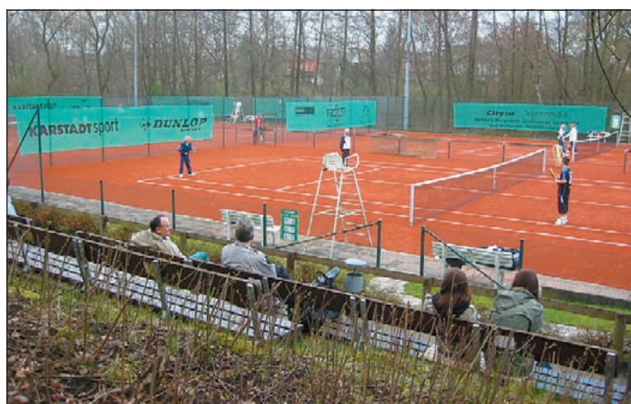
Auf den neuen TVV-Tennisplätzen macht der weiße Sport noch mehr Spaß als vorher auf den alten.

Weitere Information gibt der Spartenleiter Bernd Schallon unter Telefon 040/700 88 75.