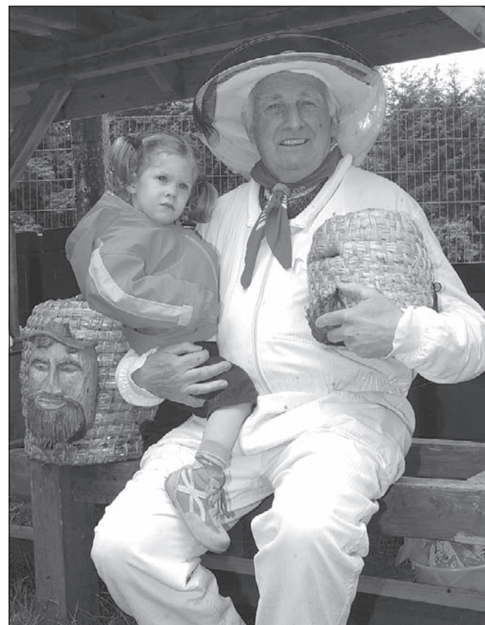
Imkerei im Wildpark Schwarze Berge: Besonders Kinder wollen wissen, wie und woher der süße Honig kommt

Natürlich gibt es auch tolle Aktionen für die Kinder mit Spielen und Basteleien, wie zum Beispiel Kerzendrehen. Wer selbst gerne einmal Bienen halten möchte, kann sich umfassend über alle notwendigen Voraussetzungen hierzu informieren.