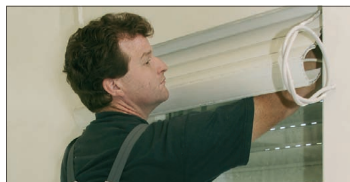
(mG) Werden im Zuge einer Altbau-Sanierung neue Fenster eingebaut, lässt sich der Rollladen komplett herausnehmen. Dadurch kann der Rollraum zum Zimmer hin völlig verschlossen und gedämmt werden. Montage und Reparatur des Rollladens erfolgen dann von außen.

Im Zuge einer Sanierung ist noch mehr möglich, vor allem in Sachen Dämmung. So können die Rolläden ganz herausgenommen und der Rollraum zum Zimmer hin völlig geschlossen und gedämmt werden. Dadurch entfällt der häufig ungedämmte