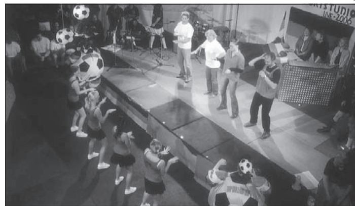
Vier Lehrer mussten auf der Bühne die Cheerleader nachahmen, da schlummerte doch manches Talent in den Pädagogen.

Mit dem lang ersehnten Reifezeugnis werden die jungen Menschen in den nächsten Wochen und Monaten in Ihre Zukunft starten. Dann heißt es wieder: lernen, lernen, lernen - aber daran denkt heute noch niemand!