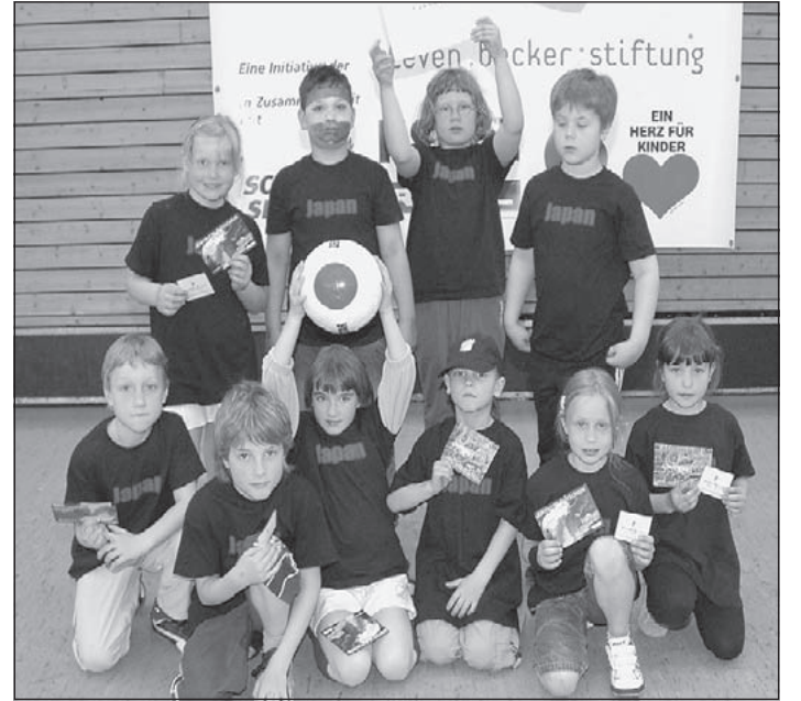
Die „Japaner“ von der Falkenberg-Schule mit dem Derbystar-Ball in ihrer Landesfarbe schieden leider vorzeitig aus.

von „fit-4-future“, Marcel Wisler, verteilten an das Japan-Team Eintrittskarten für die Spielstadt Hamburg XXL und an die „Ukrainer“ Freikarten für das Salü in Lüneburg und den Vogelpark in Walsrode. Und als „Trophäe“ nahmen die Schüler vom Heiderand neben der Siegerurkunde auch jeweils einen Derbystar-Fußball in den Landesfarben von Japan und der Ukraine mit in ihre Schule.