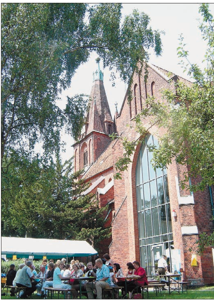
Im Schatten der Bäume hinter der St. Nikolai-Kirche feierte die Gemeinde mit ihren Gästen das 125-jährige Jubiläum.