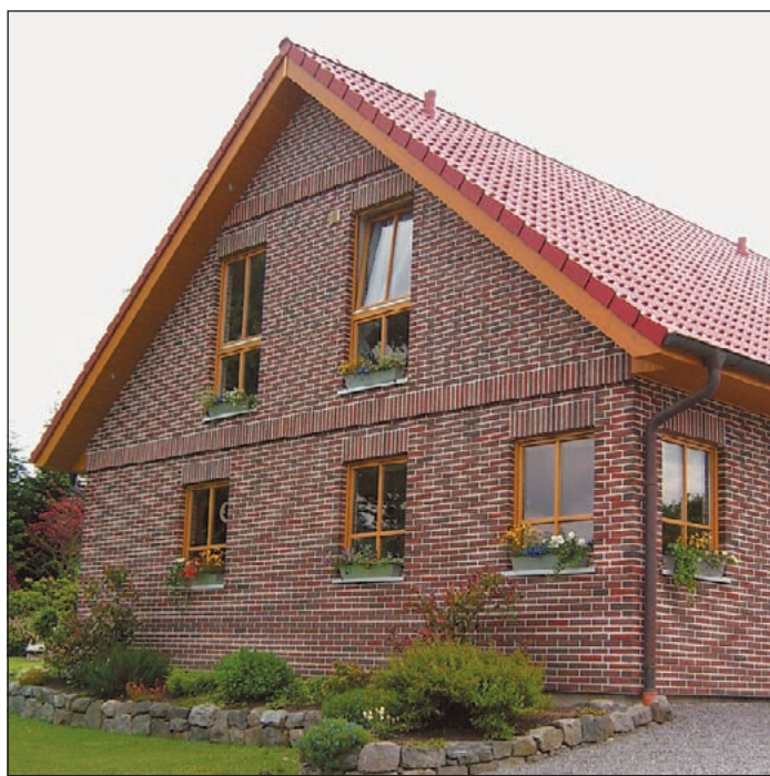
Mit Haacke-IsolierKlinkern können Sie Energie sparen und den Wert Ihres Hauses steigern.

Ein weiterer Vorteil einer neuen IsolierKlinker-Fassade ist die optische Aufwertung und damit verbundene Wertsteigerung des Hauses. Die Fa. Haacke bietet z.B. seit über 45 Jahren ihr patentiertes IsolierKlinker-System an, bei dem in eine hochdruck-