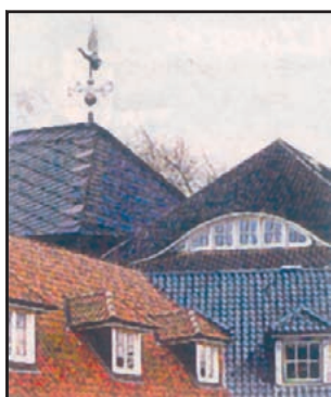
Für Sie auf der Höhe!

Ausführung sämtlicher Dachdeckungs- und Abdichtungsarbeiten Bauklempnerei