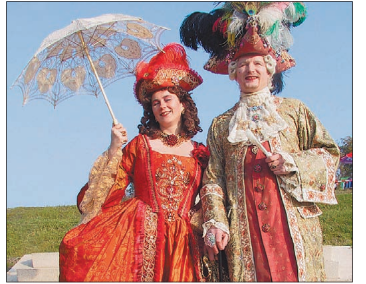
Rokoko-Paare schlendern über das Gelände und bezaubern die Gäste mit ihren Galanterien.

fünf Winsener Sommernächte mit spannenden, effektvollen und fantastischen Ideen Jung und Alt. Die nächste Veranstaltung findet am Samstag, 22. Juli, statt. Dann lädt die Landesgartenschau zu märchenhaften „Gute-Nacht-Geschichten für große und kleine Kinder“ ein.