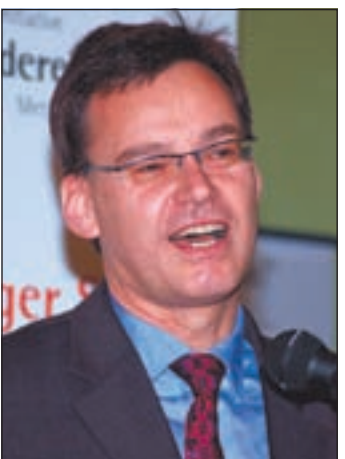
Senator Axel Gedaschko würdigte die Bemühungen der Süderelbe AG, den Hamburger Süden und die angrenzenden Landkreise wirtschaftlich nach vorn zu bringen.

wenn es darum geht, eine abgestimmte Verkehrspolitik für Norddeutschland zu erzielen. Nur eine gemeinsame Position des ganzen Nordens könne hier die notwendige Stärke und Dynamik aufbringen.