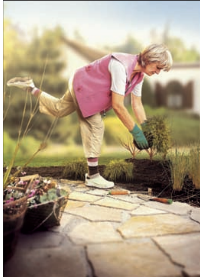
(mG) Durch Gartenarbeit (Zupfen, Rupfen, Bücken, Klettern, Strecken, Graben...) wird nicht nur der Garten fit!

Sie sind der verdiente Lohn für die vielen geleisteten Arbeitsstunden, Fitnesstraining inklusive!