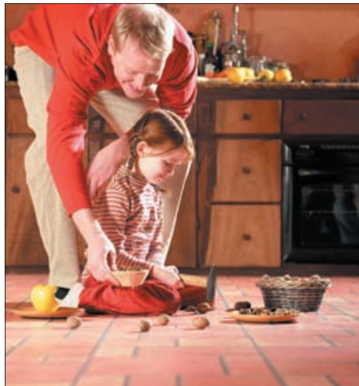
(mG) Täuschend echt sieht dieser Laminatboden im Fliesendeckor Ziegel aus. (100)

Laminatböden zeichnen sich durch ihre geschlossene Oberfläche aus, in die kein Schmutz eindringen oder fest darauf haften kann. Folglich sind sie äußerst hygienisch, pflegeleicht und auch für Allergiker geeignet.