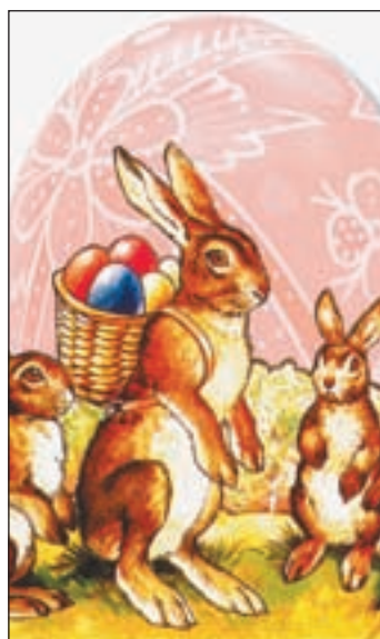
Auch dieses alte Osterhasen-Plakat ist in der Ausstellung zu sehen

Doch was wäre ein Osterfest ohne die Suche nach bunten Osternestern? Der Bioland Verband und das Freilichtmuseum