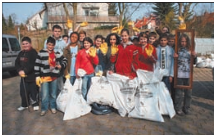
Es ist geschafft: Ganze 103 Säcke mit Müll mussten abschließend abgeholt werden

Mit viel Begeisterung zogen die Grundschüler dann los. Die Frage „Wer findet am meisten Müll?“ beschäftigte alle und schnell stöberten sie die Müllecken im Stadtteil auf. „Wir brauchen einen neuen Müllsack, der hier ist schon voll!“ war einer der am meisten gesprochenen Sätze. Dass so schnell die Säcke gefüllt werden würden, damit hatten die Lehrer nicht gerechnet. Nachschub aus der Schule musste her. Die Nachbarn der