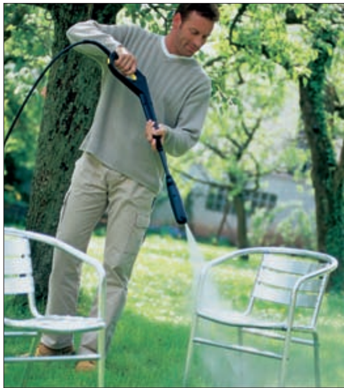
(mG) Mit Hochdruckreiniger erleichtern das Reinigen der Gartenmöbel und der Terrasse erheblich.

Beratung und Hilfe bei der Auswahl gibt es im Fachhandel.