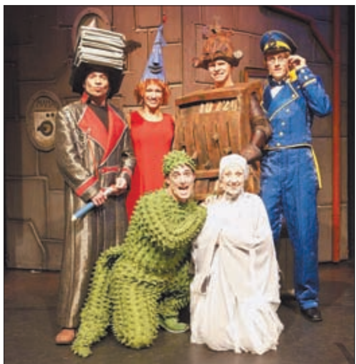
Ritter Rost, das Burgfräulein Bö, Koks, der Hausdrache und König Bleifuß sind die Protagonisten der Aufführung in der Sandra Keck Regie führt

Fremdenverkehrsverein Ferienregion Nordheide (0 41 81/282810) sowie beim OMS-Ticketservice bei Karstadt Harburg (040/775 58 19).