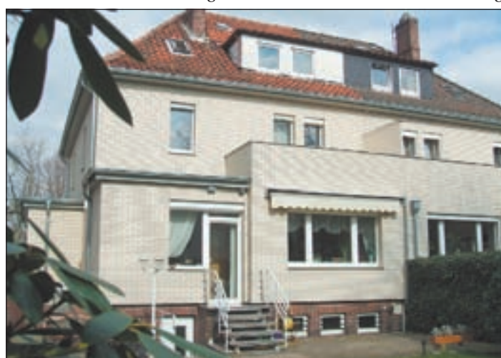
Dieses 2-Familien Stadthaus erstahlt mit Haacke Isolierklinkern in neuen Glanz.

Haacke erstellte ein ausführliches Festpreis-Angebot, in dem alle Details berücksichtigt wurden. Referenzobjekte überzeugten schließlich sogar den Nachbarn, und so wurde der Auftrag für das gesamte Doppelhaus erteilt. Alle Arbeiten verliefen reibungslos „Hand in Hand“, denn die Koordination aller Arbeiten hatte die Haacke-Bauleitung