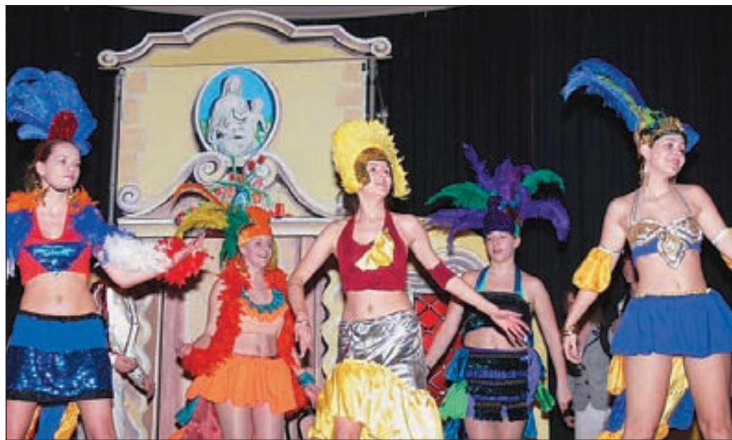
Auch in die Welt der Samba-Schulen aus Brasilien entführten die Musical-Darsteller ihre Zuschauer.

Vom 7. bis zum 10. Juni geht es mit allen 160 Teilnehmern zum Kirchentag nach Köln. Anschließend wird es noch drei weitere Aufführungen geben: am: 5./6./7. Juli in der Eberthalle geben. Besonders interessant sind die Aufführungen für Schulklassen vormittags vom 4. bis 6. Juli ebenfalls in der Eberthalle. Anmeldungen sind jetzt schon möglich, die Buchungen laufen über das Sekretariat der Gesamtschule Harburg, Telefonnummer 428 871 – 0. Der Kartenvorverkauf für die weiteren Abendvorstellungen beginnt im Mai.