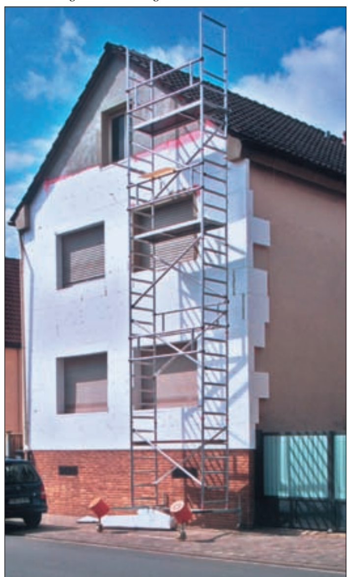
(mG) Wer knappe Ressourcen schonen möchte, setzt auf energetische Modernisierungsmaßnahmen.

(mG) Ein Blick in die Zukunft ist ernüchternd: Den heutigen Bedarf vorausgesetzt, reichen die weltweiten Vorkommen an Öl und Gas nur noch wenige Jahrzehnte. Bereits in 40 Jahren sollen die Quellen des qualitativ hochwertigen Erdöls versiegen. Bei der Verfügbarkeit von Erdgas gehen die Experten von rund 50 Jahren aus.