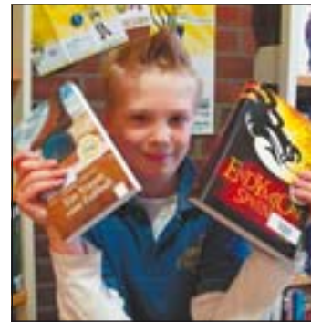
Der Julius-Club wendet sich in den Sommerferien ausdrücklich an alle Leseratten

Neben den offiziellen Begrüßungsreden sorgen Cheerleader und Spieler der Blue Devils sowie der Flag Devils für Stimmung und gute Laune. Alle Jugendlichen die am Julius-Club teilnehmen wollen, können sich vor dem Exklusiv-Fotoshooting kostenlos schminken und frisieren lassen. Erst dann wird in der Gemeindebücherei das große Geheimnis um die 40 Bücher gelüftet, die es zu lesen gilt. Alle Teilnehmer können diese aktuellen Titel kostenlos zwischen dem 6. Juli und 31. August 2007 ausleihen. Wer in der Sommerzeit drei Bücher gelesen und bewertet hat, erhält das Juli-