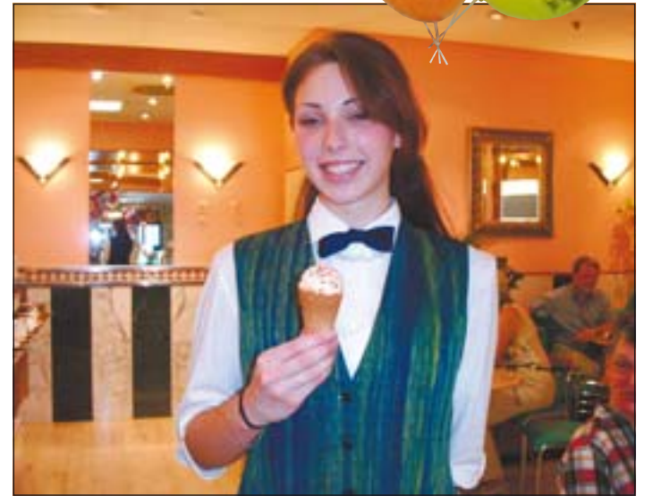
Ein Eis zur Belohnung gibt es, wenn alle Stempel gesammelt wurden.

Das „Schweinerennen“ bei Optik Hornung ist sicher auch in diesem Jahr wieder saumäßig lustig und wer bei der Markt-Apotheke den Kartoffellauf hinter sich gebracht hat, ist schon mit dem halben Programm fertig.