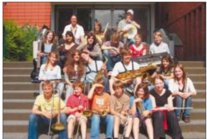
Ein Coaching hat die Band „Lydit“ vom Gymnasium Süderelbe im Wettbewerb „Kleine Töne – große Sounds“ gewonnen

Das Projekt „Kleine Töne – große Sounds“ hilft nun mit