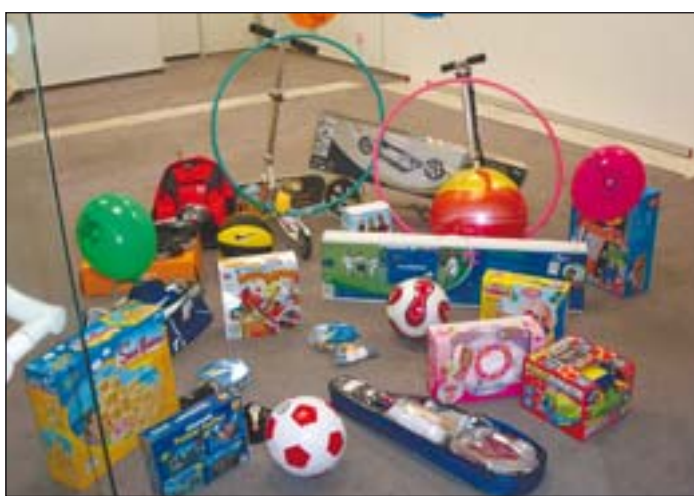
Viele attraktive Preise winken den Teilnehmern an der Rallye. Zur Verfügung gestellt wurden sie von den Geschäftsleuten