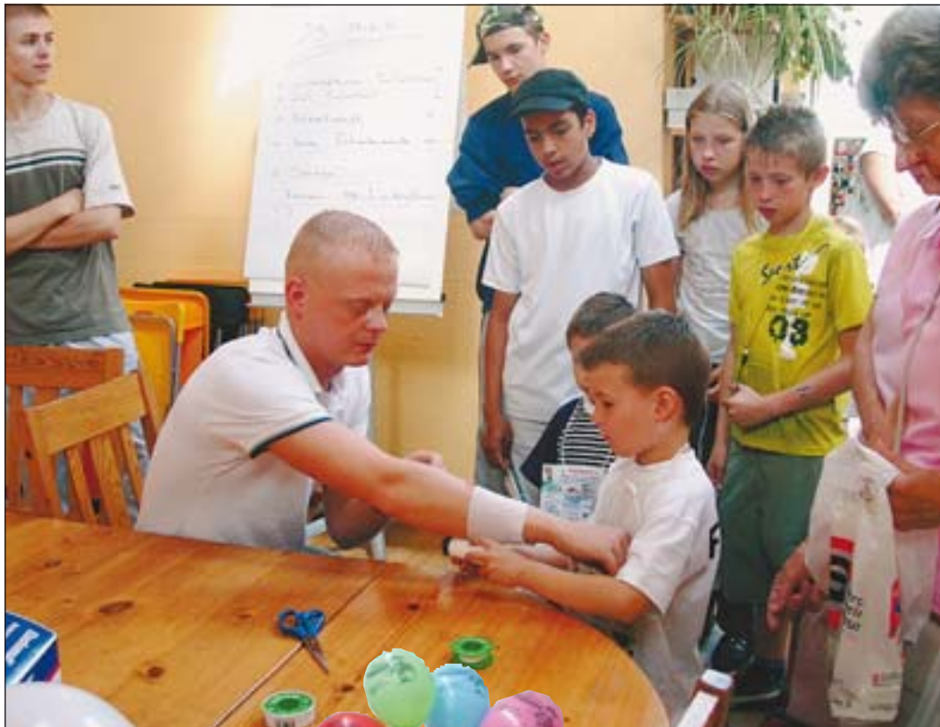
Beim ASB wird fachmännisch ein Verband angelegt.

Die Verbundenheit der ortsansässigen Geschäfte und der Verantwortlichen der beteilig-