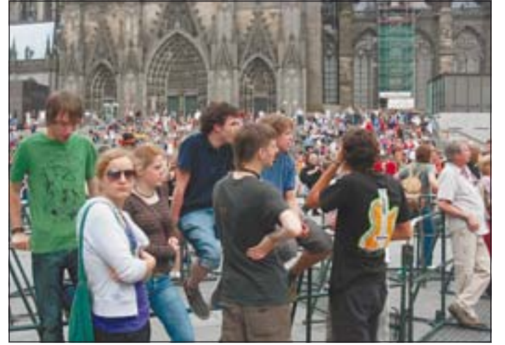
Sehen und gesehen werden auf der Domplatte.

bereits glühendheißen Asphalt-parkplatz bildeten sich Menschen-schlangen. Die 800 Plätze sind voll besetzt und 200 Leute stehen immer noch vor der Tür. Nichts geht mehr in der Stadthalle Mülheim. Zum Trost verteilen die Begleiter Flyer und weisen auf die zweite