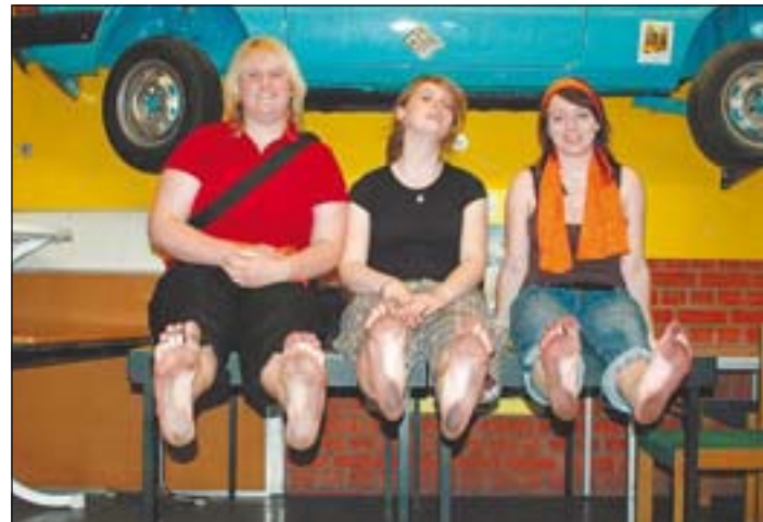
Viel Stehvermögen mussten die GSHler haben. Dass man dabei schwarze Füße bekam, wundert es?!“