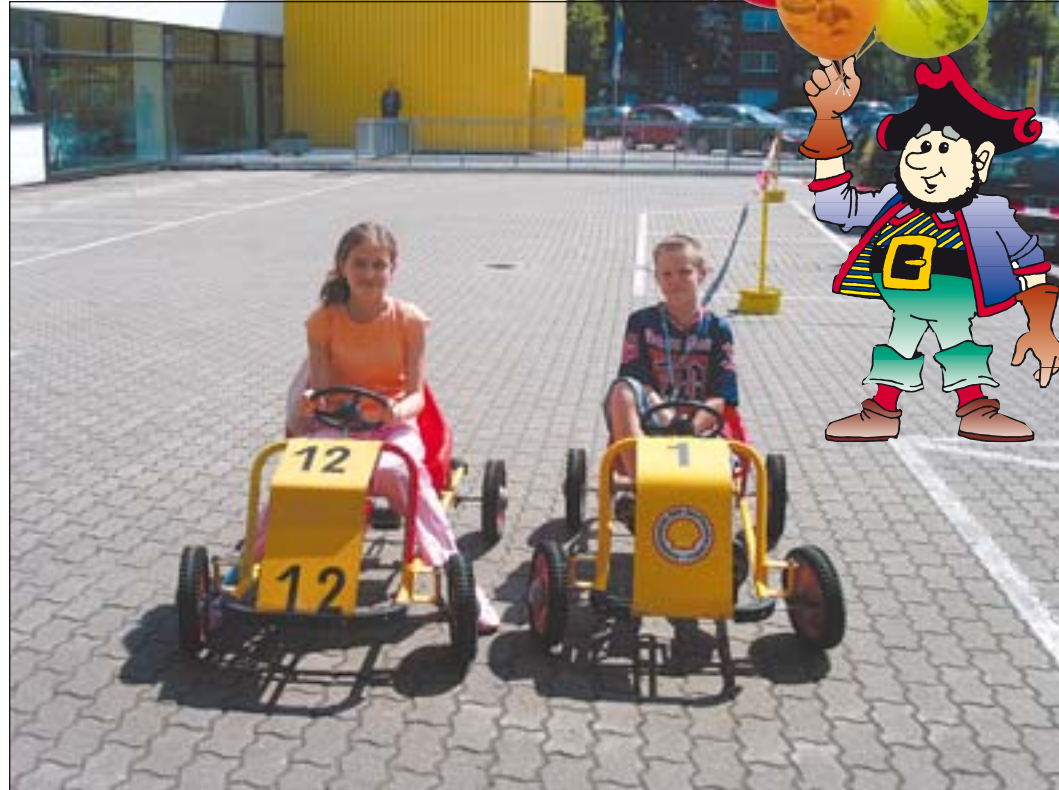
Go-Cart-fahren auf dem Rundkurs beim Autohaus Rubbert.