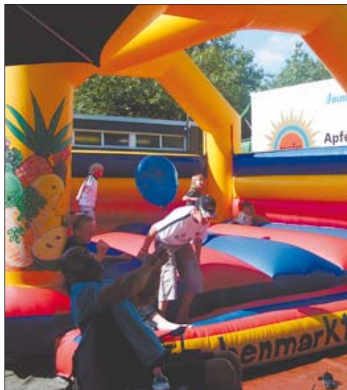
Die Hüpfburg auf dem Wochenmarkt ist für alle Kinder ein toller Spaß.