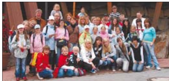
Einen abwechslungsreichen Tag verbrachten die MightyStorms im Heide Park Soltau

Gestärkt ging es dann weiter zur Wildwasserbahn, zur Bobbahn, noch einmal in eine der Achterbahnen und zum Mountain Rafting. Um 18.00 blieb noch für einen kurzen Abstecher zur Eisdielen noch Zeit, so dass ein fröhlicher Tag mit einem ausgiebigen Eisbecher seinen Abschluss fand. Erschöpft stieg der Fischbek-Tross gegen 18.30 Uhr in den Bus, um die Heimreise anzutreten.