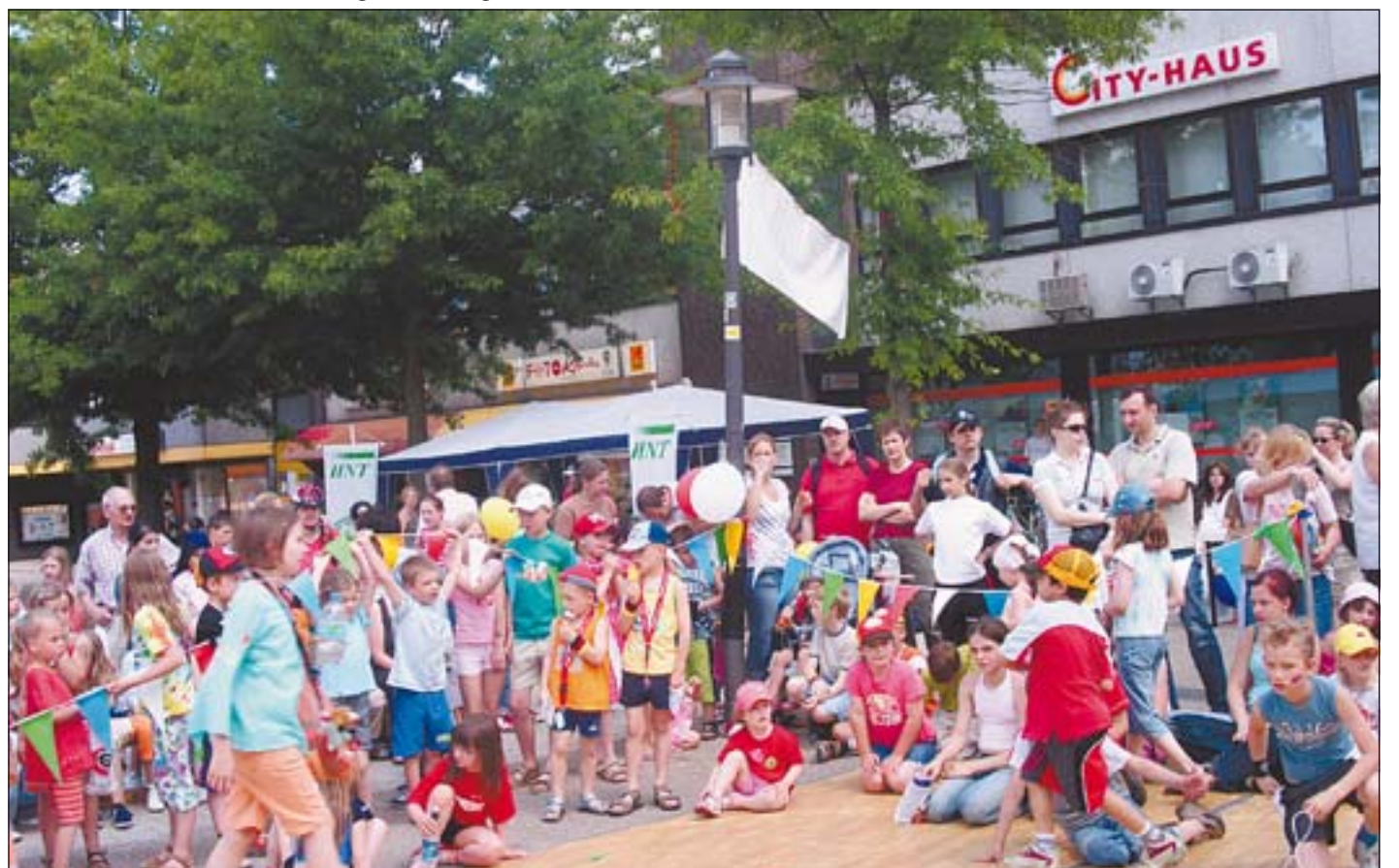
Ein großes Gedränge gibt es immer wieder wenn im 10.00 Uhr die Rallye bei der HNT-Bühne beginnt.

nur ihr Gesicht in eine „Has und Igel“- Wand stecken und sich als kleines Igelchen fotografieren lassen. Nach der Rallye gibt es dann noch ein tolles Erinnerungsfoto zum Mitnehmen! Beim Scheibenspiel kommt es bei Augenoptik in der Bahnhofstraße auch in diesem Jahr wieder mehr auf Glück als auf Geschick an.