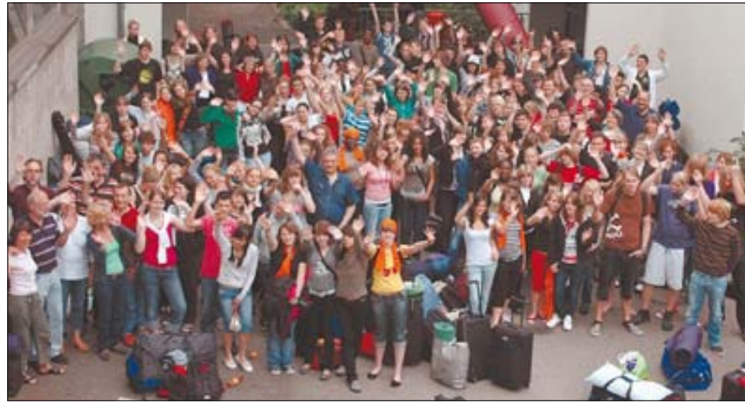
170 Schüler nebst Lehrern und Eltern waren zum Kirchentag nach Mülheim gefahren.