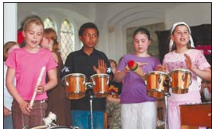
Auch die Percussion-Group hielt den Takt und unterstützte damit die Chorsänger

Kronende Abschluss war dann der bekannte Kanon „Es tönen die Lieder“ in den alle Instrumentalisten und Sänger und schließlich sogar das gesamte Publikum mit einbezogen wurden.