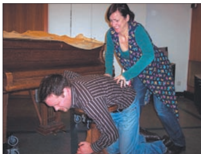
■ (pm) HARBURG. Das Harburger Theater-Sündikat präsentiert am Mittwoch 26. März im Rieckhof die Komödie „Hier sind Sie richtig“ von Marc Camoletti. Die Premiere beginnt um 20.00 Uhr. Es ist ein urkomisches Stück über alternde Revuestars, Klavierlehrerinnen, Models mit Krämpfen,

Maler, Mieter und Hausmädchen die die Folgen zu kurz gehaltener Angaben für ihre Tätigkeit auf ihre ganz eigene Weise zu spüren bekommen. Regie führt Harry Thomßen. Eine weitere Vorstellung ist am 2. April ebenfalls im Rieckhof zu sehen. Beginn auch 20.00 Uhr.