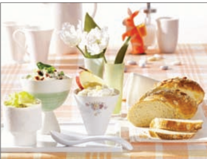
Da isst das Auge mit: Mit hübsch dekorierten Osterfrühstückstischen und liebevoll angerichteten Speisen, verwöhnen viele Restaurants ihre Gäste zu Ostern.