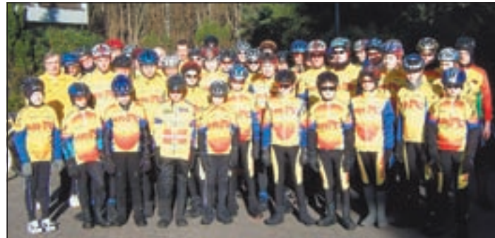
Gemeinsamer Ausritt: Die Harburger Radsport Gemeinschaft in Hitzacker.