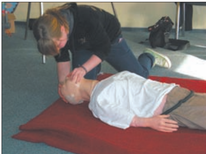
An Puppen wurde die praktische Anwendung des Gelernten geübt.

fibrillators (AED). Ebenso lernten sie verschiedene Beatmungshilfen kennen. Neben der Wissensvermittlung durfte auch der Spaß nicht zu kurz kommen. Es wurde also auch gespielt, gelacht und es gab Übungen zur Entspannung und Selbsterfahrung. „Wie fühlt man sich als Betroffener am Boden liegend, wenn alle um