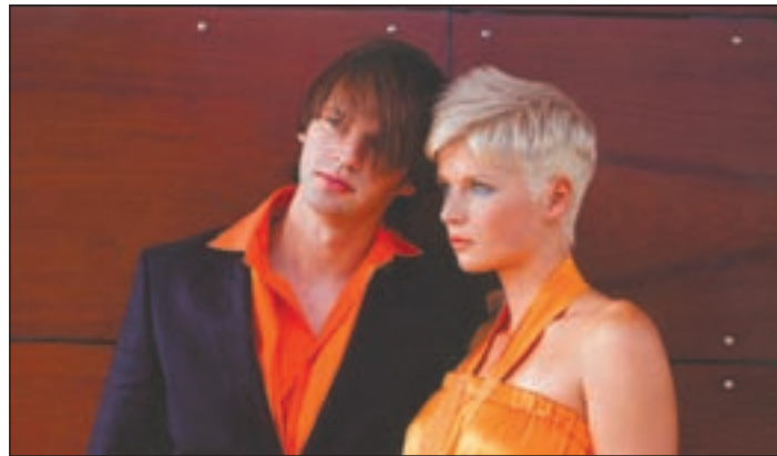
Ob für Sie oder Ihn: Schönheit beginnt am Kopf

■ HAMBURG. Zum Auftakt der Saison 2008 hat das Modeteam des Zentralverbandes des Deutschen Friseurhandwerks seine neue Trendkollektion präsentiert. Das Ergebnis sind ultrachice, unverwechselbare Looks, ein Mix aus unkonventionellen und ausdrucksstarken Frisuren. Die neuen Styles fügen sich perfekt in die aktuelle Mode ein und begeistern durch die Vielfalt an Form-, Kontur- und Farbgebung. Unterschiedliche Stilrichtungen, wie zum Beispiel Retro-Anleihen in den 20iger, 70iger oder 80iger Jahren und die Farbgestaltung, werden dabei aber generell typgerecht eingesetzt.