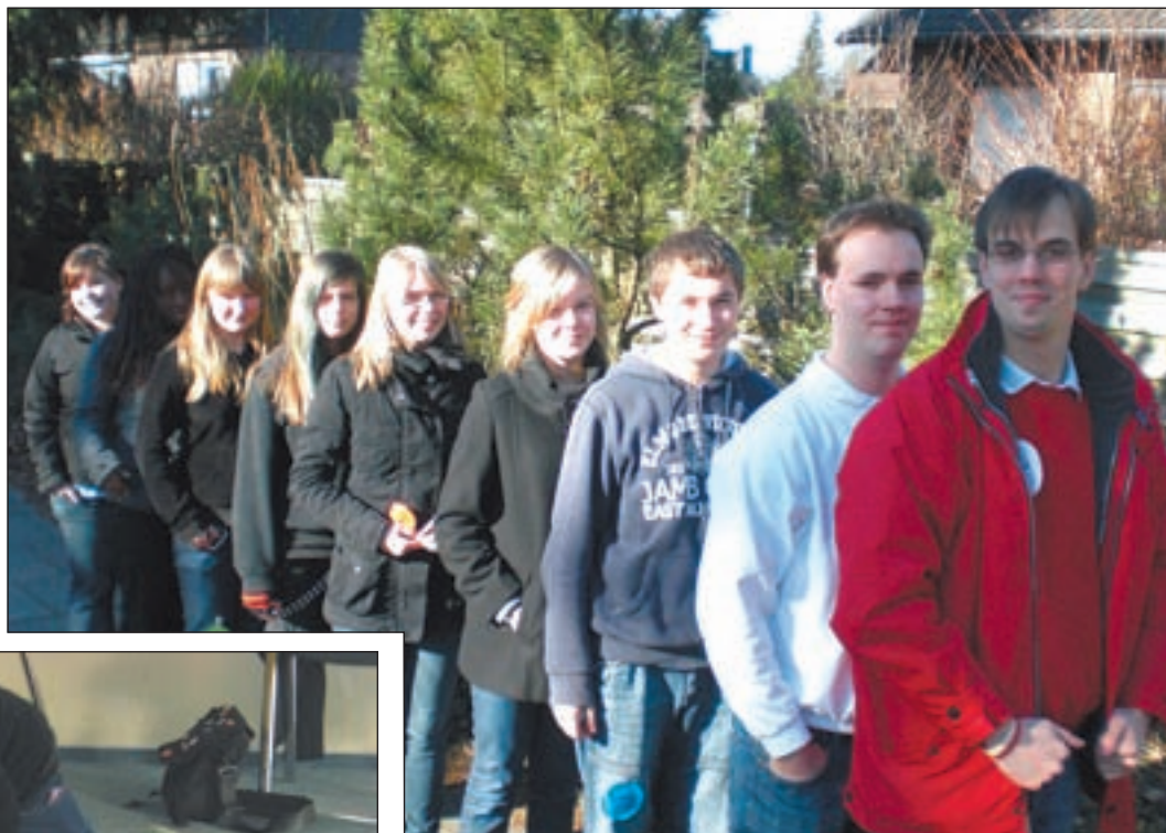
Die Schüler aus Harburg genossen diesen etwas anderen Tag.

Neben der reinen Ersten Hilfe ging es unter anderem um die Arbeit des Schulsanitätsdienstes (SSD) und der Johanniter-Jugend (JJ). Die frisch gebackenen Schulsanitäter erhielten zusätzliche fachliche Erläuterungen zur Anwendung eines automatisierten externen De-