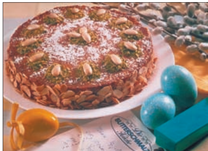
Darf zu Ostern nicht fehlen: Ein mit viel Zutaten gebackener Kuchen, verstift Ostern für die ganze Familie.

Das Osterfrühstück ist natürlich etwas aufwendiger als gewöhnlich und beinhaltet durchaus auch schnelle Pfannengerichte wie z.B. pikante Käsepannkuchen, Lachs-Kanapees, Ostereier mit leckerem Kräuterdip und einen appetitlichen Obstteller mit würzigem Käse. Dafür bleibt mittags die Küche kalt.