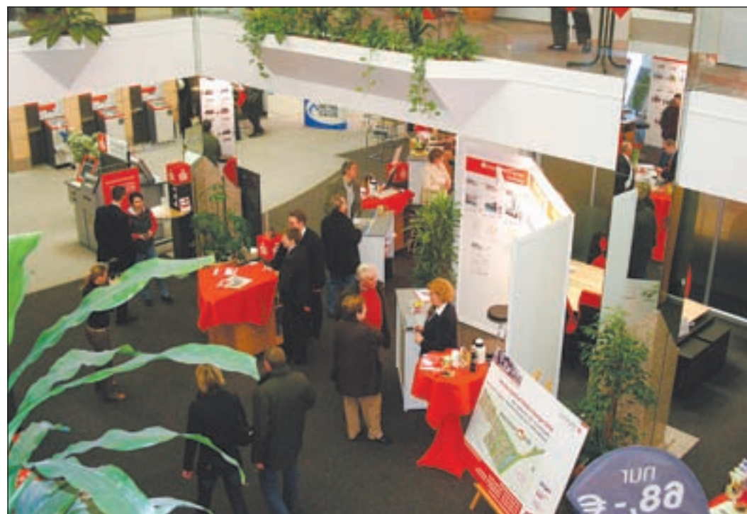
Auf der 14. ImmoBilia wurden alle Möglichkeiten für den Bau der eigenen vier Wände präsentiert

Breite Immobilienpalette für nahezu jeden Wohnwunsch