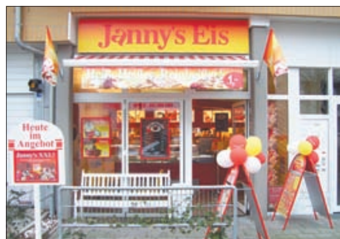
Janny's Eis in der Eißendorfer Straße 70: Hier gibt's aus nur eis aus Naturprodukten.