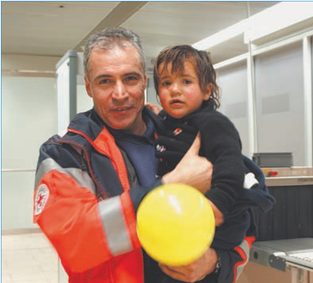
Dieses fünfjährige Mädchen musste bis nach Gießen transportiert werden, auch hier half der DRK-Kreisverband Harburg

Ein fünfjähriges Mädchen, das 450 Kilometer bis nach Gießen transportiert wurde, war ein besonders schwieriger Fall. Das Kind, das an einem schweren Herzfehler leidet, verbrauchte 12 Liter Sauerstoff in der Minute. „Kurz hinter Hannover gingen die Vorräte im Notarztwagen langsam zur Neige, so dass wir Hilfe anfordern mussten“, sagt Pillath. „Sofort erklärte sich ein Rotkreuzverband aus Hannover bereit, uns eine Sauerstoffflasche zu bringen – die Zusammenarbeit klappt einfach hervorragend.“