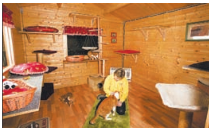
Auch ein „Mehrbettzimmer“ erwartet die Gäste.