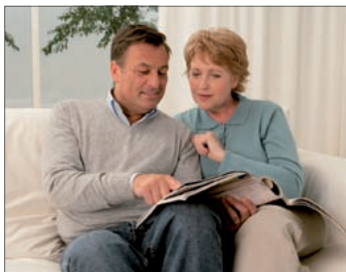
Mentale Fitness kennt kein Alter. Sie können mit 50 mental so leistungsfähig sein wie Sie es vorher waren.

stärkt darauf einstellen müssen, Produkte und Dienstleistungen zu durchleuchten, die sich auf die Wünsche der Mehrheit der insgesamt alternden Kunden beziehen und weiterentwickeln lassen. Wer zukunfts- und wettbewerbsfähig bleiben will, kommt seiner Meinung nach nicht darum herum, die Kompetenzen Älterer zukünftig stärker zu nutzen – schließlich sind sie oftmals eher in der Lage komplexe Aufgaben zu lösen, können betriebspezifische Besonderheiten besser erfassen und integrieren. Um ihre Leistungsfähigkeit möglichst lange zu erhalten, wird man die betriebliche Gesundheitsförderung auf- und ausbauen sowie die Arbeitsabläufe den Bedürfnissen älterer Mitarbeiter anpassen müssen. Aber auch die Generation 50 plus ist zunehmend gefordert, sich lebenslang weiterzubilden und zu lernen. Und für den Erhalt seiner mentalen Fähigkeiten kann jeder einzelne eine Menge tun: Zum einen durch ein geeignetes Trainingsprogramm für die grauen Zellen (z.B. im Internet: www.mental-aktiv.de ) – zum anderen mithilfe von hochwertigem Ginkgo-Spezialextrakt, der die „Kraftwerke“ in den Gehirnzellen (Mitochondrien) vor Leistungsabfall schützt. Selbst angegriffene Zellen können wieder regeneriert werden. So wird auf natürliche Weise die geistige Leistungsfähigkeit gesteigert.