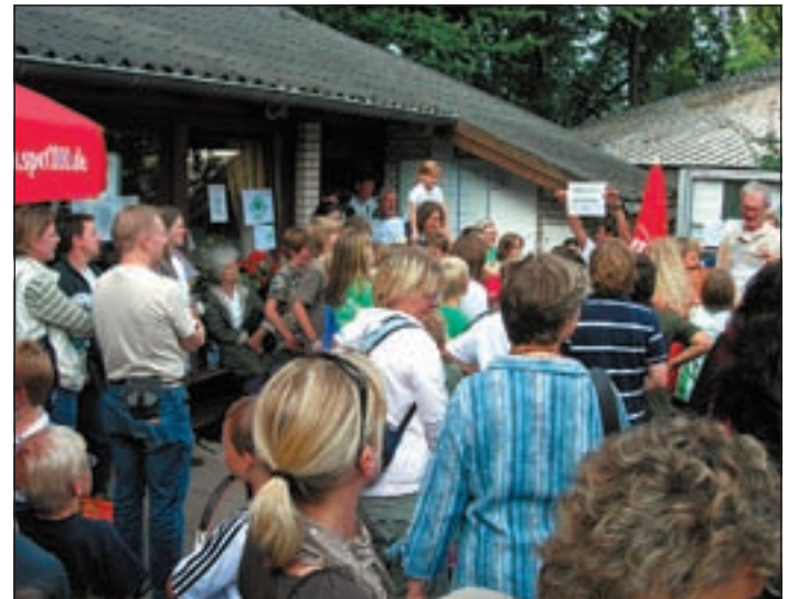
Großen Andrang gab es nicht nur bei der Tombola in der Scharfschen Schlucht.

Rund 400 Zuschauer beim Schluchtfest von Grün-Weiß