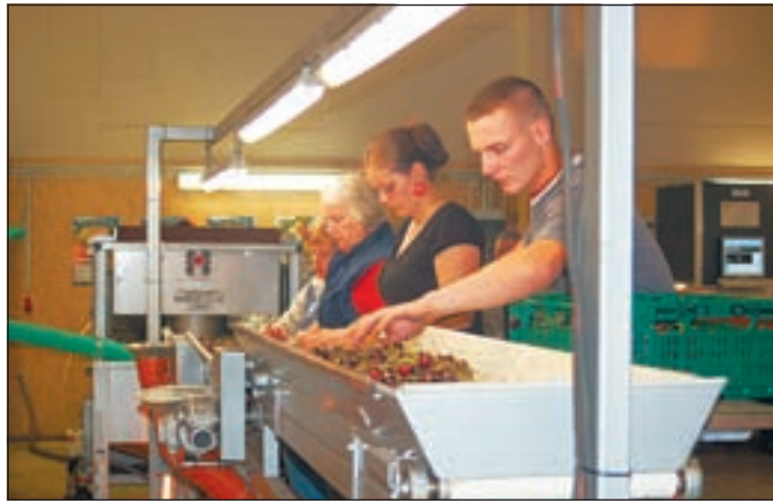
Im Zuge der Installation der Sortieranlage mussten auch neue Mitarbeiter eingestellt werden.

wo beispielsweise günstigere Trauben herkommen. Wenn sie mehrere Tausend Kilometer mittels Lastwagen nach Deutschland transportiert werden müssen, belastet das die Umwelt. Deswegen sollte man qualitativ hochwertiges Obst von Bauern aus dem Alten Land kaufen, wodurch gleichermaßen der Region und dem Klimaschutz gedient wird. Also: Kauft heimisches Obst!“, ermunterte Gedaschko seine Zuhörer. Doch nicht nur mit Obst macht Jürgen Ecks sein Geschäft. Der Betriebsleiter hat seit 2003 von der Behörde für Stadtentwicklung und Umwelt (BSU) rund 60 Hektar Grünland als Ausgleichsflächen im Moorgürtel gepachtet. Die Bewirtschaftung der Flächen unterliegt diversen Auflagen, die über Ausgleichszahlungen kompensiert werden. Das Wiesengras würde teilweise im eigenen Pensionspferdebe-