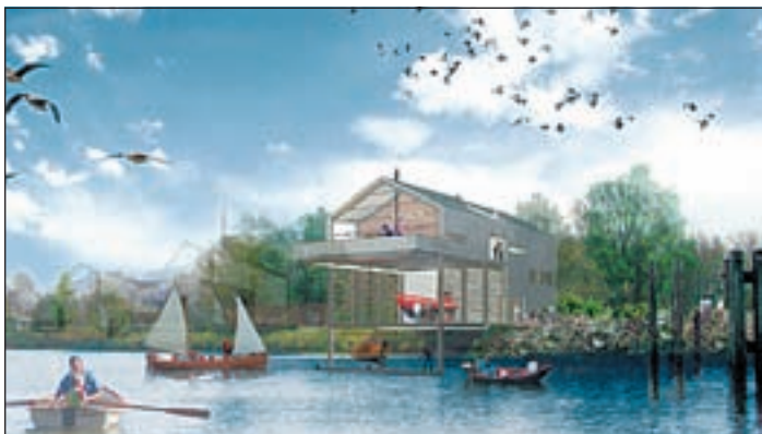
„Auch wenn es nur um ein kleines Haus mit etwa 400 qm Nutzfläche geht: Es ist ein attraktives Gebäude für Jugendliche“

Get the Kick möchte noch in diesem Jahr den Grundstein legen. Das Ergebnis des Wettbewerbs ist ab sofort in der Ausstellung IBA at WORK am Berta-Kröger-Platz in Wilhelmsburg zu sehen.