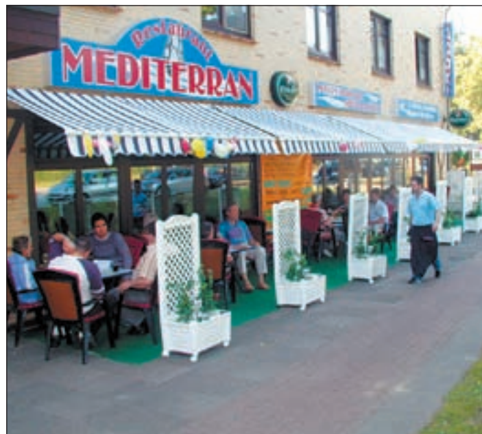
Das Mediterran verfügt, nebenbei bemerkt, auch über eine Bundeskegelbahn auf der man nach einem ausgiebigen Mahl seine überschüssigen Kalorien wieder abarbeiten kann. Also viele gute Gründe, dem „Mediterran“ einen Besuch abzustatten und sich dort einmal aufs Beste verwöhnen zu lassen.

Urlaubsstimmung erahnen. Unter Palmen oder einem Lorbeerbaum genießt man hier die köstlichsten Spezialitäten ferner Länder. Außerdem lockt im Sommer und bei herrlichem Wetter eine große Terrasse, auf der es sich bequem und angenehm sitzen lässt, ohne dass irgendwelche Passanten einem ständig beim Essen auf den Teller schauen. Wenn sich dann der Chef auch noch persönlich an die Tische der Gäste begibt um sich nach dem