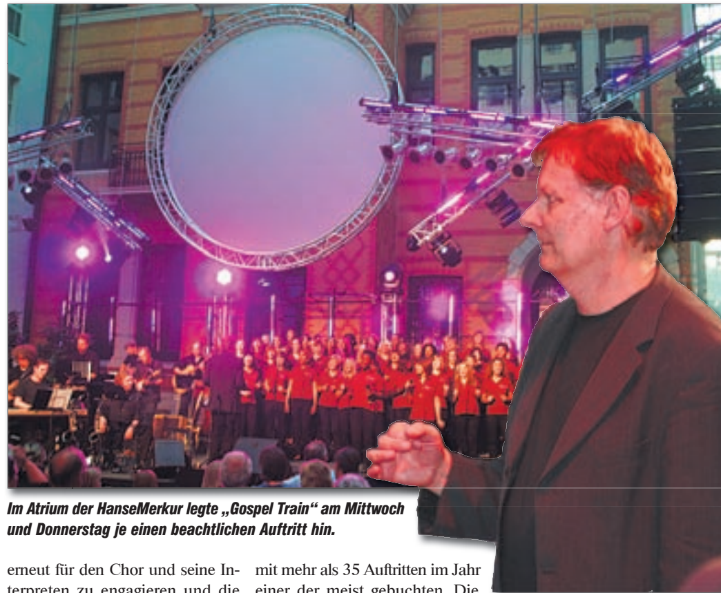
Im Atrium der HanseMerkur legte „Gospel Train“ am Mittwoch und Donnerstag je einen beachtlichen Auftritt hin.

erneut für den Chor und seine Interpreten zu engagieren und die gesamte CD-Produktion zu übernehmen, die, nebst einer DVD, an diesen beiden Tagen entstanden ist. Hochprofessionelle Technik hat-