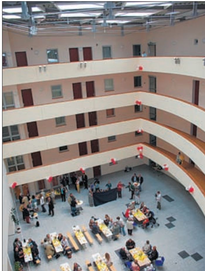
Wo früher das Pöblikum im Saal Winnetou huldigte, bietet ein helles Atrium die Möglichkeit zum gemütlichen Aufenthalt