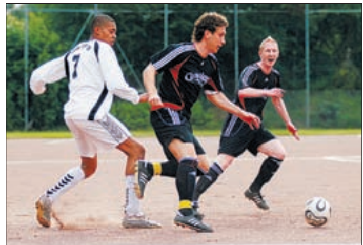
Rasante Spiele sind garantiert: Der Harburg-Pokal geht heute in die 22. Auflage.