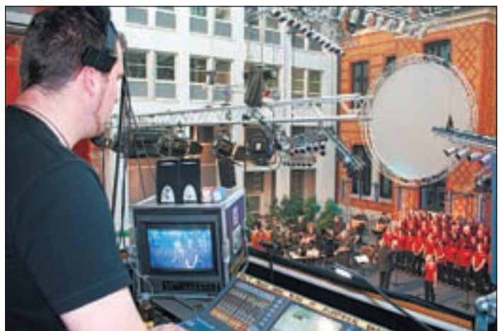
Technik der Extraklasse hatte „Blue Noise“ für die Produktion der neuen CD aufgeföhren.