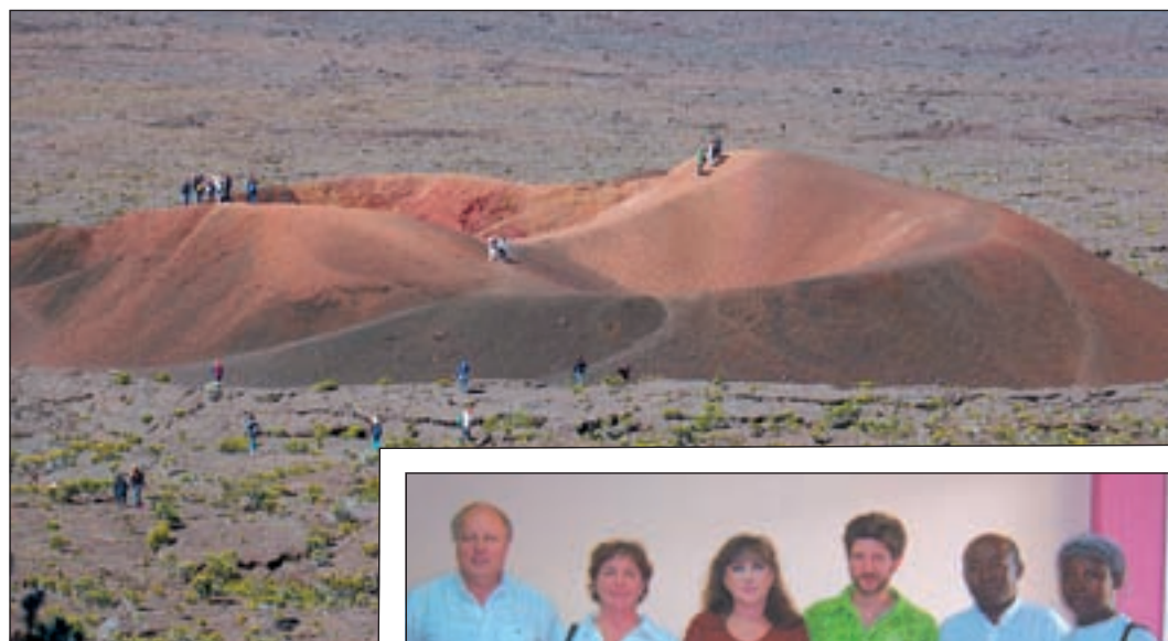
Die Schüler bei ihrer Wanderung zu den Vulkankratern auf La Réunion.

■ RÖNNEBURG. Nachdem 23 französische Schüler Ende Januar in Hamburg waren (der „Neue Ruf“ berichtete), wurde nun für eine Schülergruppe vom Alexander-von-Humboldt-Gymnasium der Traum wahr: der Gegenbesuch auf der südlichen Erdhalbkugel auf der Tropeninsel La Réunion.