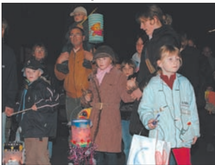
„Das war toll!“, hieß es besonders von den begeisterten Kindern.

ferde der Spielmannszug SV Wilhelmshurg von 1888 e.V. unter der Leitung von Dirk Zimmermann. Anschließend stärkten sich die Teilnehmer mit Bier, Saft und Würstchen vor der Gaststätte „Lösch-ecke“. Die SPD Eißendorf bleibt weiter aktiv: Als nächstes findet am 4.11.2008 um 19.00 Uhr das Skatturnier „Contra und Re“ in der „Lösch-ecke“ statt.