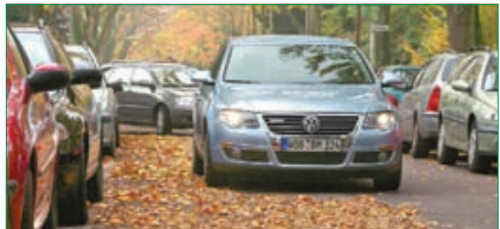
Herbstlich-bunte Blätterpracht ist zwar hübsch anzuschauen, für Autofahrer kann sie jedoch gefährlich werden. Deshalb in baumreichen Gegenden besonders vorsichtig und vorausschauend fahren.