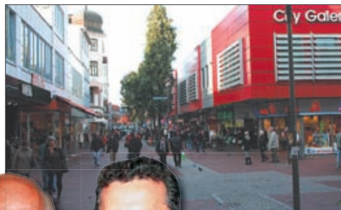
Die Lüneburger Straße und das BID, eine unendliche Geschichte.