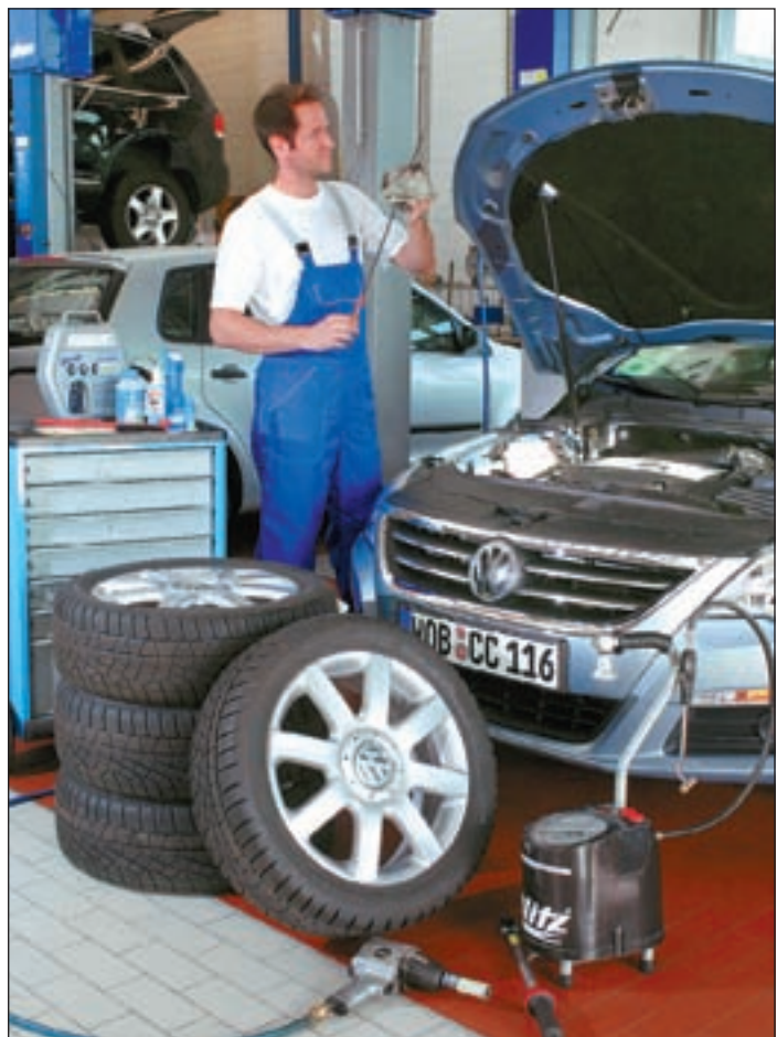
Bodenständig, zuverlässig, immer auf Achse – Winterreifen sind während der kalten Jahreszeit ein absolutes Muss.

HP: Schneematsch, Eisglätte, früh hereinbrechende Dunkelheit – der Winter bringt für Autofahrer erschwerte Fahrbedingungen mit sich. Um auch während der kalten Jahreszeit sicher ans Ziel zu kommen, sind Winterreifen für jedes Fahrzeug unerlässlich. Dieses Reifenmaterial ist speziell auf winterliche Verhältnisse zugeschnitten. Seine kälteresistente Gummimischung verhärtet weniger und gewährleistet so bessere Bodenhaftung. Winterreifen müssen eine Profiltiefe von mindestens vier Millimetern aufweisen. Zusätzlich sind sie mit Lamellen versehen, die eine bessere Haftung auf losem Untergrund und wie Schnee ermöglichen. Jeder Autofahrer, der sein Fahrzeug liebt und dem außerdem die