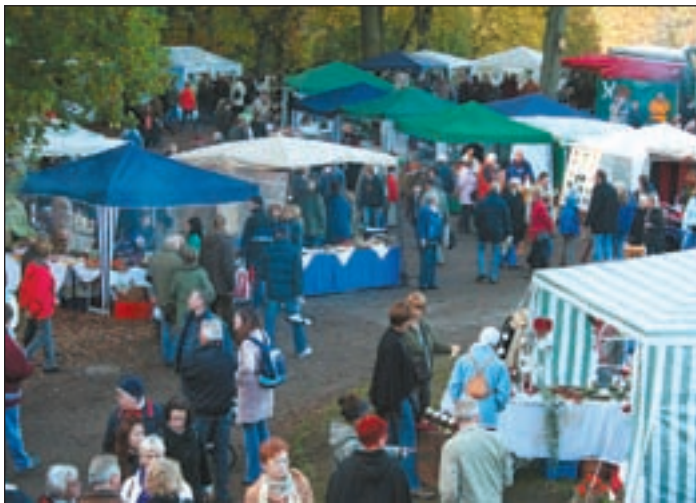
Bei herrlich-sonnigem Herbstwetter fanden auch in diesem Jahr wieder zahlreiche Besucher den Weg zum Hubertusmarkt.

44. Hubertusmarkt war der alljährliche Magnet