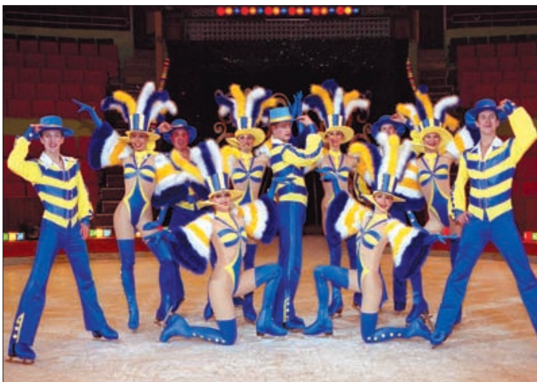
Der „Moscow Circus on Ice“ wurde als erster Eiszirkus der Welt im Jahre 1962 gegründet und fasziniert bis heute mit seinen außergewöhnlichen Darbietungen: Akrobaten, Jongleure, Hochseilkünstler, Eiskunstläufer und Clowns, die durch und über eine glitzernde Eisarena fliegen.

■ (pm) HARBURG. Der Moscow Circus hat den 1. Preis beim internationalen Zirkusfestival „Bukarest 2008“ in der Kategorie „innovativste und modernste Show“ gewonnen. Nach der sensationellen Deutschlandpremiere im Friedrichstadtpalast Berlin sowie den erfolgreichen Tourneen von 2005 bis 2008 absolvierte der „Moscow Circus on Ice“ im November 2008 auf Einladung von Fürst Albert II. zwei gefeierte Gastspiele in Monaco. Von der Presse und dem Publikum begeistert aufgenommen,