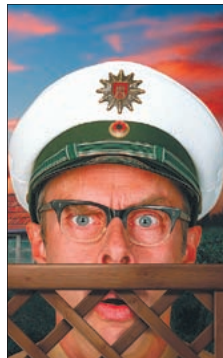
Wer hätte das gedacht? Der verbildliche Ordnungshüter – „für Sie Herr Holm“ – hat auch ein Privatleben, das allerdings den dienstlichen Bestimmungen unterliegt

führungen in vier verschiedenen Programmen: Herr Holm, der unvergleichliche Polizist aus Hamburg. Mürischer Blick, schlurfender Gang und Hornbrille sind ihm zum Markenzeichen geworden. Unerschütterlich in seinem Glauben, dass nur Ruhe und Ordnung diese Welt vor Chaos und Willkür schützen können und unermüdlich in seinem Bemühen, die Menschen unseres Landes zu mündigen und gesetzestreuern Bürgern zu machen. Aber auch für Herrn Holm gibt es ein Leben nach dem Dienst: Zuhause – am Feierabend, am Wochenende. Ein beschauliches Idyll am Rande der Stadt. Dort, wo die Welt eigentlich noch nie in Ordnung war. Dort erleben wir die andere Seite des strengen Ordnungshüters: einen Menschen mit all seinen Eigenarten und Fehlern und einem unbändigen Willen, das Beste daraus zu machen. Ein Stückchen Rasen, Freunde, Musik, Sonnenschein und Vogelgezwitscher. Das kleine Glück, für das es sich zu leben lohnt. Ein Glück, das immer wieder erneut