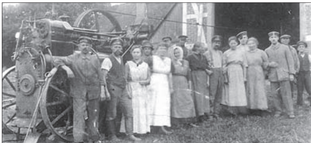
Die Firma Kräher aus Schätzingdorf arbeitete schon 1914 mit Lokomobilen.

tin Kleinfeldt berichtet über 50 Jahre Kreisstadt Winsen. Der Kreiskalender 2009 mit seinen 208 Seiten – erstmals als gebundenes Buch – kostet 11,80 Euro und ist in den Buchhandlungen, im Freilichtmuseum am Kiekeberg sowie in der Kunststätte Bossard erhältlich.