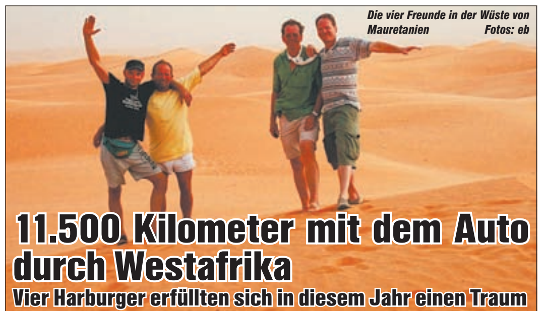
Die vier Freunde in der Wüste von Mauretanien

den Betriebsteilen, die sich an beiden Ufern der Süder-Elbe befinden, liegt in den Stadtteilen Wilhelmsburg und Harburg. Mit einer Rohölverarbeitungskapazität von 5,5 Mio Tonnen pro Jahr versorgt sie Kunden mit Flüssiggasen (Propan, Butan), Ottokraftstoffen (Normal, Super, V-Power, Rennkraftstoffe), Petroleum, Testbenzinen, Flugkraftstoff, Dieseldieselkraftstoff (V-Power Diesel, Diesel Shell Plus), Leichten Heizölen (HEL, Eco-Ultra), Grundölen, Wachs, Schweren Produkten (Bunkeröle, Heizöl schwer, HVR, Bitumina) und Schwefel. Der Vertrieb der Produkte erfolgt zu 40 % über Straßentankwagen, 15 % über Eisenbahnkesselwagen und 45 % über Binnenschiffe.