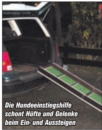
Die Hundeeinstiegshilfe schont Hüfte und Gelenke beim Ein- und Aussteigen

■ HOHNSTORF. Die Tischlerei Makro in Hohnsdorf hat ein interessantes Angebot für das vierbeinige Familienmitglied – die Hundeeinstiegshilfe, auch Hundetreppe genannt.