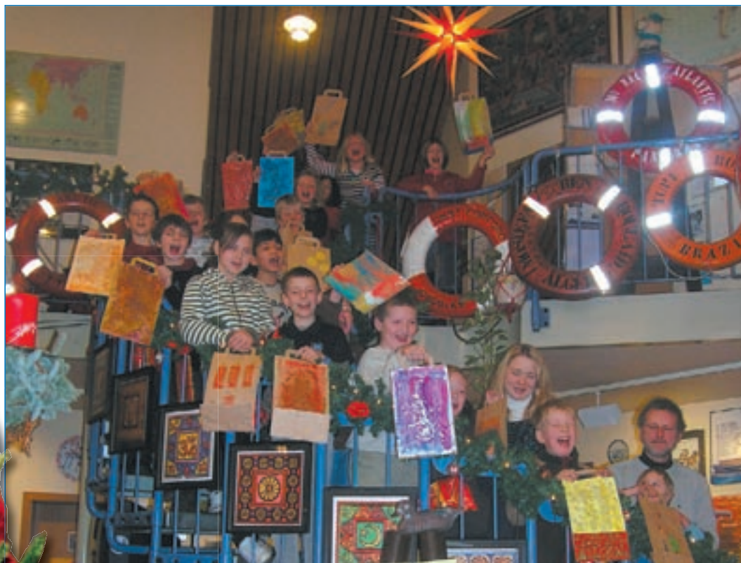
Bunte Tüten die später mit kleinen Weihnachtsgeschenken für die Seeleute gefüllt wurden, haben die Schüler aus Buchholz gebastelt.

wie sie als Kind mit elf Geschwistern und einer großen Familie die Weihnachtsnacht auf der philippinischen Insel Mindanao erlebt hat: „Wir Kinder haben schon geschlafen und wurden mitten in der Nacht mit dem Ruf ‚Es ist Weihnachten!‘ geweckt. Dann saß die ganze Familie unterm Weihnachts-