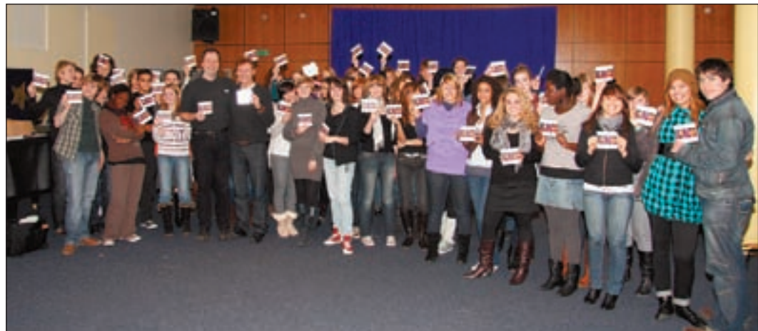
Für jeden Gospel Train-Sänger eine CD: Da durfte gejubelt werden!