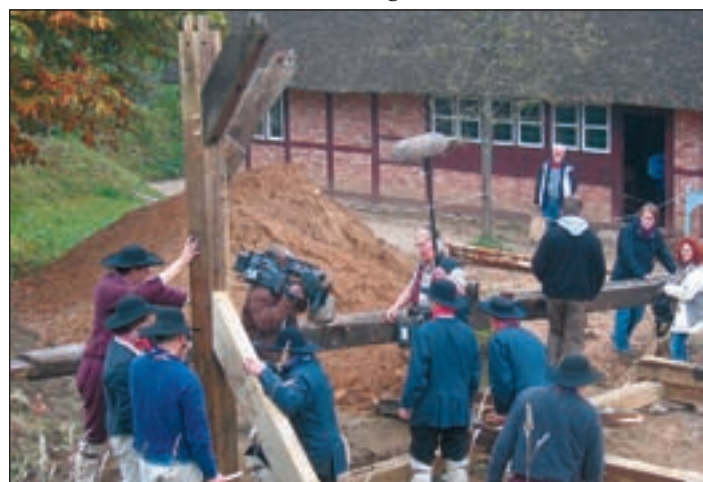
Die Handorfer Scheune (erbaut 1665), die mithilfe der Zeitreisenden neben dem Hof Meyn mit Mitteln die im Jahr 1808 zur Verfügung standen, errichtet wurde, wird nun dauerhaft im Heidedorf stehen. Bis zum Frühjahr werden Reetdach und Flechtwerk ergänzt, dann die Scheune feierlich eröffnet.

nen dabei über die Schultern. Zähne putzen mit der Holzzahnbürste, Geschirr spülen mit Buchenasche und Tanzen wie früher gehörten in die Zeit. Für die Männer stand der Hausbau im Mittelpunkt – ohne Motorsäge, Kran oder Gerüst bauten sie eine alte Scheune wieder auf. Durch diese Art experimenteller Volkskunde können sie jetzt nachweisen, wie Alltags- und Arbeitskleidung früher ausgesehen haben muss, denn Schriftstücke oder gar Zeichnungen sind selten erhalten. NDR 90,3 und das Freilichtmuseum am Kiekeberg haben die Aktion „Bauen wie 1808“ gemeinsam organisiert.