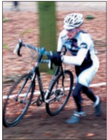
Fahrrad schultern gehört auch in diesem Jahr dazu.