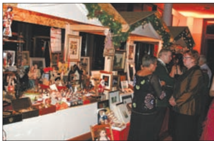
Der kleine Weihnachtsmarkt hatte in diesem Jahr seinen Platz im Neubau gefunden.

Leonhardt, SPD-Abgeordnete in der Bezirksversammlung. Während die meisten der vielen Hundert (vorbei sind die Zeiten als gerade einmal gut 300 Schützen kamen) Besucher im großen Festsaal Plätze gesichert hatten, zogen die anderen es vor, die Vorteile der so genannten „Flanierkarten“ zu nutzen und zwischen Festsaal und Disco, wo der DJ Tom CD um CD auflegte, zu pendeln. Unterwegs bestand die Möglichkeit, auf einem kleinen Weihnachtsmarkt im Neubau noch ein letztes Geschenk – Holzspielzeug, Schmuck, Malerei, Antiquitäten – zu erwerben. Für gute Tanzmusik sorgte die Show-Band „Valendras“.