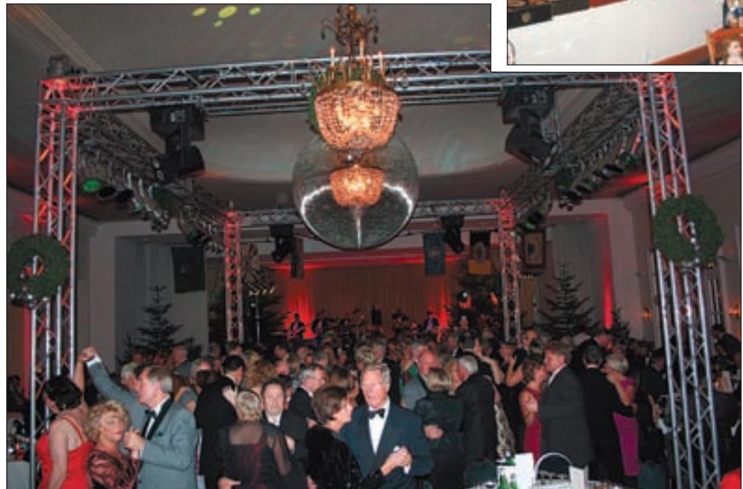
Für eine volle Tanzfläche sorgte die Showband „Valendras“.