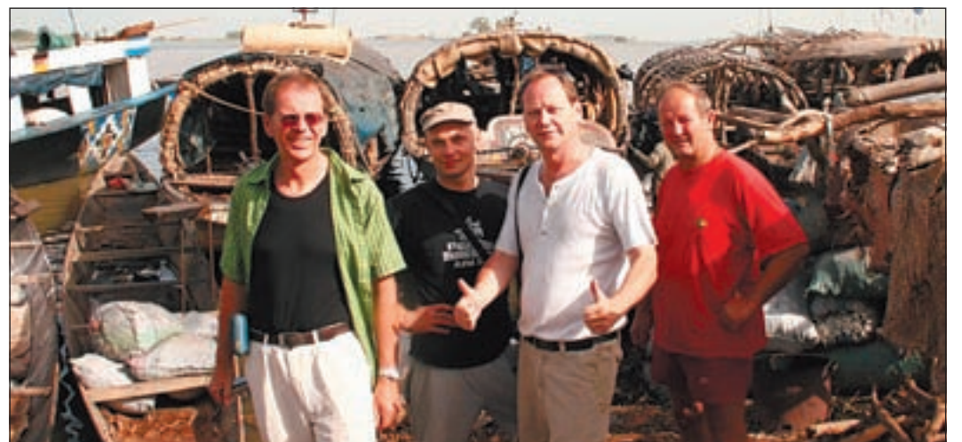
Nicht weniger pitoresk: Die Begegnung mit den Fischern in Mali

Die Elfenbeinküste ist ihrerseits das reichste Land Westafrikas und die Hauptstadt Abidjan ist mit ihren 3–6 Millionen Einwohnern das wirtschaftliche Zentrum der Elfenbeinküste. „Neben den Slums, die es in jeder afrikanischen Stadt gibt, findet man auch Wohnviertel, in denen man als Europäer ohne große Einschränkungen nach westlichen Maßstäben leben kann. Leider sind vie-