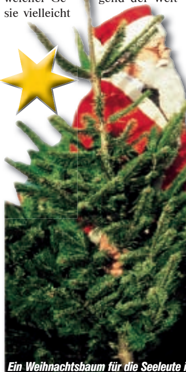
Ein Weihnachtsbaum für die Seeleute im Hamburger Hafen

■ Und schon wieder neigt sich ein Jahr dem Ende zu. Und die letzten 365 Tage hatten es in sich. Globale Finanzkrise, schwarz-grün in Hamburg und Barack Obama ist zum ersten schwarzen Präsidenten der USA gewählt worden.