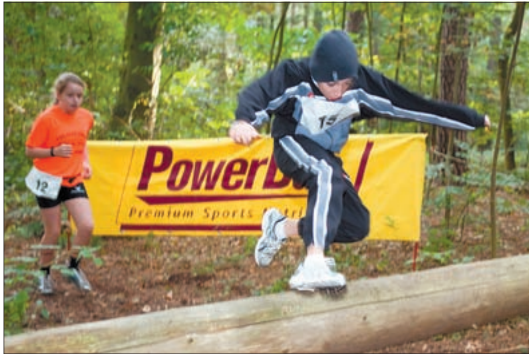
Alles keine Hindernisse: Die Schülerklassen waren beim Crossduathlon in der Haake gut besetzt.