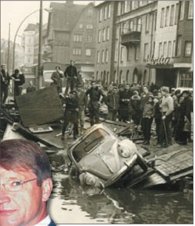
Vielen Wilhelmsburgern sind diese Bilder der Sturmflut 1962 noch immer in Erinnerung.

für den Katastrophenschutz getroffen wurden und welche Maßnahmen jeder für sich selbst treffen kann. In Verbindung mit der Ausstellung in der Gewerbeschule stellten zeitgleich am Finkenrieder Hauptdeich die Hilfs- und Rettungsdienste ihre Einsatzfähigkeit unter Beweis. Fortsetzung auf Seite 11