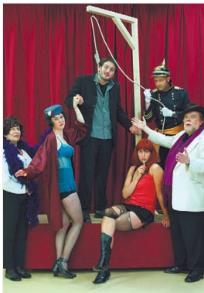
Dreigroschenoper: Das Stück spielt im Londoner Rotlichtmilieu der Zwanziger Jahre und enthält bekannte Balladen wie die „Seeräuberjenny“ oder „die Moritat von Mackie Messer“.