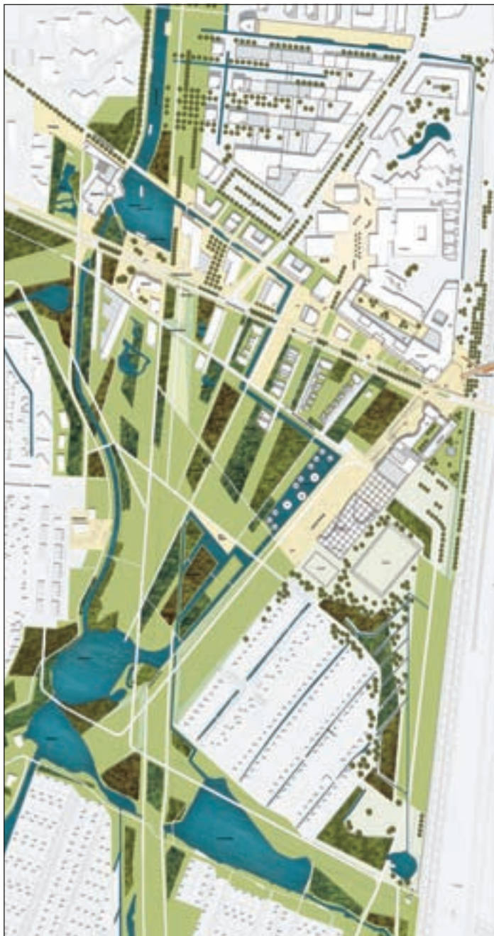
Der Masterplan NMW 2013 plus: Projekte, denen die IBA eine Antwort auf das Wohnen in der Zukunft geben möchte. (Bildrechte IBA GmbH/bloomimages).

Sechs international renommierte Planerteams, bestehend aus Architekten und Landschaftsgestaltern, haben sich an den Entwürfen für dieses Projekt beteiligt. Letztendlich konnten sich der niederlän-