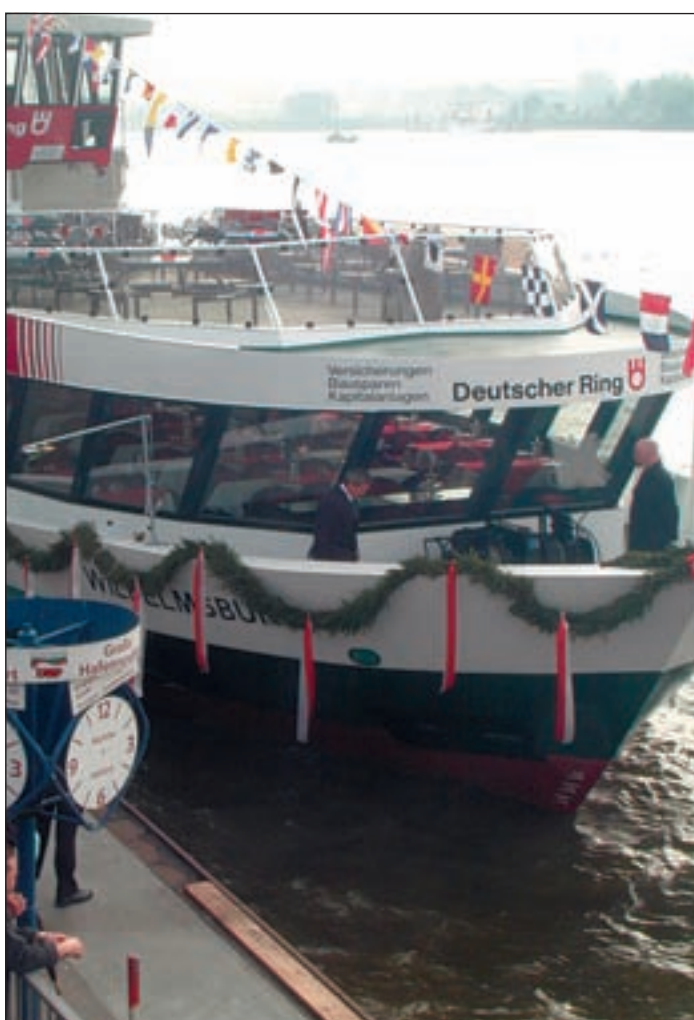
Die „MS Wilhelmsburg“ ist das 21. Schiff in der HADAG-Flotte.

Damit wurde wieder einmal dem vielzitierten „Sprung über die Elbe“ Rechnung getragen. Die HADAG setzt mit dieser Namensgebung auch die Tradition fort, ihre Schiffe nach Hamburger Stadtteilen zu benennen. Senatorin Anja Hajduk (GAL) lobte in ihrer Taufrede die Entscheidung der HADAG, dem Schiff den Namen des Stadtteils zu verleihen, der mit seiner richtungweisenden Entwicklung zu einem weiteren attraktiven Zentrum Hamburgs werden soll. Mit der bevorstehenden IBA und igs im Jahr 2013 soll auch die Verkehrsverbindung auf dem Wasserweg zwischen Hamburgs Innenstadt und der Elbinsel ausgebaut werden. Hierbei dürfte das Engagement der HADAG ebenfalls sehr gefragt sein. Die „MS Wilhelmsburg“ ist in der Flotte der HADAG das zehnte Fährschiff des modernen Typs 2000. Schon einmal in den 30er Jahren lief bei der Fährschiff-Ree-