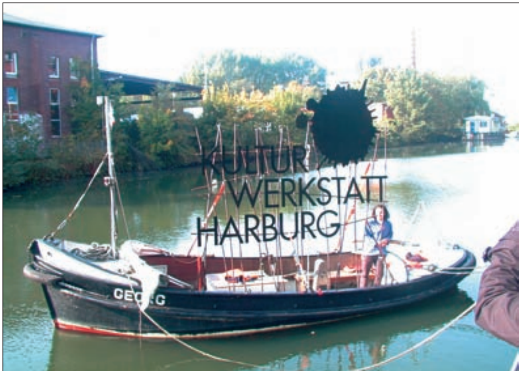
Mit einem Frachtkahn wurde die 3 mal 4 Meter große Skulptur an ihren Bestimmungsort in Harburg gebracht.

Zielort waren der Harburger Binnenhafen und der Sitz der Kulturwerkstatt Harburg. In dreiwöchiger, mühevoller Arbeit haben rund zehn Ein-Euro-Jobber in den Werkstätten der SBB Kompetenz gGmbH am Wilhelmsburger Veringkanal das Logo der Kulturwerkstatt zusammenschmiedet und geschweißt. Mit den Gesamtmaße von drei Meter