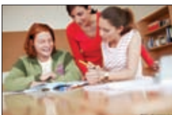
Mit Erfolg lernen: Der Studienkreis macht es möglich.

Der Unterricht findet hier in kleinen, fachbezogenen Lerngruppen mit drei bis fünf Schülern statt. Dadurch kann der Nachhilfelehrer gezielt auf die individuellen Bedürfnisse jedes einzelnen Schülers eingehen. Außerdem fühlen sich die Kinder und Jugendlichen mit ihren Lernschwierigkeiten nicht allein und motivieren