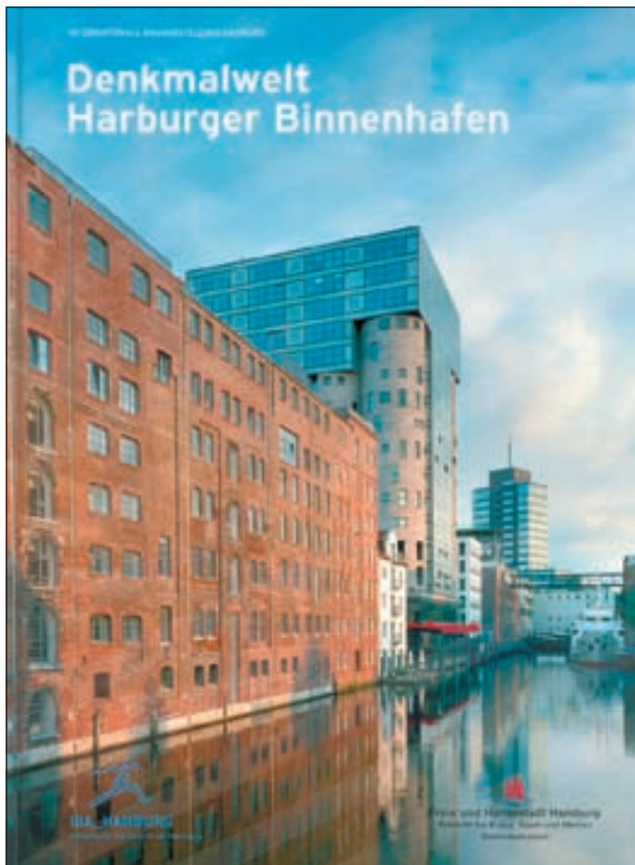
Denkmalwelt Harburger Binnenhafen: 97 äußerst informative Seiten über die Geschichte Harburgs mit vielen wissenschaftlichen Details die weit darüber hinaus gehen.