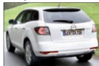
Auch an der Fahrzeugseite und am Heck des Mazda CX-7 legten die Designer Hand an.

die den Qualitätseindruck wirkungsvoll steigern.