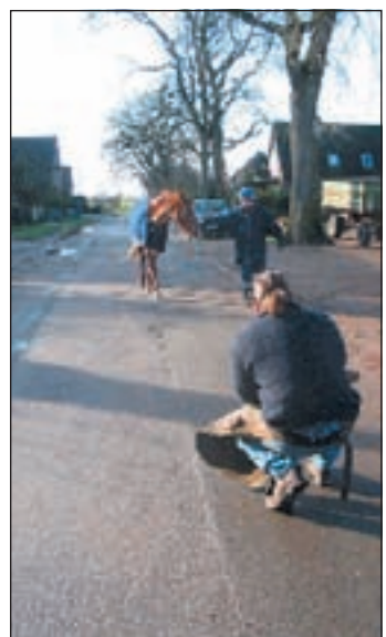
Der Hufschmied bei der Beurteilung des Pferdes

■ (ein) NEU WULMSTORF. Den optimalen Huf gibt es genauso wenig wie den optimalen menschlichen Fuß. Irgendwo ist immer etwas schief. Mensch und Pferd sind eben nicht hundertprozentig symmetrisch gebaut. So hat auch das Pferd eine stärkere und eine schwächere Seite, es ist „Links- oder Rechtshänder“.