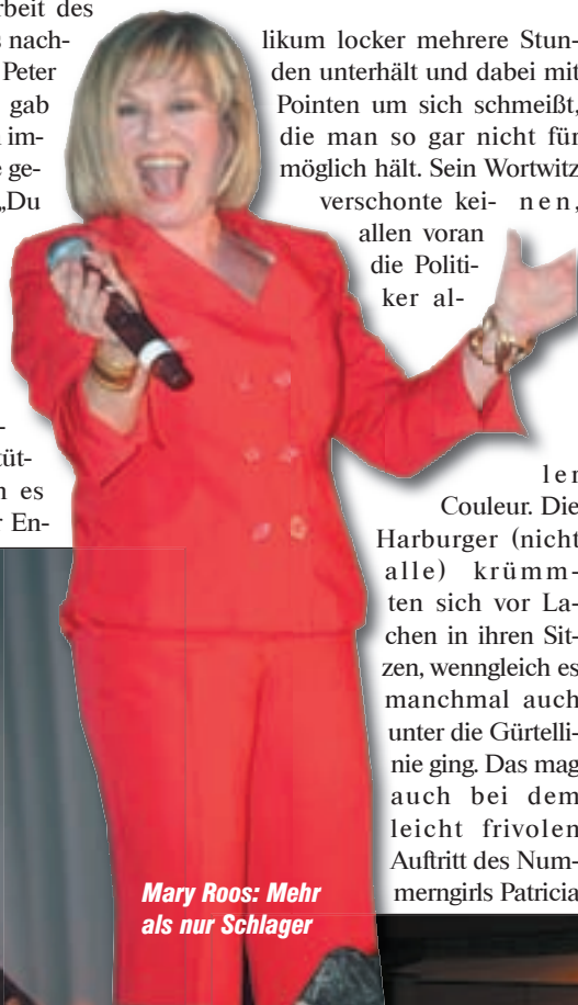
Mary Roos: Mehr als nur Schlager

ter unterhält und dabei mit Pointen um sich schmeißt, die man so gar nicht für möglich hält. Sein Wortwitz verschonte keinen, allen voran die Politiker al-