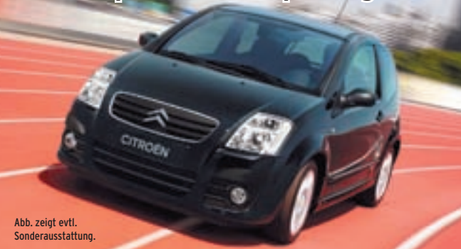
Abb. zeigt evtl. Sonderausstattung.