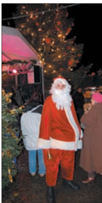
Ab dem 1. Dezember schaut täglich um 17.00 Uhr der Weihnachtsmann nach den kleinsten Besuchern. Und an den Nachmittagen der Adventssonntage können die Kinder unter Anleitung auf der Bühne kostenlos Gipsfiguren bemalen, Sterne und Weihnachtshäuschen basteln, Kerzen ziehen und vieles mehr.

■ (pm) HARBURG. Weihnachtsmarkt in Harburg: „Klein aber fein“ lautet hier schon seit Jahren die Devise. „Vor der malerischen Kulisse des erleuchteten Harburger Rathauses entsteht auch in diesem Jahr eine kleine Budenstadt mit windschiefen Fachwerkhäuschen, die liebevoll dekoriert, dem Rathausplatz ein festliches Gewand verleihen“, so Anne Rehberg, Sprecherin der WAGS Hamburg events GmbH, die den Weihnachtsmarkt veranstaltet. Im Mittelpunkt steht die mit roten Äpfeln, Schleifen und hundert von Lichtern erhellte 14 Meter hohe Colorado-Tanne. Auch in diesem Jahr kommt sie aus Harburg. Mehrere Jahrzehnte stand sie in einem Garten in Rönneburg. Nun wird ihr eine der größten Ehren zuteil. Sie wird das Wahrzeichen des Weihnachtsmarktes, der auf eine mehr als fünfzigjährige Geschichte zurückblickt.