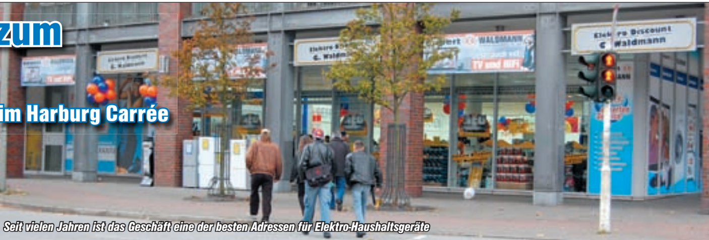
Seit vielen Jahren ist das Geschäft eine der besten Adressen für Elektro-Haushaltsgeräte

lungsraum. Doch irgendwann wurde dem Geschäftsmann auch dieser Raum zu eng. Der Zufall wollte es, dass sich vor sieben Jahren an der Wilstorfer Straße, im Harburg Car-