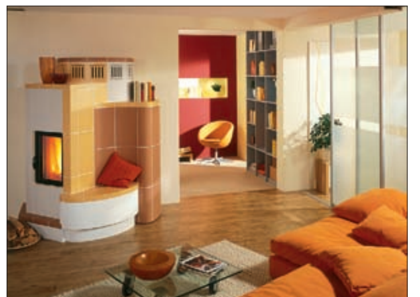
Gerade jetzt ein sicherer Tipp: Der Kachelofen – urgemütlich und rundum gesund!

■ (akz). Wenn die Tage kürzer und die Nächte wieder kälter werden, wenn ein ruppiger Wind den Regen gegen die Fensterscheiben peitscht, zieht er Groß und Klein wie eh und je in seinen Bann: Der Kachelofen! Gleich, ob man sich zum Relaxen in die Sofaecke kuschelt oder sich ein Ruheplätzchen auf der Ofenbank einrichtet: Die wohlige Strahlungswärme, die der urgesunde Wärmespender im ganzen Raum verströmt, schafft eine unverwechselbare Atmosphäre der Geborgenheit und Behaglichkeit!