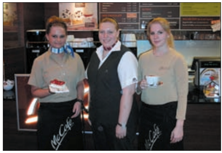
Das neue Kaffeeerlebnis für sich entdecken!

Freimaurer stellen sich vor ■ (pm) HARBURG. Das Logenhaus in der Eißendorfer Straße 27 öffnet am Samstag, 21. November von 11.00 bis 16.00 Uhr allen Interessierten seine Tür. Damit schließt es sich der Ausstellung: „Königliche Kunst, Freimaurerei in Hamburg seit 1737“ des Altonaer Museums im Jenisch-Haus an. Obwohl die Freimaurerei in Harburg bereits seit mehr als 150 Jahren besteht, ist sie heute vielen Bürgern nur noch wenig oder gar nicht bekannt. Wer etwas über die Inhalte und Ziele der Freimaurerei erfahren möchte, kann dies direkt von den Mitgliedern dieser Bruderschaft erfahren. Damit soll allen Interessierten die Gelegenheit geboten werden, sich selbst ein Bild von der noch immer als geheimnisvoll betrachteten Freimaurerei zu machen. Die Mitglieder der Logen „Ernst August zum goldenen Anker“ und „Zur Erkenntnis“ sowie auch der im Hause arbeitende Orden „Eastern Star“ für Frauen und Töchter von Freimaurern stellen sich vor.