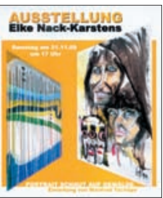
Ausstellung von Elke Nack-Karstens unter dem Titel „Portrait schaut auf Gemälde“ statt.

■ (mk) HAUSBRUCH. Am 21. und 22. November werden im Kulturhaus Süderelbe im Ehestorfer Heuweg 20 Werke der Künstlerin Elke Nack-Karstens ausgestellt. Die unter dem Titel „Portrait schaut auf Gemälde“ stattfindende Ausstellung beginnt mit einer Einleitung von Manfred Tschöpe. Am Sonnabend wird die Ausstellung um 17.00 Uhr eröffnet. Am 22. November können Kunstinteressierte von 14.00 bis 17.00 Uhr die Portraits begutachten.