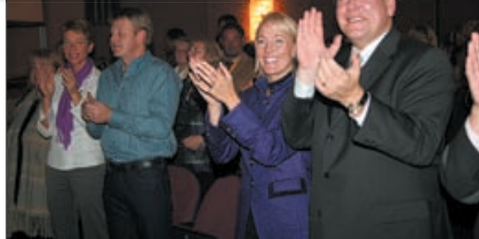
Applaus von Simone und Christoph Ahlhaus gab es für die 24. Starpyramide