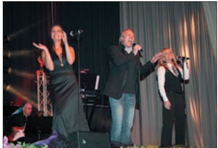
Die Gruppe „Wind“ in Begleitung der „Studiker“ hatte das Publikum schnell auf seiner Seite