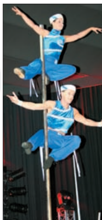
Nos Ipsi: Kraftvolle Körperbeherrschung bei der Akrobatik an der Stange

ter unterhält und dabei mit Pointen um sich schmeißt, die man so gar nicht für möglich hält. Sein Wortwitz verschonte keinen, allen voran die Politiker al-