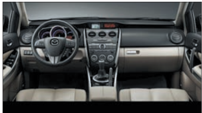
Ein schicker Innenraum ziert den Mazda CX-7

kümmern, es wird im Rahmen der Inspektionen nachgefüllt. Der Euro-5-Diesel ist eine vernünftige Alternative zum Ottomotor im CX-7. Die Maschine ist recht leise und hängt ab etwa 2.000 Touren spritzig am Gas. Sie beschleunigt den großen Mazda gefühlt schneller als die 11,5 Sekunden, die der Wagen laut Werksdatenblatt bis