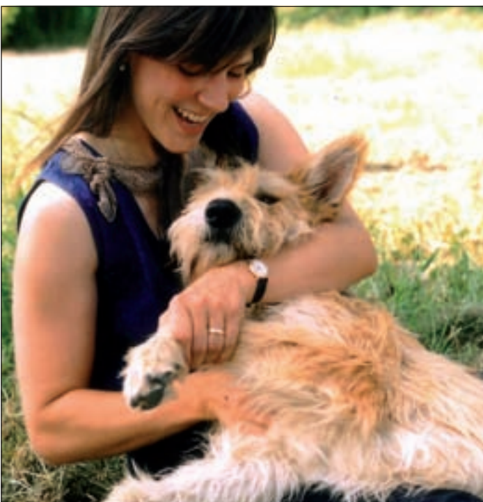
(mG) Zwischen Frauchen und Hund entwickelt sich in der Regel ein inniges Verhältnis, das dem Halter besonders in belastenden Lebenslagen Rückhalt bietet.

sind sie sich alle in dem Punkt, dass das geliebte Haustier, gerade an Tagen, an denen nichts klappen will und alles schiefliegt, eine Hilfe in Sachen emotionaler Stressbewältigung darstellt (60 Prozent).