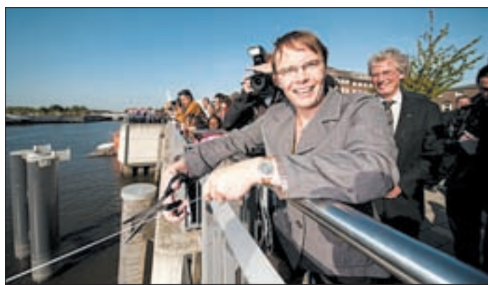
Senatorin Anja Hajduk bei der Taufe des IBA-Ponton. Im Hintergrund freut sich Uli Hellweg.