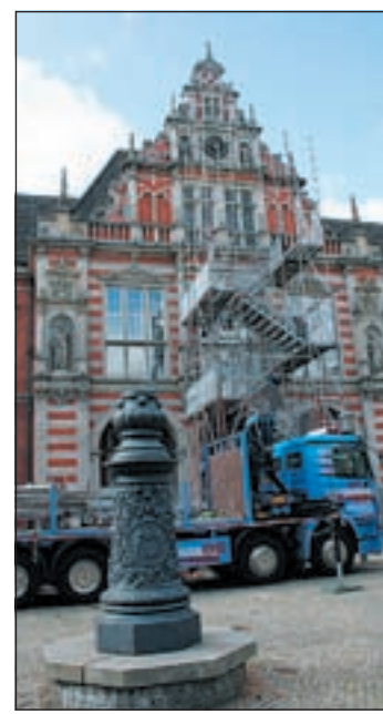
Auge in Auge mit der Rathausuhr: Ein Gerüst wird diese Tage vor der Rathausfassade hochgezogen. Auf seiner höchsten Ebene entsteht unmittelbar vor der Uhr ein Raum der diesen nicht alltäglichen Blickkontakt ermöglicht.

Für den Harburger Innenstadtbereich wurde im Rahmen des 2004 eingeführten Formats „10 Grad Kunst“ Kunst im öffentlichen Raum Projekt beantragt, dessen Realisierung nun zu großen Teilen durch die Behörde für Kultur, Sport und Medien gefördert wird. Entscheidend für die Konzeption des temporären Ausstellungspro-