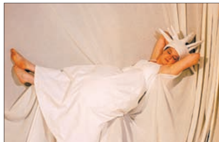
Die Königin der Farben beherrscht alle Farben – von gelb über blau bis rot.

Der Eintritt kostet 4,50 Euro für Kinder und sechs Euro für Erwachsene. Kindergärten und Schulklassen melden sich im Kinderkulturbereich bei Maren Tobel oder Brigitte Schulz an unter (040) 42 10 39 20.