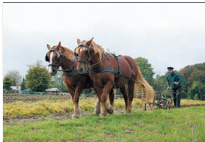
Den sprichwörtlichen Ackergaul gibt es nur noch selten

Doch nicht nur die Pferde stehen an diesem herbstlichen Sonntag im Mittelpunkt des Geschehens: Passend zur Jahreszeit feiert der Kiekeberg Erntedank. Los geht es um 10.00 Uhr mit einem Erntedankgottesdienst im festlich geschmückten Hof Meyn. Um 11.00 Uhr beginnt dann der Erntemarkt, auf dem etwa 20 Händler regionale Produkte wie Honig, Käse, Wurst, Obst und Gemüse, Sanddorn-Produkte und herbstliche Floristik zum Verkauf anbieten. Natürlich dürfen Kürbisse auf einem Erntemarkt nicht fehlen. Für Kinder ist der museumseigene Kettenflieger in Betrieb und die Landfrauen versorgen hungrige Besucher mit frischem Kaffee und selbst gemachtem Kuchen.