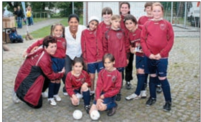
Steffi Jones, Weltmeisterin und OK Präsidentin WM 2011 am Tag des Mädchenfußballs mit Spielerinnen des 1. FFC Wilhelmsburg.

(1. FFC) so und bietet für fußballbegeisterte Mädchen im Alter von fünf bis acht Jahren in den Herbstferien vom 19. bis 23. Oktober ein kostenloses Fußballcamp an. Auf dem Platz Rotenhäuser Damm, Rotenhäuser Damm 94, können