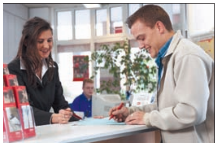
(mG) Immer häufiger wenden sich Hochschulabsolventen an Personaldienstleister, um die Zeitarbeit als Sprungbrett für die eigene Karriere zu nutzen. Wie die Branche berichtet, sind die Chancen auf eine Übernahme seitens des „Entleihers“, auch als Klebeeffekt bezeichnet, häufig aussichtsreich.

den. Die Zeitarbeit ist also als Bindeglied zwischen befristeten und unbefristeten Arbeitsverhältnissen zu verstehen, als Karriere-Sprungbrett mit der Möglichkeit, sich in der Zwischenzeit weiterzualifizieren, und der Chance, in vielseitigen Einsätzen praxisorientiert Erfahrung zu sammeln.