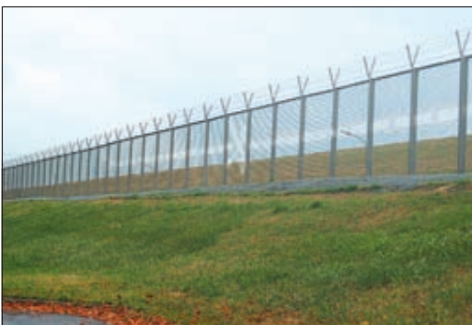
Eine weiße Naht, unterbrochen von riesigen Scheren, symbolisiert die Abgeschnittenheit der Elbinseln und ruft zugleich zum Zerschneiden der Grenze auf.

■ (au) WILHELMSBURG. Trist und grau läuft der Zollzaun an der Harburger Chaussee entlang. Vielen ist der Zaun schon seit Jahren ein Dom im Auge und sie würden ihn am liebsten sofort abreißen lassen. Vor einigen Wochen dann eine Überraschung. Auf zwei Kilometer Länge zieht sich eine weiß gestrichelte Linie am Zaun und auf dem Boden entlang, immer wieder unterbrochen von riesigen Scheren. Ein dummer Jungentreich? Nein, ganz und gar nicht. Bei seinem ersten Besuch auf der Elbinsel fand der Berliner Künstler Thomas Wiczak, dass der nach Norden grenzende hohe Freihafenzaun die Elbinsel Wilhelmsburg vom restlichen Hamburg abschirmt und da-