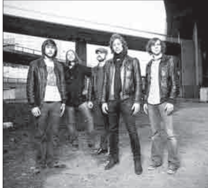
The Soulshake Express entwickelte ihren eigenen Stil, den „bouncy“ Rock.

sich gelassen, ist die Band nun auf der Mission: Shake your souls! Das Debüt-Album „Heavy Music“ wurde sowohl in Europa, als auch in Amerika schlichtweg umjubelt. Klassik Rockmagazine wählten „Little Lover“ unter die 100 besten Songs des Jahre 2007. Auf ihrem Weg wurden unzählige Seelen – im positiven Sinne vom einmaligen Groove der The Soulshake Express erschüttert. Nachdem die Jungs aus Schweden im Frühjahr/Sommer 2008 große Teile Europas und Amerikas betourt haben, sind sie in diesem Herbst weiteres Mal in Deutschland unterwegs, um bereits neue Songs ihres im Frühjahr 2010 erscheinenden neuen Albums zu präsentieren.