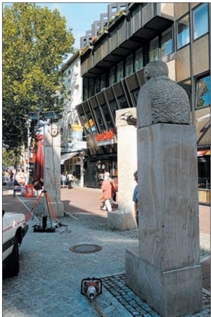
Auch die drei Stelen im Bereich des Lüneburger Tors werden mit einer Schutzschicht versehen, damit sich zukünftige Graffiti schneller entfernen lassen.

Noch bis zum 9. Oktober können an der Lüneburger Straße ansässige Grundeigentümer einen Antrag an das BID stellen und von der Graffiti-Entfernung profitieren. Wer einen solchen Antrag stellen möchte, sollte sich mit dem BID Lüneburger Straße unter der Telefonnummer 357 52 70 in Verbindung setzen.