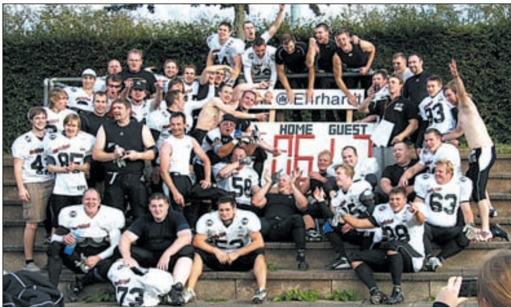
Harburg total happy: Die Ravens sind Meister der Verbandsliga und Oberliga-Aufsteiger.