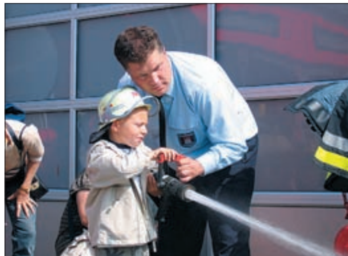
Die Freiwillige Feuerwehr Kirchdorf zeigt nicht nur, wie man einen Brand löscht, sondern engagiert sich auch im Stadtteil.

haben. Und natürlich sollten Kinder und Eltern dem Wetter entsprechend angezogen sein. Auch sind Ersatzbatterien oder Ersatzkerzen für die Lampen nicht zu vergessen.