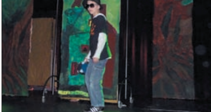
Wo ist die Stimme der berühmten Sängerin Sabrina geblieben. Die Kiddies begeben sich auf Spurensuche.

■ (au) WILHELMSBURG. Spannend wird es in den Herbstferien für Kinder zwischen acht und 12 Jahren. Von Montag, 12. Oktober bis Freitag, 17. Oktober, 10.00 bis 13.00 Uhr (Montag bis Donnerstag) und 12.00 bis 16.00 Uhr am Freitag, begeben sich die Kiddies auf Verbrecherjagd. Das Bürgerhaus Wilhelmsburg, Mengestraße 20, lädt ein zu einem Theaterkrimi der besonderen Art. In der Wilhelmsburger Villa der berühmten Sängerin Sabrina wurde eingebrochen. Gestohlen wurde nichts, nur von der Sängerin fehlt jede Spur. Als sie einige Tage später wieder auftaucht, hat sie keine Stimme mehr. Was steckt dahinter? Anna, Tim und Leon, große Fans von Sabrina, sind verzweifelt. Wild