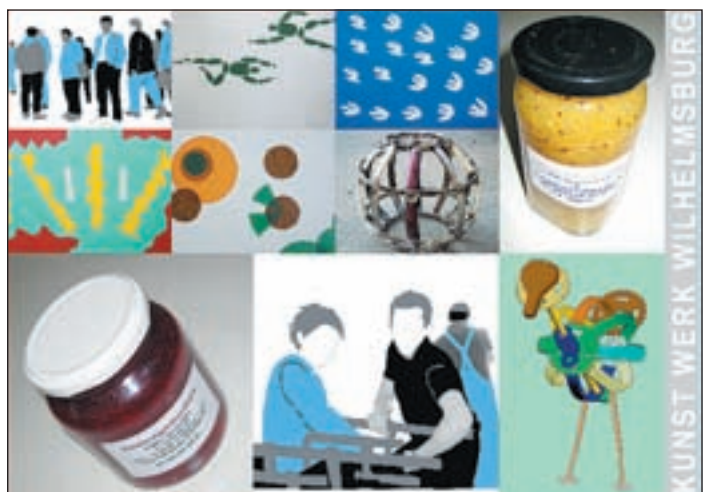
Die verschiedensten Kunstwerke stellt das Projekt „Kunst Werk Wilhelmsburg“ vor.

Das Projekt präsentiert nun erstmalig seine Arbeiten. Die Eröffnung der Ausstellung ist am Freitag, 9. Oktober um 19.00 Uhr. Die Öffnungszeiten sind montags bis donnerstags von 8.00 bis 19.00 Uhr, samstags und sonntags von 9.00 bis 19.00 Uhr, freitags ist geschlossen. Nach Wilhelmsburg wandert die Ausstellung auch in andere Stadtteile Hamburgs: Kulturwerkstatt Harburg, Offenes Atelier Mümmelmannsberg, Bücherhalle Bramfeld und andere.