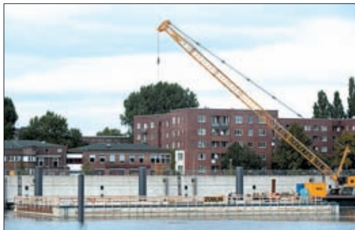
Der Ponton hat seinen Bestimmungsort gefunden: der Müggenburger Zollhafen direkt gegenüber der BallinStadt.