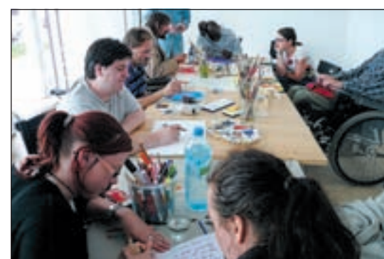
Im Kunstudio arbeiten behinderte und nicht behinderte Menschen gemeinsam

Das Kunstudio ist im Münzviertel gelegen, einem kleinem Stadtviertel in der Nähe des Hauptbahnhofes. Es wird durch den Verein „Kunst und Kultur für alle“, in Zusammenarbeit mit der Alsterdorf Assistenz Ost und der Unterstützung durch die Wichernbaugesellschaft getragen. Es ist ein Atelier für Menschen, die künstlerisch arbeiten möchten, die es aber