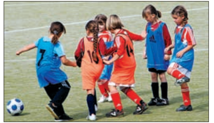
Die Mädchen des 1. FFC Wilhelmsburg sind begeistert bei der Sache.

sich die Mädchen von 10.00 bis 13.00 Uhr sportlich mit und ohne Ball betätigen. Die Mädchen werden in altersgerechten Gruppen und unter fachlicher Leitung des Lizenztrainers und DFB-Teamleiters des Vereins angeleitet. Alle Trainer und Betreuer sind auf die Arbeit mit Mädchen und jungen Frauen aus allen Kulturkreisen spezialisiert.