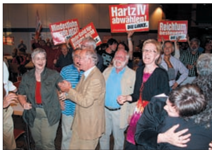
Nach dem Ergebnis der ersten Prognose liegen sich die Mitglieder der LIN-KEN vor lauter Freude in den Armen.