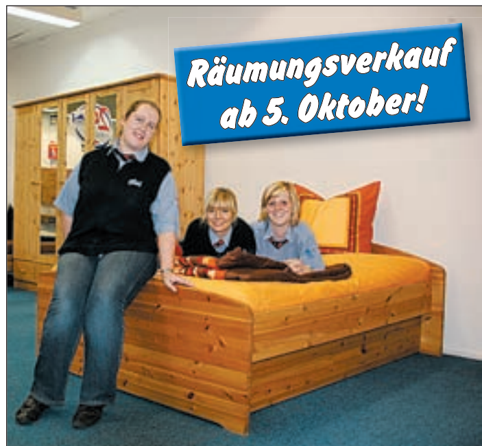
Räumungsverkauf wegen Umbau im Dänischen Bettenlager! Nutzen Sie die Gelegenheit und sichern sich 50 Prozent Rabatt auf alle Möbel-Ausstellungsstücke.

Dänisches Bettenlager Zur Seehafenbrücke 1 21073 Hamburg Telefon (040) 76 41 44-0