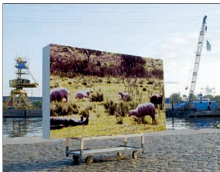
Ein Bild mit Schafen, zu sehen im Binnenhafen: Es soll deutlich machen, dass dort, wo heute eingekauft wird, früher einmal eine Heidelandschaft war.

Statt bleibende Wahrzeichen zu schaffen oder vorhandene Schönheiten zu betonen, lädt die Ausstellung die Besucher zu Wanderungen durch die architektonische, soziale, kulturelle, historische und wirtschaftliche Stadtlandschaft ein. Die künstlerischen Eingriffe wollen den Blick für die Besonderheiten vor Ort schärfen. Eine Wanderung der besonderen Art nimmt dabei die Arbeit von Olaf Nicolai vorweg, der in Harburg sein bereits in vielen internationalen Städten realisiertes Projekt „How to Produce a Site-specific Work Anywhere“