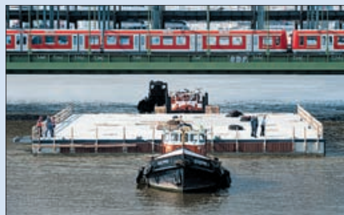
Einen langen Weg hat der IBA-Ponton hinter sich. Vor rund vier Wochen wurde er in Cuxhaven aufs Wasser gesetzt.

Senatorin Hajduk tauft IBA-Ponton auf der Veddel