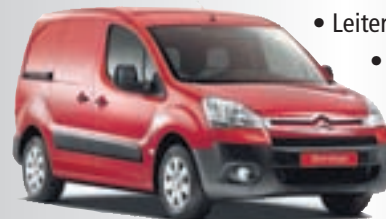
Abb. zeigt evtl. Sonderausstattung.