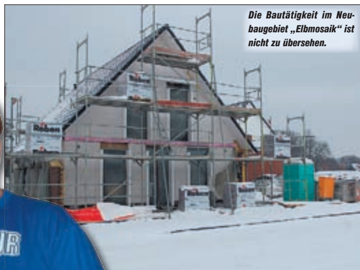
Die Bautätigkeit im Neubaugebiet „Elbmosaik“ ist nicht zu übersehen.