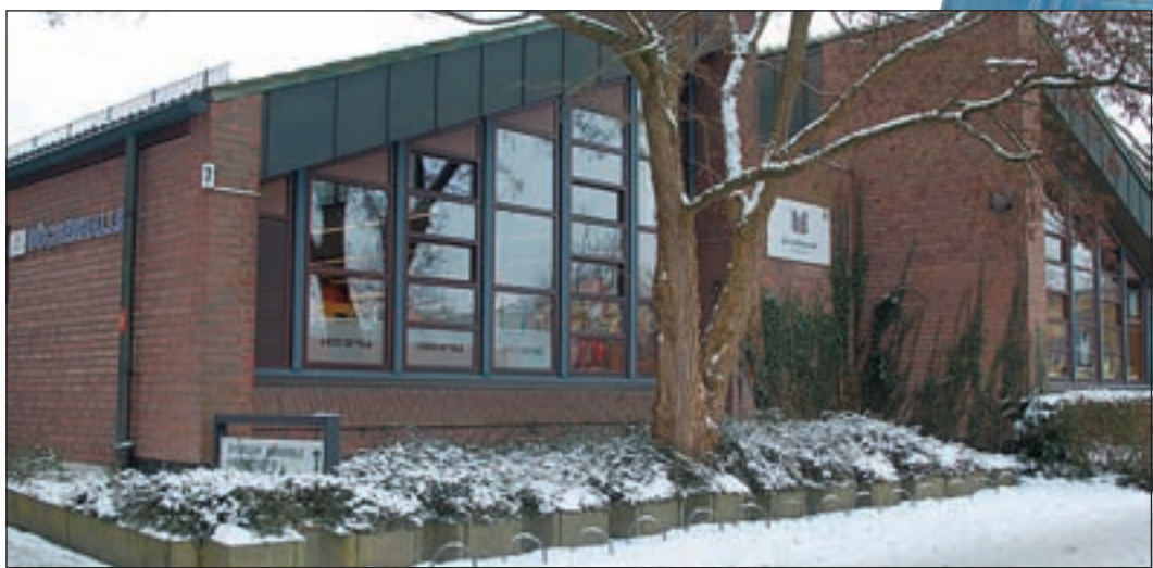
Seit dem 10. Januar 1980 ist die Bücherhalle Neugraben am Neugrabener Markt für wissbegierige Bürger eine zentrale Anlaufstelle.

Stelle hauptamtlich engagiert“, er- innert sich Pfeiffer.