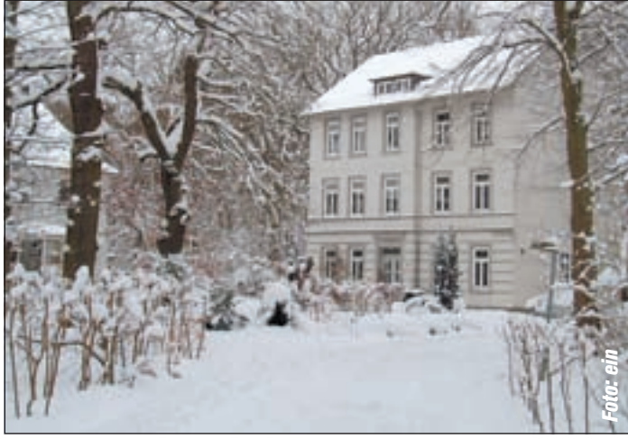
Das Kulturhaus Süderelbe hat für alle Altersklassen Kurse im Programm.

gang Tamoswki anwesend. Durch die Verlegung der öffentlichen Bü- cherhalle ins Neugrabener Zent- rum sollte dieses belebt werden“, er- klärt Pfeiffer. Dass der damalige Schritt wegwei- send war, belegt der 55-Jährige an- hand von Zahlen. Während man im ersten Jahr (1980-1981) 170.000 Ausleihen verbuchte, stieg diese Zahl für den Zeitraum von 2008 bis 2009 auf 235.000 Ausleihen an. Dabei seien die per Internet vorgenommenen Ausleihen noch gar nicht berücksichtigt, sagt Pfeif-