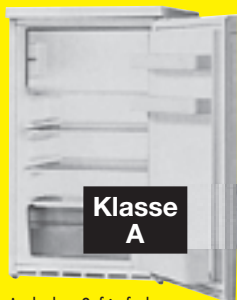
Auch ohne Gefrierfach