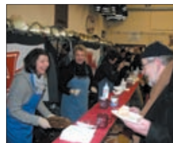
Viel Zuspruch und nicht minder gute Laune gab's auch am Kuchenbuffet

680,45 Euro aus der eigentlichen Schredderaktion und dem, was im Tagesverlauf in den Spendenschiffchen gelandet ist, hat die FF eingenommen. Insgesamt konnten nach dem Kassensturz 1.973,45 Euro an die DGzRS überwiesen werden, davon entfielen allein 1.293 Euro auf die Benefiz-Tombola. Insgesamt 46 Preise hatten die zahlreichen Sponsoren zur Verfügung gestellt: Es gab Eintrittskarten für die Freerzer oder für das Maritime Muse-