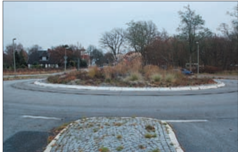
Soll der Süderelbegenkreis (Aufnahme aus dem Herbst) künstlerisch aufgewertet werden?

Neubaugebiet Elb-Mosaik zu sein, nicht gerecht wird.“ Beeken schwebt eine Gestaltung des Süderelbegen-Kreises wie auf der spanischen Ferieninsel Lanzarote vor. „Dort hat der spanische Künstler César Manrique eine Vielzahl von Kreisen mit Kunstwerken bereichert. Seine markanten Werke besitzen einen künstlerischen Anspruch, lenken die Verkehrsteilnehmer aber nicht ab. Es ist ein toller Anblick. Zudem sind die Arbeiten leicht zu warten. Außerdem fertigen einheimische Künstler die Skulpturen oder überdimensionalen Windspiele an. Somit ist eine Unterstützung der lokalen Künstler gewährleistet“, erklärt Beeken. Dessen Antrag erhielt Anfang 2009 von allen Parteien Zustimmung, genauso wie ein gemeinsamer Antrag der CDU/GAL-Koalition zum gleichen Thema. Allerdings mit einer Einschränkung – CDU und GAL verengten die Thematik von vorn-