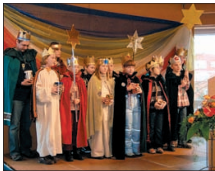
Die Sternsänger brachten Besinnlichkeit in die Veranstaltung.

Die ersten Bewohner würden Anfang des neuen Jahres einziehen und LeA wird daneben den neuen Kiosk am Bahnhof übernehmen. Es wäre dem Rat wichtig gewesen, dieses Projekt an den Verein zur Integration von Menschen mit Behinderungen hier in Neu Wulmstorf zu übergeben, um so zu signalisieren, wie fest LeA hier im Ort verankert sei, führte Rosenzweig aus. Damit war das Thema neuer Bahnhof schon angesprochen. In 2009 habe das ambitionierte Projekt nun langsam Gestalt angenommen und wenn die letzten kleineren und größeren Hürden genommen wären, würde Anfang 2010 der Bahnhof vollständig fertig gestellt sein und den Ansprüchen auch der Rollstuhlfahrer und der Nutzer der mehr als erfolgreichen S-Bahn gerecht werden, versprach der Bürgermeister. Dieser lobte ebenfalls das ehren-