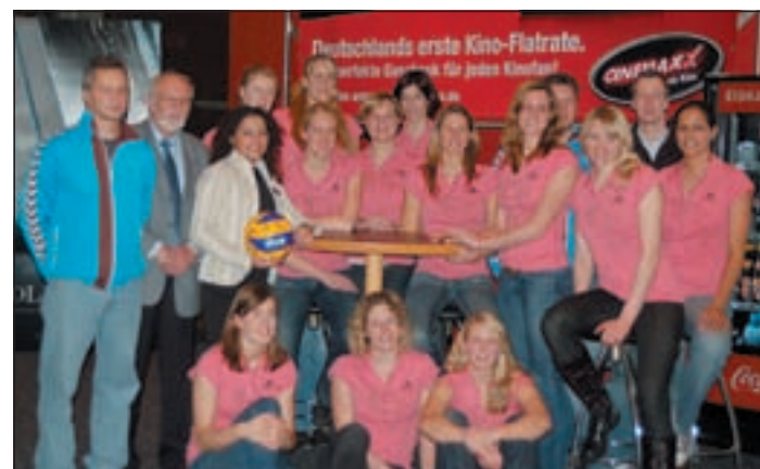
Das Team von VT Aurubis Hamburg hat wieder in die Erfolgsspur zurückgefunden.

Jahresempfang von Aurubis im Harburger Cinemaxx