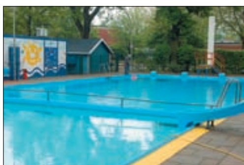
Das Freibad Neugraben wird zukünftig mit umfangreichen Mitteln der Behörde für Stadtentwicklung und Umwelt (BSU) unterstützt.

Pflicht, das Freibad Neugraben finanziell zu unterstützen. Diese auch für die Harburger Verwaltung über-