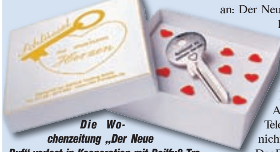
Die Wochenzeitung „Der Neue Ruf“ verlost in Kooperation mit Beilfuß Trading Store 3 Mal das romantische Hochzeitsgeschenk „Schlüssel zu meinem Herzen“.

Herzchen eingraviert. Als besonderes Highlight haben Sie zusätzlich die Möglichkeit, den „Schlüssel zu meinem Herzen“ auf der Rückseite mit einer eigenen, individuellen Wunschgravur zu versehen. Gibt es einen schöneren Weg seinem Partner den eigenen Wohnungsschlüssel zu überreichen? Wenn Sie dieses fantasievolle Präsent gewinnen möchten, schreiben Sie einfach eine Postkarte bis zum 20. Januar an: Der Neue Ruf, Cuxhavener Straße 265 b, 21149 Hamburg. Stichwort: Hochzeit. Adresse und Telefonnummer nicht vergessen. Der Rechtsweg ist ausgeschlossen. Viel Glück!