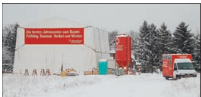
Trotz Eis und Schnee gehen die Handwerker ihren Arbeiten an zwei Neubauten der Viebrockhaus AG im Neubaugebiet „Elbmosaik“ unter beheizten Zelten nach.

■ (mk) NEUGRABEN. Im Neugrabener Neubaugebiet „Elbmosaik“ können aufmerksame Zeitgenossen eine ungewöhnliche Beobachtung machen. Während auf den anderen Baustellen die Arbeiten aufgrund Eis und Schnee momentan ruhen, gehen an zwei Neubauten der Viebrockhaus AG die Handwerker ihrem Job weiterhin nach. Des Rätsels Lösung: Unter riesigen Zelten können die Arbeiten trotz widriger Wetterverhältnisse ungehindert fortgeführt werden. Damit beschreitet die Viebrockhaus AG auch auf diesem Gebiet neue Wege – und das bereits seit längerer Zeit. Und so funktioniert es: Die Häuser werden unter haushohen Zelten gebaut, die zudem noch beheizt werden.