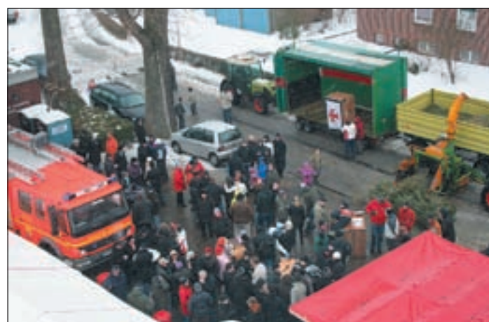
Zum 8. Schredderfest kamen diesmal trotz eisigem Wind bei Minustemperaturen 800 Besucher