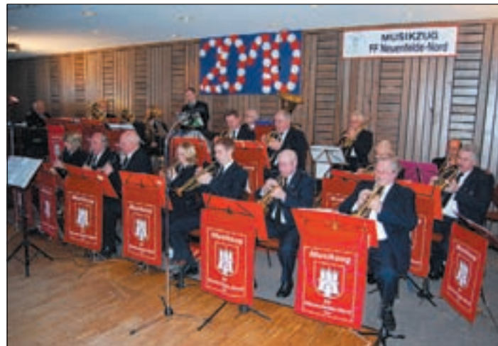
Der Musikzug der Freiwilligen Feuerwehr Neuenfelde Nord begeisterte die Zuhörer beim Konzert im Schützenheim.

ren. Der Eintritt ist frei. Anmeldungen müssen unbedingt unter Telefon (040) 745 94 61 vorgenommen werden.