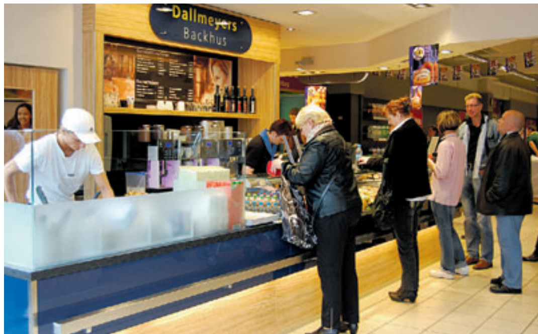
Dallmeyers Backhus in der unteren Etage des Marktkauf-Center stellt großzügig die Zutaten für das Back-Duell der Politiker