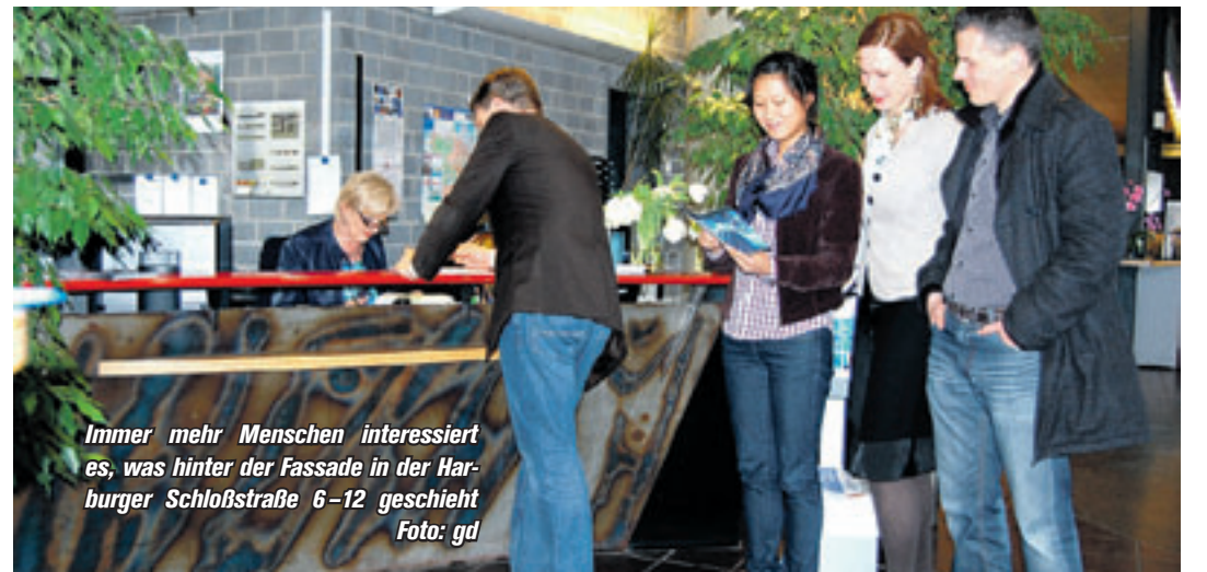
Immer mehr Menschen interessiert es, was hinter der Fassade in der Harburger Schloßstraße 6-12 geschieht

■ (gd) Harburg. Häufig läuft man an Häusern und Fassaden vorbei, ohne zu wissen, was sich hinter diesen Mauern verbirgt. Oftmals prangen große Schilder vor der Haustür, auf denen Hinweise und die Namen von Firmen zu lesen sind, die einem fremd und unerklärlich erscheinen. So ähnlich mag es auch manchem ergehen, der durch die Harburger Schloßstraße geht und an der Wand eines Hauses die Worte „TuTech Innovation“ zu lesen bekommt. Am 23. Juni ab 14.00 Uhr öffnet TuTech seine Türen, um sich und seine Partnerfirmen einmal vorzustellen. Nahezu 150 durchgeführte Veranstaltungen mit rund 5.400 Teilnehmern im Jahr 2010 – das ist die stolze TuTech-Bilanz als Veranstaltungszentrum. TuTech organisiert gemeinsam mit Partnern aus Wirtschaft und Wissenschaft Stammtische, Kolloquien, Seminare, Konferenzen und Hausmes-