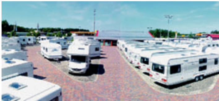
Rund 200 neue wie auch gebrauchte Wohnwagen und Reisemobile bietet der hauseigene Caravan-Handel „Südsee-Camp-Caravans“ regelmäßig an