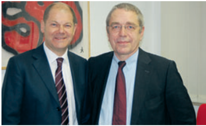
Die SPD-Spitzenkandidaten Olaf Scholz (li.) und der Neugrabener Bürger-schaftsabgeordnete Thomas Völsch sehen der Wahl mit Optimismus entgegen.

SPD-Spitzenkandidat Olaf Scholz in Neugraben