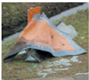
Trotz der unbefriedigenden Situation ist die illegale Entsorgung von Müll wie hier in einer Straße im „Elbmosaik“ verboten.