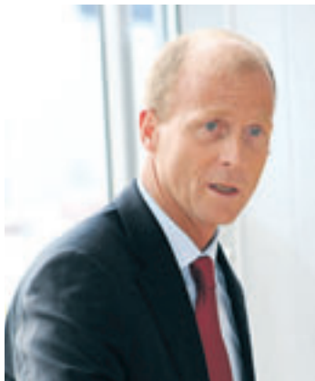
Tom Enders: Auch 2011 soll ein Erfolgsjahr werden

■ (pm) Finkenwerder. Airbus hat seine Auslieferungen bereits zum neunten Mal in Folge gesteigert und einen neuen Unternehmensrekord aufgestellt. 2010 wurden 510 Flugzeuge (2009: 498) an 94 Kunden (darunter 19 Neukunden) ausgeliefert. Diese Zahl teilt sich auf in 401 Flugzeuge der A320-Familie, 91 A330/A340 und 18 A380. Im Geschäftsbereich Militärflugzeuge lieferte Airbus 20 leichte und mittelschwere Transportflugzeuge aus und übertraf damit die Zahl der Auslieferungen von 2009 um vier Flugzeuge. Airbus hat 2010 insgesamt 644 Neuaufträge verzeichnet. Der Gesamtwert der Aufträge belief sich brutto auf über 84 Milliarden US-Dollar zu Listenpreisen. Dies entspricht