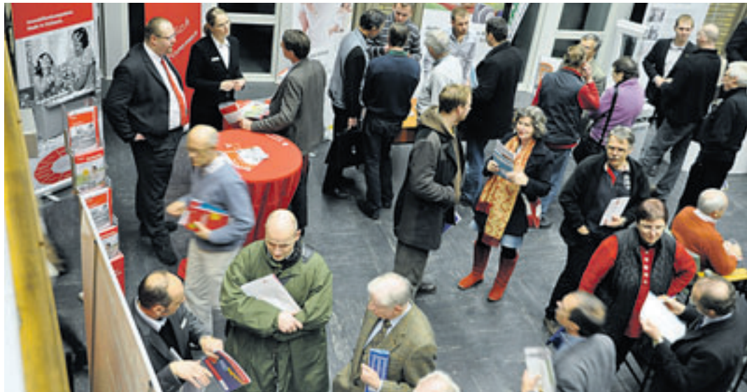
Immer wieder finden die Themen Energieeinsparung und Modernisierung bei Haus- und Wohnungsbesitzern großes Interesse

beraten zu lassen. Auf einer Abendveranstaltung im Feuervogel, dem neuen Bürgerzentrum Phoenix, werden den Interessenten von 17.00 bis 21.00 Uhr alle Fragen beantwortet und sie bekommen die Möglichkeit, sich direkt vor Ort durch Hersteller und Anbieter von Dämmung, Heizung, Fenstern und erneuerbarer Energien sowie durch Fachbetriebe, Finanzanbieter, Förderer und Energieberater beraten zu lassen. Eine Reihe von informativen Vorträgen gibt Anregungen, Praxisbeispiele und wichtige Hinweise zu beispielsweise den verschiedenen Fördermöglichkeiten bei einer Modernisierung. Der Informationsabend findet im Rah-