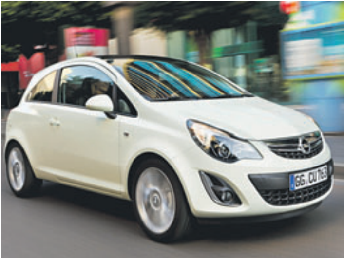
Dank neuer Front soll Opels Corsa dynamischer ins Jahr 2011 starten.

Das Modell Satellite – der Name dürfte daher rühren, dass Popsternchen Lena jetzt Markenbotschafterin für Opel ist – enthält zusätzlich unter anderem Lederlenkrad, elektrische