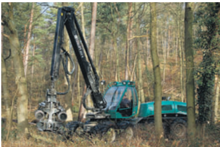
Mittels eines Harvesters werden Birken und Kiefern gefällt und in Sekundenschnelle zerlegt.

„Es handelt sich um eine routinemäßige Durchforstungsmaßnahme. Grundlage dafür ist das Fortseinerichtungsverzeichnis. Daraus ergibt