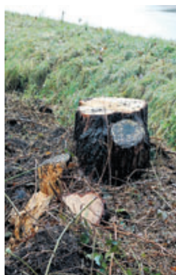
Auch morsche Bäume am Ehestorfer Heuweg wurden aus Gründen der Sicherheit entfernt.

schnitte während der Forstarbeiten nicht betreten dürfe, ernst nehmen. Die durch die schweren Maschinen verursachten Schäden an den Waldwegen würden bald behoben werden, erklärte Schulz.