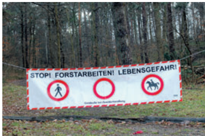
Absperrbänder warnen die Bürger vor dem Betreten von Durchforstungszone.