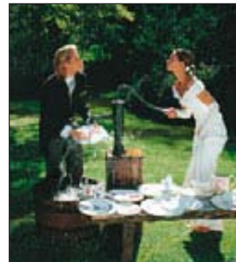
(spp) Hochzeitsbräuche, wie gemeinsames Zersägen eines Baumstammes, gibt es offensichtlich auch als Praxis-Test: Braut und Bräutigam beim Geschirrspülen.

Mit den eleganten Brautschuh macht die Braut den ganzen Tag eine blendende Figur – egal welches Hochzeitspiel sie meistern muss. Von der Brautführung über den Eröffnungswalzer bis hin zur Schwelle, über die sie getragen wird: An diesem Tag ist sie die Schönste.