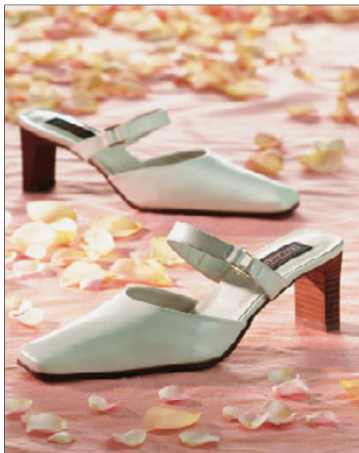
(spp) Auf eleganten Sohlen in die Ehe – mit cremefarbenen Brautschuh.