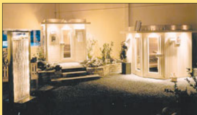
Ein kleiner Blick in die große Wellness-Ausstellung bei Wellnessdrops in Drestedt.

der sollte sich das Wellnessvergnügen in die eigenen vier Wände oder den eigenen Garten holen. Die Wohlfühlspezialisten von „Wellnessdrops“ aus Drestedt tragen dem wachsenden Gesundheits- und Körperbewusstsein in der Bevölkerung Rechnung und bieten in ihrer großen Wellness-Ausstellung ein umfangreiches Sortiment an Whirlpools, Saunen, Infrarot-Wärme-Kabinen, und Solarien.