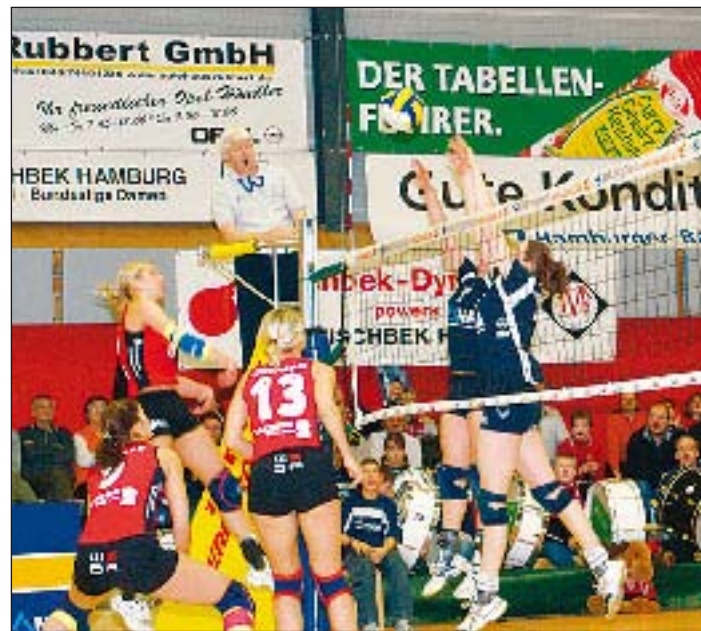
Trotz verzweifelter Gegenwehr, konnten die Spielerinnen des TV Fischbek die Niederlage gegen den Dresdner SC nicht verhindern.