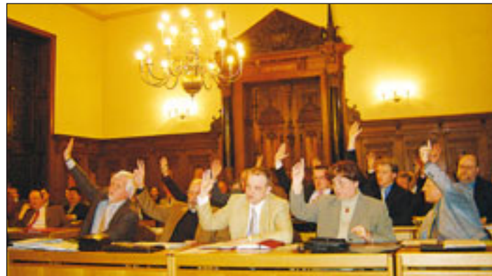
Mit den Stimmen von CDU und GAL sprach sich eine Mehrheit in der Bezirksversammlung für eine Mißbilligung der Vorgehensweise der Verwaltung aus!