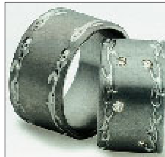
(spp) Platin Trauringe „Unique“ von Johann Kaiser, Hainburg.