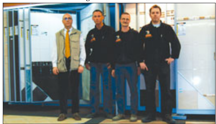
Das Team der Firma „Fliesen-Discount“ am Großmoorbogen 15 berät seine Kunden serviceorientiert und kompetent.

Montags bis freitags von 8.00 bis 20.00 Uhr und samstags von 8.00 bis 16.00 Uhr ist das kompetente Team für Sie da. Weitere Informationen gibt es im Internet unter www.fliesendiscount.de