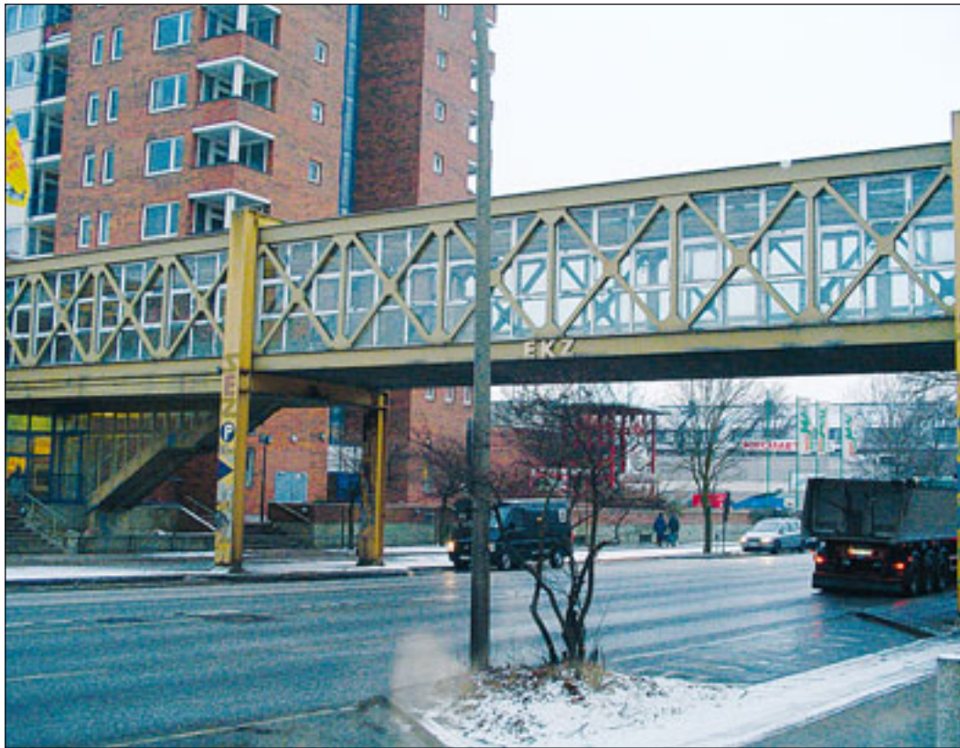
Die Außenfassade der SEZ-Brücke soll mit einem finanziellen Aufwand von 90.000 Euro saniert werden.

Brücke befragte „Der Neue Ruf“ SEZ-Geschäftsinhaber nach ihren generellen Änderungswünschen hinsichtlich der Inneneinrichtung des Einkaufs-Center. Hierbei ergaben sich eine ganze Reihe von Anregungen. „Wände und Decken im SEZ müssen komplett neu gestrichen werden. Auch die Tiefgarage bedarf einer grundlegenden Sanierung.“