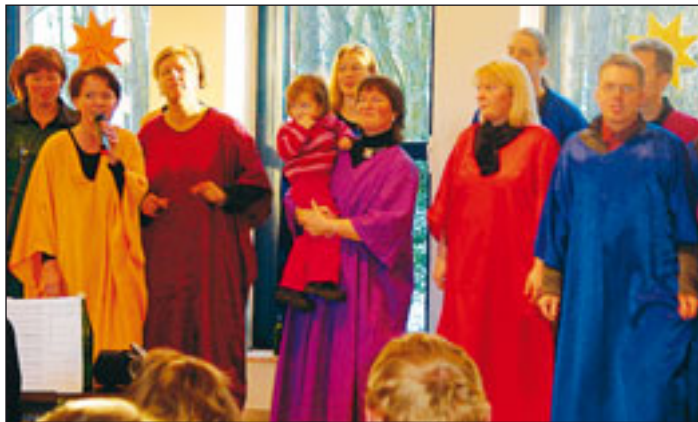
Der Gospelchor „Joy'n'Music“ begeistert seine Zuschauer mit raffinierten Liedern.

diesem Termin der Gospelchor „Joy'n'Music“ aus Neu Wulmstorf auf.