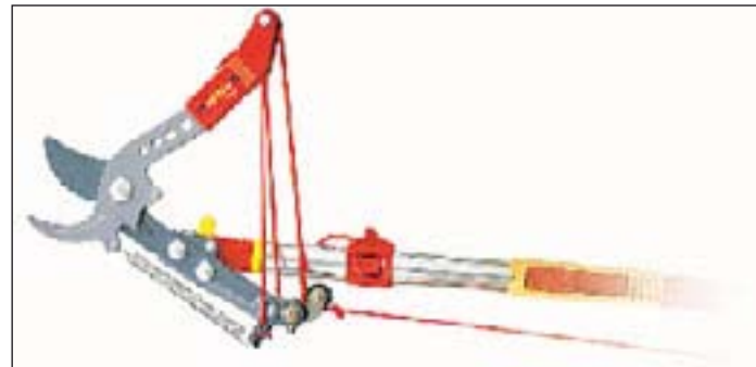
Astschere mit Seilzug.

Nur mit richtigem Werkzeug kann man diese Arbeiten „Fachmännisch“ ausführen und hat Spaß an der Arbeit.