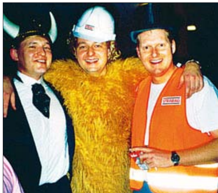
Ausgelassene Stimmung und ausgefallene Kostümierungen werden auch dieses Jahr auf der Faschingsparty des TVV Neu Wulmstorf dominieren

Essen und Getränke werden fast zum Selbstkostenpreis angeboten, da die Bewirtung von ehrenamtlichen Helfern der Turnabteilung geleistet wird.