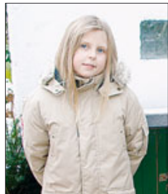
Hanna ist wegen des Verschwindens ihrer Haustiere traurig.

formationen über das Schicksal von „Klopfer“, der ein grau-weiß geflecktes Fell hat, mitzuteilen.