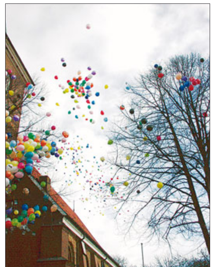
Der Fantasie der Airbus-Startbahn-Gegner sind keine Grenzen gesetzt: Als Zeichen ihres Protestes ließen sie am 23. Januar 1000 bunte Luftballons gen Himmel steigen.

(mk) Neuenfelde. Auch nach dem Verkauf wichtiger Grundstücke an Airbus durch den Neuenfelder Bauern Cord Quast, geben sich die Gegner der Landebahnverlängerung nicht geschlagen. Bester Beweis für diese Tatsache, war eine Protestkundgebung am 23. Januar. Vor der St. Pankratius-Kirche versammelten sich am ungefähr 100 Startbahngegner, darunter auch viele Kinder und Jugendliche, zu einer fantasievollen Protestaktion.