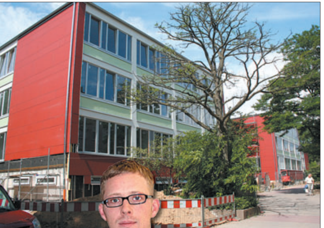
Das neue Bürgerzentrum im Phoenix-Viertel steht kurz vor der Fertigstellung

chen, was es einmal sein soll: Der Kern eines lokalen Netzwerkes von Angeboten der Kinder- und Jugendhilfe, Starterschule, Familienförderung, Elternschu-