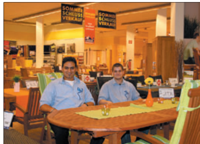
Nichts wie hin zum Dänischen Bettenlager Harburg: Nur noch wenige Ausstellungsstücke zu drastisch reduzierten Preisen warten auf Ihre neuen Besitzer

Dänisches Bettenlager Zur Seehafenbrücke 1 21073 Hamburg Telefon (040) 764 14 40