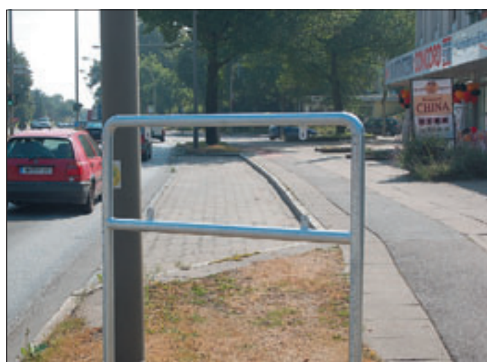
Gestohlen oder legal abgeschraubt? Kurz vor der Kreuzung Cuxhavener Straße/Falkenbergsweg war ein neues Schild mit der falschen Aufschrift Hausbruch installiert worden.

Stadteilschilder vermerkt gewesen wären. Doch entweder konnten die Beschäftigten die Karte nicht richtig lesen oder die Standorte der jeweiligen Schilder waren falsch eingezeichnet. Bereits in Harburg gab es einige Merkwürdigkeiten. Erst wurde in Neuland ein Schild mit der Aufschrift Neuenfelde aufgestellt. Dann platzierte man im Abstand von wenigen Metern gleich zwei Neuland-Schilder – ist Neuland über Nacht