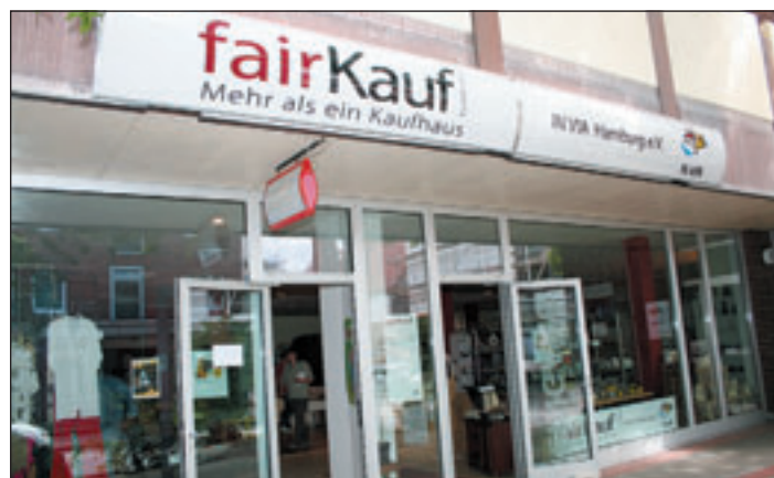
Das „fairKauf“ wurde von den Harburgern, die berechtigt sind hier einzukaufen, sehr gut angenommen