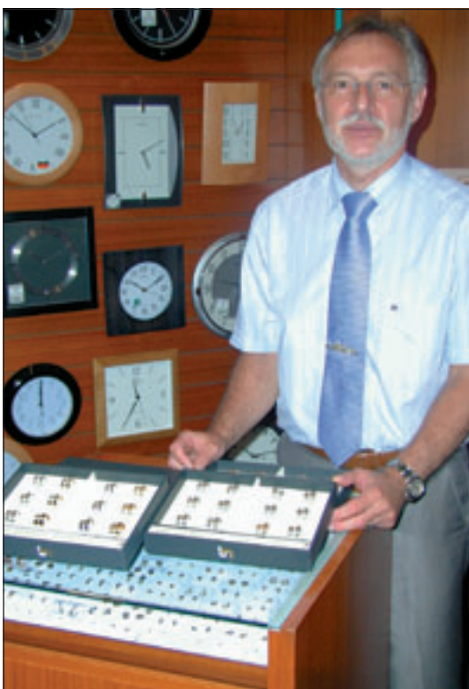
Die Bruno Mayer-Kollektion bei Juwelier Mannigel bietet eine große Auswahl von Trauringen in außergewöhnlichem Design an.

Juwelier Mannigel Süderelbe-Einkaufszentrum Cuxhavener Straße 335 21149 Hamburg Tel.: (040) 701 77 31 Fax: (040) 701 30 40