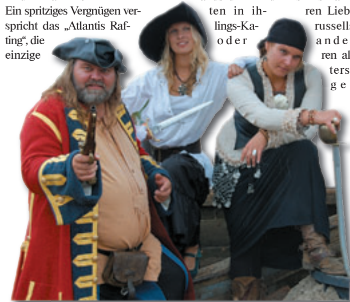
Auf der Pirateninsel sind die wahren Herrscher der Meere in ihrem Element und stellen dort ihre Künste zur Schau

Jung und Alt ein Schafott mit einer Guillotine bestaunen, aber niemand muss dabei gleich den Kopf verlieren. Für alle großen Abenteurer stellen die wahren Herrscher der Meere ihre Künste zur Schau und von freitags bis sonntags erklingen Live-Musik und Piratengesänge von der Bühne der Pirateninsel. Ein spritziges Vergnügen verspricht das „Atlantis Rafting“, die