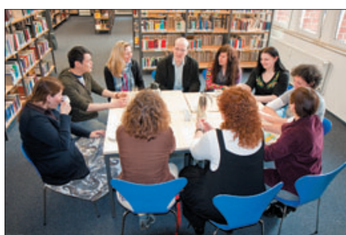
Ein Vorteil des Projektes: Lernen in kleinen Gruppen

Projekt für Erwachsene mit Migrationshintergrund