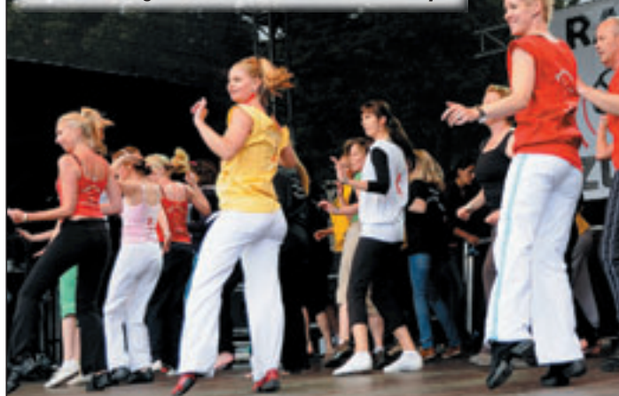
Auch die Gruppe „Danceation“ beteiligt sich an diesem 1. Harburger Kultursommer

17 lädt zur Vernissage und Ausstellung mit Gemälden zum Thema „Blumen und Landschaften“ ein und lockt zudem mit einer Weinprobe vom „Eiskeller“ (Freitag, 13. August von 9.30 bis 19.00 Uhr und Samstag, 14. August, 9.30 bis 16.00 Uhr).