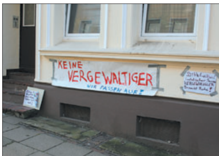
Die Bürger haben ihre Protestschilder an der Fassade des Hauses in dem Hans-Peter W. wohnen sollte, befestigt

Massive Proteste bei Bürgern und Politikern