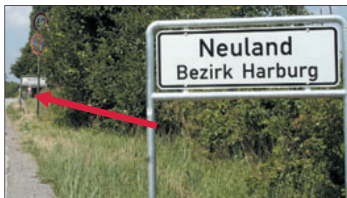
Diese Aufstellung grenzt schon an Dummheit: Zwei Schilder künden dem Autofahrer, dass er sich nun nach Neuland begibt.

so klein geworden? Auch Neugraben blieb vom Wirrwarr nicht verschont. Kurz vor der Abzweigung zum Falkenbergsweg stand an der Cuxhavener Straße in Richtung Harburg ein Schild mit der Aufschrift Hausbruch. Auf der anderen Seite begann laut neuem Schild Neugraben – alteingesessene Neugraber trauten ihren Augen nicht. Zwischenzeitlich sind beide Schilder weg – Schulz geht davon aus, dass sie geklaut worden seien. Angesichts der einfachen Verschraubung ist das auch keine große Kunst. Immerhin sind noch die Bügel da.