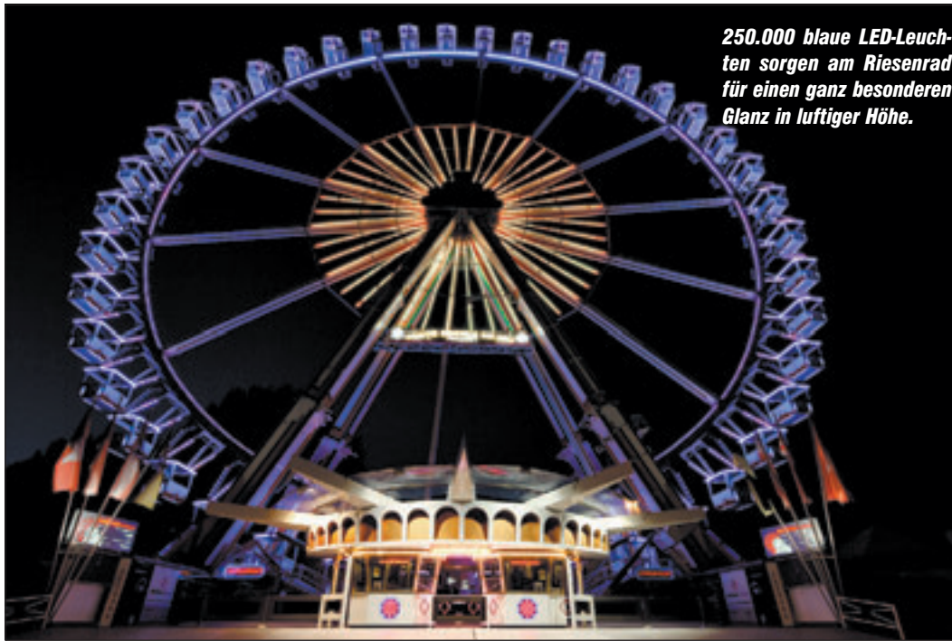
250.000 blaue LED-Leuchten sorgen am Riesenrad für einen ganz besonderen Glanz in luftiger Höhe.

■ (pm) HARBURG. Für Freunde des gepflegten Swingtanzes heißt es am Sonntag, 8. August ab 16.00 Uhr im Café Leben, Heimfelder Straße 21, „Swing das Leben“ Die Swingwerkstatt Hamburg bietet einen kostenlosen Crashkurs an, eine Anmeldung ist nicht erforderlich. Anschließend darf ab 16.30 Uhr zu Charleston, Balboa und Lindy Hop getanzt werden. Für vier Stunden legt DJ Mel aktuelle und klassische Songs auf.