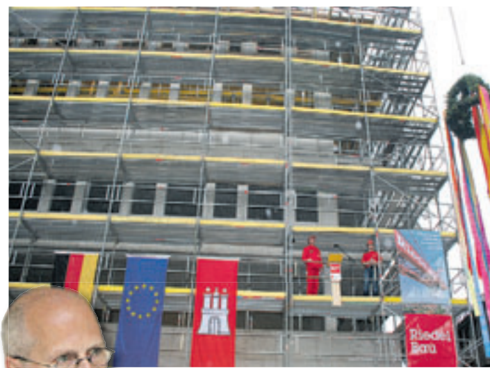
Im Rathausforum über dem am Mittwoch der Richtkranzschwelte, werden elf Dienststellen unter einem Dach zusammen geführt