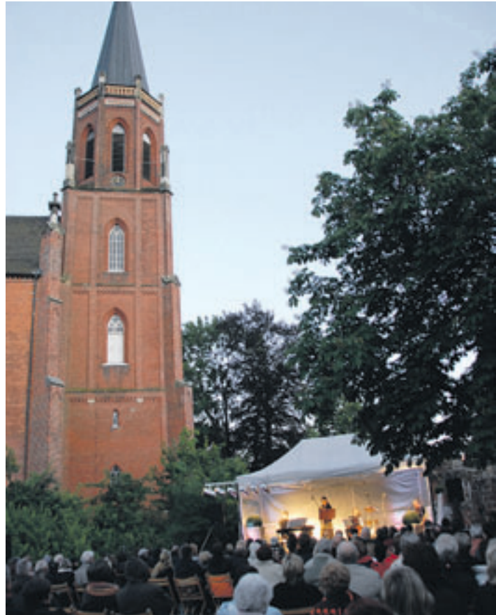
Den Freund klassischer Klänge erwartet im Klosterpark eine eindrucksvolle Veranstaltung mit hochkarätigen Musikern

Stadtmarketing Harsefeld Herrenstraße 25, 21698 Harsefeld Tel.: (04164) 887-135