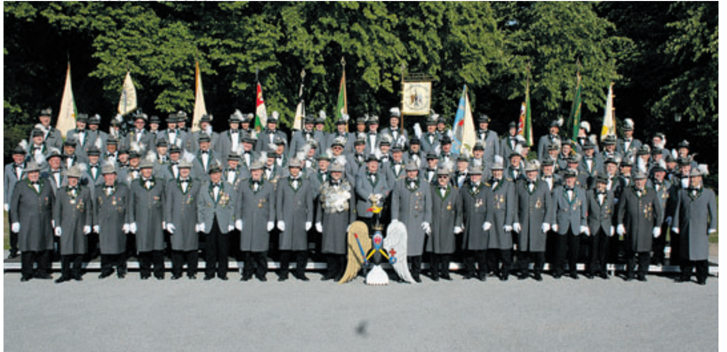
Das große Gilde-Foto am Schwarzenberg ist eine Tradition an der unverändert festgehalten wird. Der Termin lautet das alljährliche Vogelschießen ein. Während der nächsten Tage wird die Gilde regelmäßig im Stadtbild zu sehen sein.

Hamburgs neuer Erster Bürgermeister Olaf Scholz (SPD) lässt sich beim Umzug am 16. Juni, der diesmal auch durch eine Dudelsack-Pfeiferband begleitet wird, von Carola Veit, Vorsitzende der Bürgerschaft vertreten, hält