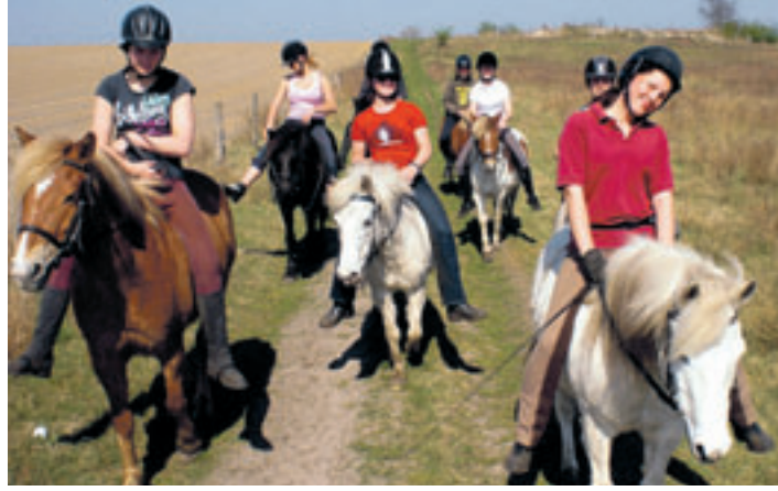
Gibt es etwas schöneres, als mit Freunden und auf einem Pony einen Ausritt zu machen?

■ (gd) Tostedt. Für junge, aktive Kinder von 6 bis 14 Jahren, für Mitmacher die nicht nur cool auf der faulen Haut liegen wollen ist der Otter-