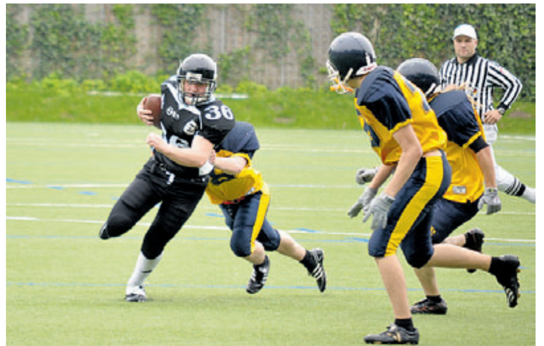
Ob es in zwei Wochen für einen erneuten Sieg, diesmal gegen den Tabellenersten, reicht?

Der Spieltag begann mit dem Empfang der jugendlichen Gastmannschaft, der Buxtehude Junior Dragons. In der Unterzahl, aber hochmotiviert betraten sie das Feld. Doch der zahlenmäßigen und körperlichen Überlegenheit der Gastgeber aus Harburg konnten die Buxtehuder nicht viel entgegensetzen. Schon zur Halbzeit führte das Heimteam mit 28:00. Trotz dieses Punktestandes ließen die Junior Dragons ihren Willen nicht brechen und kämpften verbissen um jeden Meter Raumgewinn. Schlussendlich trennten sich die Teams jedoch mit einem 44:0 und die jungen Raben können sich