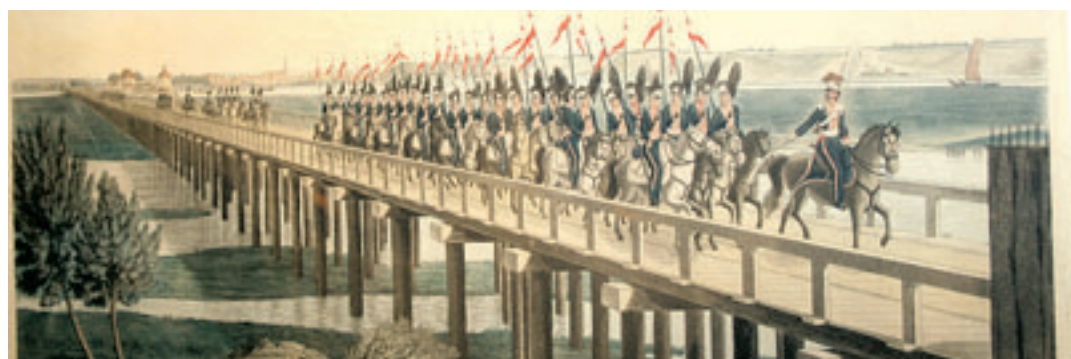
Südlicher Teil der napoleonischen Holzbrücke über die Elbe, erbaut in 83 Tagen. Die Gesamtlänge der Brücke betrug 15173 Fuß.

Seit 1933 befinden sich zwei große, vergoldete Schlüssel im Helms-Museum. Sie sollten am 13. August 1810 durch den Harburger Bürgermeister Hansing an Jerome Bonaparte, Napoleons Bruder und König des Königreichs Westfalen aus Anlass seiner Reise nach Hamburg übergeben werden. Doch König Jerome hatte wenig Interesse daran. Er ließ sich lieber zum Tafeln in das Harburger Schloss kutschieren.