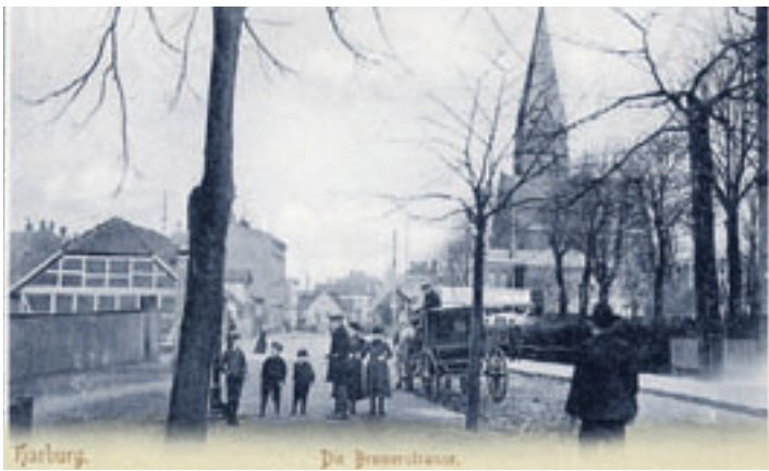
Die Bremertrasse (alte Schreibweise) im späten 19. Jahrhundert