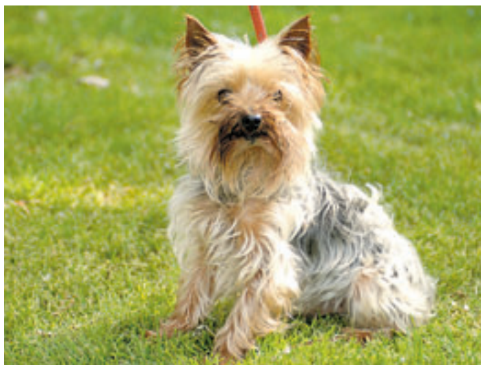
Vielleicht findet sich beim Sommerfest auch für „Tarzan“ ein neues Herrchen oder Frauchen.

Geschichte des traditionsreichen Vereins näher. Die zwei- und vierbeinigen Schüler der Spiel & Spaß-Gruppe der Hundeschule beweisen ihr Können, Mitarbeiter des Tierheims zeigen den Gästen bei Führungen das Gelände und die verschiedenen Tierhäuser und informieren über die Wildtierstation des HTV. Außerdem hält eine Spielwiese viele Attraktionen für Kinder bereit. Von 14.00 bis 16.00 Uhr sorgt die Band „Beat Shadows“ für musikalische Unterhaltung. Zwischendurch können sich die tierschutzinteressierten Besucher im Spatencafé mit Kaffee und Kuchen stärken. Zurzeit warten im Tierheim Süderstraße rund 1000 Tiere auf ein neues Zuhause, darunter sind rund 130 Hunde. Um ihre Vermittlungschancen zu erhöhen, werden einige von ihnen beim Sommerfest vorgestellt.