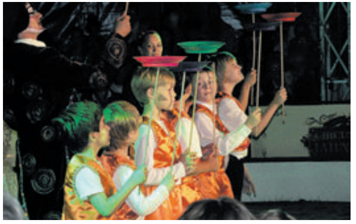
„Manege frei“ hieß es am Freitag und Samstag vergangener Woche für die Schüler der Grundschule Scheeßeler Kehre. Im Rahmen einer Projektwoche mit dem Zirkus „LaLuna“ verwandelten sich die Mädchen und Jungen, ent- sprechend ihren Neigungen, in kleine Zirkusartisten. Eltern, Großeltern und Freunde hatten sich im Zirkuszelt auf dem Schulhof eingefunden um die Darbietungen zu bestaunen. Dabei hatten die Kinder die Möglichkeit, ihre Fähigkeiten kennen zu lernen und ihre Grenzen zu erweitern.