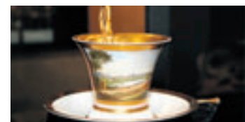
Diese Tasse zeigt die Bremer Straße um das Jahr 1824

Wer nicht an der Strecke arbeiten wollte, die bei Tötensen über einen Damm führte, der musste finanziell bluten. Auch über die Elbe ließ Napoleon eine 5.000 Meter lange Holzbrücke bauen. Sie hatte aber nicht lange Bestand – anders als die Straße die in ihrer Verlängerung entstanden ist, die heutige Georg-Wilhelm-Straße in Wilhelmsburg – so wie auch die Herrschaft der Franzosen in Hamburg nur von kurzer Dauer war. Sie zogen 1814 wieder ab und hinterließen verbrannte Erde. Es waren mit die bittersten Jahre die Hamburg erlebt hat. An diese Zeit erinnert beispielsweise ein auch heute noch als „Pferdestall“ bezeichnetes Gebäude der heutigen Universität Hamburg, das damals zweckentfremdet wurde. Nicht nur die finanzielle Last, die die Hamburger tragen mussten, war groß. Die Besitzer, die zwangseinquartiert wurden, wollten auch bewirtet werden. In Harburg stand das Posthaus beispielsweise auf der heutigen Fläche des Betriebs Zehrer und Petersen. Wie es damals in Harburg ausgesehen hat, davon zeugen Gemälde und Stiche, die sich im Fundus des Helms-Museums befinden.