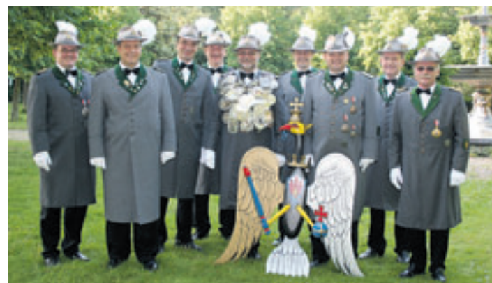
Die Gilde-Deputation stellte den diesjährigen Vogel vor

Die Fahrgeschäfte sollen folglich noch weniger werden, wobei ein Kinderkarussell und auch der Break-Dancer sicherlich nicht fehlen werden. Das ewige Biertrinken und Bratwurstessen muss nicht mehr sein, befand die Deputation. Folge: Die Besucher sollen leckere Scampi-Spieße genießen und