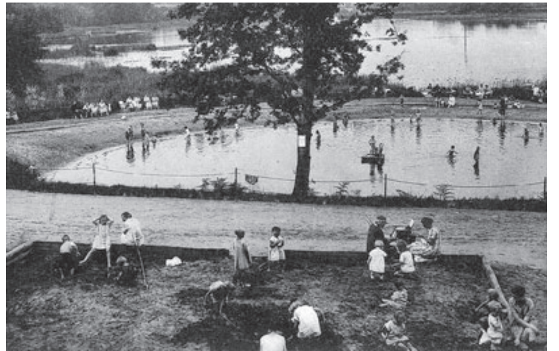
Das ehemalige Planschbecken im Stadtpark um 1930