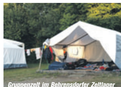
Gruppenzelt im Behrendorfer Zeltlager

hallen rund um den Opferberg stehen zur Verfügung, so dass auch für ein Schlechtwetter-Programm gesorgt ist. Eine Woche inklusive Betreuung und Verpflegung kostet für alle Sportvereinsmitglieder 85 Euro, Geschwisterkinder zahlen 75 Euro, für Nichtsportvereinsmitglieder 100 Euro.