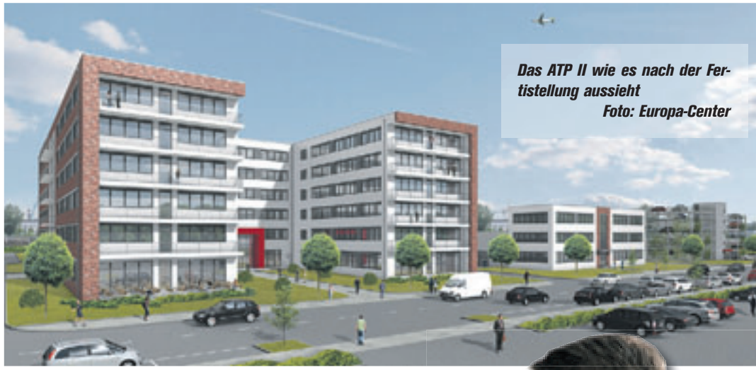
Das ATP II wie es nach der Fertigstellung aussieht