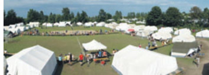
Der Zeltplatz liegt direkt am Ostseestrand

mit viel Spiel und Spaß die Ostsee genießen wollen genau das richtige! Die HNT hat damit einen „Klassiker“ wieder aufleben lassen – viele hundert Kinder und Jugendliche haben in den vergangenen Jahrzehnten mit tollen Erinnerungen daran teilgenommen.