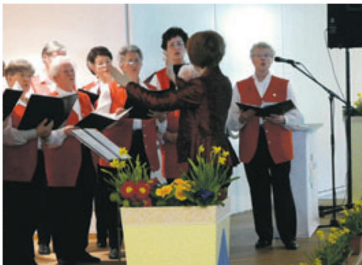
Auch der Damenchor Neugraben von 1951 wird auf der Veranstaltung singen.