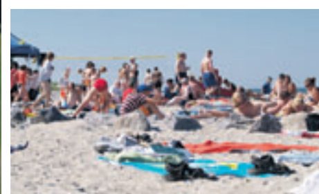
Der Behrendorfer Strand ist keine 200m vom Zeltlager

■ (pd) Für das HNT Sommerzeltlager in Behrendorf können noch weitere Betreuer ab 16 Jahren eingesetzt werden. Für die Zelte mit bis zu acht Kindern sind jeweils noch zwei männliche und zwei weibliche Betreuerplätze frei. Bedingung sind die Juleica (Jugendgruppenleiterausweis) oder eine Mitgliedschaft in einem Sportverein. Die Teilnahmekosten werden übernommen und es wird ein Taschengeld gezahlt. Informationen gibt es im HNT-Sportbüro, Telefon 7017443 oder bei Astrid Röttger, Telefon 7014195.