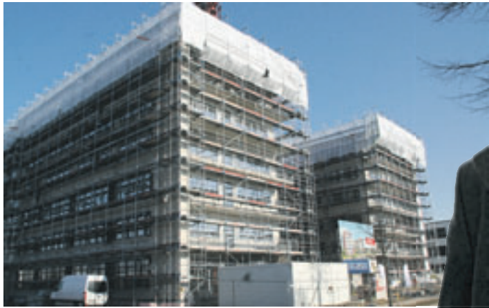
95 Prozent der gesamten Büro- und Gewerbeflächen sind bereits vermietet