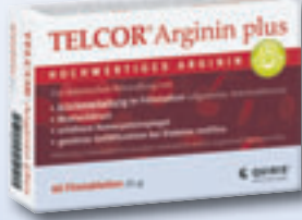
Arginin: Bluthochdruck chemiefrei senken

■ (ein) Der medizinische Fortschritt schenkt uns viele zusätzliche Lebensjahre. Doch machen uns diese Jahre häufig mehr Angst als Hoffnung. Wird man diese Jahre bei vollem Bewusstsein erleben, oder gezeichnet sein durch die Schreckgespenster der Neuzeit, durch Adernverkalkung, Demenz oder Alzheimer? Experten weisen in diesem Zusammenhang auf die Notwendigkeit eines frühzeitigen und konsequenten Adernschutzes hin. Herausragende Bedeutung kommt hierbei Arginin zu, einem natürlichen Eiweißbaustein, der als Adern-Nährstoff Bedeutung erlangt.