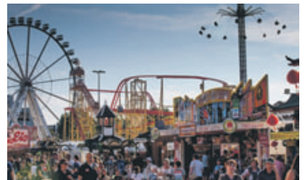
Auch in diesem Jahr rechnen die Schausteller auf dem Frühlingsdom wieder mit zahlreichen Besuchern, die sich von der bunten Vielfalt des größten Volksfestes des Nordens begeistern lassen wollen.

Getreu dem Motto „Ein Spaß für die ganze Familie“ wartet der Frühlingsdom 2013 wieder mit einem bunten Mix aus Nostalgie, hochmodernem Action-Spaß und kulinarischen Leckereien auf die DOM-Besucher. Hier findet jeder sein persönliches Highlight, ob in einem der vielen Fahr-, Schau- und Belustigungsgeschäfte, auf dem „Jahrmart Nostalgia“ oder bei einer der typischen DOM-Speisen. Mit Dampfkarussell und Nostalgie-