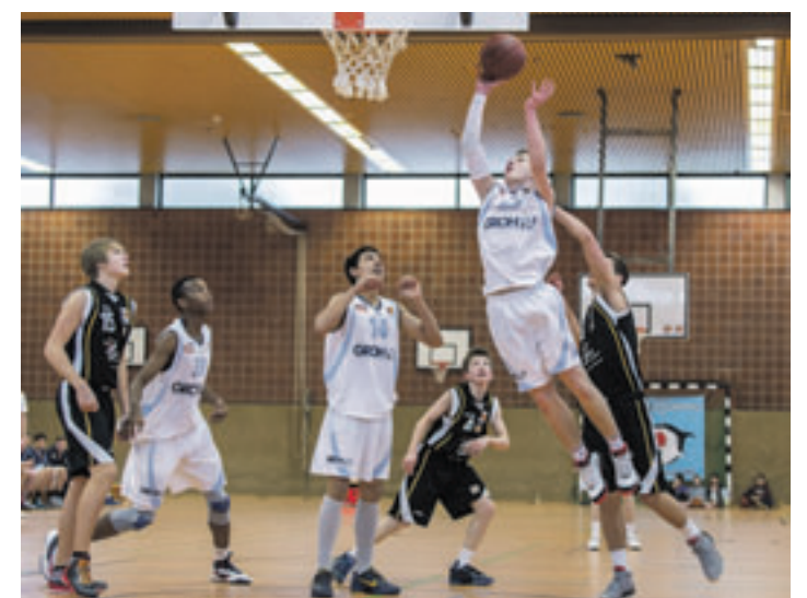
...und schon wieder punkten die Sharks