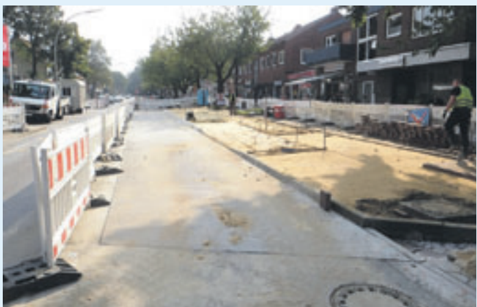
Langsam nehmen die neuen Bushaltestellen in der Bahnhofstraße Gestalt an.

am Fahrbahnrand. Alle Einrichtungen und Geschäfte in der Neugraber Bahnhofstraße sind über die Zufahrt durch die Straßen Bauernweide und Neugraber Markt weiterhin zu erreichen. Der Busverkehr wird aufrechterhalten.