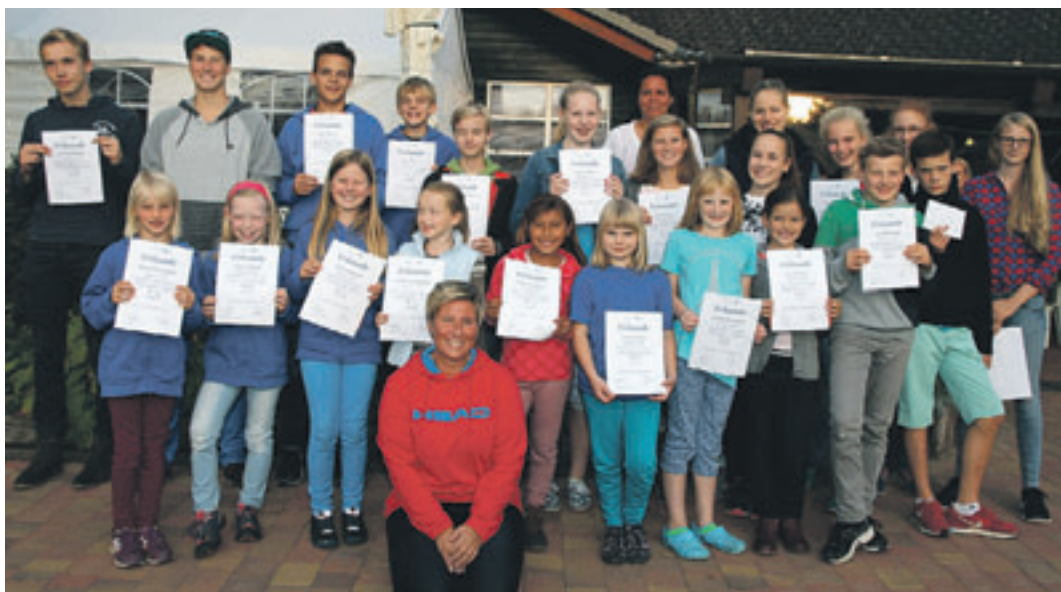
26 Kinder und Jugendliche nahmen am Turnier des NTC teil.

des Jahres Carola Barkow und Anja Kuhn, deren Kinder selbst beim NTC spielen. Die Intention der beiden Mütter lag darin, dass sich die