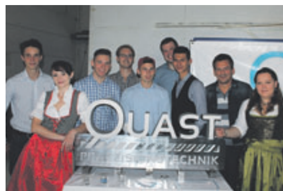
Die Azubis bei Quast präsentierten die Ausbildungsberufe auf dem Oktoberfest.