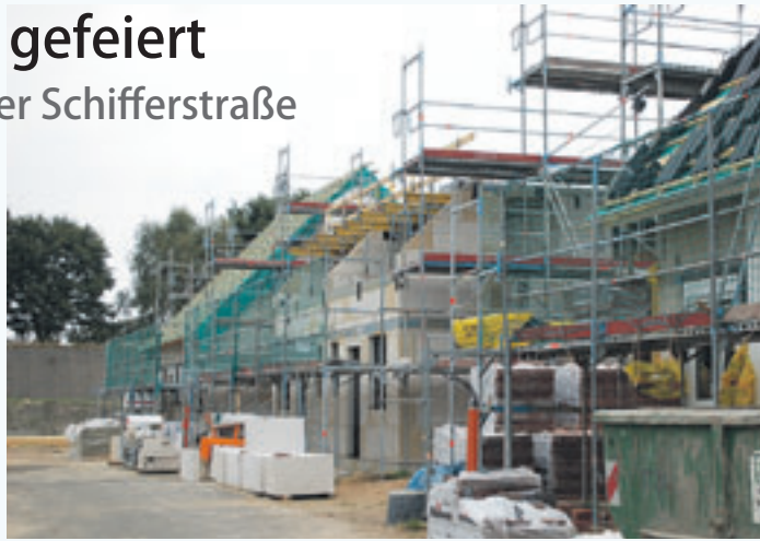
Laut Projektleiter Alexander Lang sind die ersten Neubauten des „Familienhofs an der Schifferstraße“ voraussichtlich schon im November 2014 bezugsfertig.

Das Baugrundstück für das neue NCC-Wohnquartier „Familienhof an der Schifferstraße“ befindet sich in grüner und gepflegter Nachbar-