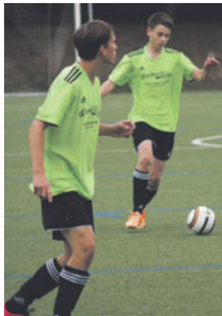
Die C-Jugend der HNT gewann mit 4:0 gegen den SV Wilhelmsburg.