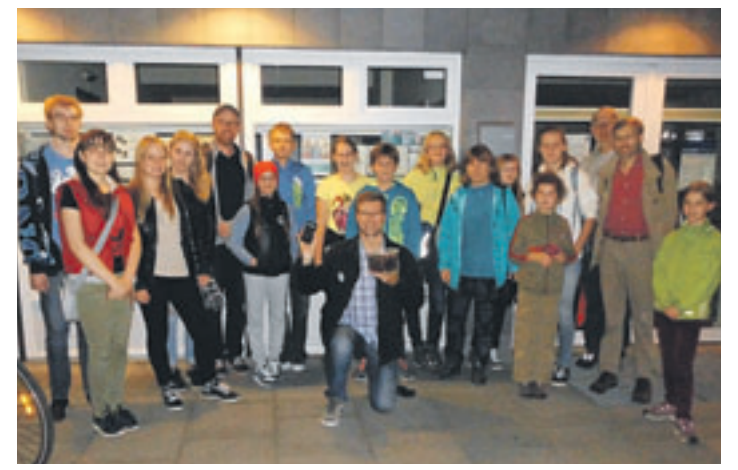
Zum Fledermausrundgang am 19. September trafen sich Schüler des Gymnasiums Süderelbe und Aktive der NABU-Gruppe.

■ (mk) Neugraben. Fledermaussuche in Neugraben? Zu dieser etwas ungewöhnlichen Exkursion trafen sich am 19. September Schüler des Süderelbe-Gymnasiums („Umwelt-AG“ und „Bio-AG“) und Aktive der NABU-Gruppe.