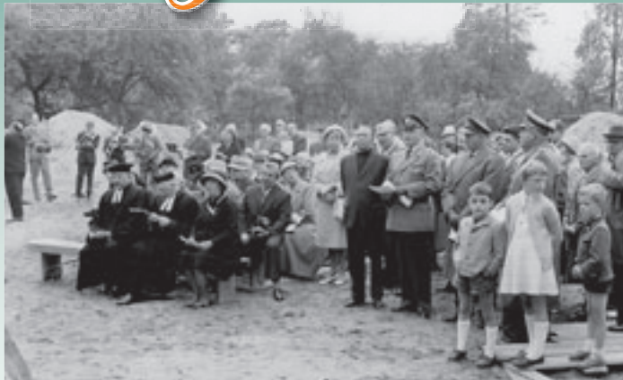
Am 30. September 1962 fand die Grundsteinlegung für die Corneliuskirche statt.