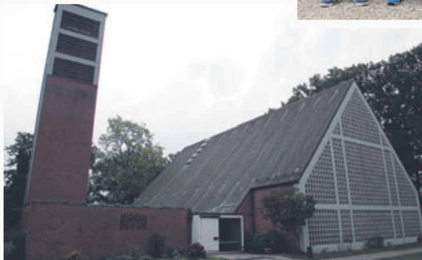
Die Corneliuskirche wurde einem niedersächsischen Bauernhof nachempfunden.

und Neugraben abgehalten werden. Am 29. Oktober 1911 wurde in Neugraben die neue Michaeliskirche eingeweiht. Damit hatten die Mitglieder des Pfarrbezirkes Elstorf II ihre eigene Kirche. Am 23. Oktober 1923 wurde der nächste bedeutende Schritt vollzogen – die Trennung von der Muttergemeinde Elstorf.