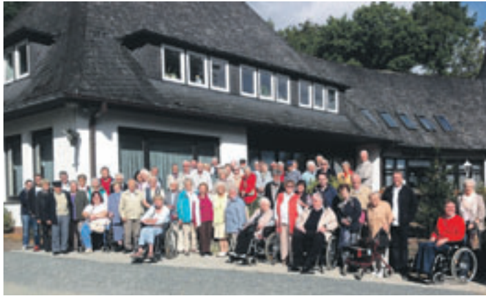
SoVD- bzw. DRK-Mitglieder aus Neu Wulmstorf besuchten den Zoo Wingst.