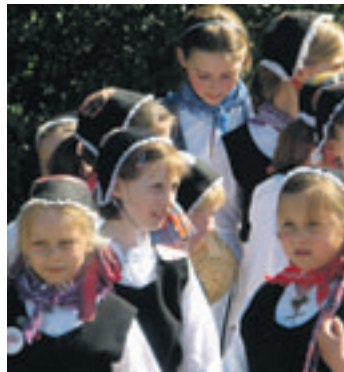
Die Volkstanz und Trachtengruppe Kiekeberg hofft auf neue Mitglieder.

Getanzt werden alte und neue Volks- und Kindertänze. Bei Auftritten wird eine Tracht getragen, die die Kinder um den Kiekeberg um 1870 als Sonntagskleider hatten. Am Wochenende, 3. bis 5. Oktober, treten die Kinder beim Erntefest auf. Alljährlich fährt der Nachwuchs zum „Tag der Niedersachsen“ und zum Landeskindertanzfest und macht jedes Jahr eine tolle Fahrradtour.