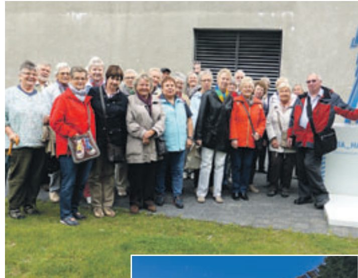
Am 24. September besuchten Mitglieder der Freizeitgruppe Süderelbe den Energiebunker.

Teilnehmer am diesem Rundgang wird neben Manuel Sarrazin, Mitglied des Deutschen Bundestags