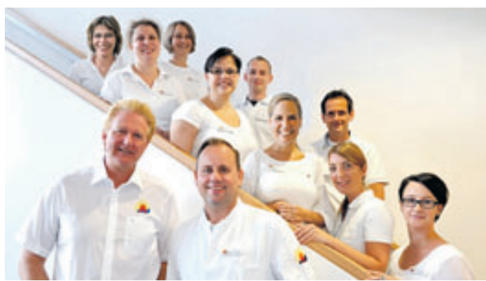
Ein hochqualifiziertes Team gibt den Besuchern Einblicke in die heutige innovative Strahlentherapie.

Strahlentherapiezentrum Harburg Veritaskai 6 21079 Hamburg Tel.: (040) 2111656666 E-Mail: info@szha.info www.szha.info