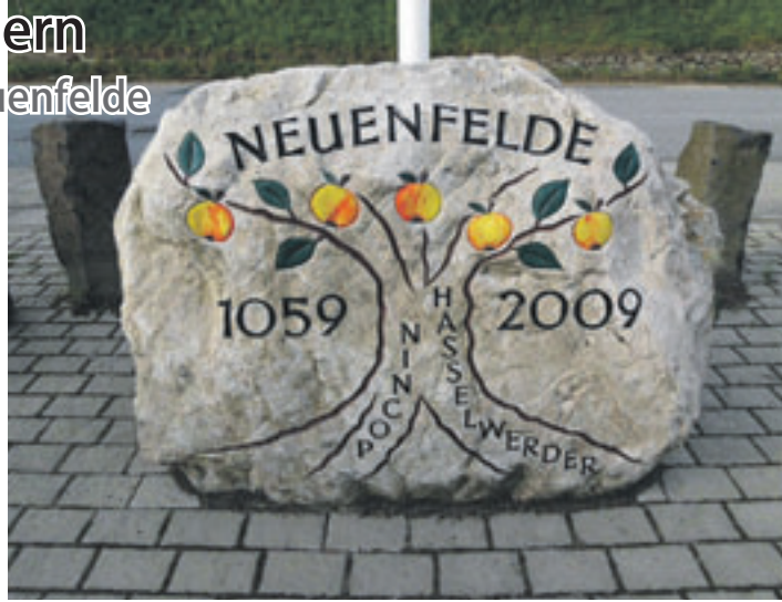
Auf ihrer Wanderung kommen die Wanderfreunde Hamburg auch am Neuenfelde-Findling vorbei.

■ (mk) Süderelbe. Am 5. Oktober wollen die Wanderfreunde Hamburg mit Helga Weise durch die Fischbeker Heide rund 16 Kilometer bis Neuenfelde wandern. Dort spielt Hilger Kespohl auf der Arpschnitger-Orgel der St. Pankratius-Kirche ein Konzert. Der Eintritt ist frei, Spende erbeten. Treffen ist um 10.00 Uhr am Bahnhof Neugraben, auf der Fußgängerbrücke, zur gemeinsamen Fahrt im Bus 240 nach Waldfrieden/Wendeschleife. Die Wanderung startet von dort um 10.20 Uhr. Eine Kaffeeinkehr ist am Ende der Wanderung auf Wunsch möglich. Die Rückfahrt mit der HVV-Fähre ist ab Finkenwerder geplant.