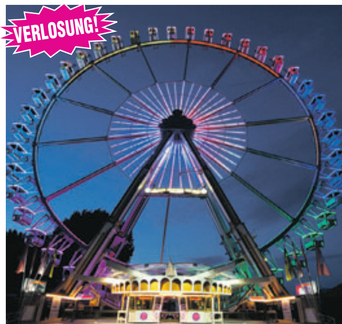
Das Riesenrad gilt schon längst als Wahrzeichen für den Hamburger Dom.

Die spektakuläre Simulationsanlage „Encounter“, ein Belustigungsgeschäft der besonderen Art, wird