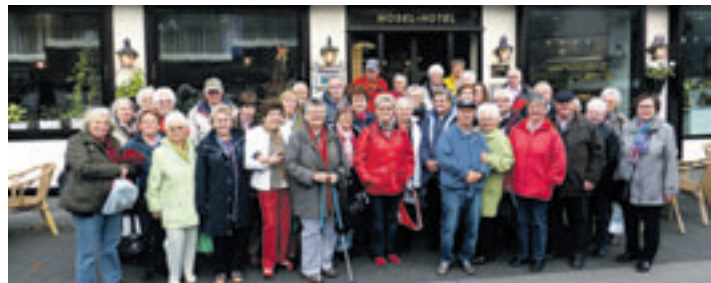
Die Teilnehmer der Freizeitgruppe Süderelbe verbrachten einige schöne Tage an der Mosel.

■ (mk) Neugraben. Die Freizeitgruppe Süderelbe für die ältere Generation war mit 44 Teilnehmern per Reisebus vom 27. – 31. Oktober an der schönen Mosel. Pünktlich ging es um 6.25 Uhr vom Neugraber Bahnhof los. Nachdem noch Reisende von den Bahnhöfen Harburg und Othmarschen zugestiegen waren, ging es gen Richtung Mosel. Cochem, Bernkastel-Kues und Beilstein lauteten einige Stationen des Ausfluges. Die Burg Thurant wurde ebenso wie das Kloster Maria Laach besichtigt. Selbstverständlich war auch eine Mosel-Schiffahrt im