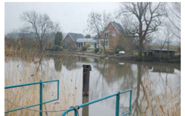
Mit der sogenannten „vorläufigen Sicherung“ soll verhindert werden, dass in Überschwemmungsgebieten, wie hier an der Este in Cranz, zusätzliche Schadenspotenziale entstehen.

■ (mk) Neuenfelde. Die Hamburger Verwaltung hat bisher stets deutlich gemacht, dass die Hansestadt Hamburg – wie alle anderen Bundesländer auch – für alle Gewässer mit Schadenspotenzial Überschwemmungsgebiete durch Rechtsverordnung auszuweisen habe. Ein solches Gebiet wird nun auch an der Este in Cranz vorläufig gesichert. Mit der sogenannten „vorläufigen Sicherung“ soll verhindert werden, dass in überschwemmungsgefährdeten Bereichen zusätzliche Schadenspotenziale entstehen. Grundlage für die Ermittlung eines Überschwemmungsgebietes wäre das 100-jährliche Hochwasser, das durchschnittlich einmal in 100 Jahren auftritt. Wegen der Ergebnisse, welche die Berechnungen zutage gebracht haben, sei für diesen Gewässerabschnitt ein Verfahren zur vorläufigen Sicherung des Überschwemmungsgebietes durchzuführen.