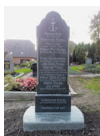
Es wäre schön, wenn viele Menschen die Gelegenheit nutzen, um sich den Stein der Familie Kinau auf dem Karkhoff anzuschauen.