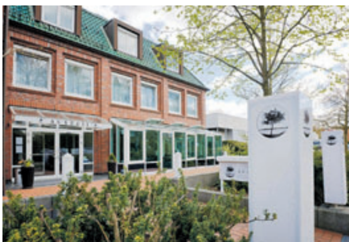
Das Auszeit Garni Hotel Hamburg in Neugraben wurde als HolidayCheck TopHotel 2014 ausgezeichnet.

mit ausgesuchten Zutaten aus heimischer Produktion. Vorwiegend kommen Produkte aus der Umgebung, wie beispielsweise Wurst aus der Heide, Obst aus dem Alten Land und Kaffee von einer Hamburger Rösterei auf den Frühstückstisch. Marmeladen, Joghurt oder Schokoladencreme werden durch die „Guten Geister der Auszeit“ selbst hergestellt. Leckeres Rührei oder Spiegelei wird dem Gast auf Wunsch frisch serviert. Nicht umsonst bekam das „Auszeit“ von seinen zahlreichen begeisterten Gästen hervorragende Bewertungen, die eine Auszeichnung als HolidayCheck Top Hotel 2014 zur Folge hatte. Auch VTA Aurubis Hamburg hat die Qualität des „Auszeit“ schät-