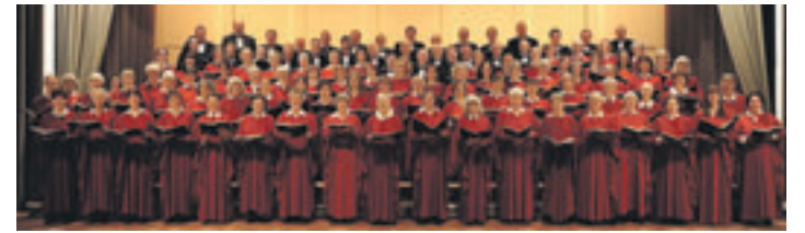
Die Krönungsmesse wurde wohl erstmals zur Krönung von Kaiser Franz II. aufgeführt und auch nach Mozarts Tod gerne bei ähnlichen Anlässen. Der Text des Magnificats weist auf die nicht mehr ferne Adventszeit hin.