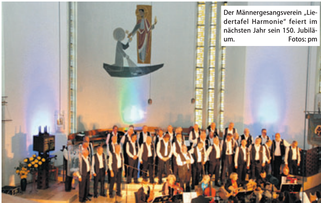
Der Männergesangsverein „Liedertafel Harmonie“ feiert im nächsten Jahr sein 150. Jubiläum.

Liedertafel und Freunde: Konzert in St. Petrus