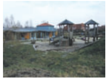
Blick auf die Kindertagesstätte Fuchsbau.

eigentlich drei-gruppige Kindertagesstätte an. Der große Garten bot genügend Raum, um die Kindertagesstätte zu erweitern und den Bedarf an Kinderbetreuung in Neu Wulmstorf weiterhin zu decken. Seit dem 15. Oktober werden weitere 15 Krippenkinder im Fuchsbau betreut. Ab Januar werden weitere 25 Kinder ab drei Jahren in einer Containerlösung ebenfalls auf dem Gelände der Kindertagesstätte Fuchsbau betreut. Diese Gruppe – und auch die vorläufige Krippengruppe, die in der Kindertagesstätte untergebracht ist, wird dann mit der Fertigstellung des Familienzentrums 2016 in die dortige Kindertagesstätte umziehen. Die Gemeinde plant den Bau des Familienzentrums an der Stelle des jetzigen MehrGenerationenHaus Courage. Ein öffentliches Forum, welches eine Bürgerbeteiligung ermöglicht, soll im Frühjahr 2015 stattfinden.