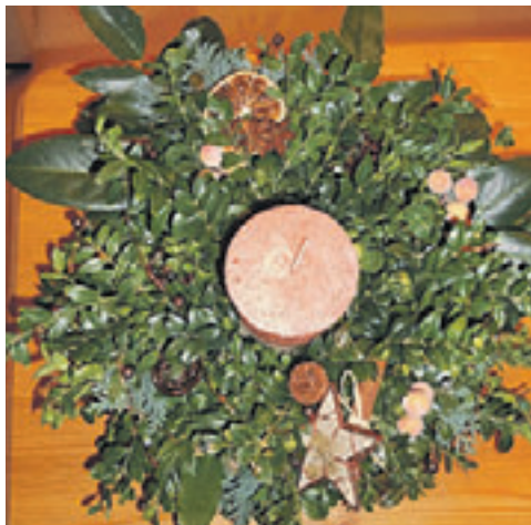
In der Bücherei können Erwachsene sich in der Kunst des adventlichen Handwerks üben.

■ (mk) Neu Wulmstorf. Am 21. November um 19.00 Uhr bietet die Bücherei im Rathaus wieder einmal einen gemütlichen, kreativen Bastelabend für Erwachsene an. In diesem Jahr steht ein Adventsgesteck im Korb auf dem Programm. Grundmaterialien wie Korb, Steckmasse, Draht und Tanne werden zur Verfügung gestellt. Lediglich weitere Dekorationen wie Kerzen, Schleifen oder Grundierungsfarbe können nach persönlichem Geschmack mitgebracht werden. Da die Teilnehmerzahl begrenzt ist, sollte eine An-