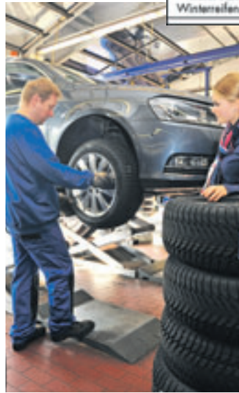
Schon auf Winterreifen gewechselt? In Deutschland besteht eine situative Winterreifenpflicht.