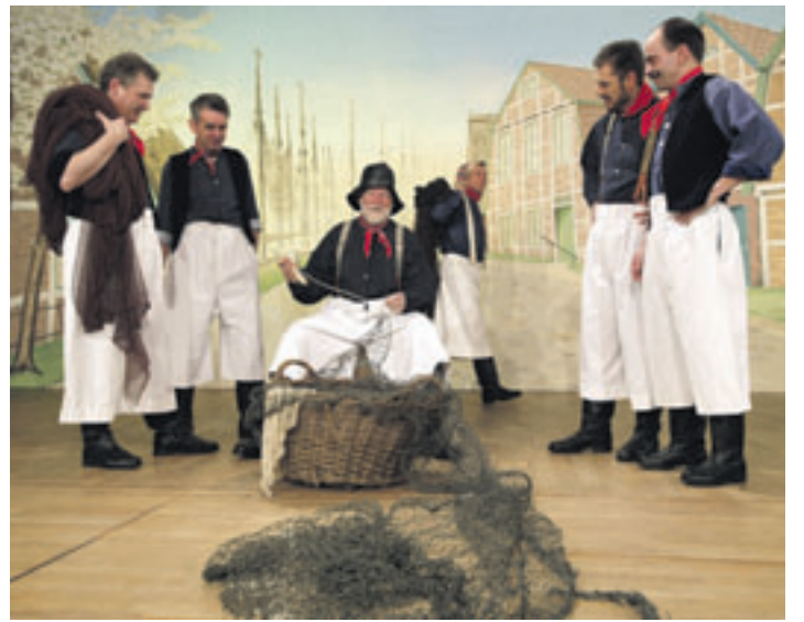
Lassen Sie den Alltag – hier eine Szene aus dem Leben der Fischer – hinter sich und kommen Sie zur Danzkring-Aufführung!

heißt es deshalb wieder am 30. November ab 15.30 Uhr im Theatersaal der Stadteilschule Finkenwerder am Norderschulweg. Eintritt: 7 Euro. Der Vorverkauf beginnt heute, am 8. November, in Finkwarders Lütten Loden, Steendiek 19, und im Blumenpavillon Jonas, Neßdiech 100. Auswärtige können unter Tel. 040 7434186 bei Jutta Vick Karten reservieren lassen.