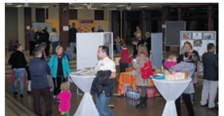
Eltern mit ihren Kindern nutzten die Möglichkeit, sich an den Ständen der beteiligten Grundschulen zu informieren.