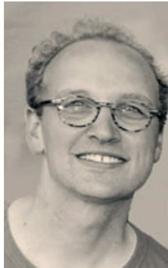
Peter Schulze Foto: ein

Auch Dr. Gudrun Schitteck, grüne Spitzenkandidatin für die Bürgerschaft in Süderelbe (WK 17), schließt sich dieser Forderung an: „Schon im Alltag ist die S3 die am stärksten ausgelastete S-Bahn-Strecke Hamburgs. Oft ist es im Berufsverkehr schwer, überhaupt in die Wagen zu kommen, von einem Sitzplatz ganz zu schweigen. Kurzfristig muss deshalb der Takt der S3 verstärkt und alle Bahnen auf die maximale Fahrzeuglänge erweitert werden. Auch der Fährverkehr