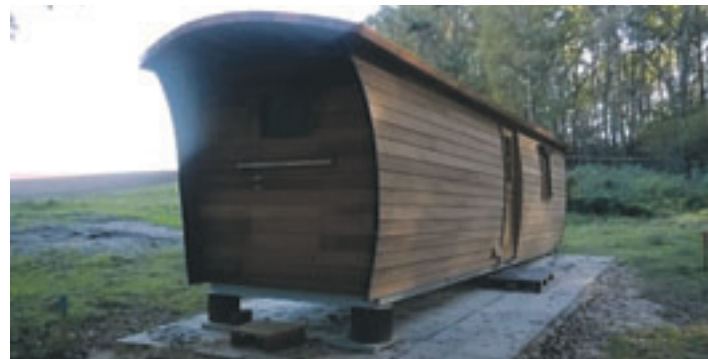
Der Bauwagen des Kindergartens HeideBären ist mittlerweile von den Kids in Beschlag genommen worden.

Von der Straße nicht zu sehen, fügt sich in der Kindertagesstätte Fuchsbau nun eine vierte Gruppe an die