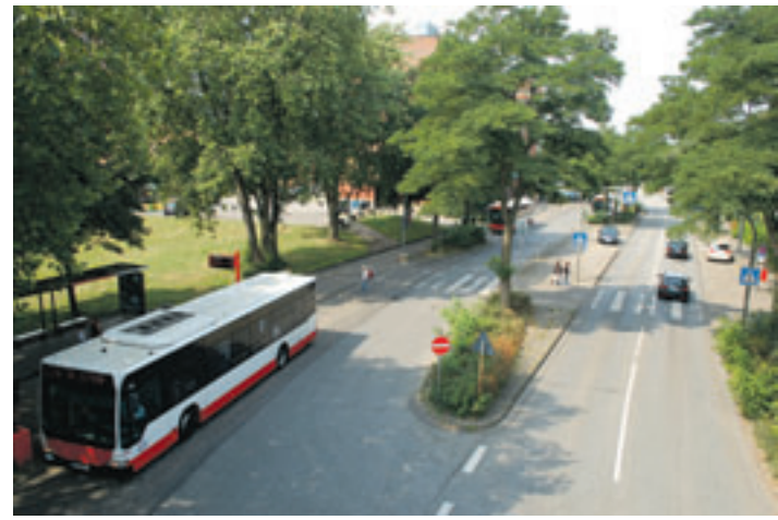
Der Neugraber Bahnhofsvorplatz soll nun in mehreren Schritten aufgewertet werden.

das dieses Rahmenprogramm und die hierdurch geförderten Maßnahmen fortgesetzt werden, heißt es im Koalitionsvertrag. In puncto „Fischbeker Heitkamp“ hat die CDU Duftmarken gesetzt. Die Begrenzung der Wohneinheiten auf höchstens