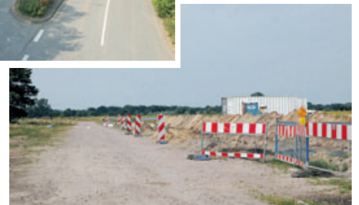
Für das Neubauebiet Elbmosaik sollen nun laut Koalitionsvertrag nur höchstens 690 Wohneinheiten realisiert werden.

Ferner sei dafür Sorge zu tragen, dass die vorgesehene Infrastruktur, sofern möglich, parallel zur