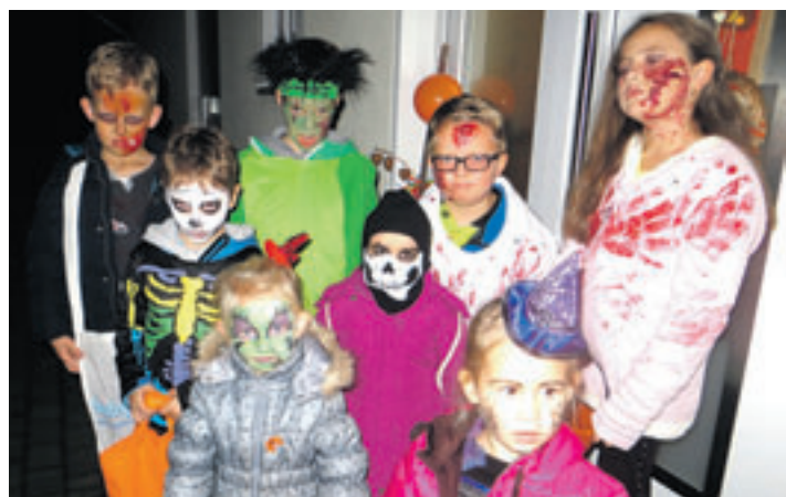
Auch diese kleinen Schattenwesen forderten: Süßes oder Saures.

sen schienen die Macht zu übernehmen. In den in Gärten aufgestellten Kürbisgesichtern erloschen die Kerzen. Es schien, dass sich die Menschen ängstlich in ihre Häuser zurückgezogen hatten, denn die Straßen waren wie leergefegt, und hinter Gardinen lugten Gesichter hervor. Zur Freude der Bewohner läuteten dann aber nicht nur unheimliche, sondern auch freundlich anzusehende Gestalten an Türglocken und forderten mit den Worten „Süßes oder Saures“ oder einem anderen Gedicht einen Tribut ein.