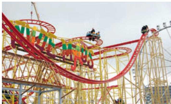
Länger, höher, schneller, so präsentiert sich auch die Wilde Maus wieder auf dem Winterdom.