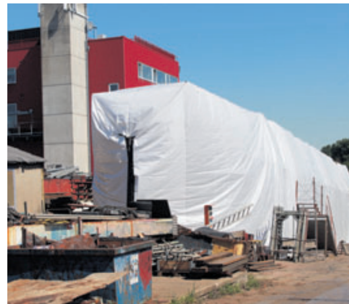
Nein, hier war nicht der Künstler Christo am Werk: Unter der Plane verbirgt sich das sanierungsbedürftige Hamburger Theaterschiff