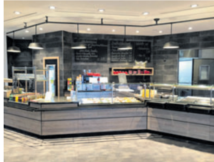
Die großzügige Theke dominiert das neugestaltete Ladengeschäft