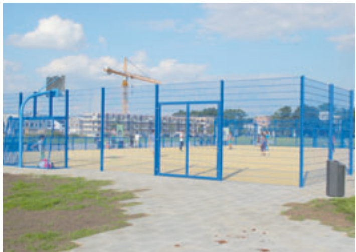
Treffpunkt ist dienstags und donnerstags ab 17.30 Uhr an der Sportanlage auf den Königswiesen

dem Regen trotzen, aber es hat allen so viel Spaß gemacht, dass die „Startergruppe“ seitdem zu den regelmäßigen Teilnehmern gehört“, betonen Czaplinski und Müller. Inzwischen wäre die Teilnehmerzahl auf über 20 Mädchen und Jungen aus den Wohnunterkünften und dem nahegelegenen Wohngebiet angestiegen. Neben Fußball würden auch andere Sportarten (z.B. Badminton) und Laufspiele angeboten. Es herrsche