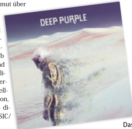
Das Cover der neuen Deep Purple-CD

xus eines treuen Publikums zu haben.“ so Steve Morse (Gitar).