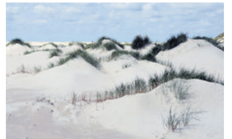
Auch dieses Werk wird in der Ausstellung gezeigt

Küsten kommen nicht zu kurz: Amrum, Cuxhaven, Büsum, Wursten, Helgoland, die Halligen und die Schlei sind vertreten. Und das zur besten Sommerzeit, wo es viele ans Wasser zieht. Die Fotos stammen aus den Jahren 1959 bis 2010. Es handelt sich im Wesentlichen um analoge Fotos, Dias und Negative, in Schwarzweiß und Farbe. Achtung: Sonntags ist das SEZ geschlossen.