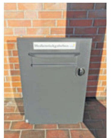
Hier gehören die Medien rein.