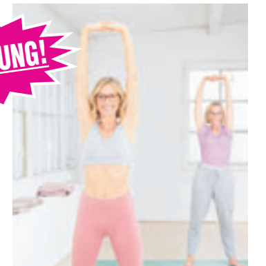
Eine individuell angepasste Brille sorgt für den richtigen Durchblick