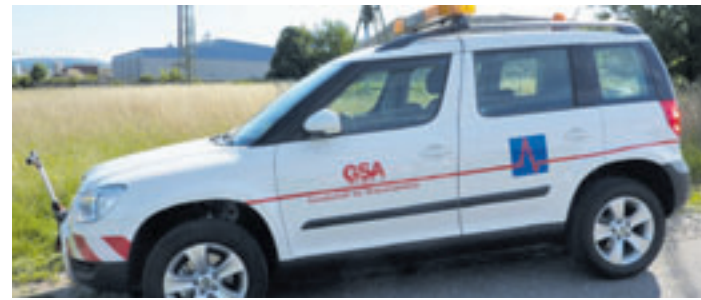
Die GSA wird eine Befahrung einiger ausgewählter kommunaler Straßen und Wege durchführen.

fährt das Erfassungsfahrzeug – deutlich sichtbar durch Warnleuchten und Sicherheitszeichen – im Schritttempo die betroffenen Straßen und Wege. Dadurch, dass alle relevanten Daten überwiegend bereits während der Befahrung registriert werden, wird es nur zu einer geringen Beeinträchtigung des Verkehrs kommen, heißt es in einer Presse-Mitteilung der Gemeinde.