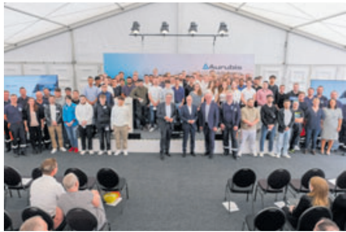
Mit Beginn des neuen Ausbildungsjahres starteten bei Aurubis in Hamburg 77 junge Menschen in ihr Berufsleben. Als nachhaltigstes Hüttenetzwerk der Welt bildet Aurubis 14 verschiedene Ausbildungsberufe in einer zukunftsträchtigen Industrie für den eigenen Bedarf aus.

Selbstverständlichkeit mehr. Die Tatsache, dass im vergangenen Jahr jeder Auszubildende seine Abschlussprüfung erfolgreich bestanden hat und über 85 % der Absolventen sich dazu entschieden haben, anschließend bei Aurubis übernommen zu werden, macht uns stolz und zeigt, dass sich unsere Investitionen in eine moderne, zukunftsweisende Ausbildung bereits heute auszahlen.“ Damit beweise Aurubis als Hamburgs zweitgrößter industrieller Ausbilder erneut sein kontinuierliches Engagement, um dem Fachkräftenachwuchs zu begegnen. Dies zeigt auch das 2019 eröffnete Innovations- und Ausbildungszentrum (IAZ) von Aurubis, in dem die Auszubildenden flexibel gestaltete Gruppen-, Lern- und Arbeitsräume vorfinden, die für sie individuelle Rahmenbedingungen zum optimalen Lernen schaffen. Darüber hinaus entwickelt Aurubis sein Ausbildungskonzept kontinuierlich weiter, um den sich stetig verändernden Ansprüchen gerecht zu werden. Dazu gehört seit diesem Jahr beispielsweise die Ausstattung mit einem persönlichen Tablet für alle technisch-gewerblichen Auszubildenden für eine moderne, digitale Arbeits- und Lernumgebung. Auch im nordrhein-westfälischen Lünen, wo der deutsche Recyclingstandort von Aurubis liegt, beginnen in diesem Jahr 17 junge Menschen ihre Ausbildung. Dort bietet Aurubis sieben verschiedene Ausbildungsberufe an und gehört damit zu den größten Ausbildungsunternehmen in der Region.