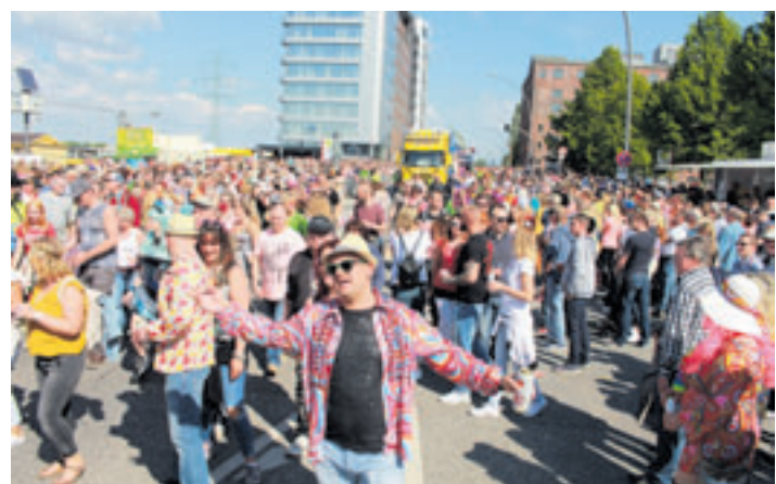
Das war der letzte Discomove im Mai 2019!