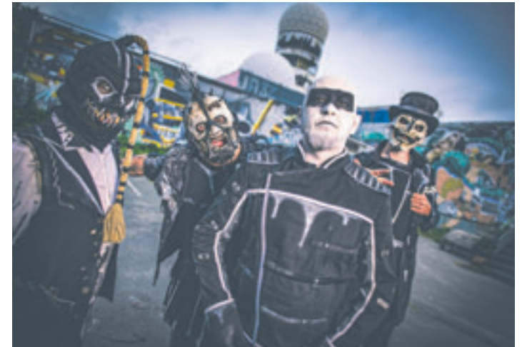
„Hämaton“: „Lang lebe der Hass“ ist die energiegeladene Fortsetzung ihres im Dezember 2021 erschienenen Longplayers „Die Liebe ist tot“ und der Soundtrack für die kommende Tour der Band

■ (pm) Wilhelmsburg. In diesem Herbst wollte die Band „Hämaton“ endlich auf ihre „Liebe & Hass European Tour 2022“ gehen und die Bühnen, nicht nur in Deutschland, Österreich und der Schweiz, sondern auch in weiteren Ländern Europas entern – doch schweren Herzens musste die Band heute die Verlegung der Tour in den April und Mai 2023 bekanntgeben. Ebenfalls verschoben wird der Release des neuen Albums „Lang lebe der Hass“, welches nun am 4. November auf dem Label „Anti Alles“ erscheint, statt wie ursprünglich geplant am 16. September. Davon betroffen ist auch das Konzert in Hamburg in der Wilhelmsburger Edel-Optics-Arena. Der neue Termin ist jetzt der 15. April 2023, und statt in der Edel-Optics-Arena wird das Konzert nun in der Sporthalle Hamburg stattfinden. Die bereits für die Edel-Optics-Arena erworbenen Tickets behalten ihre Gültigkeit. In der Pressemitteilung von „Hämaton“ heißt es weiter: „Grund dafür ist NORDs Gesundheitszustand. Seit einigen Wochen plagen ihn massive Probleme mit seinem Gehör. Er musste sich einer sehr ernstesten OP an einem Ohr unterziehen und bekam zur gleichen Zeit auch noch eine starke Entzündung im anderen Hörorgan. Die Genesung geht nur sehr langsam voran, und schon für die Shows beim WOA und auf dem Summer