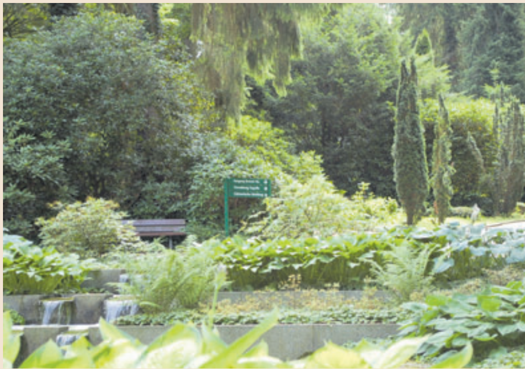
Der Neue Friedhof in Harburg lädt mit seinem parkähnlichen Charakter zum Verweilen ein