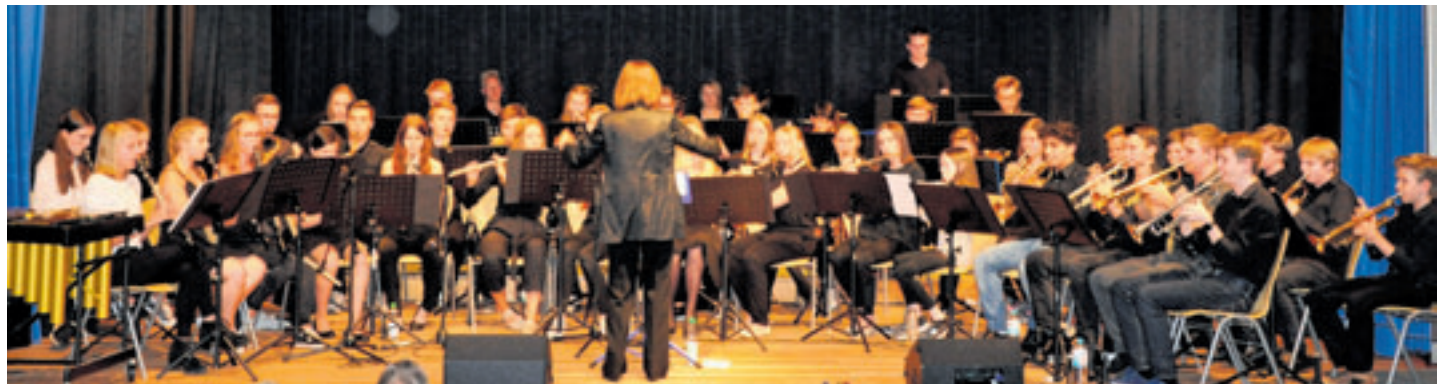
Sommerkonzert des Marmstorfer Schülerorchesters: Ein Termin, auf den viele gewartet haben

Beginn ist um 18 Uhr, Einlass ab 17.30 Uhr, der Eintritt beträgt 5 Euro. Eintrittskarten sind über die Orchesterleiter und das Büro der Grundschule Marmstorf sowie an der Abendkasse zu beziehen.