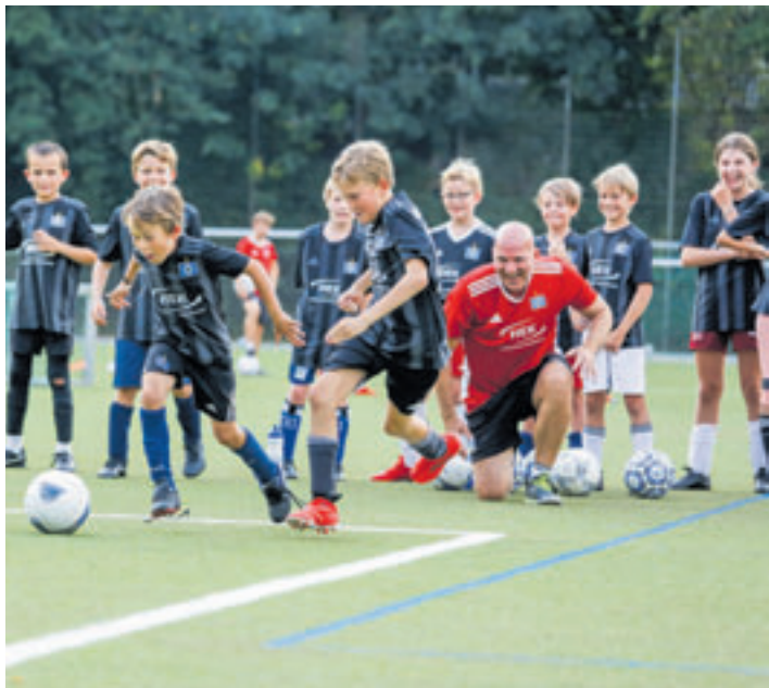
Auch in Harburg wird vom 10. bis zum 14. Oktober auf dem Platz des Harburger Turnerbundes trainiert

wurden wieder diverse Fußballplätze in Norddeutschland angesteuert. Insgesamt nahmen 5.146 Nachwuchskicker, darunter 4.848 Jungen und 298 Deerns an den 75 Sommercamps teil, bei denen 100 Trainer im Einsatz waren. Eine organisatorische Meisterleistung mit einer Menge Fußballspaß für junge Rautenkicker. Wer die Sommercamps verpasst hat, sollte sich die Herbstferien freihalten. Denn: Im Oktober geht es mit insgesamt 18 Herbstcamp-Terminen weiter. Übrigens: Auch in Harburg wird vom 10. bis zum 14. Oktober auf dem Platz des Harburger Turnerbundes trainiert. Alle weiteren Infos zu den Trainingseinheiten und Fußballcamps gibt es unter www.hsv-fussballschule.de .