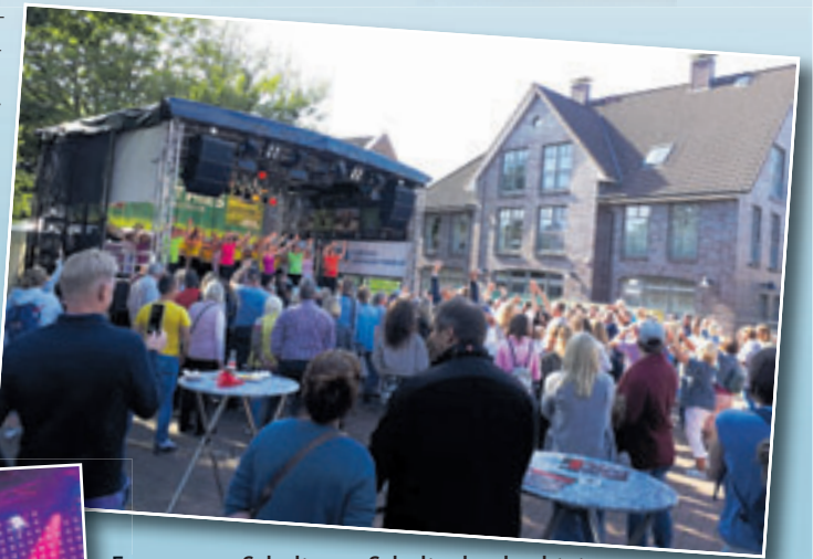
Eng an eng, Schulter an Schulter beobachtet mandas Bühnengeschehen

tert AUREL feat. Gerdfather mit seinen modernen Interpretationen traditioneller Seemannslieder. Samstagabend kann man sich auf eine One-Man-Show im Orchestersound freuen: Wayne Morris, ein Mann, der viele „Saiten“ hat und diese auch spielen kann. Danach rocken Hitfield zum ersten Mal das Dorffest. Die sechs Musiker bringen mit den größten Rock-Hits und dem Besten aus den Charts jedes Publikum in Wallung. Fette Disco-Beats gibt es wie immer auf dem Partyreal vom Team 412.