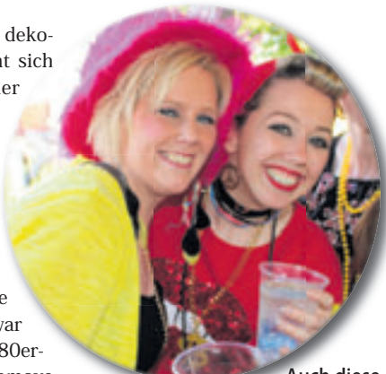
Auch diese zwei gut gelaunten jungen Damen feierten kräftig mit

■ (pm) Harburg. Eine bunt dekorierte Truck-Karawane bahnt sich heute, 10. September, wieder ihren Weg durch den Harburger Binnenhafen. Nach zwei Jahren pandemiebedingter Zwangspause kann wieder durchgestartet werden. Bunte und schrille Outfits, Schlaghosen und Rüschenhemden, Discoanzüge und viel gute Laune – das war die Disco-Ära der 70er- und 80er-Jahre. Bei dem letzten Discomove vor Corona hat all das ein furioses Comeback gefeiert. Bereits am Nachmittag waren über 20.000 Besucher dabei. Bis zum Abend wurden es noch mehr. Knapp 30.000 Teilnehmer wurden am Ende gezählt. Tausende Besucher tanzten beim Discomove unter freiem Himmel zu den