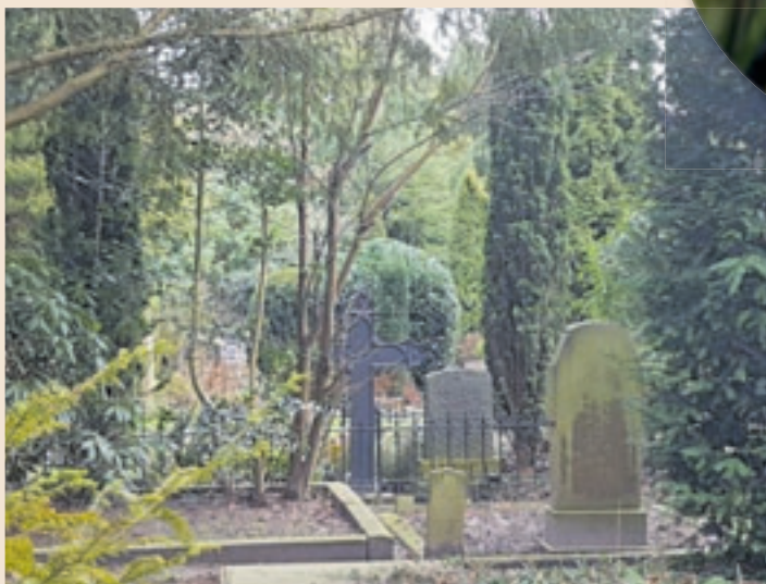
Am 17. und 18. September 2022 laden viele Städte zu Mitmachaktionen rund um und auf dem Friedhof ein

Effizienz, Flexibilität und Mobilität – Wörter, die unsere aktuelle Zeit und Gesellschaft beschreiben.