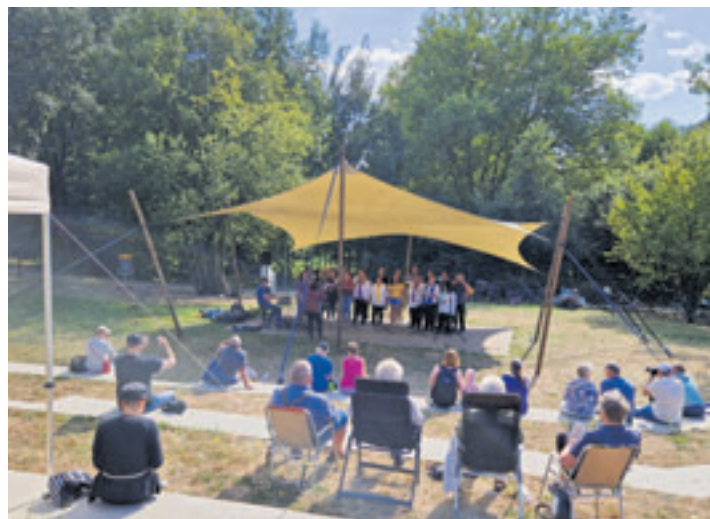
„Inseldeerns“ und „Kanal & Lieder“ gemeinsam auf der Freilichtbühne im Inselpark.

zum Beispiel vor der Rindermarkthalle der Fall war. Insofern sag ich, lässt es uns nächstes Jahr einfach genauso wieder machen!“, forderte er die Anwesenden auf und erntete dafür großen Beifall. Eine Fortsetzung des Projekts liegt im Rahmen des Möglichen, und bei Vernetzungsgesprächen zwischen den Organisationen wurden bereits einige Ideen geäußert, die gemeinsam weiterentwickelt werden sollen. „aufatmen! – Hamburg singt und spielt“ fand erstmals 2021 statt und war ein voller Erfolg. Über 90 verschiedene Chöre, Vocal Groups, Instrumentalensembles und Schauspielgruppen mit über 1500 Beteiligten brachten alle sieben Bezirke der Stadt zum Klingen und Spielen, um zu zeigen, dass die Amateurkulturszene der Stadt auch nach der langen Pandemiepause noch quicklebendig ist!