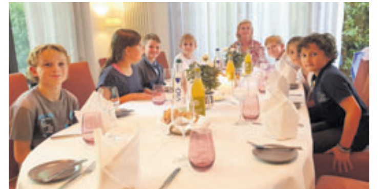
Der Kurs-Abschluss wurde mit einem Menü und anschließender Führung im Hotel beendet

Die Schüler erhielten ihre Urkunde über die Teilnahme noch im Hotel. Die Freude und Begeisterungsfähigkeit war auch für das Servicepersonal sichtlich überraschend.