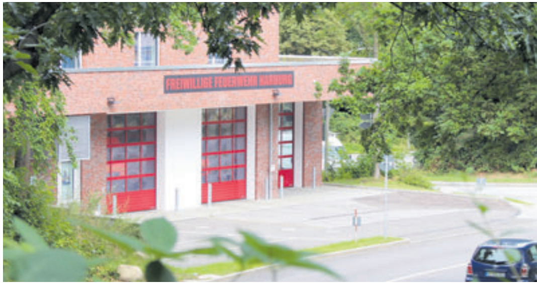
Die Einweihung der neuen Wache der FF Harburg ließ coronabedingt lange auf sich warten

Stadt dar, sondern agiert stadtweit. Diese Wache würdigt das Engagement der hier arbeitenden Freiwilligen Feuerwehrfrauen- und männer.