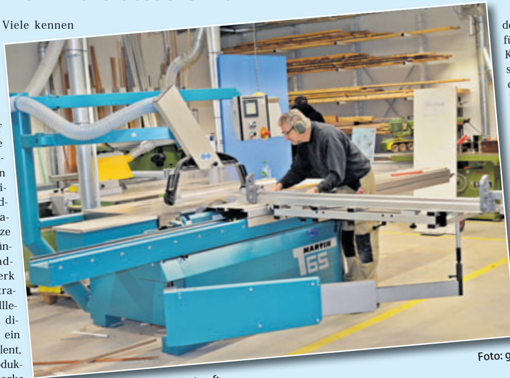
Ohne Handwerk gibt es keine Zukunft

den Satz „Handwerk hat goldenen Boden“. Aber was genau bewegt jemanden heute noch dazu, einen Handwerksberuf auszuführen? Viele Menschen entscheiden sich eher für ein Studium als für einen Job in der Handwerkerbranche. Dabei gibt es eine ganze Reihe von guten Gründen für das Handwerk. Das Handwerk ist der ideale Kontrapunkt in der schnelllebigen, bunten und digitalen Welt. Es ist ein ganz besonderes Talent, aus rohen Grundprodukten wahre Kunstwerke zu kreieren. Wie lässt sich der Reiz am Handwerk verdeutlichen? Wie finde ich „meinen“ passenden Ausbildungsberuf? Was sollte ich im Handwerk beachten? Die generelle Herausforderung ist, für die Zukunft noch genügend Fachkräfte zu haben. Wenn die