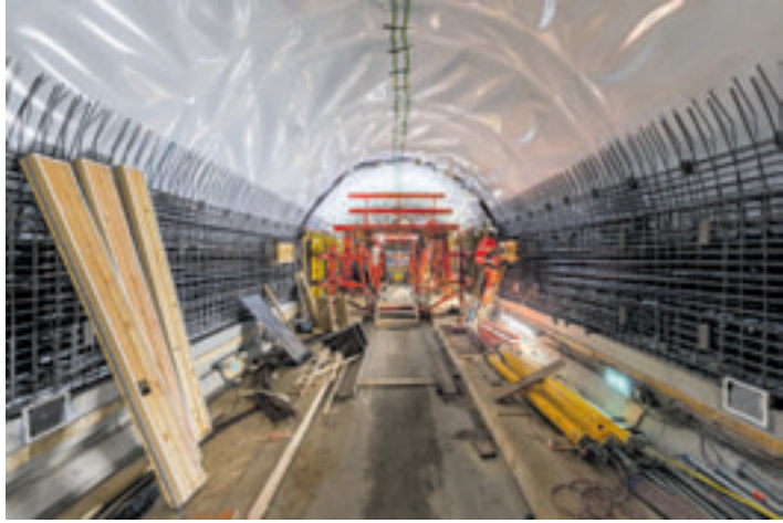
Der Alte Elbtunnel während der Sanierungsarbeiten

legender Sanierung wieder eröffnet. Im Zuge der Arbeiten hatte die Hamburg Port Authority (HPA) die komplette so genannte Tübbing-Konstruktion freigelegt und mehr als 200.000 Niete auf Dichtigkeit überprüft. Zudem wurden in en-