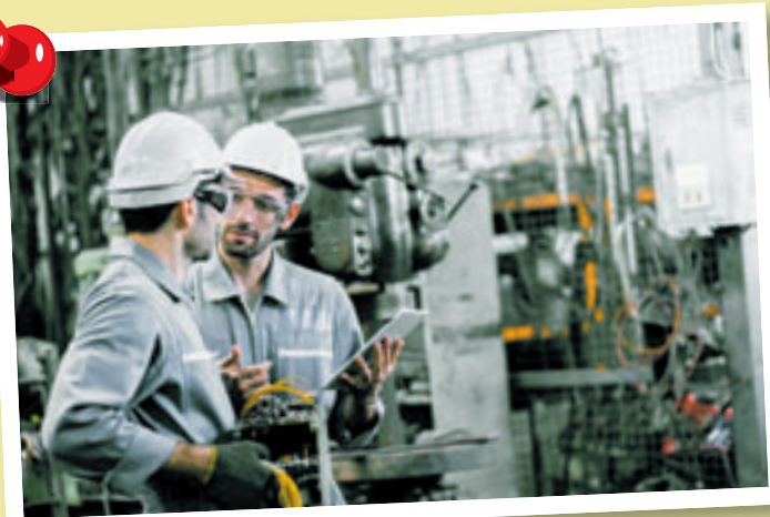
Während der Prozessabläufe überwachen unsere Azubis die Temperaturen, regeln die Materialzufuhr und entnehmen Proben des Schmelzguts, die sie zur Analyse weiterleiten.

■ (Speira) Hamburg. Verfahrenstechnologen und -technologininnen Metall der Fachrichtung Nichteisenmetallurgie produzieren bei uns das Metall der Zukunft. Genauer gesagt begleiten sie den kompletten Prozess in unserem Hamburger Standort in Finkenwerder. Hier entsteht unser Aluminium. Dazu steuern und regeln sie unsere größtenteils automatisierten und computergesteuerten Anlagen. Unser Aluminium besteht zu einem Teil aus recyceltem Material, das bei ungefähr 660 Grad Celsius flüssig wird. Wem also hohe Temperaturen nichts ausmachen, der ist bei uns genau richtig. Während der Prozessabläufe überwachen unsere Azubis die Temperaturen, regeln die Materialzufuhr und entnehmen Proben des Schmelzguts, die sie zur Analyse weiterleiten. Anhand dieser Analysen sind sie in der Lage, die Qualität zu beurteilen und entsprechende Zusatz-