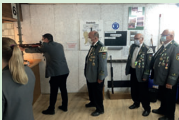
Während der Pandemie musste auch am Schießstand Maske getragen werden