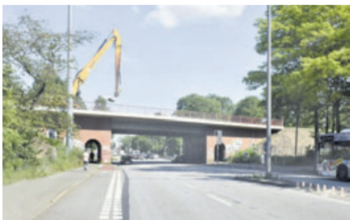
Mit dem Abriss der Brücke muss aus technischen Gründen noch ein paar Tage gewartet werden

Die Umleitung des Verkehrs einschließlich des Öffentlichen Nahverkehrs erfolgt in diesem Zeitraum über die ehemaligen Zu- und Abfahrten der Alttrasse der Wilhelmsburger Reichsstraße. Betroffen von den Maßnahmen ist der Abschnitt der Mengestraße zwischen Dratelnstraße und Georg-Wilhelm-Straße.