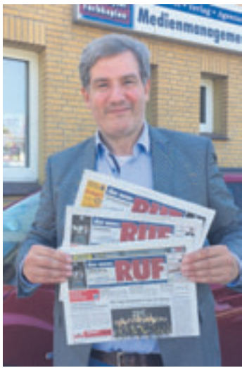
Der SPD-Bundestagsabgeordnete Metin Hakverdi stand Rede und Antwort

bahnhof krisenfest gemacht wird. Beispielsweise könne der Hauptbahnhof kaum die im Rahmen eines Schienenersatzverkehrs eingesetzten Busse aus Wilhelmsburg aufnehmen. „Wir brauchen für den Notfall durchgängige Busspuren zur S-Bahn in Neugraben, Harburg und Wilhelmsburg, die dann zum Hauptbahnhof führen. Wir brauchen das beste Schienenersatzverkehrskonzept der Stadt“, fordert Hakverdi. Wenn man will, dass immer mehr Menschen die öffentlichen Verkehrsmittel benutzen sollen, dann müsse man dafür sorgen, dass es funktioniert, zeigt sich der SPD-Politiker entschlossen.