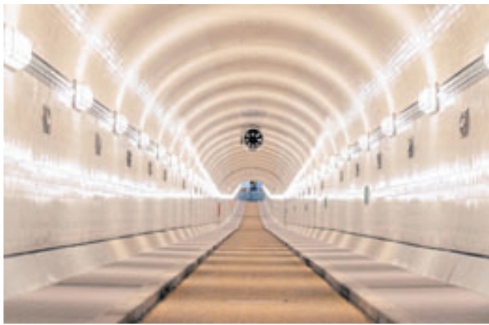
Die Oströhre in einem verkehrsfreien Moment

ger Absprache mit dem Denkmalschutz die Wandfliesen, Fahrbahn und die Beleuchtung nach historischem Vorbild erneuert bzw. restauriert. Gleichzeitig wurde die Tunnelröhre mit modernster Technik ausgestattet – von Rauchmeldern über Lautsprecher bis hin zu einem automatischen Zählsystem