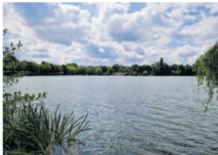
Um die Entwicklung und Pflege artenreicher Waldlichtungsflure im Harburger Stadtpark zu gewährleisten, sollen u.a. im Schulgarten lückige Gehölzbestände durch Auslichtung der vorhandenen Gehölzbestände und Initialsaat einer blühenden Wildkrautmischung in ihren Urzustand zurückversetzt werden