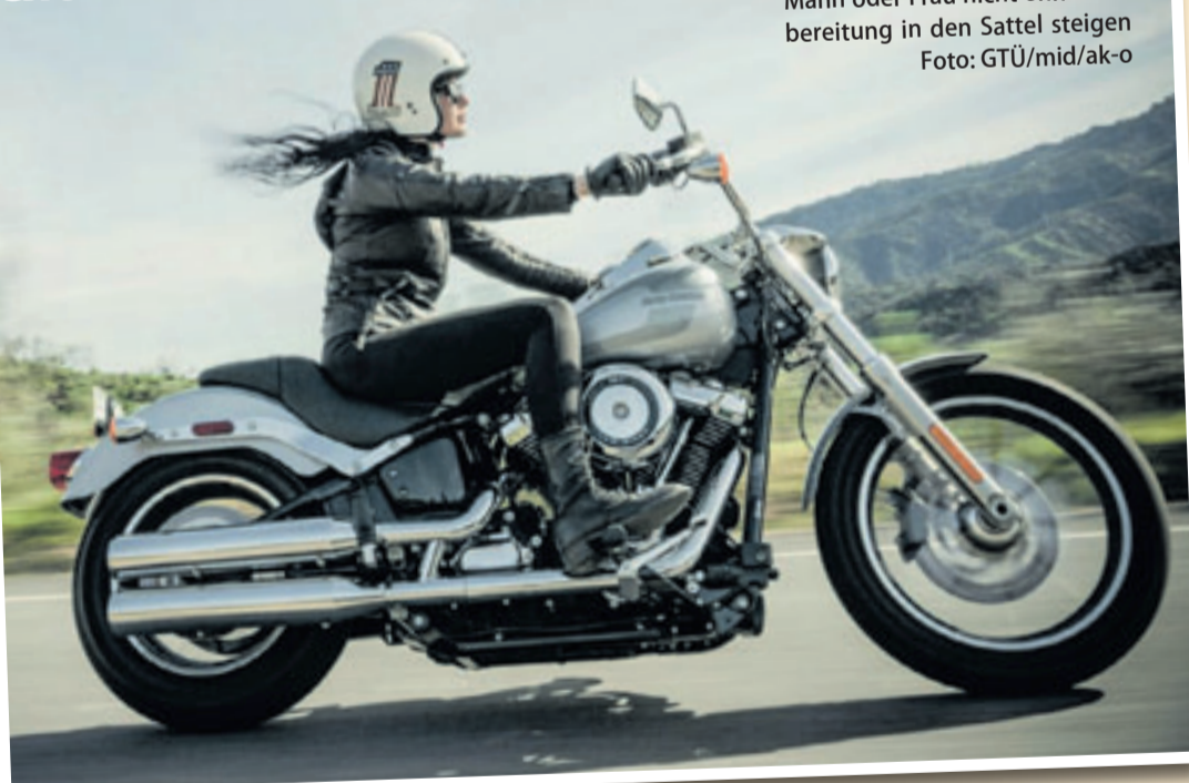
Nach der Winterpause sollte Mann oder Frau nicht ohne Vorbereitung in den Sattel steigen

■ (mid/ak-o). Der Frühling bringt Sonne und wärmere Temperaturen. Das ist für viele Zweiradliebhaber das Startsignal zum Aufbruch in die neue Saison. Allerdings sollte man nach der Winterpause nicht ohne Vorbereitung in den Sattel steigen. Die Tage vor der ersten Ausfahrt sind optimal geeignet für eine gründliche Fahrzeugwartung. An deren Anfang steht die Reinigung vom Winterstaub. Wer im Herbst sein Fahrzeug gründlich gereinigt und für einen geschützten Abstellort gesorgt hat, profitiert nun von einem guten Grundzustand. Ab in die Werkstatt zum großen Service? Das kann insbesondere für angetriebene Zweiräder sinnvoll sein, also Motorrad und E-Bike. Dabei wird geprüft, dass sämtliche Komponenten intakt sind und alle Funktionen zur Verfügung stehen. Auch Verschleißteile werden kontrolliert und bei Bedarf ausgetauscht. Ob Zweirad mit oder ohne Motor: Wichtig ist eine rechtzeitige Terminvereinbarung – denn im Frühling ist die Nachfrage nach Wartungen groß. Auch wer noch im Spätherbst oder Winter sein Zweirad technisch umfassend in Schuss gebracht hat, nimmt vor der ersten Ausfahrt eine Kontrolle wichtiger Komponenten vor: Ist der Reifendruck in Ordnung? Funktionieren Licht und Brem-