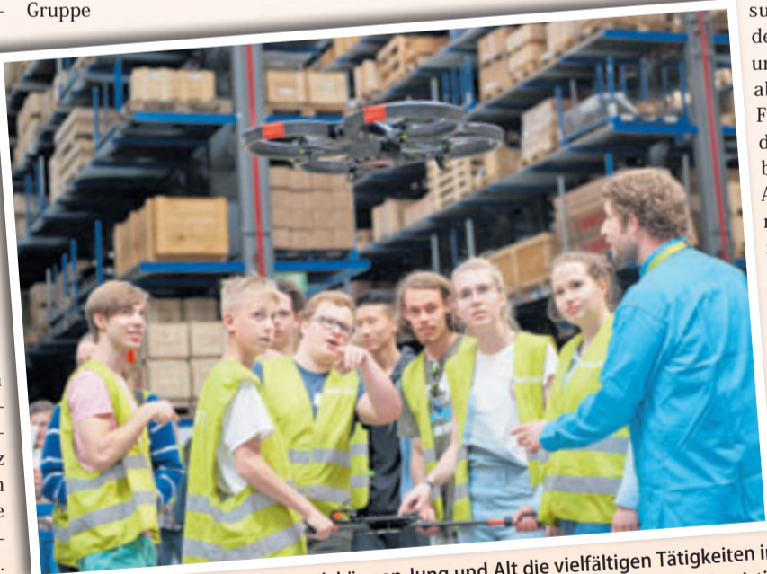
Am europaweiten Tag der Logistik können Jung und Alt die vielfältigen Tätigkeiten in der Logistik hautnah erleben

Mit mehr als 3,3 Mio. Arbeitskräften und einem Umsatz von über