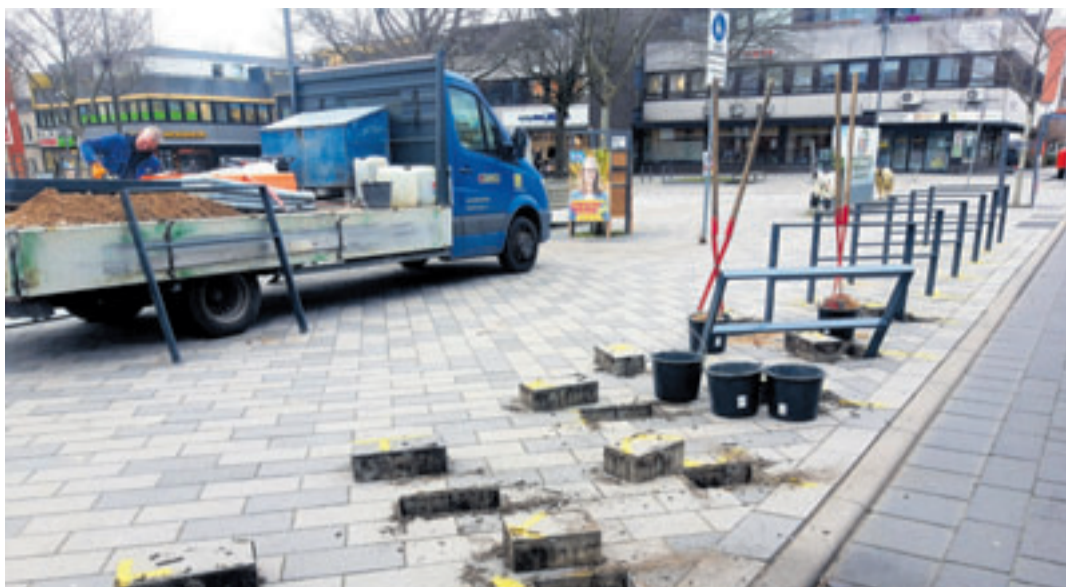
Im Neugrabener Zentrum wurden bereits neue Fahrradständer installiert

Zur Standortauswahl hatte die grüne Bezirksfraktion sich daher im letzten Jahr für eine digitale Beteiligung der