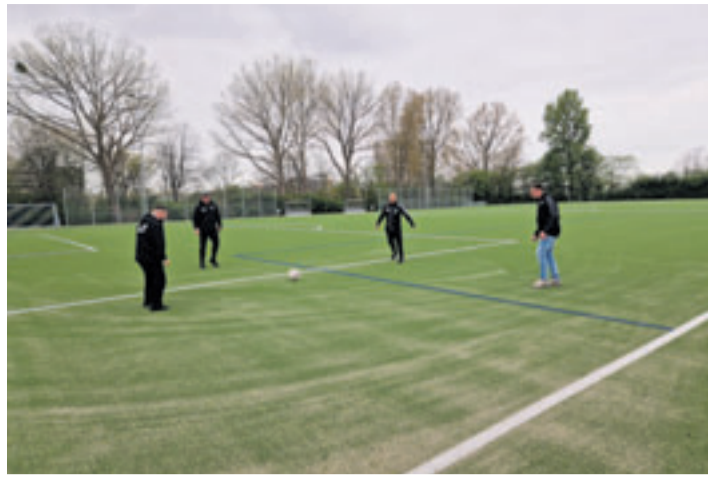
Eine kleine Trainingseinheit auf dem neuen Kunstrasenplatz direkt nach der Einweihung. Die Spieler sind sich einig: Es spielt sich super!

„Den heutigen Tag hat die Finkenwerder Fußballwelt lange herbeigesehnt: Durch die großzügige Unterstützung der Hamburgischen Bürgerschaft, der Bezirksversammlung Hamburg-Mitte und des Beirates Bezirklicher Sportstättenbau bekommt Finkenwerder ‚außer der Reihe‘ einen Kunstrasenplatz. Nach den gängigen Kriterien hätten wir wohl noch viele Jahre darauf warten müssen, deshalb bin ich für diese Unterstützung besonders dankbar. Der neue, moderne Platz trotz jeder