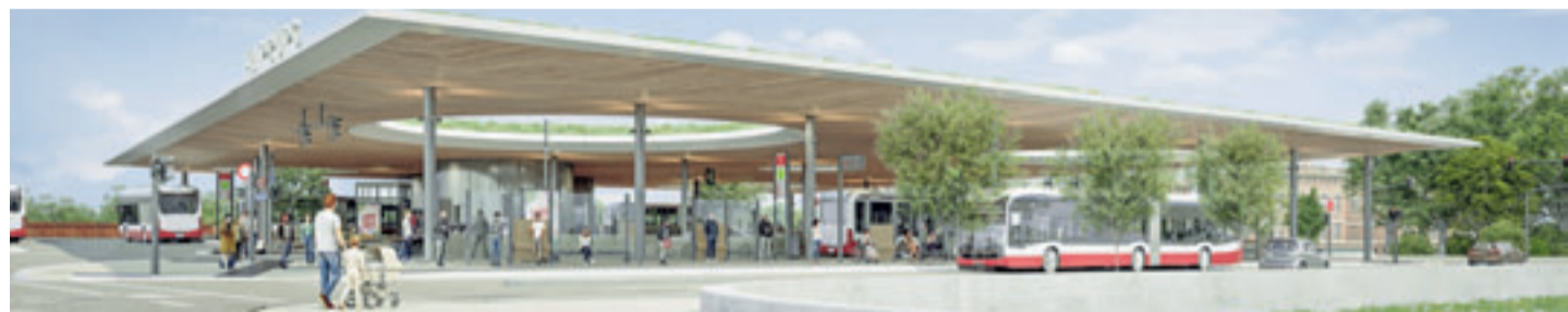
Wenn es keine weiteren Verzögerungen gibt, soll die neue Busanlage im Sommer 2026 in Betrieb genommen werden Visualisierung: HOCHBAHN

Behelfsbrücken für die A26-Ost in Wilhelmsburg die S-Bahn mehrere Wochen gesperrt wird. „Ein Verkehrskonzept für S-Bahn-Sperrung ab August 2025 wird derzeit erarbeitet“, heißt es dazu von der HOCHBAHN. Wenn es nun keine weiteren Verzögerungen gibt, plant die HOCHBAHN, dass die neue Anlage im Sommer 2026 in Betrieb geht. „Die Planungen hier waren sehr aufwendig, auch weil die Abstimmung mit vielen Beteiligten Zeit in Anspruch nimmt. Wir sind sehr froh, dass wir nun mit dem Projekt starten können. Hier entsteht ein sehr attraktives Gesamtensemble, was nicht nur über hohe Leistungsfähigkeit verfügen, sondern auch ein Aushängeschild für eine moderne Mobilität in Harburg sein wird“, erklärt Jens-Günter Lang, Technik-Vorstand der HOCHBAHN.