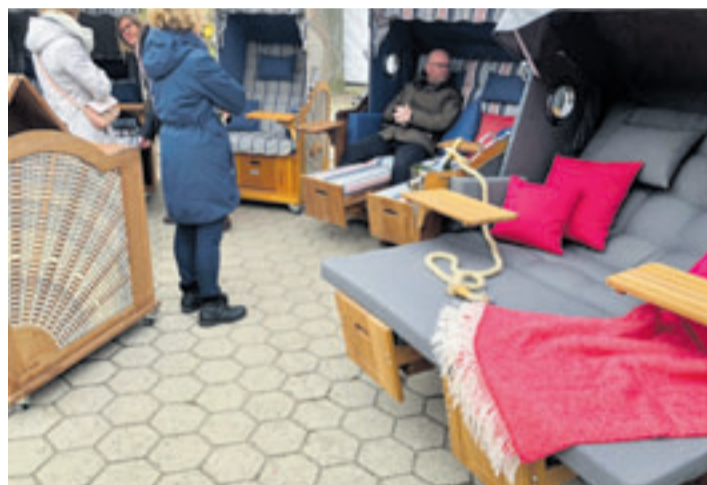
Auch Strandkörbe gehören zum Sortiment auf „Hof Sudermühlen“

der „Woll-Friesen“. Außergewöhnliche, ansprechende Kunst ist vertreten und vieles mehr.