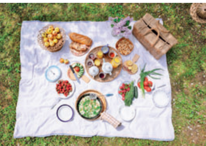
Passend zum Auftakt in die Outdoor-Saison dreht sich bei dem nächsten Kochworkshop alles rund ums Thema Picknick und Grillen ohne Fleisch

■ (mk) Neugraben. Auch 2024 bietet Neugraben fairändern wieder seine beliebten Kochworkshops an. Passend zum Auftakt in die Outdoor-Saison dreht sich bei dem nächsten Kochworkshop alles rund ums Thema Picknick und Grillen ohne Fleisch: Neben vielen Rezeptideen mit frisch zubereiteten Zutaten, wie beispielsweise vegane Cevapcici oder knusprige Quinoa-Bratlinge, leckere Dips und süße Spieße mit veganen Brownies, werden ebenfalls Tipps und Ideen gegeben, wie sich beim Picknick Müll vermeiden lässt. Am Ende des Abends werden die Gerichte in gemütlicher Runde gemeinsam genossen. Und bestimmt heißt es auch dieses Mal wieder, dass auch ohne Fleisch der Genuss nicht zu kurz kommt! Die Anmeldung ist möglich per E-Mail an kochen@neugraben-fairaendern.de oder telefonisch unter 040 18078510. Die Plätze sind begrenzt und erfahrungsgemäß rasch vergeben! Der genaue Veranstaltungsort im Hausbruch wird nach Anmeldung bekanntgegeben. Die Kosten liegen bei 20 Euro. Yvonne Grimault, Elke Wiesner und Gina Laubstein freuen sich darauf, mit den Teilnehmern gemeinsam die Grill- und Picknick-Saison einzuläuten.