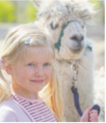
Wie wäre es mit einem Alpaka-Spaziergang im Wildpark Schwarze Berge? Fotos: ein

Das Frühlingsfest beginnt um 11 Uhr und ist kostenlos, es fällt lediglich der Wildpark-Eintritt an. Alle Infos und das Programm auf www.wildpark-schwarze-berge.de .