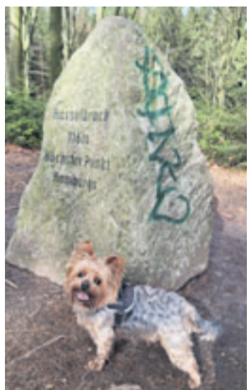
Hund Struppi vor dem beschmierten Gipfelstein Hasselbrack in der Fischbeker Heide