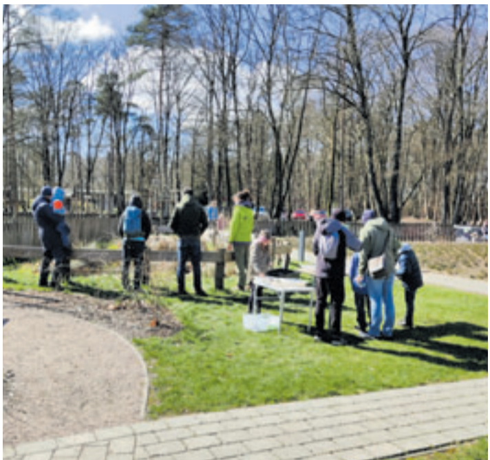
Am 14. April 2024 von 12 bis 16 Uhr lädt die Loki Schmidt Stiftung zum Start in den Frühling zu einem bunten Programm rund um das Heidehaus ein

■ (mk) Fischbek. Am 14. April von 12 bis 16 Uhr lädt die Loki Schmidt Stiftung zum Start in den Frühling zu einem bunten Programm rund um das Heidehaus ein. Für Familien gibt es verschiedene Mitmachangebote. Im Garten sind verschiedene Kunstwerke von „GriMis Kunstpfad“ zu entdecken. Die Rückkehr der Frösche und Kröten kann sowohl am Teich des Heidehauses als auch auf einer Führung zum Kuhteich beobachtet werden. Für Erwachsene wird zudem eine Naturerlebnisführung in die frühlingshafte Heide angeboten. Als besonderes Highlight stellt sich, in diesem Jahr neu, die Höpen Schäferei mit ihren Heidschnucken vor und bietet Einblicke in die Schaf-