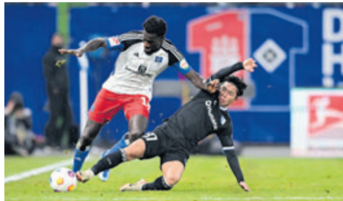
Am 14. April um 13.30 Uhr müssen die Rothosen auswärts beim 1. FC Magdeburg ran