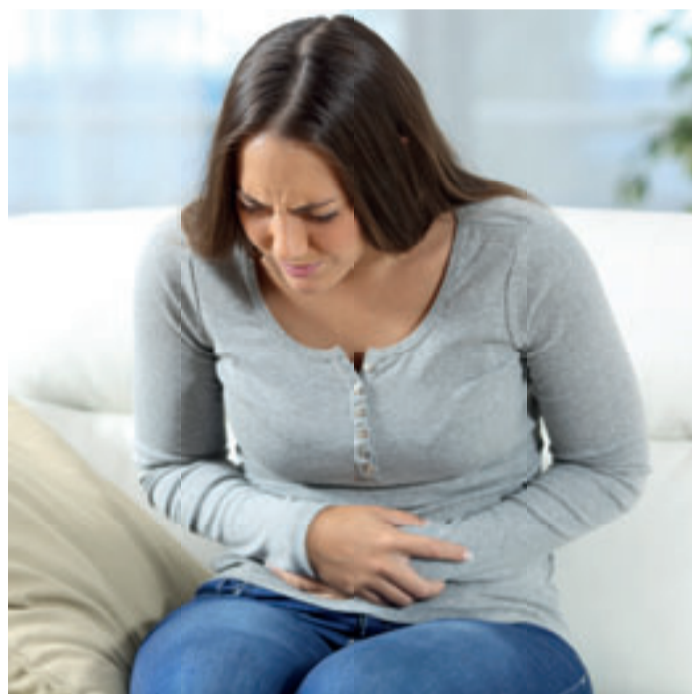
Wiederkehrende Darmbeschwerden wie Durchfall, Bauchschmerzen und Blähungen können die Lebensqualität Betroffener stark einschränken.

Interessierte Leser können jetzt von einem besonderen Angebot des Herstellers profitieren. Mit dem Code Tagebuch erhalten Kunden im Kijimea Onlineshop beim Kauf einer 28er- oder 84er-Packung Kijimea Reizdarm PRO ein exklusives Reizdarm-Tagebuch gratis dazu! Dieser Code ist bis zum 22.04.2024 gültig und einzulösen unter www.kijimea.de . Nur solange der Vorrat reicht.