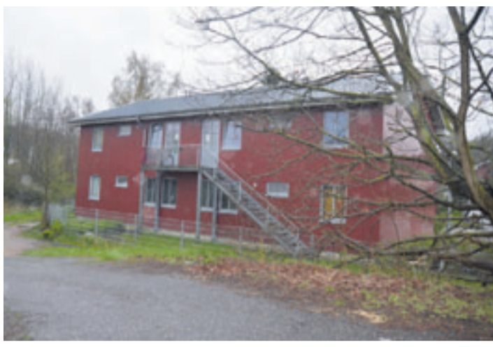
Die AfD lehnt die weitere Benutzung der Unterkunft Am Radeland zur Unterbringung von Migranten ab