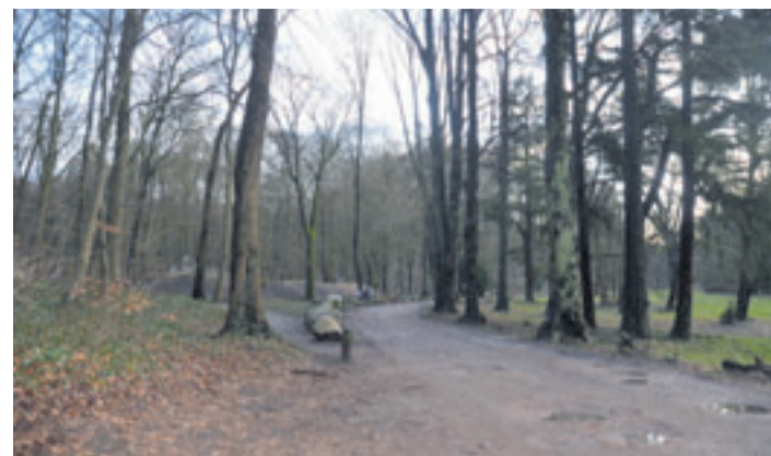
In Meyers Park schlägt die BUKEA vor allem den Schutz der Buchenwälder mittels Ausweisung von drei Bereichen, die mindestens 30 Meter von öffentlichen Wegen entfernt liegen, vor

Meyers Park: In diesem Areal schlägt die BUKEA vor allem den Schutz der Buchenwälder mittels Ausweisung von drei Bereichen, die mindestens 30 Meter von öffentlichen Wegen entfernt liegen, vor. Parkanlage Rönneburg: Für die zur Hälfte noch im Privatbesitz befindliche Anlage sei vorgesehen, dass Teile des Wittheckgrabens wieder als vollkommen offenes Fließgewässer hergestellt wird. Dafür müssten auch aufgestaute Teiche auf mehreren Grundstücken abgelassen werden. Durch den Rückbau der Stauteiche würden Amphibienlaichgewässer verloren gehen, wodurch ein Ersatzlebensraum benötigt wird. Auf der Fläche des Stauteichs können durch eine entsprechende Modellierung in dem nassen Gelände zwei neue, durch Sickerwasser gespeiste Waldtümpel entstehen, ohne dass der parallel verlaufende Bach unterbrochen wird. Um diese Maßnahmen durchzuführen, wäre die Be-