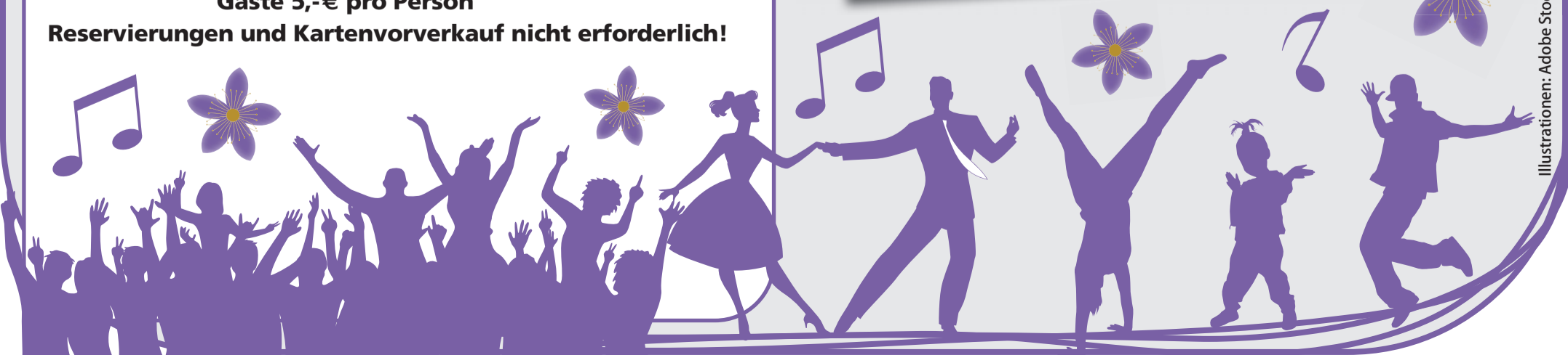
Illustrationen: Adobe Stock