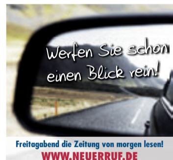
Werfen Sie schon einen Blick rein! Freitagabend die Zeitung von morgen lesen! WWW.NEUERRUF.DE

+ Eißendorfer Straße 72 a + 21073 Hamburg + www.kirste-bestattungen.de