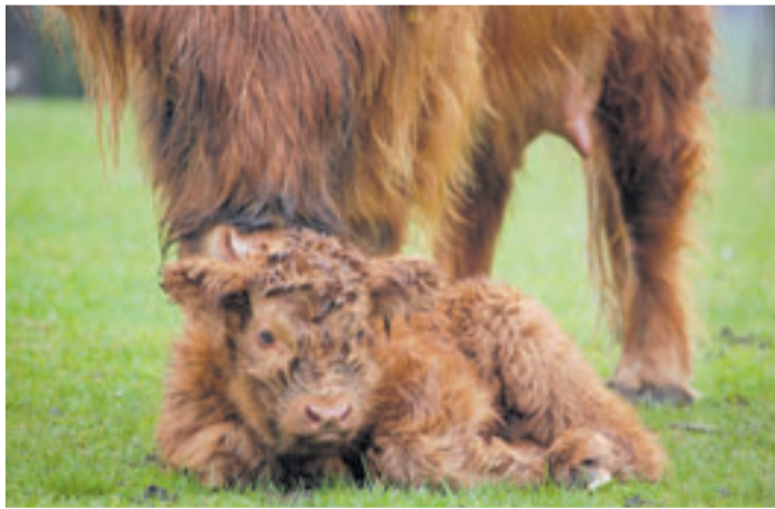
Viele süße Jungtiere freuen sich auf den Frühling und auf Besucher

Beim Frühlingsfest ist für alle etwas dabei: Die Kinder können sich auf dem Gelände rund um den Elbblickturm, auf den Strohhallen, den Hüpfburgen oder beim Seilklettern nach Herzenslust austoben. Beim Bogenschießen oder beim Wildpark-Jenga kommen auch Erwachsene auf ihre Kosten. Wer nach so viel Action eine Verschnaufpause braucht, kann eine Runde mit der Wildpark-Bahn drehen, in der Kunsthandwerkerhalle basteln oder die vielen süßen Jungtiere bestaunen. „Wir haben ein tol-