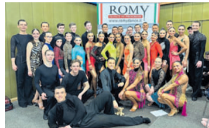
Gruppenfoto der erfolgreichen Paare von Blau-Weiss Buchholz beim Tanzturnier um das „Blaue Band der Spree“ in Berlin