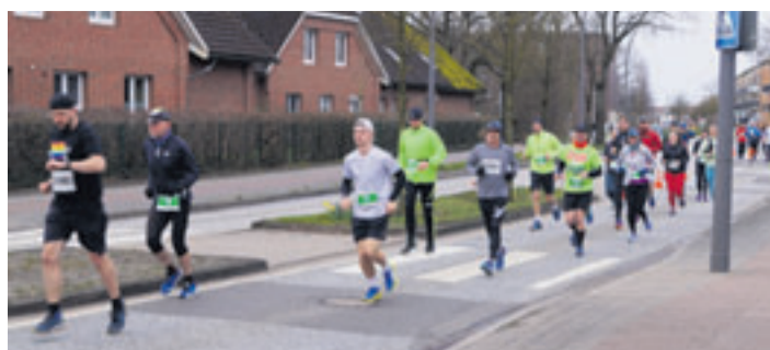
Beim Hamburger Halbmarathon 2023 liefen die Teilnehmer kurz nach dem Start auf der Neuwiedenthaler Straße

■ (mk) Süderelbe. Am 21. April findet wieder der Hamburger Halbmarathon durch das Alte Land statt. Das traditionsreiche Event der Hausbruch-Neugraber Turnerschaft (HNT) gehört seit Jahren zum festen Programm vieler Hobbyläufer. Die Strecke führt von der CU-Arena in Neugraben bis nach Neuenfelde und wieder zurück. Dadurch kommt es am 21. April vormittags zu einigen Verkehrseinschränkungen. Nach dem Startschuss um 10 Uhr auf der Straße „Am Johannisland“ vor dem BGZ Süderelbe führt die Laufstrecke über den Torfstecherweg, Neuwiedenthaler Straße, Francoper Straße, Hinterdeich,