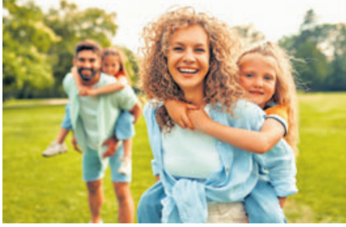
Trotz Neurodermitis unbeschwert durch den Alltag? Eine Therapie mit regulierenden Darmbakterien kann dazu beitragen, Neurodermitis-Beschwerden von innen zu lindern

■ (mk) Lohnweiler. Die Haut juckt, ist gerötet, entzündet sich und nässt – klassische Symptome von Neurodermitis! Die Hautkrankheit tritt meist im Säuglings- oder Kindesalter auf. Therapiemethoden unter Einsatz von Kortison sind häufig unverzichtbar, können dauerhaft aber Nachteile haben. Um Neurodermitis-Beschwerden von innen zu lindern, verweisen viele Hautärzte inzwischen auf regulierende Darmbakterien in ausgewählten Probiotika. Fast jedes vierte Baby und jedes 12. Kind im Schulalter leidet unter Neurodermitis. Bei den Betroffenen kann die Hautbarriere ihre Schutzfunktion erblich bedingt nicht ausreichend wahrnehmen und erleichtert das Eindringen von Reizstoffen. Zusätzlich reagiert das Immunsystem auf eigentlich harmlose Reize mit einer überschießenden Reaktion auf der Haut. Besonders gefürchtet: Sogenannte Superinfektionen mit Bakterien, Viren oder Pilzen, die zu weiteren Komplikationen führen können.