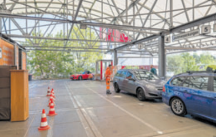
Der Recyclinghof am Rondenburg ist einer von dreien in ganz Hamburg, der am 20. April geöffnet hat

■ (sl) Hamburg. Am Samstag, 20. April, findet bei der Stadtreinigung Hamburg (SRH) eine Personalversammlung statt. Daher sind sowohl der Energieberg Georgswerder als auch die meisten Recyclinghöfe an diesem Tag geschlossen. Nur die Höfe Lieblingstraße 66 in Billbrook, Rondenburg 52a in Bahrenfeld und Volksdorfer Weg 196 in Sasel haben von 8 bis 14 Uhr geöffnet. „Das an diesem Tag vermutlich starken Andrang auf diesen Recyclinghöfen geben wird, bittet die SRH ihre Kunden, ihre Wertstoffe und Abfälle soweit möglich an einem anderen Tag auf den Recyclinghöfen abzugeben. Am besten geeignet sind die Tage Dienstag bis Donnerstag“, sagt Pressesprecherin Anna-Maria Jeske. Die SRH bittet um Verständnis für den eingeschränkten Service an diesem Tag. Alle Infos auch unter www.stadtreinigung.hamburg.