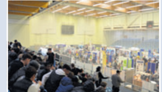
Ungewohntes Szenario: Auf den Rängen und dem Spielfeld der CU Arena drehte sich 2023 alles um die Süderelbe Jobmesse

Das Angebot ist extrem breit gefächert. Es ist ebenfalls ideal für junge Menschen, die bald ihrem Schulabschluss entgegen sehen, aber auch für Studenten, für Leute, welche sich einfach informieren bzw. orientieren möchten, die ihren Beruf wechseln wollen und selbst für Menschen, die nur einen Nebenjob suchen. An die 100 Unternehmen und Organisationen präsentieren sich. Das geht von Airbus und Aurubis über das Deutsche Rote Kreuz, der Handwerkskammer und dem Jobcenter bis hin zu Zajadacz und dem Zoll. Die Jobmesse Süderelbe wird ausschließlich von ehrenamtlich tätigen Menschen aus dem Umfeld des TV Fischbek durchgeführt und - in erster Linie - von Förderern und Spendern finanziert. Für die Veranstaltung gab es in den vergangenen Jahren viele Auszeichnungen, wie etwa den Großen Stern des Sports in Gold und den Mercedes-Benz Integrationspreis. Seien Sie dabei und besuchen Sie die Jobmesse Süderelbe. Der Eintritt ist natürlich frei.