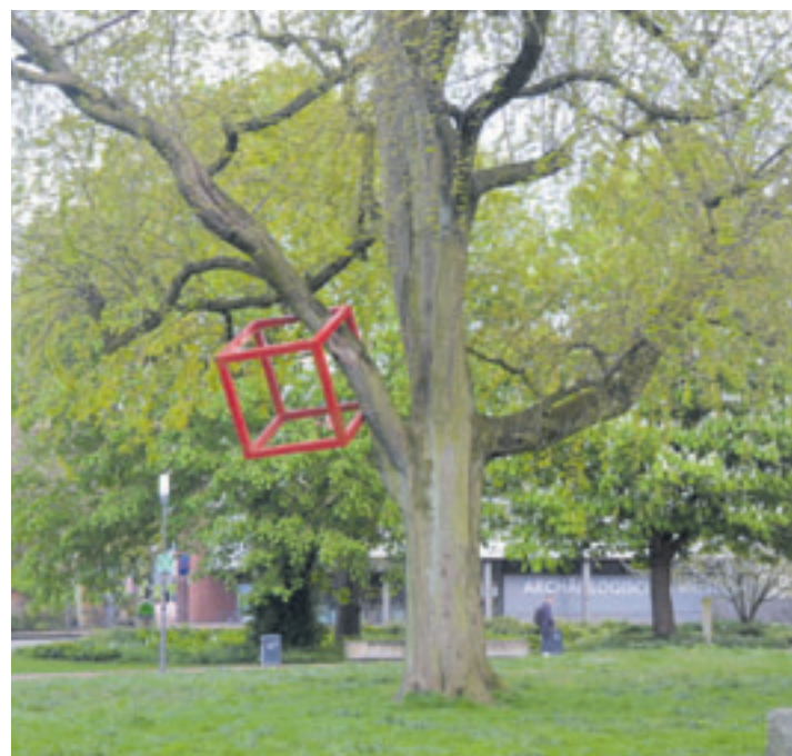
Die CDU möchte, dass das hängende Kunstwerk in den Besitz des Bezirkes übergeht.

Ein von ihm eingebrachter Antrag bittet den Vorsitzenden der Bezirksversammlung, sich mit dem Künstler Hans-Dieter Schrader in Verbindung zu setzen, um abzuklären, zu welchen Bedingungen das auf der Krokuswiese angebrachte Kunstwerk endgültig dem Bezirk überlassen und zur Erweiterung des Kunstpfades einbezogen werden könnte.