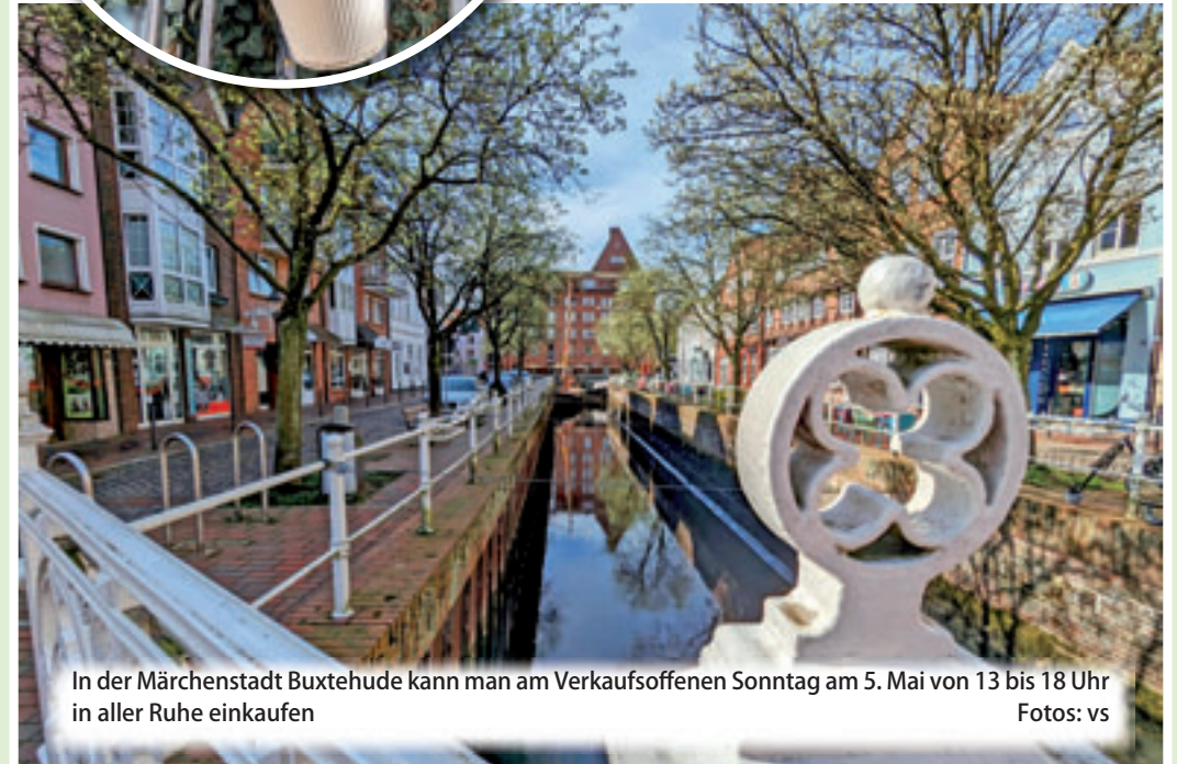
In der Märchenstadt Buxtehude kann man am Verkaufsoffenen Sonntag am 5. Mai von 13 bis 18 Uhr in aller Ruhe einkaufen