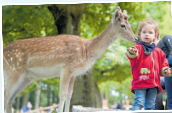
Die Kids können unter anderem das Damwild im Freigehege füttern

■ (mk) Vahrendorf. Das schönste Geschenk ist gemeinsame Zeit – das gilt auch zum Muttertag. Wie wäre es zum Beispiel mit einem ausgiebigen Frühstück im Wildpark-Restaurant? Das reichhaltig gedeckte Frühstücks-Buffer lässt dabei keine Wünsche offen: krosse Brötchen, leckere Käse- und Wurstvariationen, deftiges Rührei mit Speck & Würstchen, Müsli und frisches Obst ... hier ist für jeden etwas dabei. Für nur 21,90 Euro pro Person inkl. Kaffee, Tee und Saft kann am 12. Mai von 8.30 Uhr bis 11 Uhr nach Herzenslust geschlemmt werden. Übrigens: Kinder bis 12 Jahre zahlen nur den halben Buffetpreis. Jetzt schnell sein und ein paar der begehrten Plätze reservieren unter Tel. 040 8197747-40. Gut gestärkt geht es danach weiter durch den Wildpark, um eine große Runde spa-