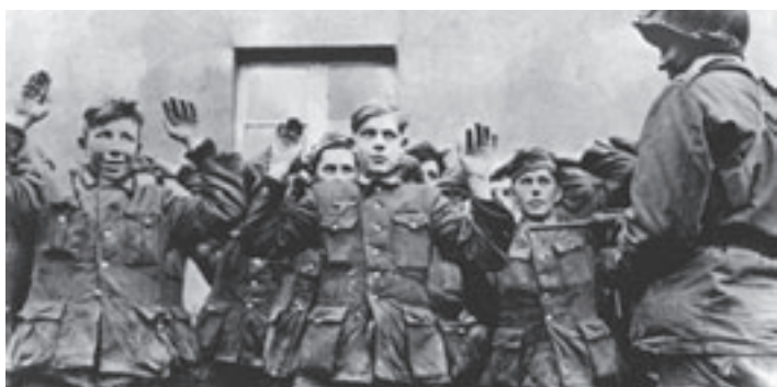
Im Frühjahr 1945 ist der 18-jährige Werner Holt mit einigen Schulkameraden als letztes Aufgebot zur Verteidigung einer deutschen Kleinstadt eingesetzt