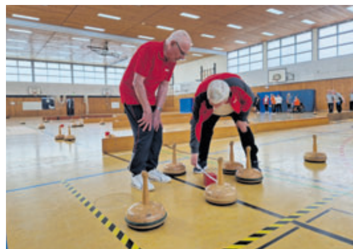
Welche Bosseln liegen näher an der Daube: Hier wird genau nachgemessen

gang, werden die Punkte zusammengezählt. Je näher ein Bossel an der Daube liegt, umso mehr Punkte erhält das Team. Der nächste Bossel erhält zwei Punkte und die anderen jeweils einen Punkt. Liegt der Bossel komplett außerhalb des Zielfelds, erlangt er keine Punkte. Bereits zum dritten Mal hat die BSG ein Bossel-Turnier in Wilhelmsburg organisiert, diesmal mit zehn Mannschaften aus der ganzen Republik. Selber nehmen die Mitglieder der BSG auch an Turnieren teil, darunter sind auch die Deutschen Meisterschaften. Allerdings leidet die Wilhelmsburger Gruppe unter Nachwuchsmangel. Wer sich auch einmal im Bosseln ausprobieren möchte, ist herzlich willkommen. Weitere Informationen gibt es bei Ute Meier von der BSG unter utemeier.bsg@gmail.com .