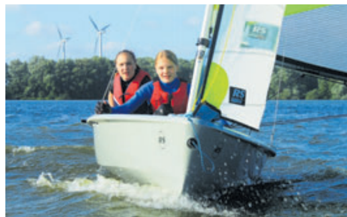
Zwei Jollenseglerinnen der Segelvereinigung Sinstorf beim Segeln auf dem Neuländer See

■ (au) Neuland. Am Sonntag, 5. Mai, von 11 bis 16 Uhr bietet die Segelvereinigung Sinstorf auf dem Neuländer See in Harburg-Neuland ein kostenloses Schnuppersegeln an. Für Kinder ab acht Jahren stehen moderne Jollen zur Verfügung – egal, ob sie nur mal mitfahren oder gleich selber steuern möchten. Die Trainer sind im Motorboot immer in der Nähe.