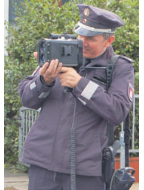
Tagelang waren in Hamburg Polizeibeamte unterwegs, um Verkehrssünder zu erwischen

Besonders gefährlich: Auf der Autobahn A1 in Richtung Süden auf Höhe der Ausfahrt Stillhorn entdeckte die Polizei ein Auto, das bei