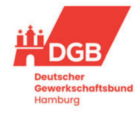
Der Stadtverband Harburg des Deutschen Gewerkschaftsbunds ruft am 1. Mai zur Demo auf Foto: ein

Lohn, mehr Freizeit, mehr Sicherheit‘. Denn das sind die Grundlagen für ein gutes Leben, gerade auch in Zeiten der Krise und des Umbruchs. Dafür kämpfen wir Gewerkschaften. Dafür brauchen wir eine starke Demokratie, die sich auf flächendeckende Tarifverträge und eine starke Mitbestimmung stützen kann.“