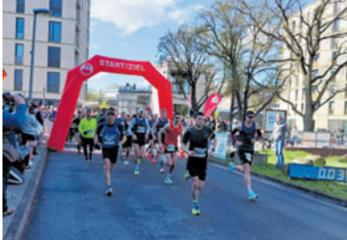
Der Start des Halbmarathons

ger der HNT-Leichtathletik-Abteilung freute sich auch über die Zahl der Läufer: „Die 525 Anmeldungen sind gegenüber dem Frühjahr 2023 eine gute Steigerung. Und das, obwohl wir eine Woche vor dem Marathon Hamburg keinen idealen Zeitpunkt erwischten. Aber das Wetter hat uns heute bestens in die Karten ge-