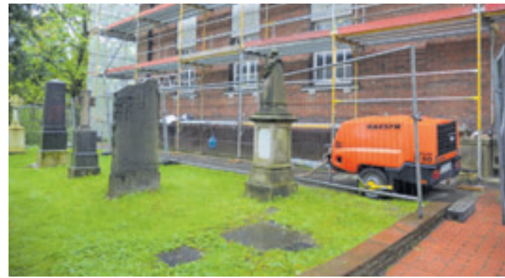
An der Fassade des Kirchenbaus sollen unter anderem marode Ziegel gegen neue ausgetauscht werden

abhalten, was aber sehr ambitioniert sei. Solange die Sanierungsarbeiten laufen, müssten Besucher von Gottesdiensten mit der Thomas-Gemeinde in Hausbruch vorlieb nehmen. Ab Anfang 2025 wolle man auf jeden Fall mit Gottesdiensten und Veranstaltungen fortfahren. Geplant sei eine große Wiedereröffnungsfeier. Außer Gottesdiensten, Hochzeiten und Taufen sollen in der St. Gertrudkirche Konzerte und Lesungen stattfinden. Natürlich wird die Ausstellung über das Dorf Altenwerder wieder einen festen Platz in der Kirche einnehmen. Auch der Altenwerder Klönschnack wird wieder über die Bühne gegen, kündigt Meyer an.