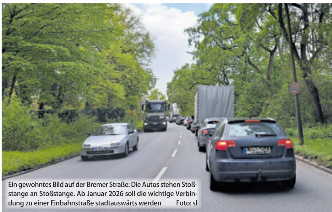
Ein gewohntes Bild auf der Bremer Straße: Die Autos stehen Stoßstange an Stoßstange. Ab Januar 2026 soll die wichtige Verbindung zu einer Einbahnstraße stadtauswärts werden

■ (au) Harburg. Rund 12.000 Stunden haben die Hamburger im Jahr 2023 laut ADAC Staubilanz im Stau gestanden: Stoßstange an Stoßstange, im Schrittempo, immer ein Fuß auf der Kupplung, Geduld war gefragt. Viel Geduld aufbringen müssen in den kommenden Jahren auch die Autofahrer im Hamburger Süden, denn die Bremer Straße soll grundhaft instandgesetzt werden, wie vergangene Woche im Ausschuss Mobilität und Inneres vom zuständigen Landesbetrieb Straßen, Brücken und Gewässer (LSBG) bekanntgegeben wurde. Die ersten Arbeiten sollen bereits im Juni dieses Jahres beginnen. Tiefe Schlaglöcher, schlechte Radwege, etc. – die Bremer Straße ist