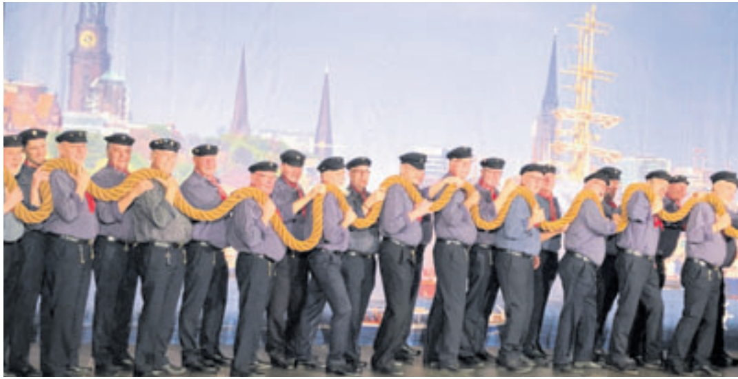
Passend zum Hafengeburtstag treten die Tampentrekker zusammen mit ihren Sangesfreunden aus Österreich im Wilhelmsburger Bürgerhaus auf

posten wird es allerdings in diesem Jahr nicht geben. Dafür gibt es ein Konzert etwas abseits vom großen Trubel. Grund dafür ist, dass der fernsehbekannte Shantychor Gäste aus Österreich hat. Am Samstag, 11. Mai, empfangen die Shanties ihre Sangesfreunde des Partnerchors MGV Ehrenhausen aus der Steiermark, um mit ihnen gemeinsam den Hafengeburtstag zu erleben. Auch dabei sind spontane Gesangseinlagen nicht ausge-