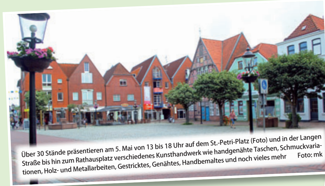
Über 30 Stände präsentieren am 5. Mai von 13 bis 18 Uhr auf dem St.-Petri-Platz (Foto) und in der Langen Straße bis hin zum Rathausplatz verschiedenes Kunsthandwerk wie handgenähte Taschen, Schmuckvariationen, Holz- und Metallarbeiten, Gestricktes, Genähtes, Handbemaltes und noch vieles mehr

Vor diesem Hintergrund macht das relaxte Shoppen in den gut sortierten Geschäften in der Buxtehuder Innenstadt noch mehr Spaß. Bestimmt haben sich die Geschäftsinhaber die eine oder andere Überraschung ausgedacht. Zum Frühling werden in zahlreichen Geschäften sicherlich viele neue Artikel angeboten. Das heißt auch, dass der Kunde das eine oder andere Schnäppchen aus der Winter-Kollektion machen kann. Also nichts wie hin nach Buxtehude vom 3. bis 5. Mai.