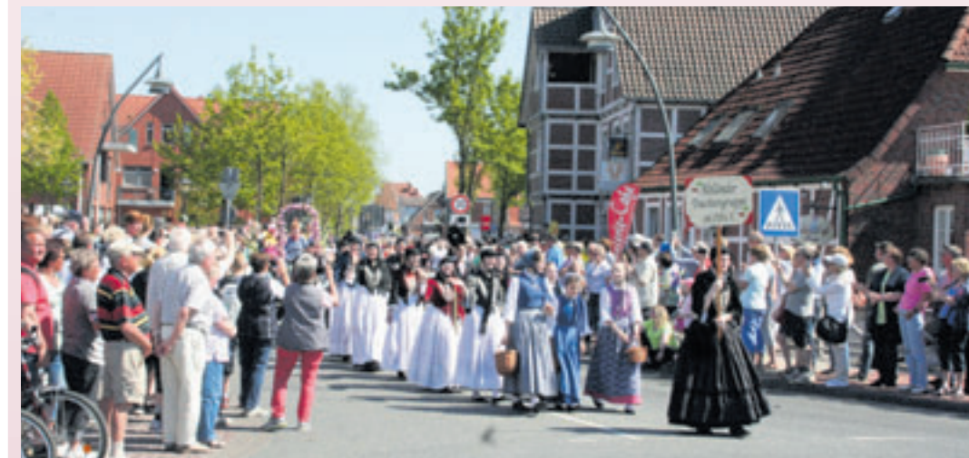
Auch 2024 wird die Altländer Trachtengruppe mit von der Partie sein.

Jung und alt in historischen Uniformen, Trachten oder Kostümen – dies macht unter anderem den Reiz des Blütenfestes Jork aus.