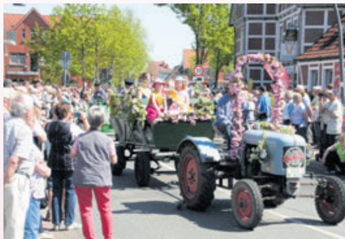
Altgediente Trecker ziehen mitunter die Wagen.

Ausrichter dieser überregional bekannten Großveranstaltung ist die Gemeinde Jork gemeinsam mit der Werbegemeinschaft Jork. Das Altländer Blütenfest verbindet Tradition und Kultur in einem der größten zusammenhängenden Obstanbaugebiete Europas. Seit 1981 krönen die Altländer ihre Blütenkönigin. Ihre Majestät, die Altländer Blütenkönigin, vertritt die Region des Alten Landes bei vielen Anlässen. So