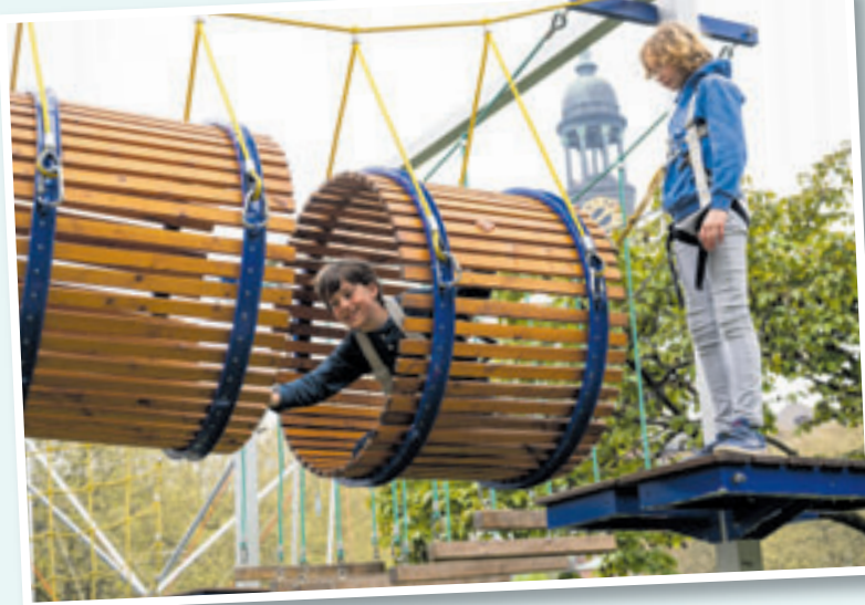
Auf der großen Erlebnisfläche gibt es Spiel und Spaß für Kinder

■ (BWl) Hamburg. Beim Hafengeburtstag Hamburg können kleine Entdecker und neugierige Seefahrer vom 9. bis 12. Mai 2024 in die maritime Welt von gestern und heute eintauchen, Abenteuer erleben, spielen, Neues lernen und sich überraschen lassen. Mutige Kids klettern in die Wanten eines echten Dreimasters, erobern einen Goldschatz und singen Karaoke. Die große Spielfläche mit Bungeetrampolin und Hochseilgarten, die Besuche an Bord von zahlreichen Schiffen und die erlebnisreichen Mitmach-Aktionen lassen Kinderaugen leuchten. Die zahlreichen Open-Ship-Aktionen sind auch bei den jüngeren Gästen des Hafengeburtstag Hamburg sehr beliebt. Für kleine Landratten ist es ein unvergessliches