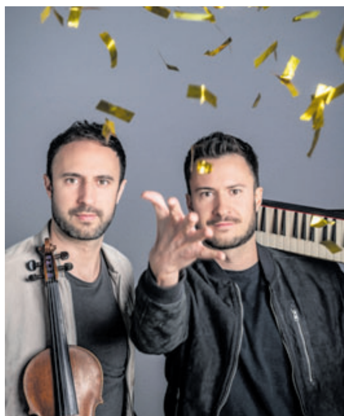
ASS Dur bringt Musik und Comedy, Mozart und Helene Fischer zusammen

bei denen schon mal der eine oder andere Mord geschieht.