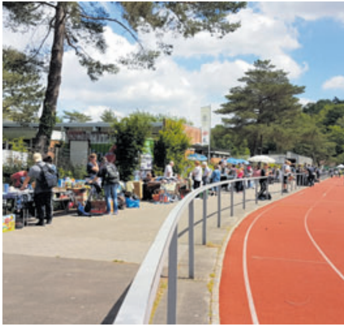
Der HNT-Flohmarkt findet 2024 am 15. Juni statt

für große und kleine Gäste geben. Auf die Besucher warten beim HNT-Sommerfest unter anderem eine spannende Rallye mit vielen Mitmachaktionen, eine Tombola, verschiedene Leckereien und Getränke sowie Spielangebote für den Nachwuchs. Dazu gibt es einen Einblick in die große Sportwelt der HNT. Die Gebühr für einen Stand auf dem HNT-Flohmarkt beträgt 15 Euro für 3 lfd. Meter. HNT-Mitglieder zahlen nur 10 Euro. Der Aufbau ist ab 9 Uhr möglich. Wer Fragen hat, kann sich gerne an das HNT-Sportbüro wenden, E-Mail sportbuero@hntonline.de oder Tel. 040 7017443.