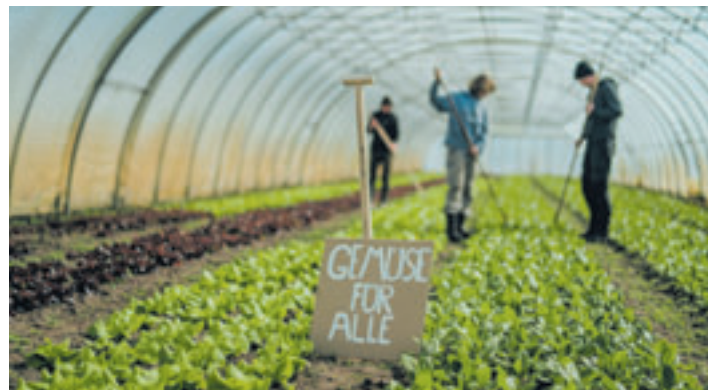
Gemüse für alle, heißt es bei der Solidarischen Landwirtschaft

aus Wistedt betreibt Abholstellen in Tostedt, Buchholz, Buxtehude, Neu Wulmstorf, Seevetal, Harburg und Wilhelmsburg. Die meisten Solawis nehmen aktuell auch noch neue Mitglieder auf. Wer sich das Ganze einmal genauer anschauen und das eine oder andere Gemüse probieren möchte, ist herzlich zu einer 90-minütigen Hofführung der Solawi Superschmelz am Sonntag, 5. Mai, um 15 Uhr auf dem Biohof Quellen in Wistedt eingeladen. Um eine kurze Anmeldung per E-Mail unter ackerteam@solawi-superschmelz.de wird gebeten, spontane Gäste sind aber auch willkommen.