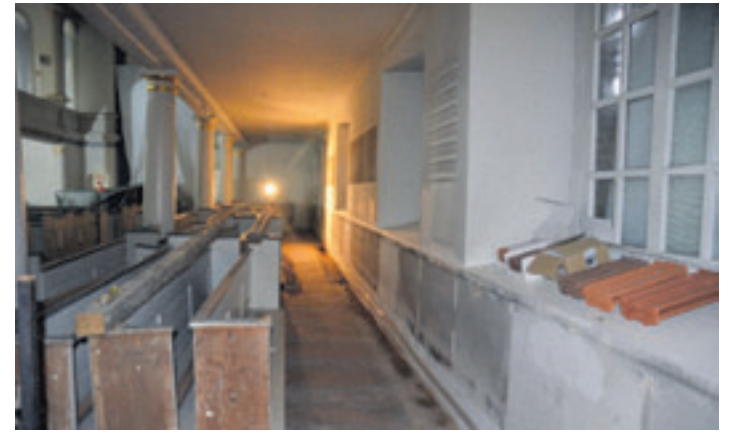
Der Innenraum der Kirche erhält sowohl eine neue Heizungsanlage (Wärmepumpe) als auch einen frischen Anstrich.

les seine Richtigkeit hat, liegen in der Kirche einige Musterziegel, anhand derer sich die Handwerker orientieren können, sagt Meyer. Auch der Förderverein Altenwerder beteiligt sich an der Sanierung. Der Innenraum der Kirche wird komplett neu gestrichen – auf Kosten des Fördervereins. Mit dem Amt für Denkmalschutz habe man sich auf die bisherige Farbe Weiß geeinigt. Ihm gefalle der schlichte Farbton, der den Innenraum gut zur Geltung bringe und den er auch für zeitlos halte, schwärmt Meyer. Bis