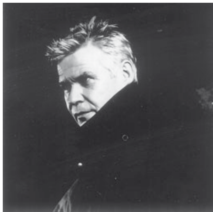
Achim Reichel präsentiert sein neues Album Wilder Wassermann – Balladen & Mythen.