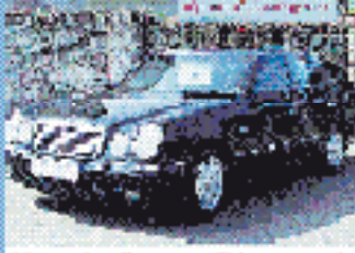
Mercedes Benz 240E Avantgarde 2.4 l, 120 kW (165 PS), EZ 3/99, 60.300 km, schwarz, Automatik, ABS, ESP, Leder, el. SHD, Do- u. Seiten-Airbags, ABS, el. Spiegel, Klima, SV, ABS, Sitzheiz., Winterreifen € 25.980,-