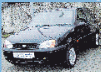
Ford Fiesta Futura 1.3 l, 44 kW (60 PS), EZ 6/91, 9.350 km, profar-schwarz-met., 5-Gang, 84, Do- u. Seitenairbags Fahrer, Schervert., WFS, Klima, RVC, SV, 3. Brennst., el. ABS € 9.290,-