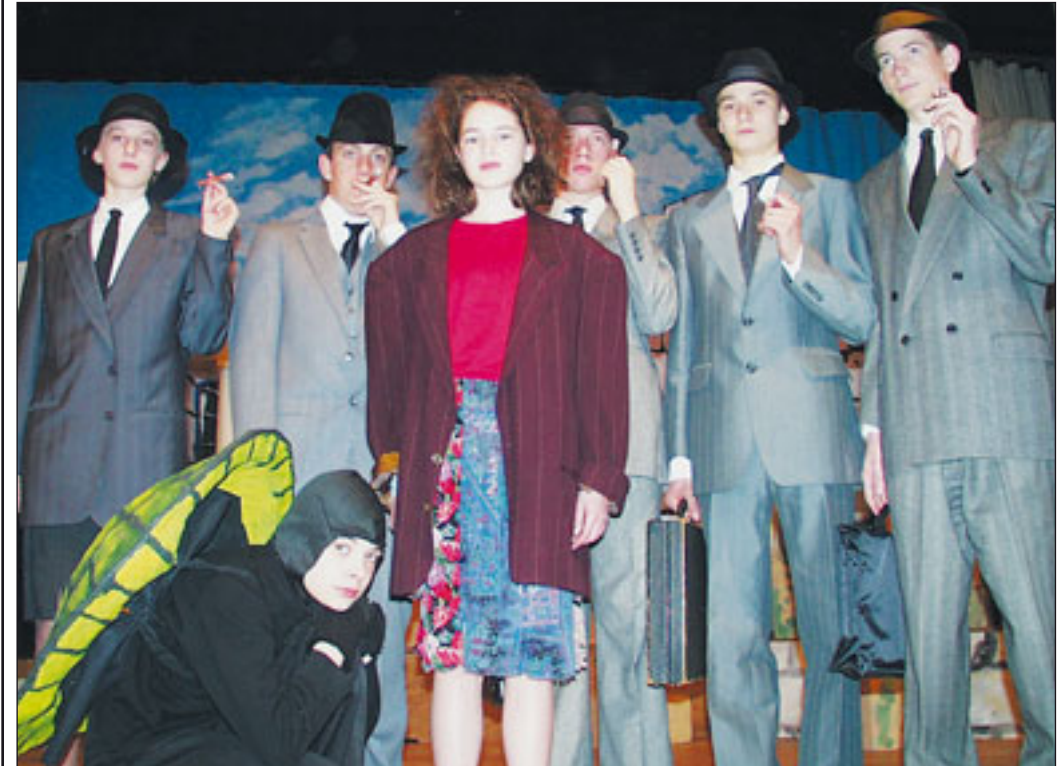
Die Schülerinnen und Schüler der achten Klasse der Rudolf Steiner Schule Harburg führen „Momo“ auf. Die 1972 entstandene Geschichte von Michael Ende hat im Laufe der Zeit nichts von ihrer Faszination verloren. Sie erzählt von den Gefahren, die von Zeitdieben ausgehen, von denen es heute mehr denn je gibt.