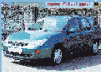
Ford Focus Trend Turnier 1.8 l, 90 kW (122 PS), EZ 10/99, 48.075 km, weiss- grau-met., 5-Gang, ABS, ABS, Do- u. Seiten-Airbags, el. FH, SV, WFS, ZV, el. Spiegel, Klima € 13.166,-