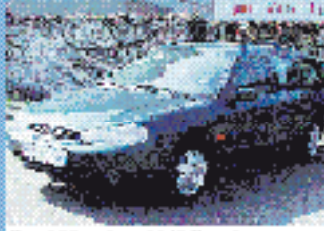
Ford Mondeo OLX Turnier 1.6 l, 66 kW (90 PS), EZ 1/97, 99.847 km, ischwarz- graun-met., 5-Gang, 3. Brennst., Do-Airbag, ABS, el. FH, Klima, RVC, SV, WFS, ZV mit FB € 8.450,-