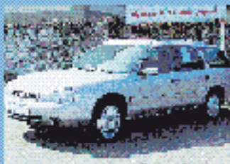
Ford Mondeo Ambiente Turnier 1.6 l, 70 kW (95 PS), EZ 4/00, 68.037 km, kristallblau- met., 5-Gang, Do- u. Seiten-Airbags, ABS, el. Spiegel, el. FH, Klima, RVC, SV, ZV mit FB € 11.970,-