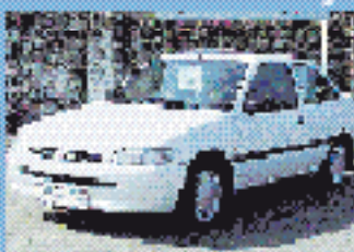
Ford Escort Fun 1.6 l, 65 kW (88 PS), EZ 4/95, 111.200 km, weiß, 5-Gang, Do-Airbag, el. Spiegel, ABS, RVC, SV, WFS, ZV, get. Heckste SHD € 3.490,-