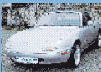
Mazda MX-5 Roadster 1.6 l, 65 kW (90 PS), EZ 7/99, 125.000 km, silber-met., 5-Gang, Euro 1, el. FH, SV, Sonder- rufe, Holzleim, Sportauspuff € 7.490,-