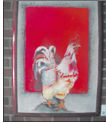
Der Feuerhahn von Heidrun Harmann ist ein Blickfang der Ausstellung.

(jl) Neu Wulmstorf. Psychologisch gesehen erzeugt die Farbe Rot, insbesondere das Gelbrot, von allen Farbefindungen die stärkste Wirkung bei den Menschen. Bei längerem Betrachten der Farbe, so stellten Wissenschaftler fest, beschleunigt sich die Atmung und der Puls und Blutdruck steigt. Diese erregende Wirkung kann positiv aber auch mit Abneigung empfunden werden. Schon ein Kinderreim beschreibt diese gegensätzlichen Gefühle, die die Farbe auslöst: „Rot ist die Liebe, rot ist das Blut, rot ist der Teufel in seiner Wut.“