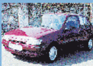
Ford Fiesta Fun 1.3 l, 37 kW (50 PS), EZ 12/94, 129.000 km, bordeauxrot-met., 5-Gang, Euro 1, Airbag, get. Rück- sitze, Colorverklebung, RVC € 2.630,-