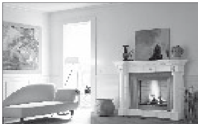
(mG) Wer sich für einen mit Holz beheizten Kamin oder Kachelofen entscheidet, muss kein schlechtes Gewissen gegenüber der Natur haben.

Deshalb ist die Nutzung von Holz aus heimischen Wäldern keine Gefahr für die Bäume. Unsere Wälder sind Wirtschaftswälder, in denen nur so viele Bäume gefällt werden wie auch