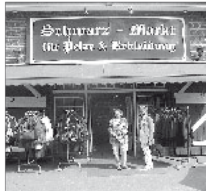
Willkommen im Schwarz-Markt: Am kommenden Sonnabend, 4. Mai lädt das Team des renommierten Rader Modegeschäftes von 9.30 bis 16 Uhr zur Maifeier.

Und am kommenden Sonnabend, 4. Mai wird gefeiert. Von 9.30 bis 16 Uhr gibt es Würstchen und Getränke, Live-Musik und eine Weinprobe vom Mosel-Weingut Schneider Kranz.