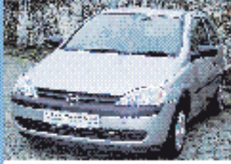
Opel Corsa 1.2 16V 1.2 l, 55 kW (75 PS), EZ 5/01, 15.830 km, silber- met., 5-Gang, Euro 4, 3. Brennst., Stadler in Wagenf., Klima, Color, Airbag € 9.995,-