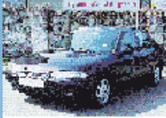
Ford Mondeo Ghia 1.8 l, 85 kW (115 PS), EZ 3/95, 90.070 km, asberg- rot-met., 5-Gang, Do-Airbag, ABS, el. Spiegel, Klima, RVC, el. FH, ZV mit FB € 5.390,-