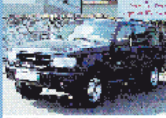
Ford Explorer Limited 4.0 l, 155 kW (211 PS), EZ 10/00, 10.870 km, schwarz-met., Auto- rick, ABS, ABS, Do- u. Seiten-Airbags, ABS, el. Spiegel, el. FH, Klima, Leder, el. SHD, ZV mit FB € 23.490,-