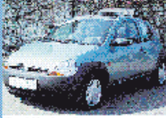
Ford Ka Capri 1.3 l, 44 kW (60 PS), EZ 5/01, 10.024 km, apgri- nes-met., 5-Gang, Euro 4, Do- u. Seiten-Airbags, RVC, SV, 3. Brennst., el. Folddach € 8.450,-