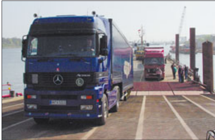
Der Baustellen- und zum Teil auch Zulieferverkehr erfolgt bis 2004 auf dem Wasserweg.

Die Halle wird 230 Meter lang und 120 Meter breit sowie 26 Meter hoch sein. Als Fundament wurden seit Anfang Dezember 2.100 Betonpfähle in die Airbus-Erweiterungsfläche im Mühlen-