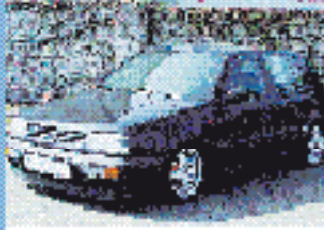
VW Golf III GTI Edition 2.0 l, 86 kW (116 PS), EZ 5/94, 102.751 km, schwarz, 5-Gang, Airbag, ABS, el. Spiegel, Color, el. FH, Klima, RVC, Sportitze, ZV € 5.112,-