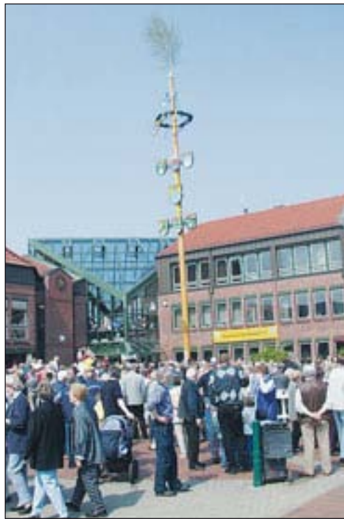
Im letzten Jahr kamen zahlreiche Neu Wulmstorf, um die Aufstellung des Maibaums und das anschließende Festprogramm zu sehen.

(11) Neu Wulmstorf. Mit dem ersten Tag des Wonnemonats Mai findet alljährlich, seit nunmehr zwölf Jahren, das Fest um das traditionelle Maibaumaufstellen auf dem Neu Wulmstorf Rathausplatz statt. Auch in diesem Jahr dürfen sich die Neu Wulmstorf und ihre Gäste auf ein buntes Frühlingsprogramm freuen. Die Veranstalter des Maifestes sind der Neu Wulmstorf Kulturverein und die Freiwillige Feuerwehr Neu Wulmstorf.