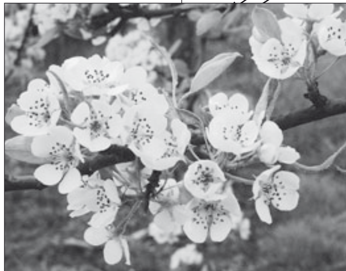
In Anlehnung an einen Operetten-Ohrwurm: Es blüht so weiß, wenn Finkenwerders Bäume blühen.

Auf den eingezeichneten Strecken ist die Obstblüte besonders reizvoll.