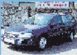
Opel Omega Caravan CD Kombi 2.0 l, 110 kW (150 PS), EZ 3/95, 114.000 km, Blau, ABS, el. FH, Klima, el. SHD, Do-Airbag, ABS, SV, Dachreg., ZV mit FB, Nebel, El. Rückspiegel € 7.750,-