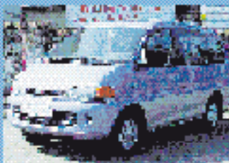
Mitsubishi Space Gear 2400 GLS 2.4 l, 97 kW (132 PS), EZ 10/99, 75.100 km, violett-blau, Automatik, Do-Airbag, ABS, el. Spiegel, el. FH, RVC, SV, ZV, el. SHD, Klimaautomat. € 13.490,-