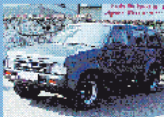
Nissan Terrano 3.0 V6 3.0 l, 129 kW (149 PS), EZ 6/93, 105.414 km, perlengraun-met., 5-Gang, 3. Brennst., Do-Airbag, ABS, el. FH, Klima, RVC, SV, Standrad, ZV, WFS € 7.590,-