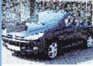
Peugeot 206 CC 110 1.6 l, 68 kW (92 PS), EZ 5/01, 6.118 km, schwarz-met., 5-Gang, Do- u. Seiten-Airbags, ABS, Color, SV, Sonderfahrg., PEI/CD, ZV mit FB, el. Spiegel, el. FH, el. SD € 18.950,-