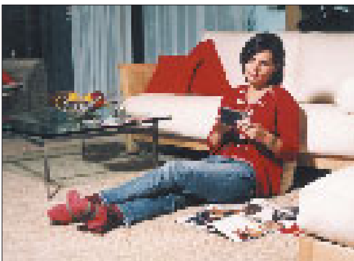
(mG) Fußbodenheizung muss nicht teurer sein als Radiatorenheizung. Das ergab eine aktuelle Studie.

(mG) Noch immer geistert durch Bauherren- und Modernisiererkreise das Vorurteil, eine moderne Fußbodenheizung sei teurer als die herkömmliche Radiatorenheizung. Eine aktuelle Studie des Institutes für Modernisierung und Erhaltung von Bauwerken e. V. an der TU Berlin zeigt, dass diese Ansicht falsch ist.