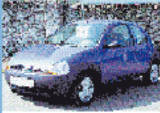
Ford Ka Kool 1.3 l, 44 kW (60 PS), EZ 4/99, 56.000 km, karibikblau- met., 5-Gang, 80, Do-Airbag, ABS, RVC, WFS, get. Rückste, Klima, SV, Winterreifen € 5.470,-