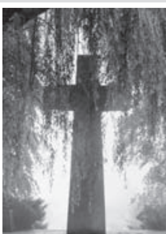
(mG) In Zeiten wachsender gesellschaftlicher Mobilität stellen die Gräber verstorbener Angehöriger einen wichtigen Bezugspunkt für den Einzelnen dar.

mit Zeitungsanzeigen, Blumenschmuck und Terminen mit den entsprechenden Pfarrern oder Grabrednern über die Kaffeetafel bis hin zur Übermittlung von Danksagungen.