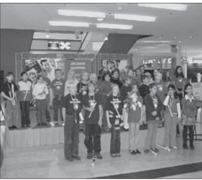
Den Anfang machte am Montag der Chor der Schule Dempwolfstraße