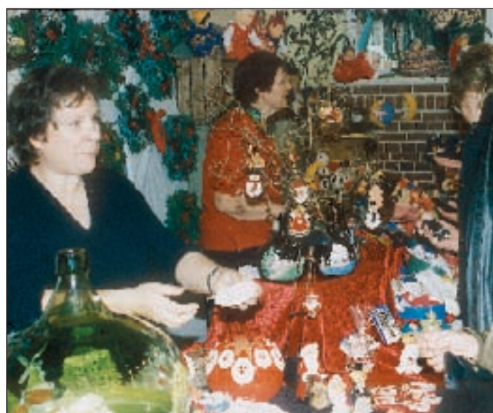
Kunsthandwerk wie hier gibt es im Autohaus Köbernik in Harburg zu bewundern.