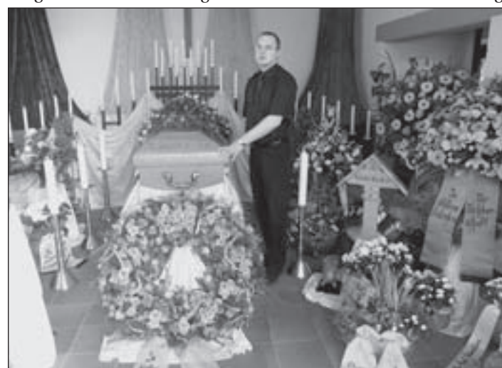
(mG) Der Bestatter versteht sich heutzutage als Dienstleister im Sterbefall. So befasst er sich unter anderem mit der Planung, Durchführung und Nachbereitung der Trauerfeier. Häufig sind Bestatter aber auch die ersten Ansprechpartner für die Hinterbliebenen eines Verstorbenen. Um den Angehörigen Trost, Rat und Hilfestellung zu bieten, sind daher auch grundlegende Kenntnisse in Psychologie und Trauerbewältigung notwendig.

Bestattungsunternehmen bieten den Angehörigen von Verstorbenen kompetente Hilfestellung, von der Erledigung sämtlicher Formalitäten bei den zuständigen Behörden über die Organisation des gesamten Ablaufs der Bestattung