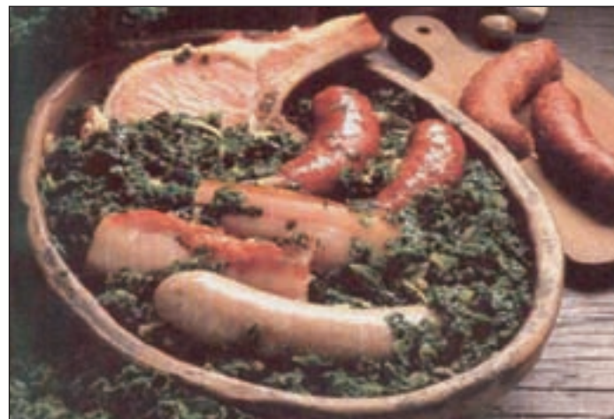
Leckerer Grünkohl in vielen Variationen gibt es in dieser Jahreszeit in den Restaurants.

England, Skandinavien und vor allem in Norddeutschland. Unser Markt wird fast vollständig von der inländischen Produktion abgedeckt. Die Saison geht von Ende September bis Februar/März.