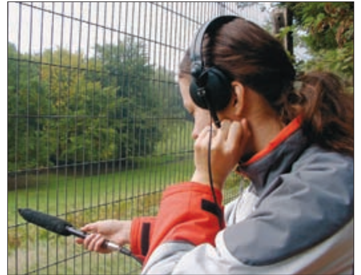
Die „Wolfsgruppe“ beschäftigte sich damit, mit welchen akustischen Mitteln das Wolfsrudel zum Heulen stimuliert werden könnte. Dabei scheint eine Feuerwehirsirene eine bedeutende Rolle zu spielen...

Eine Anmeldung ist aus organisatorischen Gründen unbedingt unter Telefon 79 68 82 65 erforderlich.