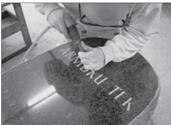
(mG) Grabmale sind das letzte Geschenk, das die Hinterbliebenen dem Verstorbenen machen können. Sie können glatt geschliffen oder unbehauen, stehend oder liegend, gerade geschnitten oder figürlich, massengefertigt oder künstlerische Einzelarbeit sein - das Angebot an Grabmalen ist groß. Wichtig und sinnvoll ist deshalb eine professionelle Beratung beim Steinmetz.

Die meisten Grabmale sind aus Naturstein. In gleicher Weise eignen sich jedoch auch Holz und Metall. Letztere Materialien waren vor allem im vorigen Jahrhundert weit verbreitet; in größerer Zahl finden sie sich noch dort, wo landschaftliche Traditionen vorherrschen, z. B. in den Alpen. Unterschiedliche Materialien erzeugen verschiedene Wirkungen. Das Grabmal aus Stein verkörpert eine gewisse Schwere, es verleiht dem Grab einen Hauch von Ewigkeit. Holz deutet demgegenüber darauf hin, dass das Grab nur