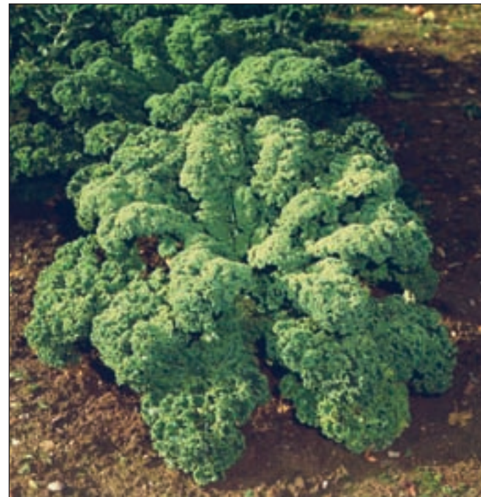
Auf dem Feld gedeiht der Grünkohl, auch „Oldenburger Palme“ genannt, prächtig.

Die Heimat des Grünkohls liegt im östlichen Mittelmeerraum. Trotz bescheidener Ansprüche an Klima und Boden hat er weltweit keine größere Verbreitung erlangt. Der Hauptanbau des Grünkohls erfolgt in den Niederlanden,