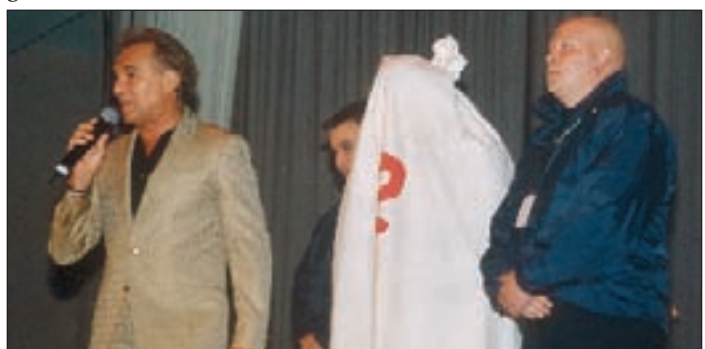
Für das Spielchen „Wer ist der Prominente im Sack“ konnte diesmal der ehemalige Tagesschau-Sprecher Wilhelm Wieben gewonnen werden.

fällen verletzte Kinder möglich gemacht haben. An dieser Hilfe solle sich auch in Zukunft nichts ändern, so ihr Wunsch.