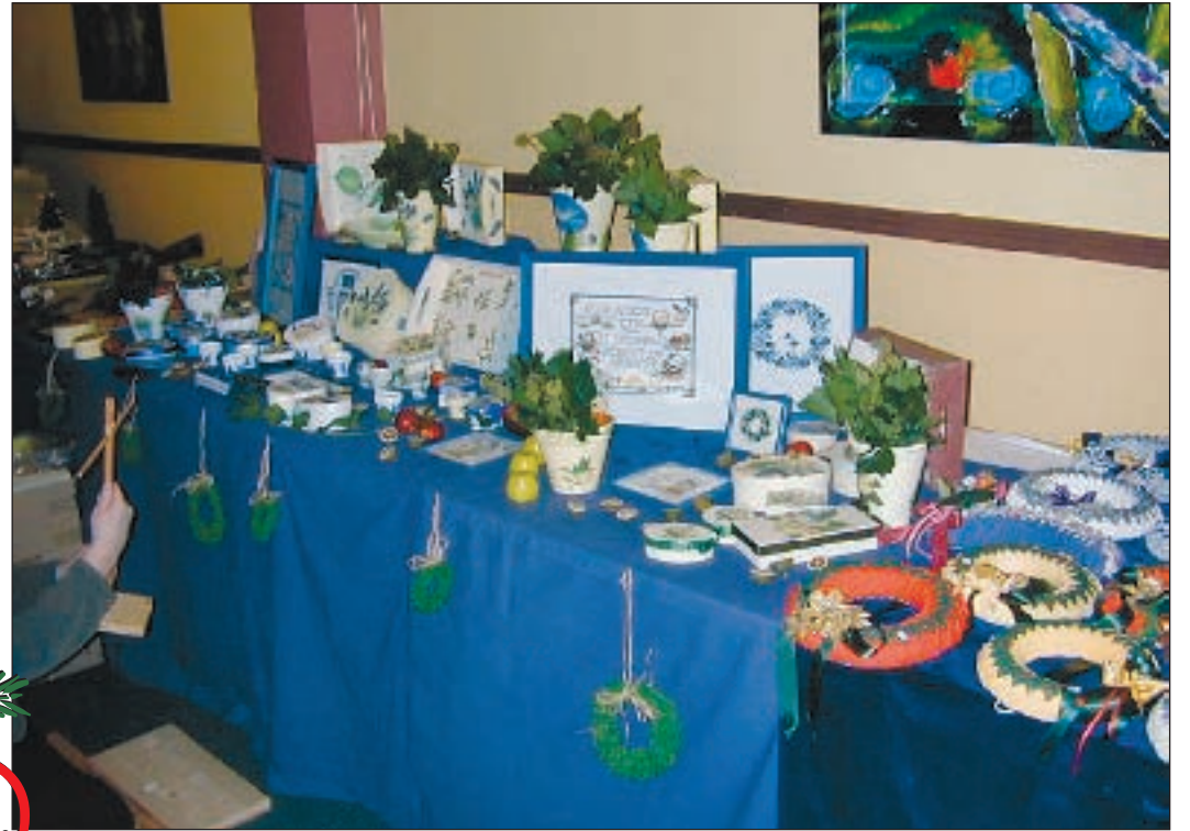
Handarbeiten und viele hübsche Sachen gibt es auf dem Martins-Markt des Seniorenpflegeheims Eichenhöhe zu bewundern und zu kaufen!

Wer sich einmal richtig verwöhnen lassen will, kann sich bis zum 15. November unter Telefonnummer 79 01 71 13 zu einem dreigängigen Überraschungsmenue um 13.30 Uhr anmelden. Die Kosten für das Menue betragen 16 Euro.