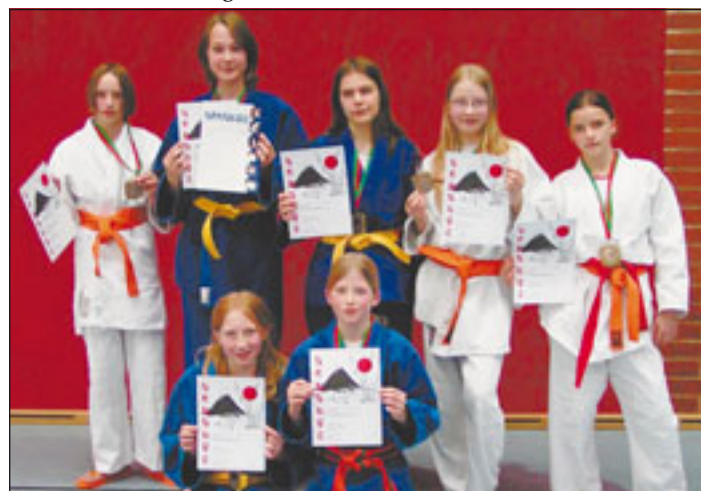
Die U14 /w der Judo-Kampfgemeinschaft TVV Neu Wulmstorf / TuS Jork errang bei der Bezirks-Meisterschaft in Nienhagen einen ausgezeichneten 3. Platz.