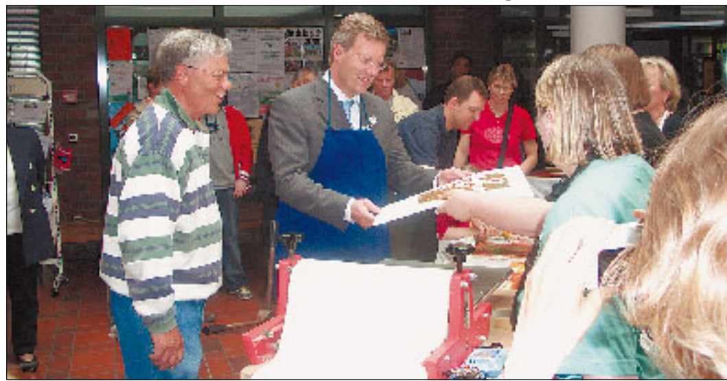
Der Ministerpräsident hatte sichtlich Spaß am Linoldrucken, das Publikum sah interessiert zu.

Sogar ein Vergleich mit den Ständen von „Baywatch“ wurde gezogen. Als Wulff schließlich noch einmal auf die schöne „Stadt“ Neu Wulmstorf zurückkam, ging ein Raunen durch die Zuhörer. Na ja, ein Ministerpräsident kann schließlich nicht alle „Kleinigkeiten“ aus seinem großen Land wissen (wer sich jetzt ähnlich unwissend fühlt, wie Herr Wulff, dem sei erklärt, dass die Neu Wulmstorfer Bevölkerung sich schon zweimal gegen die Stadtwerdung des Ortes ausgesprochen hat!).