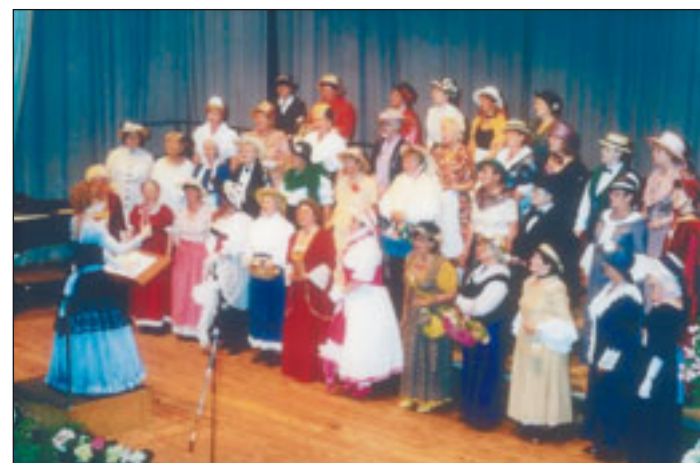
Mit einer musikalischen Show für Augen und Ohren überraschte der Harburger Frauenchor die musikalischen Mitstreiter