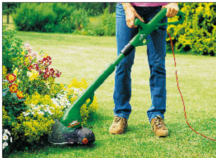
(spp) Elektrische Helfer beim Frühjahrsputz im Garten.