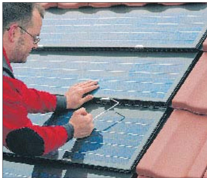
(spp) Solarsysteme lassen sich beim Hausbau oder bei einer Dachumdeckung fast vollständig in die Dachfläche integrieren.

Das SolarZentrum Hamburg nutzt diese einmalige Gelegenheit, Solaranlagen der neuen Gebäude eines der Hamburger Baugebiete und bereits seit Jahren ertragbringende Anlagen im Rahmen einer Solartour am Dienstag, dem 31. Mai, für jeden Interessierten kostenlos vorzustellen. Es gibt Informationen zur Anlagentechnik, Bundes-