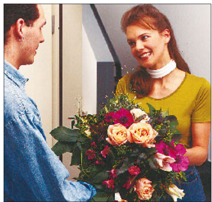
(mG) Ein überraschend zugesandter Blumengruß entzückt einfach jede Mama.

(mG) Im Zeitalter digitaler Datenübermittlung ist es dank eines weitverzweigten, multimedialem Kommunikationsnetzes möglich, über große Distanzen hinweg ganz frische Blumen zu verschicken. Muttertag ist die Gelegenheit, den praktischen Blumengruß-Service einmal zu nutzen und Mutter mit einem duftenden, frischen Blumenstrauß „Danke“ zu sagen. Um die Blumen nicht einem unnötig langen und strapaziösen Transportweg aussetzen, schickt der Blumenservice stets einen Auftrag an einen teilnehmenden Partnerfloristen in der Nähe der Empfängerin. Dort werden die gewünschten Blumen erst kurz vor der Auslieferung aus frischer Ware fachgerecht gebunden, auf Wunsch mit begleitenden Accessoires oder Grußkarten versehen und pünktlich zum Muttertag überreicht.