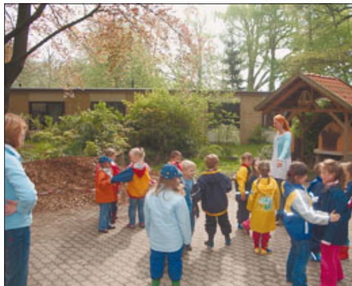
Der morgendliche Begrüßungsstanz ist auch bei den Vorschulkindern sehr beliebt.

fach schlauer in die Zukunft. Als es darum ging, sich mit verschiedenen Berufen vertraut zu machen, besuchte die Gruppe eine Bäckerei, den Hamburger Großmarkt, einen Krankengymnasten, die Polizei und die Feuerwache am Berliner Tor. Zum Vorschulabschied wird sogar