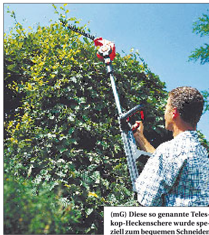
(mG) Diese so genannte Teleskop-Heckenschere wurde speziell zum bequemen Schneiden von hohen und sehr niedrigen Hecken entwickelt. Das umständliche Hantieren mit der Leiter entfällt ebenso wie das mitunter anstrengende Bücken beim Schneiden niedrig wachsender Hecken.

(mG). Der Frühling haucht dem Garten neues Leben ein. Jeder Grünliebhaber freut sich, wenn nun alles wieder sprießt und gedeiht. Damit die Natur einem nicht über den Kopf wächst und die richtige Form des Grüns gewahrt bleibt, ist es allerdings notwendig, hin und wieder mit der Schere einzuschreiten. Der regelmäßige Schnitt ist das A und O für gesunde und schöne Hecken. Das gilt auch dann, wenn sie keinen kunstvollen Formschnitt erhalten sollen. Wichtig beim Schneiden ist ein präziser, glatter Schnitt. Je sauberer er ist, desto rascher heilen die Wunden. Gute Scheren schneiden, ohne die Zweige zu quetschen und damit zu verletzen. Eine richtig geschnittene Hecke dankt mit dichtem Wuchs. Die Arbeit lohnt sich also, denn nur dichte Hecken machen den Garten oder die Terrasse wohnlich und schützen vor Staub, Lärm und unge-