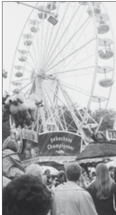
Das Riesenrad ist das Wahrzeichen des Pfingstmarktes in Neukloster