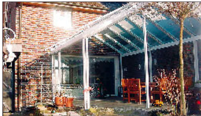
(wnp). Wer eine überdachte Terrasse oder Veranda sein eigen nennt, weiß die Vorteile zu schätzen.