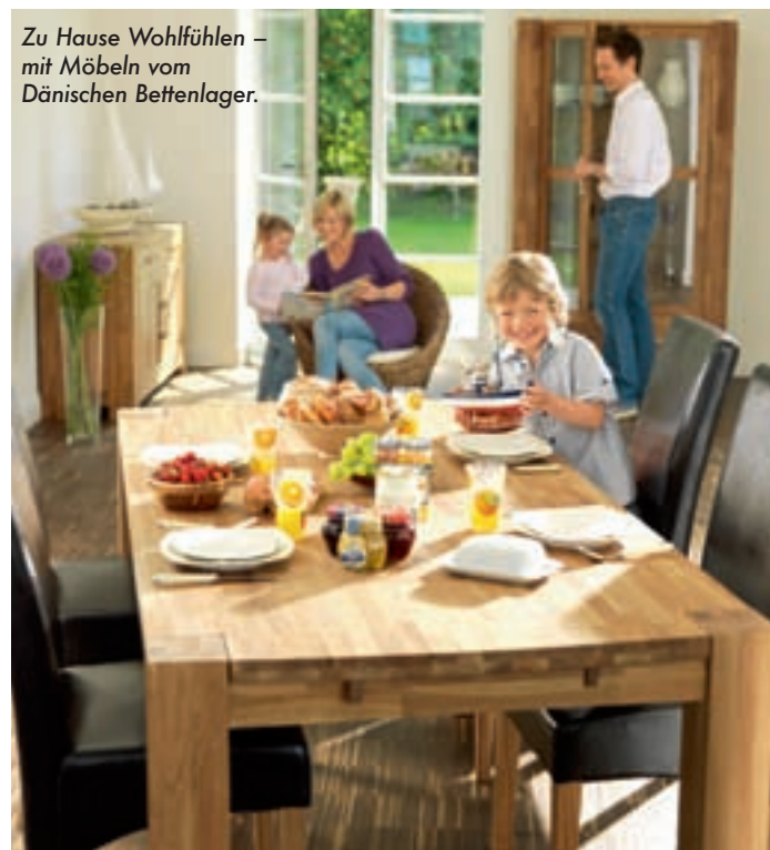
Zu Hause Wohlfühlen – mit Möbeln vom Dänischen Bettenlager.

Dänischen Bettenlager. Denn die Einrichtungsprofis aus dem hohen Norden bieten diesen Herbst ein umfangreiches Sortiment mit vielen Neuheiten und sehr günstigen Preisen. Besonders wenn es um hochwertige Echtholzmöbel aus Eiche, Kiefer, Akazienholz oder Kernbuche geht, finden sich in den deutschlandweit über 700 Filialen unschlagbar günstige Angebote. Besonders bei Set-Angeboten im Esszimmerbereich, aber auch bei den Wohn- und Schlafzimmern, bieten sich große Einspar-Möglichkeiten.