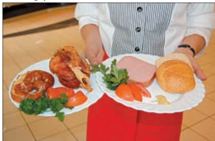
Leberkäse, halbe Hähnchen und Brezen sind in der Oktoberfestzeit für Liebhaber bayerischer Kost ein Muss