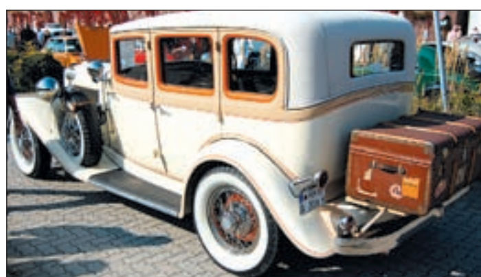
Zu einem der ältesten Fahrzeuge gehörte auch dieser gepflegte Auburn aus den 30er Jahren

70ern, vom Packard Clipper mit seinem protzigen 8-Zylinder-Motor bis zum Messerschmidt-Kabinnenroller, Baujahr 1959, es war so ziemlich alles vertreten, was dem Begriff „Oldtimer“ in irgendeiner Weise gerecht wurde. Rund 250 Besitzer dieser teilweise recht aufwendig restaurierten und zumeist gut erhaltenen Vehikel