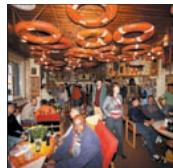
Seeleute und Landratten feierten gemeinsam den Geburtstag der Seemannsmission

■ (pm) WALTERSHOF. Beim 23. Duckdalben-Geburtstag fanden fast 400 Besucher den Weg zur Seemannsmission. Sie ist eine Einrichtung des Kirchenkreises Harburg-Ost.