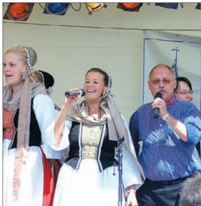
Die Proben der Finkwarder Speeldeel für das Weihnachtskonzert laufen auf Hochtouren

deel Kontakt aufzunehmen. Um eine Abholung kümmern sich die Speeldeeler. Für das 4. Adventwochenende hat sich die Finkwarder Speeldeel etwas Besonderes einfallen lassen: die Bühne des CCH wird kurzerhand in „Haifischbar“-Atmosphäre getaucht und man darf sich im ersten Teil des Konzertes neben Speeldeel-Klassikern wie „Mudder un Vadder goht ut“ auch auf allseits bekannte Melodien freuen. Das Programm wird auch in diesem Jahr wieder sehr familienfreundlich sein und für Jung & Alt die richtige Mischung aus Gedichten, Tänzen und Liedern bieten. Im weihnachtlichen Teil des Konzertes warten die Kinder der Lütt Finkwarder Speeldeel jetzt schon sehnsüchtig auf „de Wiehnachtsmann“ und hoffen, dass das Rezept für die Kekse der „Weihnachtsbäckerei“ in diesem Jahr aufzufinden ist! Die Vorstellungen beginnen um 17.00 Uhr (Samstag) und um 15.00 Uhr (Sonntag) jeweils im Saal 2 des CCH. Eintrittskarten gibt es bei den bekannten Vorverkaufsstellen oder unter der Telefonnummer 742 66 34 Kontakt mit der Speel-