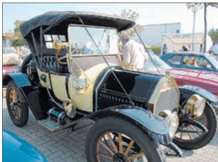
Zu Zeiten dieses Oldtimers war von Aerodynamik noch keine Rede, dafür aber von vielen liebevollen Details geprägt

hatten sich jetzt zum vierten Mal vor den Hallen des TÜV in Harburg getroffen, um ihre Schmuckstücke zur Schau zu stellen, miteinander zu fachsimpeln, Tipps und Ratschläge auszutauschen oder einfach nur einen netten Ausflug in den Süden Hamburgs zu machen.