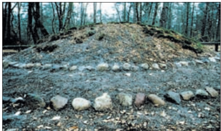
Die urgeschichtlichen Bestattungsplätze aus der Bronze- und Jungsteinzeit stehen im Mittelpunkt der letzten Entdeckungstour des Stadtteilmarketings Neuwiedenthal.

„Rund ums Neuwiedenthal befindet sich nicht nur eine bemerkenswerte schöne Landschaft, sie ist auch kulturhistorisch interessant. Wir freuen uns, bei dieser Tour Denkmäler von früheren Kulturen direkt vor der Haustür zu zeigen“, bemerkt Peter Finke von dem Bauverein der Elbgemeinden eG, der in Neuwiedenthal eine von 12 Auftraggebern des Stadtteilmarketings ist.