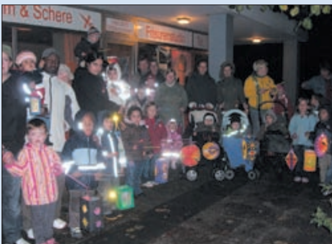
Die Hausbrucher SPD lädt am 2. Oktober um 19.00 Uhr zum traditionellen Laternenumzug ein.

Umzug begleiten – Kinder, bringt Eure schönsten Laternen mit! Treffpunkt ist am 2. Oktober ab 18.30 Uhr vor der Galleria am Rehrstieg. Der Abmarsch ist für 19.00 Uhr vorgesehen. Für Teilnehmer, die sich später einreihen wollen, hier der Laufkurs: Es geht los über den Rehrstieg bis zum Minnerweg, dann über den Minnerstieg zur Straße Lange Striepen und zurück über den Striepenweg zum Parkplatz hinter der Galleria.