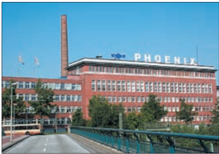
Das umfangreiche Archiv der Phoenix AG wurde dem Museum der Arbeit zwecks Forschung übergeben.

Hamburg“ und das gleichnamige Buch, Autor Jürgen Ellermeyer, aus dem Jahr 2006 gefördert. Damals steuerte sie Leihgaben bei und überließ Produkte und Werkzeuge aus der historischen Sammlung und dem Betrieb, u.a. der traditionellen Schlauchfertigung. Dazu erlaubte sie dem Filmemacher Jürgen Kinter die Reportage von verschiedenen, heute z.T. nicht mehr in Harburg vertretenen Arbeitsbereichen für die Ausstellung. Das Phoenix-Archiv hatte, wie viele Hamburger Firmenarchive, unter Verlusten und Einschränkungen zu leiden. Trotzdem stellt es, zumal angesichts des Rückgangs der Produktion vor Ort, eine Fundgrube für Fragen zu einem rund 150 Jahre alten Unternehmen dar, das ab 1856 maßgeblich zur Industrialisierung Harburgs beitrug, einige Eigenwechsel, Produkt- und Organisationsänderungen überstand und nach dem Zweiten Weltkrieg zeitweilig das größte Industrieunternehmen Harburgs war. Mit der vollzogenen Schenkung bleibt die über mehrere Jahrzehnte gewachsene Sammlung in Hamburg zusammen und der Stadt damit ein bedeutsames Firmenarchiv erhalten.