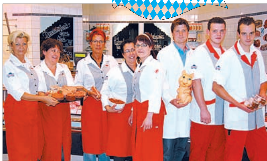
Das Team der Fleischerei Aldag hat sich mit besonderen Schmankern auf die Bayerischen Wochen eingestellt.

■ (gd) FISCHBEK. Endlich ist es wieder soweit, die Bayerischen Wochen bei der Fleischerei Aldag in Fischbek stehen bevor und in dem nett eingerichteten Bistro an der Cuxhavener Straße 460 wird es vom 28. September bis zum 10. Oktober wieder herrlich nach typisch bajuwarischen Schmankerln duften. Verführerische Spezialitäten, wie Leberkäse mit Semmeln, Haxe mit Sauerkraut oder Weißwurst mit Laugenbrezel, alles nach Original Bayerischen Rezepten, stehen dann auf der Karte, ergänzt von Fritatensuppe, Spanferkel und Krautwickel, einer urigen Wiesen-Pfanne, deftigem Wurstsalat und Kaiserschmarrn oder leckeren Germ-Knödeln, die das blau-weiße Angebot abrunden werden. Dass die Fleischerei Aldag über so hervorragende Originalrezepte verfügt, hat sich nicht nur bei der Kundschaft schon seit langer Zeit herumgesprochen, es hat auch