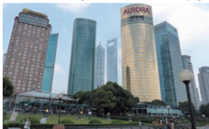
Die Skyline von Shanghai beeindruckte auch die Mitglieder der Bürger-schaftsdelegation aus Hamburg.

Partnerstadt zu schicken, um politische Gespräche zu führen und wirtschaftliche Kontakte zu pflegen.