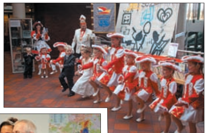
Die jungen Narren tanzten im Eingangsbereich des Rathauses was das Zeug hielt.

■ (mk) NEU WULMSTORF. Seit dem 11. November haben die Narren die Macht im Rathaus Neu Wulmstorf übernommen. Unter typisch beschwingter Karnevalsmusik und mit den Worten „Wir wollen den Schlüssel“, „eroberte“ eine Delegation des Carnevalclubs Süderelbe e.V. der seinen Sitz in Neu Wulmstorf hat, das Büro von Bürgermeister Wolf Rosenzweig. Dieser hängte den Narren den symbolischen Rathausschlüssel freiwillig aus. Ge-