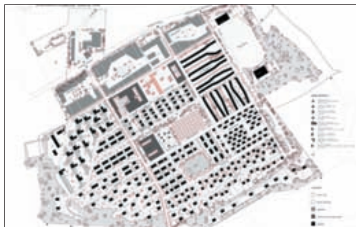
Die Planungen sehen nur hochwertige Bebauung auf dem Areal der Röttiger-Kaserne vor – mehrstöckige Bauten wie von der Finanzbehörde vorgeschlagen sucht man vergeblich.