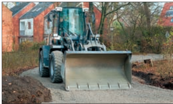
Ein Bagger glättet die frisch auf aufgeschüttete Glemsanderschicht, die äußerst widerstandsfähig sein soll.

Die Oberfläche wäre mit Glemsander ausgestattet worden. Asphalt oder andere bekannte Materialien dürfen aus Umweltschutzgründen nicht verwendet werden, erläuterte Hollmichel. Dieser zeigte sich überzeugt, dass der instandgesetzte Eingangsbereich gut zum Konzept des Regionalparks Rosengarten passen würde.