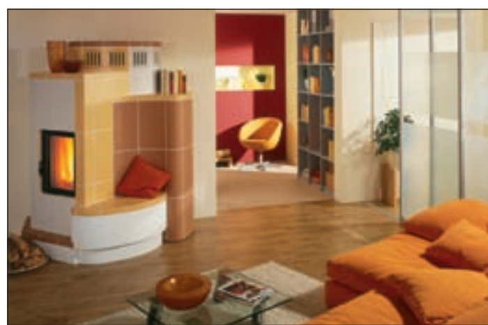
Gerade jetzt ein sicherer Tipp: Der Kachelofen – urgemütlich und rundum gesund! akz

* Der Kachelofen lässt sich mit heimischen Brennstoffen – Scheitholz, Pellets oder Braunkohle – befeuern. Das heißt: er gewährt ein hohes Maß an Versorgungssicherheit, denn er macht unabhängig von den Turbulenzen an den internationalen Energiemärkten! Die Bundesrepublik Deutschland – darauf weist das Bundesumweltministerium ausdrücklich hin – ist trotz seiner dichten Bebauung nach wie vor ein waldriches Land. Und seine natürlichen Ressourcen reichen