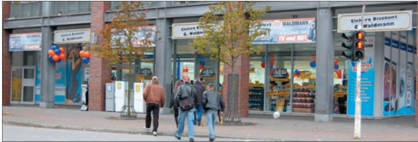
Seit vielen Jahren ist das Geschäft eine der besten Adressen für Elektro-Haushaltsgeräte

Nach einer fünfjährigen Umbauphase war es am 5. November endlich soweit, das Haus präsentiert sich jetzt der Kundschaft in einem helleren, noch freundlicheren und modernen Licht und auf einer um 250 Quadratmeter erweiterten Ver-