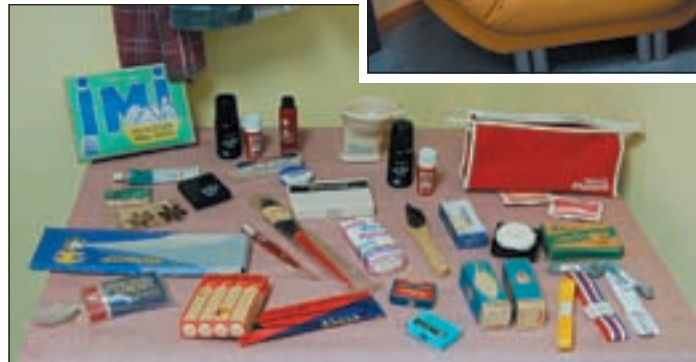
Auch alltägliche Gebrauchsgegenstände im DDR-Alltag sind zu besichtigen.