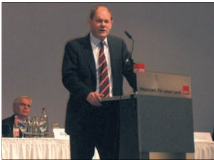
Der frühere Arbeitsminister Olaf Scholz wurde mit großer Mehrheit zum Hamburger SPD-Landesvorsitzenden gewählt.

tember zurückgetreten war. Scholz, der auch stellvertretender Vorsitzender der SPD-Bundestagsfraktion ist und auf dem SPD-Bundesparteitag in der kommenden Woche für das Amt des stellvertretenden Parteivorsitzenden kandidiert, zeigte sich zufrieden über das gute Abstimmungsergebnis: „Ich freue mich über die breite Unterstützung, die mir die Hamburger SPD mit diesem Ergebnis signalisiert. Sie ist die Voraussetzung dafür, dass wir gemeinsam daran arbeiten, die Sozialdemokratie in unserer Stadt wieder stark zu machen.“