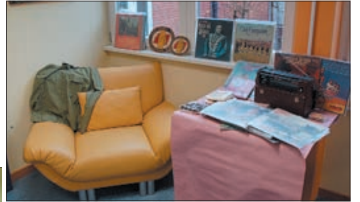
Ein gewissen Wohlstand in der DDR gab es seit den frühen 70er Jahren natürlich auch – hier am Koffer-Radio, Schallplatten und Sessel zu erkennen.

und die Verhältnisse in der DDR an der Reihe. „Der frühere Minister für Abrüstung und Verteidigung in der letzten DDR-Regierung, Rainer Eppelmann, hatte in einen Schreiben an alle Gemeinden angefragt, ob diese zum 9. November nicht Veranstaltungen planen könn-