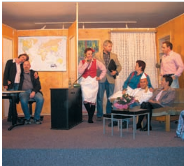
Die Theatergruppe des MGV Germania Elstorf probt mit Eifer ihr aktuelles Stück „Bloots een Viddelstünn“, um es im Gasthaus Meinschien Ende November/Anfang Dezember aufzuführen.