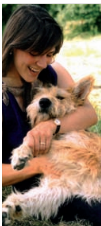
(mG) Zwischen Frauchen und Hund entwickelt sich in der Regel ein in-niges Verhältnis, das dem Halter besonders in belastenden Lebenslagen Rückhalt bietet.

Ob Single oder Großfamilie, junger oder älterer Tierhalter - einig sind sie sich alle in dem Punkt,