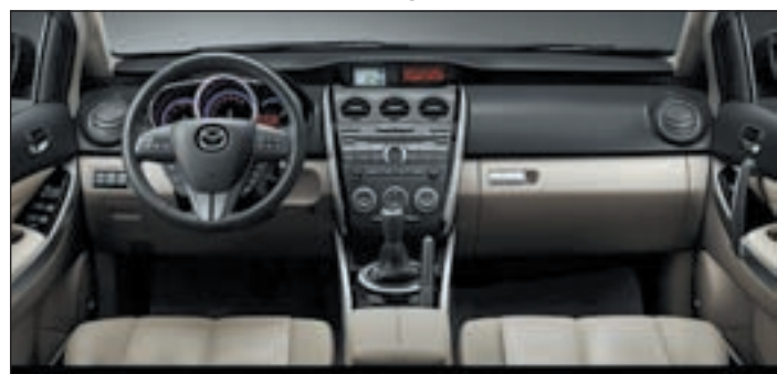
Ein schicker Innenraum ziert den Mazda CX-7

men der Inspektionen nachgefüllt. Der Euro-5-Diesel ist eine vernünftige Alternative zum Ottomotor im CX-7. Die Maschine ist recht leise und hängt ab etwa 2.000 Touren spritzig am Gas. Sie beschleunigt den großen Mazda gefühlt schneller als die 11,5 Sekunden, die der Wagen laut Werksdatenblatt bis Tem-