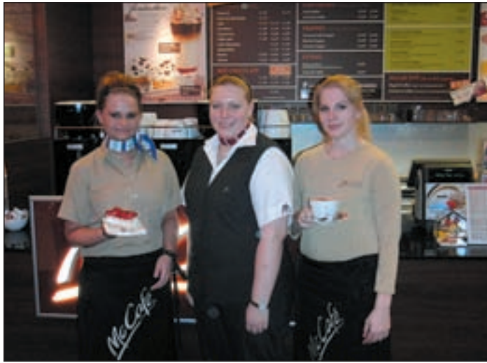
Das neue Kaffeeerlebnis für sich entdecken!

(ak) HARBURG. Das können jetzt auch die Gäste im McDonald's Restaurant in der Stader Straße, an der Autobahnabfahrt Heimfeld. Am Freitag, den 13. November, öffnete das umgebaute Restaurant mit „McCafé“ seine Türen in der Stader Straße 256, in Heimfeld. Die Genießerlounge lädt ein zu vielfältigen Kaffee-Spezialitäten und Snacks in netter Atmosphäre