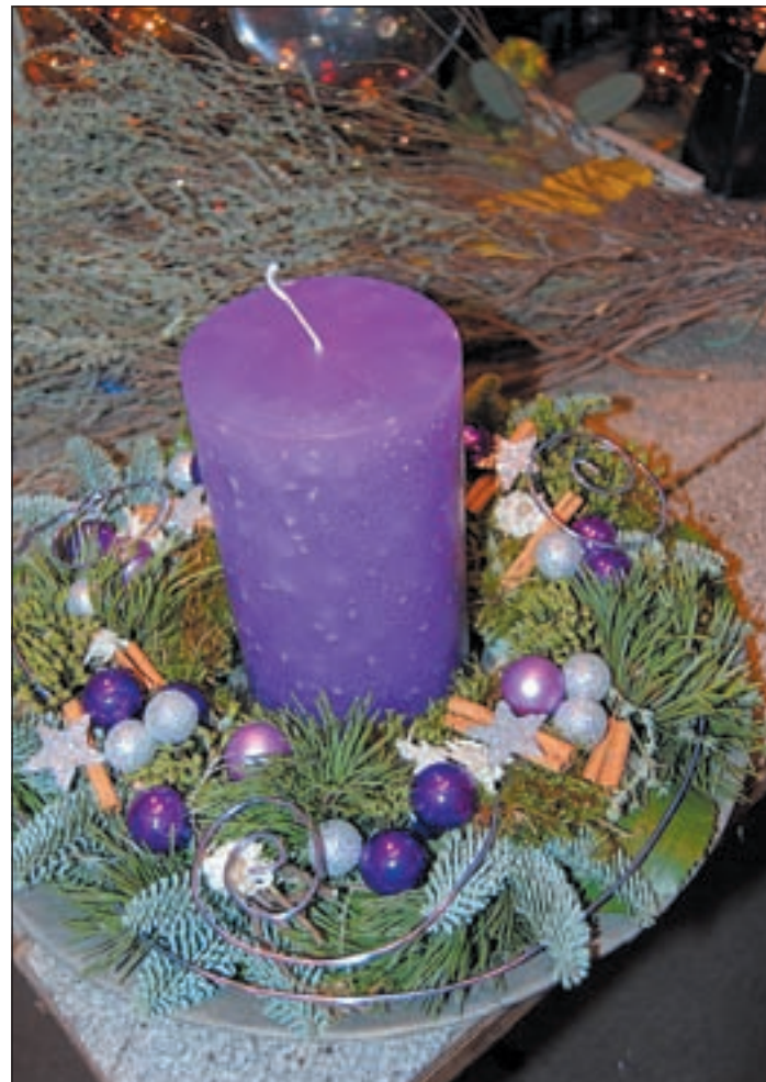
Lila und Silber gehören dieses Jahr wieder eindeutig zu den diesjährigen Trendfarben

dinavische Prägung, die sich in kleinen, bunt gekleideten Engeln, in Silber glänzenden Weihnachtspyramiden und sogar in einer „floristi-