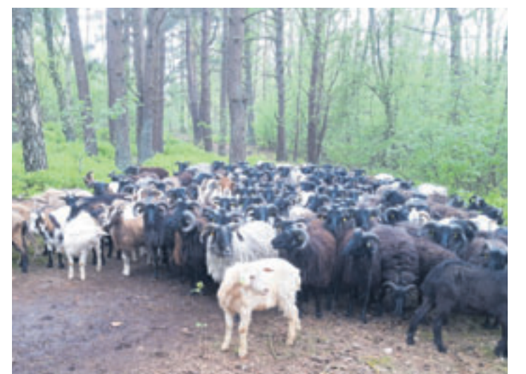
Seit Ostern ist die neue Schafherde in der Fischbeker Heide vor Ort