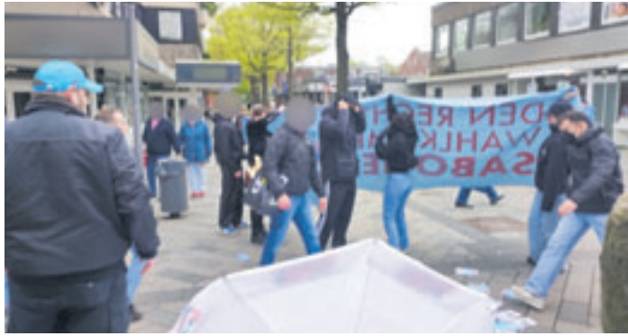
Bislang unbekannte Täter beschädigten am 20. April in der Neugrabener Marktpassage einen AfD-Infostand