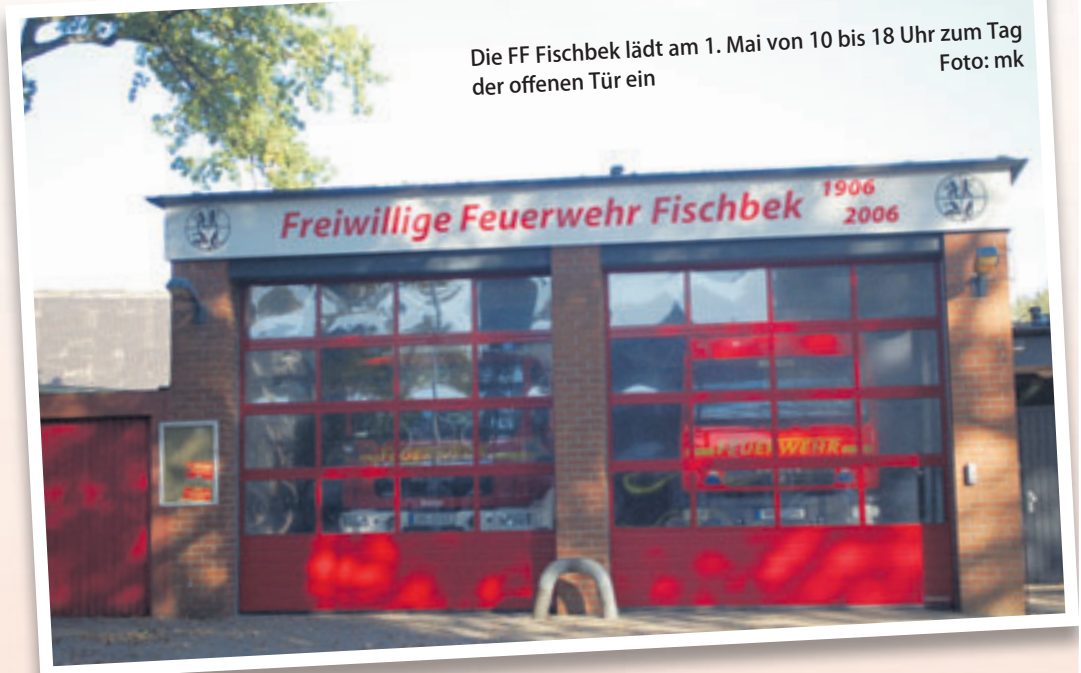
Die FF Fischbek lädt am 1. Mai von 10 bis 18 Uhr zum Tag der offenen Tür ein

Für nur einen Euro kann man sich ein Los kaufen. Die über 200 Preise wurden unter anderem von der HASPA, Autoteile Neugraben, Re-