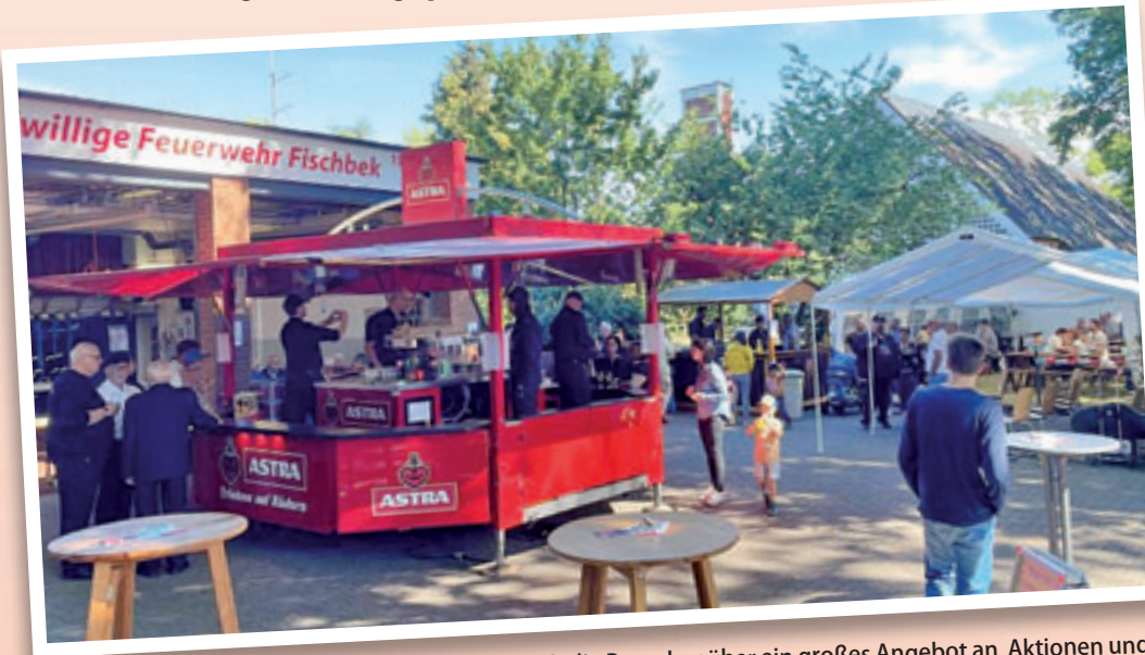
Am Tag der offenen Tür der FF Fischbek können sich die Besucher über ein großes Angebot an Aktionen und kulinarischen Leckereien freuen.

Achtung: Die Straße Fischbeker Weg ist wegen der Veranstaltung von 11.30 bis 19.30 Uhr gesperrt.