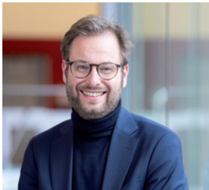
Senator Anjes Tjarks kommt am 6. Mai ins BGZ Süderelbe

wie etwa HVV Hop oder Moia. Eine Schlüsseltechnologie hierzu ist das autonome Fahren, dessen Chancen, Risiken und realistische Einsatzmöglichkeiten diskutiert werden. Weiterhin soll es um den Ausbau der Fuß- und Radinfrastruktur gehen, um durchgehende, komfortable Radnetze für Alltag und Freizeit sowie um sichere Schulwege, die Kinder gerne nutzen und bei denen Eltern sich keine Sorgen machen. Nicht zuletzt sollen Handwerker*innen und Pflegedienste in den Blick genommen werden, die auf zügige Fahrten zu ihren Einsätzen und Parkmöglichkeiten bei ihren Kund*innen angewiesen sind. Doch auch für alle weiteren Fragen und Anregungen interessiert Bürger werden Tjarks, Schittek und Ost an diesem Abend zur Verfügung stehen.