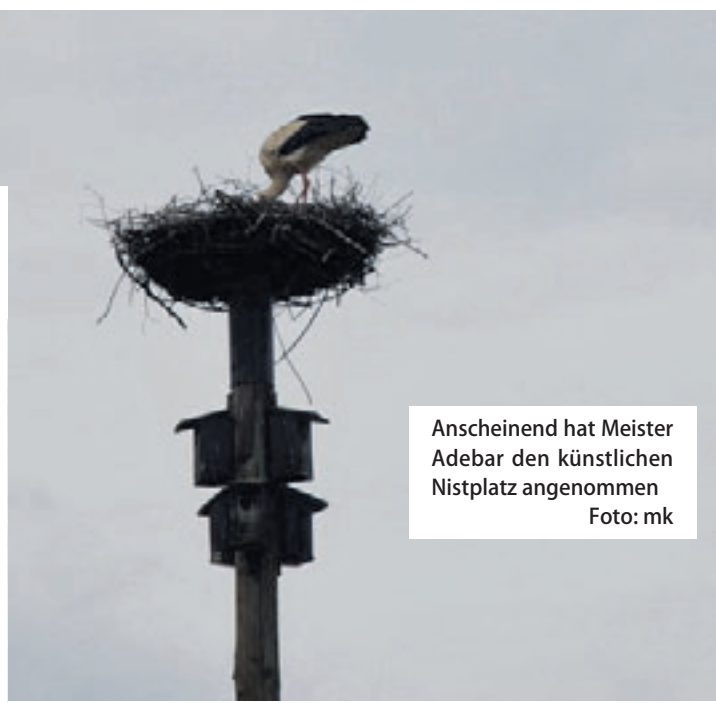
Anscheinend hat Meister Adebar den künstlichen Nistplatz angenommen