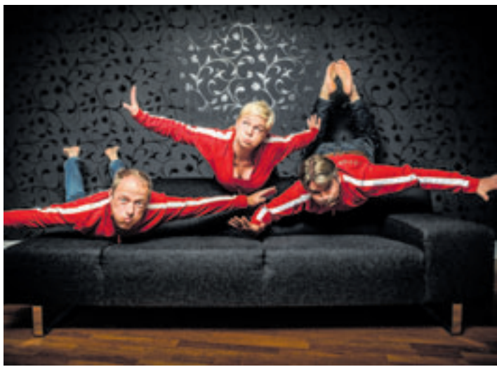
Fünf Sekunden – mehr Zeit haben die Spieler des Improvisationstheaters Steife Brise nicht, um sich auf die Show vorzubereiten

zur Uraufführung. Die Schauspieler der Steifen Brise und ihr Musikerkollegen erschaffen auf der Bühne einen Wind, der jeden mitreißt. Seit 1992 pustet die Steife Brise das deutsche Impropublikum ordentlich durch – mit Charme, Tempo und einer guten Portion nordischer Frechheit. Sobald die Zuschauer Stichworte auf die Bühne rufen, legen die Schauspieler und Musiker los und lassen Geschichten, Szenen und Lieder aus dem Nichts entstehen. Schnell. Lebendig. Hammer. Heute arbeitet die Steife Brise zudem europaweit erfolgreich als Businesstheater. Das Ensemble zählt sechzehn Schauspieler und zwei Musiker, die auch als Trainer und Moderator im Einsatz sind. Eintritt 15 Euro, gerne mit Voranmeldung unter tickets@kulturhaus-suederelbe.de oder Tel. 040 7967222. Restkarten an der Abendkasse.