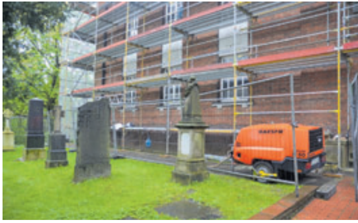
An der Fassade des Kirchenbaus sollen unter anderem marode Ziegel gegen neue ausgetauscht werden

Aber ganz so einfach, wie es sich anhört, ist es auch wieder nicht: Der Denkmalschutz hat stets ein Wortchen mitzureden. Ob bei den Steinen der Außenwände, den Dachziegeln oder der Installation der Wärmepumpe. Letztere konnte nicht einfach in die Fassade integriert werden wie bei normalen Häusern. Der Denkmalschutz genehmigte nur den Einbau der Wärmepumpe auf Höhe der ehemaligen Kapelle. Damit bei der Neueindeckung des Daches alles seine Richtigkeit hat, liegen in der Kirche einige Musterziegel, anhand derer sich die Handwerker orientieren können, sagt Meyer.