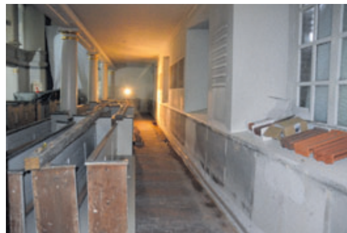
Der Innenraum der Kirche erhält sowohl eine neue Heizungsanlage (Wärmepumpe) als auch einen frischen Anstrich

gebäudes auch ein niveauller Veranstaltungskalender gehören. Fortsetzung auf Seite 17