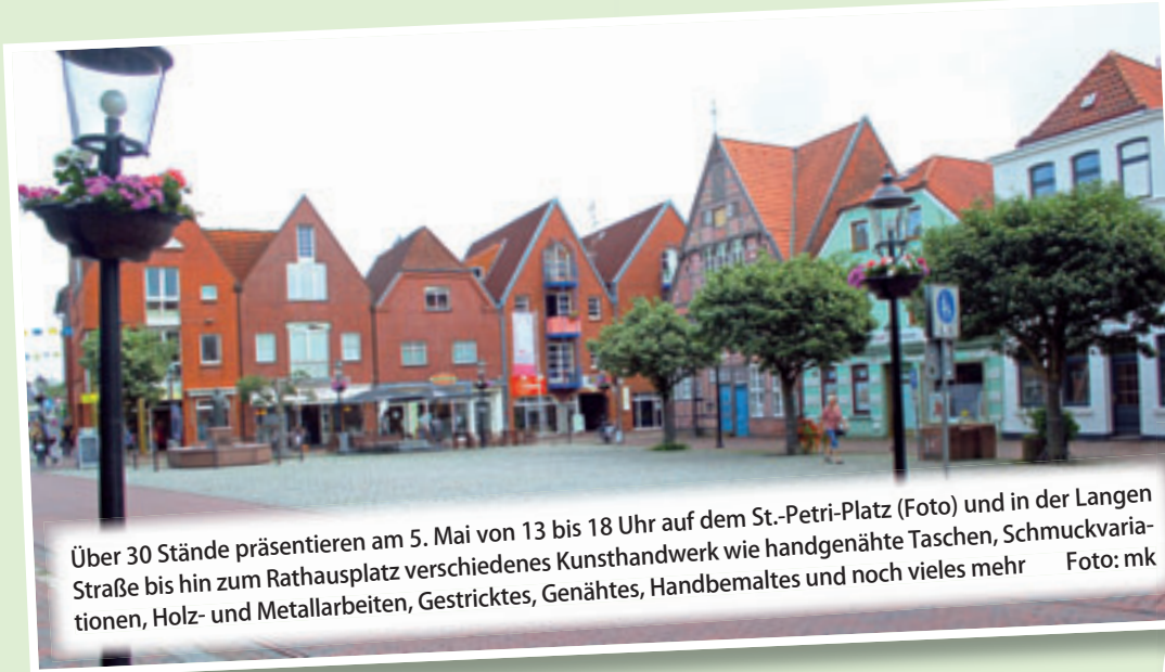
Über 30 Stände präsentieren am 5. Mai von 13 bis 18 Uhr auf dem St.-Petri-Platz (Foto) und in der Langen Straße bis hin zum Rathausplatz verschiedenes Kunsthandwerk wie handgenähte Taschen, Schmuckvariationen, Holz- und Metallarbeiten, Gestricktes, Genähtes, Handbemaltes und noch vieles mehr

Neben den Anbietern von selbstproduzierten Nahrungsmitteln werden auch wieder die angestammten Schausteller mit Verzeh- und Getränkeständen die Innenstadt beleben. Auch ein Kinderkarussell wird aufgebaut und bietet besonderen Spaß