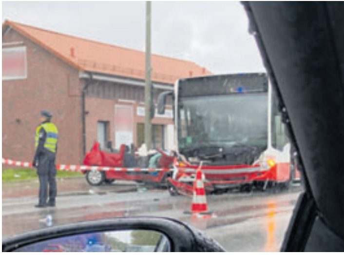
Das Dach des Pkw musste zur Rettung der Fahrerin aufgeschnitten werden

■ (mk) Neugraben. Gegen 13.20 Uhr ist es am 24. April auf der Cuxhavener Straße in Höhe Borchersweg zu einer Kollision zwischen einem Pkw und einem Linienbus gekommen, bei der die Autofahrerin lebensgefährliche Verletzungen erlitt. Den bisherigen Erkenntnissen des aufnehmenden Verkehrsunfall-Teams zufolge, befuhren eine Frau mit ihrem Renault die Cuxhavener Straße in Richtung stadtauswärts auf dem linken und der Bus der Linie 240 auf dem rechten Fahrstreifen. In Höhe des Borcherswegs soll die Pkw-Fahrerin den Fahrstreifen gewechselt haben, woraufhin es zur Kollision mit dem neben ihr fahrenden Bus kam. Durch den Aufprall schleuderte der Pkw gegen einen Laternenmast und kam dort zum Ste-