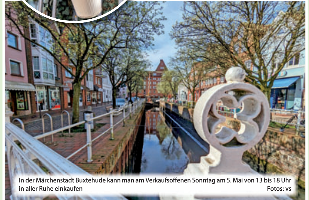
In der Märchenstadt Buxtehude kann man am Verkaufsoffenen Sonntag am 5. Mai von 13 bis 18 Uhr in aller Ruhe einkaufen