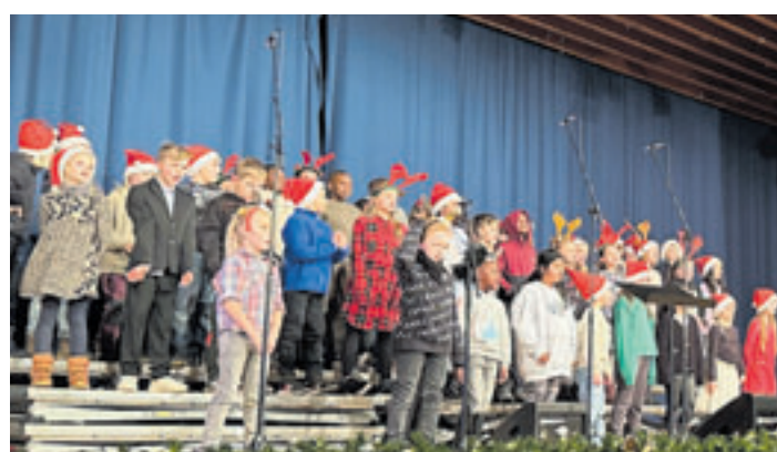
Der Aueschulchor wird sein Können ebenfalls auf dem Benefizkonzert unter Beweis stellen

■ (au) Finkenwerder. Es wird wieder musikalisch in Finkenwerder: Am Sonntag, 5. Mai, findet um 11 Uhr in der Werkshalle FMB (Finkenwerder Maschinenbau) im Hein-Saß-Weg 17 ein Benefiz-Konzert für die Unterstützung der Chorarbeit in den Finkenwerder Grundschulen statt. Mit Bier, Wein und Wurst ist natürlich für das leibliche Wohl gesorgt. Den Erfolg des Benefizkonzertes zugunsten des TuS Finkenwerder nach dem verheerenden Hallenbrand im vergangenen Jahr im Hinterkopf gibt es nun eine Neuauflage in den räumlichen Gegebenheiten der Maschinenfabrik, organisiert vom musikalischen Urgestein Peter Schuldt. Mit dabei sind die „Tinnitussis“, eine Hamburger Band, deren musikalisches Herz irgendwo zwischen Balkan-Brass, Party-Pop und New Orleans-Jazz schlägt ... Sie sind viele, sie sind laut, irgendwie süß, sehen gut