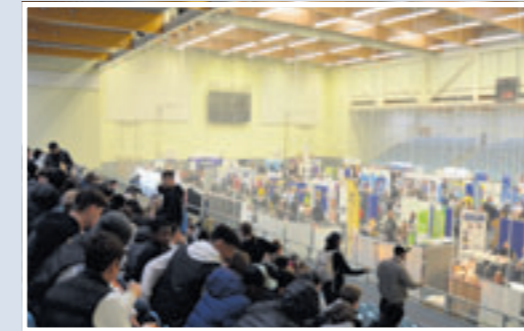
Ungewohntes Szenario: Auf den Rängen und dem Spielfeld der CU Arena drehte sich 2023 alles um die Süderelbe Jobmesse

■ (mk) Neugraben. Am 3. Mai von 10 bis 16 Uhr ist es wieder soweit. Dann geht in der CU-Arena, direkt am S-Bahnhof Neugraben gelegen, die nächste Jobmesse Süderelbe des TV Fischbek über die Bühne. Schirmherr dieser Veranstaltung ist in diesem Jahr das Sportidol, der Direktor Nachwuchs des HSV und Trainer der Frauenfußball-Nationalmannschaft, Horst Hrubesch. Obwohl diese Messe für einen kleinen Sportverein eine große Aufgabe darstellt, setzt der ausrichtende TV Fischbek auch in diesem Jahr auf Kontinuität und kommt den Wünschen nach, diese offene Berufs-, Aus- und Weiterbildungsmesse zu organisieren und zu veranstalten. Die Jobmesse Süderelbe versteht sich als Alternative zu den großen kommerziellen Ausbildungsmessen nördlich der Elbe. Hauptsächliches Anliegen der Veranstaltung ist es, Jugendlichen und He-