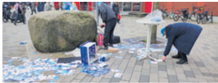
Die AfD-Flyer wurden auf den Boden geworfen

■ (mk) Neuenfelde. „Du bist wunderbar beschenkt!“ – unter diesem Motto steht die stets gut besuchte Veranstaltung der Gemeinde rund um die Neuenfelder Kirche im Organistenweg 7 am 1. Mai. Dazu sind alle Kinder von 0-18 Jahren wie immer eingeladen, Eltern und andere Erwachsene dürfen gern mitgebracht werden. Los gehts um 11 Uhr mit einer kurzen Familienandacht in der Kirche. Anschließend öffnet die Spielemeile und die beliebten Attraktionen wie die Hüpfburg, die Kistenrutsche sowie verschiedene Schmink- und Bastelangebote. Für das leibliche Wohl von Groß und Klein ist natürlich ebenfalls gesorgt: Mit Pommes, Würstchen, Stockbrot, Waffeln und Zuckerwatte ist für (fast) jede*n etwas dabei, solange der Vorrat reicht. Für Kinder sind alle Angebote einmal kostenlos, nachdem sie sich eine Laufkarte abgeholt haben. Für Erwachsene oder einen Nachschlag kosten die Essensangebote einen geringen Betrag, der direkt in die Finanzierung der Veranstaltung fließt. Diese endet um 16 Uhr.