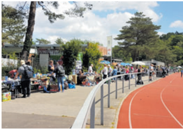
Der HNT-Flohmarkt findet 2024 am 15. Juni statt

Rund um den Flohmarkt wird es ab 12 Uhr ein buntes Programm für große und kleine Gäste geben. Auf die Besucher warten beim HNT-Sommerfest unter anderem eine spannende Rallye mit vielen Mitmachaktionen, eine Tombola, verschiedene Leckereien und Getränke sowie Spielangebote für den Nachwuchs. Dazu gibt es ei-