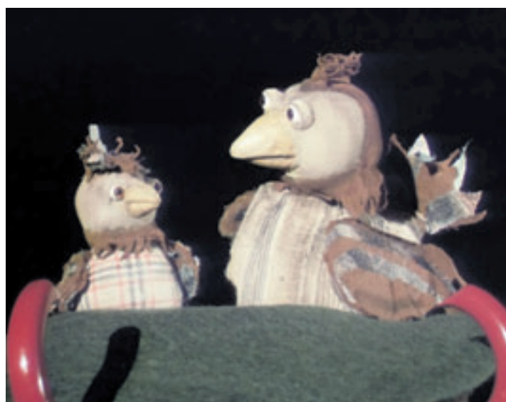
Am 5. Mai präsentiert das Kulturhaus Süderelbe das TANDERA THEATER mit dem Stück „Ratzenpatz“

Jetzt soll er auch noch fliegen lernen! Er traut sich nicht. Eines Tages sind alle anderen Spatzen unterwegs. Friedrich ist ganz allein. Genau darauf hat die Katze gewartet – eine abenteuerliche Geschichte übers Großwerden. Eintritt 6 Euro inkl. Suppe, gerne mit Voranmeldung unter tickets@kulturhaus-suederelbe.de oder Tel. 040 7967222. Restkarten an der Tageskasse ab 10.30 Uhr.