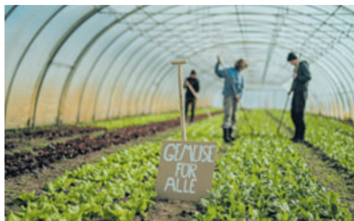
Gemüse für alle, heißt es bei der Solidarischen Landwirtschaft

■ (au) Hamburger Süden. Solidarische Landwirtschaften, kurz Solawi genannt, erfreuen sich immer größerer Beliebtheit. Das Grundprinzip: In einer Solawi tragen viele Menschen gemeinsam die Kosten eines landwirtschaftlichen Betriebs und erhalten im Gegenzug wöchentlich die Ernte (der Neue RUF berichtet). Im Hamburger Süden gibt es verschiedene Möglichkeiten, an einer Solawi teilzuhaben: Die Solawi Backerbse baut auf dem Arpshof in Wenzendorf an, der Wilkenshof in Rosengarten, der Verein Möhren & More in Itzenbüttel bei Jesteburg, die Solawi Zuwachs e.V. in Ollsen und die Solawi Superschmelz