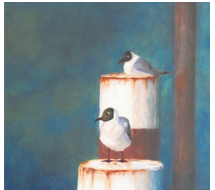
Realistische Darstellungen sind ein faszinierendes Kapitel in der darstellenden Kunst