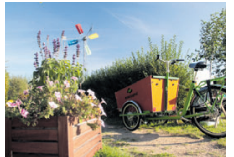
Das BUND-Recyclingfahrrad fährt am 5. Mai quer durch den Inselepark und klärt über Mülltrennung auf

genossen werden. Für Kaffee und Kuchen ist gesorgt, sodass alle einen schönen Tag im Garten erleben können – ganz gleich, ob alt oder jung. Der BUND Hamburg bietet eine weitere Station direkt am Wasser an. Hier geht es um Plastikmüll und Wasserqualität. Neben spannenden Mitmachangeboten gibt es auch viele Informationen rund um das Thema Wasser. Wer richtig aktiv werden will, kann direkt in eins der BUND-Kanus einsteigen und die umliegenden Gewässer von Müll befreien (#canoe4nature). Das ganze Angebot wird abgerundet von dem BUND-Recyclingfahrrad, das an diesem Tag quer durch den Inselepark fährt und über Mülltrennung aufklärt.