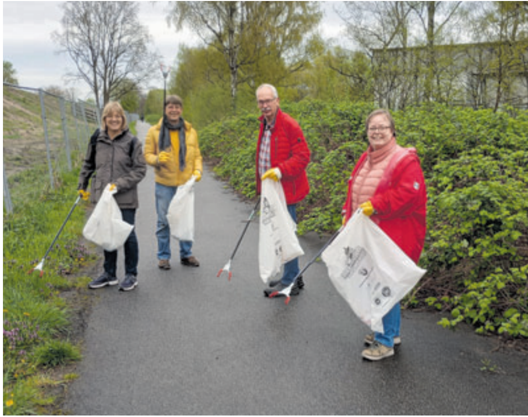
Mitglieder der Stadtteilpflege sammeln gemeinsam Müll

Für dieses Jahr hatte sich die Stadtteilpflegegruppe vorgenommen, die Sitzungsstruktur der Treffen anzupassen, um „in der wärmeren Jahreszeit“ auch ganz praktisch und sichtbar das Erscheinungsbild Wilhelmsburgs zu verändern und gemeinsam Müll zu sammeln. So fand das letzte Treffen am 9. April zunächst im Freien statt und es wurde im Bereich zwischen Bürgerhaus, Gert-Schwämme-Weg und Dratelnstraße eine Stunde lang fleißig gesammelt. Insgesamt kamen acht