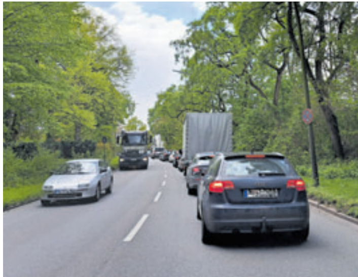
Ein gewohntes Bild auf der Bremer Straße: Die Autos stehen Stoßstange an Stoßstange. Ab Januar 2026 soll die wichtige Verbindung zu einer Einbahnstraße stadtauswärts werden

Im Juni dieses Jahres startet erstmalig Hamburg Wasser mit Leitungs-