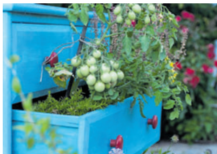
Der Frühling ist da, es können wieder Saaten in der Saatgutbibliothek mitgenommen und eingepflanzt werden.

dünn und dünn ...? Das gibt es doch nicht: Die anderen Tiere mopfen sich seine wertvollen Blätter. Am 22. Mai gibt es „Pettersson zeltet“, mit Text von Angelika Kutsch und Illustration von Sven Nordqvist: Der alte Pettersson und sein lebhafter Kater Findus sind auf einem neuen Abenteuer. Diesmal steht Zelten auf dem Programm, ein Vorhaben, das vor allem bei Findus große Begeisterung weckt. Er hat noch nie in einem Zelt geschlafen und ist voller Vorfreude auf die neue Erfahrung. Was die Flitzbogenwurfangel ist und wer noch alles mitkommt, erfahren die Kinder im Bilderbuchkino. Der Eintritt für die Veranstaltungen ist frei! Gruppen werden gebeten, sich anzumelden.