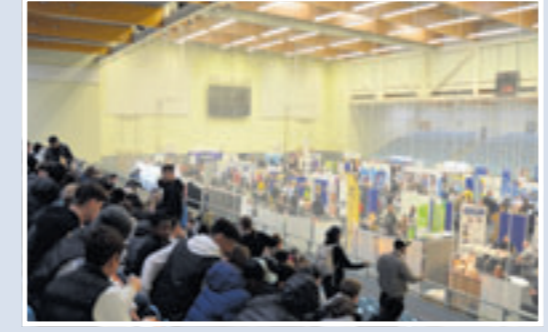
Ungewohntes Szenario: Auf den Rängen und dem Spielfeld der CU Arena drehte sich 2023 alles um die Süderelbe Jobmesse

■ (mk) Neugraben. Am 3. Mai von 10 bis 16 Uhr ist es wieder soweit. Dann geht in der CU-Arena, direkt am S-Bahnhof Neugraben gelegen, die nächste Jobmesse Süderelbe des TV Fischbek über die Bühne. Schirmherr dieser Veranstaltung ist in diesem Jahr das Sportidol, der Direktor Nachwuchs des HSV und Trainer der Frauenfußball-Nationalmannschaft, Horst Hrubesch. Obwohl diese Messe für einen kleinen Sportverein eine große Aufgabe darstellt, setzt der ausrichtende TV Fischbek auch in diesem Jahr auf Kontinuität und kommt den Wünschen nach, diese offene Berufs-, Aus- und Weiterbildungsmesse zu organisieren und zu veranstalten. Die Jobmesse Süderelbe versteht sich als Alternative zu den großen kommerziellen Ausbildungsmessen nördlich der Elbe. Hauptsächliches Anliegen der Veranstaltung ist es, Jugendlichen und Heranwachsenden, die sich in unserer Gesellschaft schwer tun, einen Weg ins Berufsleben aufzuzeigen. Die Jobmesse Süderelbe spricht sowohl junge Deutsche als auch Migranten an, die nur einen ungenügenden Schulabschluss vorzuweisen haben, die über mangelnde Bildung verfügen, die oft in sozialen Brennpunkten leben und wenig Vertrauen in staatliche Stellen haben. Auch für Flüchtlinge ist die Jobmesse Süderelbe ein geeignetes Anlaufziel. Aber natürlich ist dieses Event für alle da.