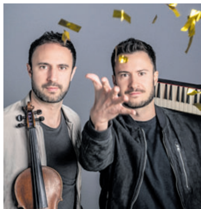
ASS Dur bringt Musik und Comedy, Mozart und Helene Fischer zusammen