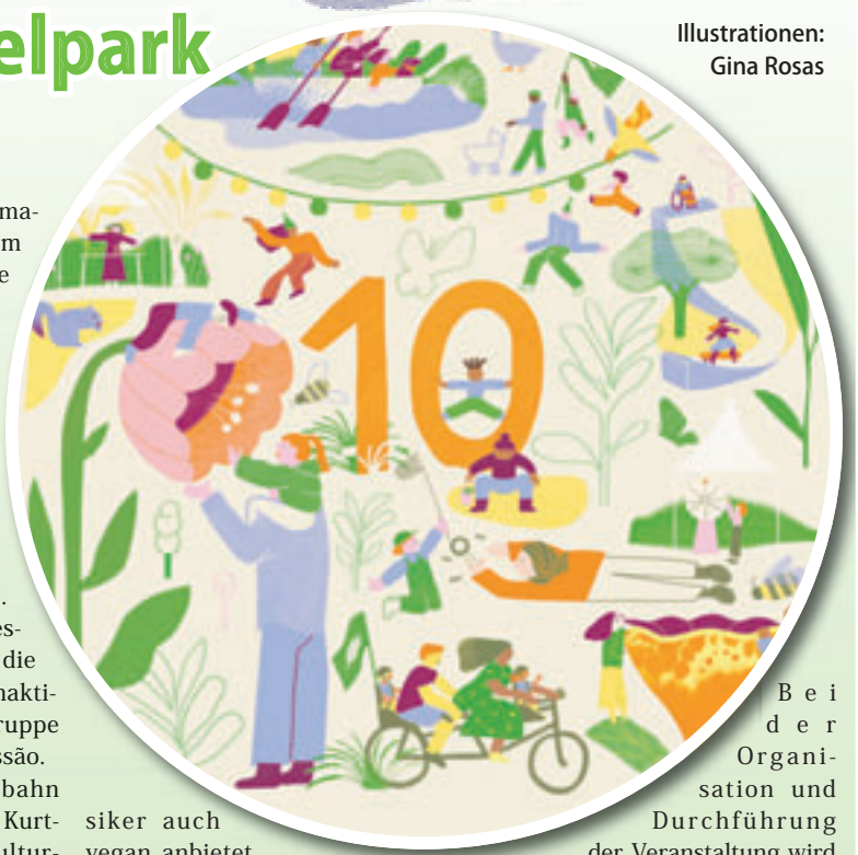
Illustrationen: Gina Rosas

wegungsprogramm zum Mitmachen. Highlight ist in diesem Jahr der circa 50 Meter lange Pumptrack, der mit Fahrrad, Scooter oder Skateboard befahren werden kann. Im BUND Naturerlebnispark im Süden des Parks gewährt ein Wilhelmsburger Imker Einblick in einen Bienenstock und kindgerechte Theaterstücke vermitteln erstes Naturwissen. An der KulturKapelle im Westen des Geländes erwarten die Gäste zum Beispiel Mitmachaktionen und Livemusik der Gruppe Bateria Altona Escola Percussão. Eine barrierefreie Elektrobahn verbindet emissionsfrei den Kurt-Emmerich-Platz mit der KulturKapelle, damit auch mobilitätseingeschränkte Menschen den gesamten Park komfortabel erkunden können. An den verschiedenen Stationen werden faire Leckereien angeboten: Vom selbstgebackenen Kuchen gegen Spende bis zum Foodtruck Piece For Peace, der hochwertig zubereitete Imbissklas-