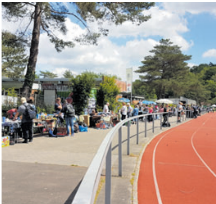
Der HNT-Flohmarkt findet 2024 am 15. Juni statt

für große und kleine Gäste geben. Auf die Besucher warten beim HNT-Sommerfest unter anderem eine spannende Rallye mit vielen Mitmachaktionen, eine Tombola, verschiedene Leckereien und Getränke sowie Spielangebote für den Nachwuchs. Dazu gibt es einen Einblick in die große Sportwelt der HNT. Die Gebühr für einen Stand auf dem HNT-Flohmarkt beträgt 15 Euro für 3 lfd. Meter. HNT-Mitglieder zahlen nur 10 Euro. Der Aufbau ist ab 9 Uhr möglich. Wer Fragen hat, kann sich gerne an das HNT-Sportbüro wenden, E-Mail sportbuero@hntonline.de oder Tel. 040 7017443.