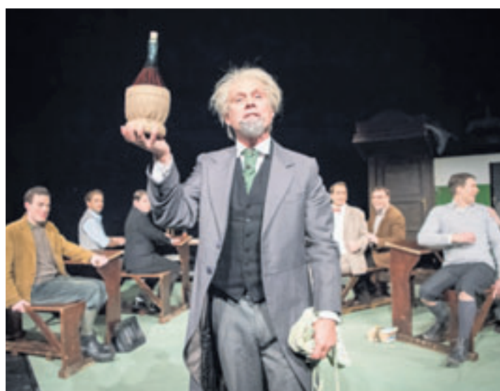
Auch in diesem Jahr ist natürlich die Feuerzangenbowle wieder da. Am 21. Dezember treibt der Schüler Pfeiffer mit drei „f“ seinen Unfug im Klassenzimmer