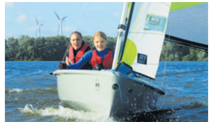
Zwei Jollenseglerinnen der Segelvereinigung Sinstorf beim Segeln auf dem Neuländer See.

■ (au) Neuland. Am Sonntag, 5. Mai, von 11 bis 16 Uhr bietet die Segelvereinigung Sinstorf auf dem Neuländer See in Harburg-Neuland ein kostenloses Schnuppersegeln an. Für Kinder ab acht Jahren stehen moderne Jollen zur Verfügung – egal, ob sie nur mal mitfahren oder gleich selber steuern möchten. Die Trainer sind im Motorboot immer in der Nähe. Es sind keine Vorkenntnisse im Segeln nötig, aber Schwimmkenntnisse (Bronze). Mitzubringen sind wettergerechte Kleidung, festes Schuhwerk (am besten Turn-