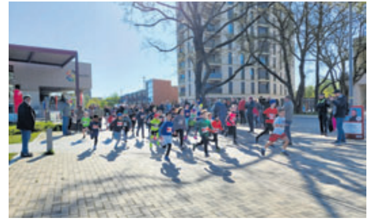
Der Start des Kinderlaufs

spielt. Nur der Wind hat gerade den Teilnehmenden der 21 Kilometer auf der langen Hohenwischer Straße gut entgegengepustet.“