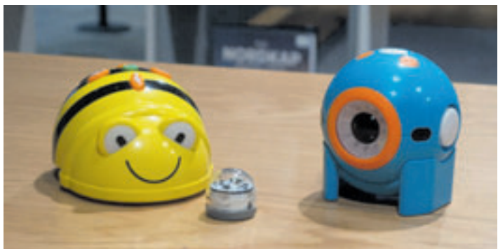
Mit den „Beebots“ und „Ozobots“ lernen schon die Kleinsten zu programmieren.