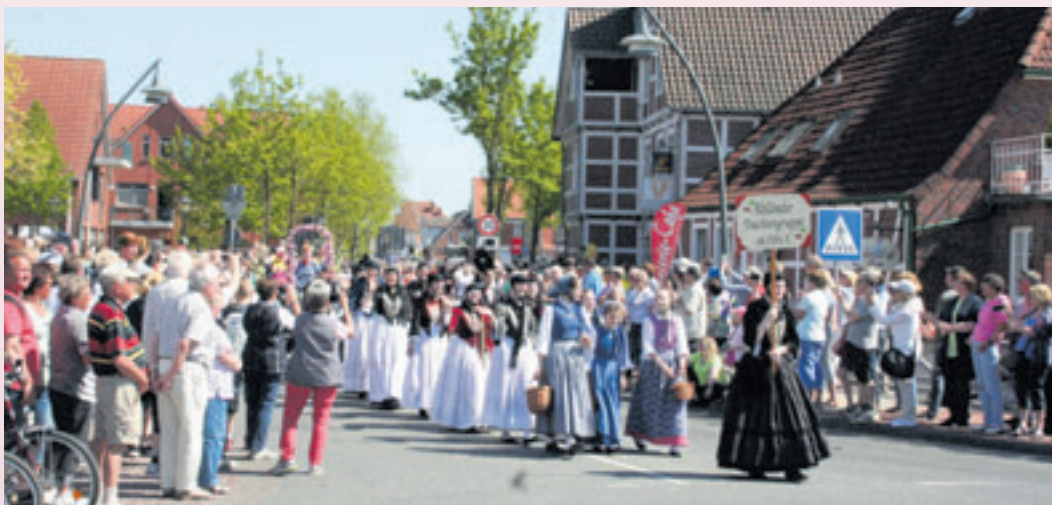
Auch 2024 wird die Altländer Trachtengruppe mit von der Partie sein.

unter der Rubrik Tourismus oder Veranstaltungstermine). Gern gesehener Gast ist sie auch bei Fernsehsendern und in anderen Medien. Für das Amt der Altländer Blütenkönigin können sich junge Frauen aus dem Alten Land bewerben. Aus den Bewerbungen erwählt dann eine Jury die neue Majestät. Welche Kandidatin letztlich Altländer Blütenkönigin geworden ist, ist wohl das bestgehütete Geheimnis im Alten Land, denn vor der offiziellen Krönung am Samstag wird ihr Name streng geheim gehalten. Auf die Gäste warten circa 60 Stände von Kinderschminken, Kultur bis Kunsthandwerk, von Obstständen bis Obstler, von Bratwurst bis Bratfisch. Und auf der Bühne steht ein abwechslungsreiches Programm mit Tradition und Kultur im Mittelpunkt. Informieren Sie sich gern in jedem Jahr über den Programmablauf in aller Ruhe und lassen sich Ihre persönlichen Highlights dann nicht entgehen.