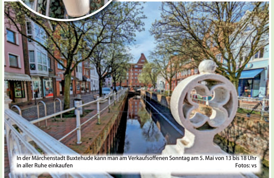
In der Märchenstadt Buxtehude kann man am Verkaufsoffenen Sonntag am 5. Mai von 13 bis 18 Uhr in aller Ruhe einkaufen