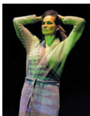
Alexandra Kamp spielt die verzweifelte und verlassene Geliebte in „Eine verhängnisvolle Affäre“

Los geht die neue Saison am 4. Oktober mit „Loriots heiler Welt“. Hier können sich die Fans unter anderem auf „Weihnachten bei den