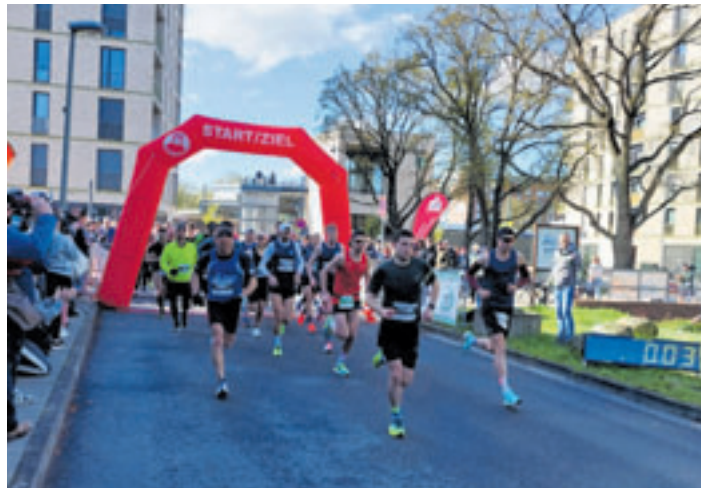
Der Start des Halbmarathons

ger der HNT-Leichtathletik-Abteilung freute sich auch über die Zahl der Läufer: „Die 525 Anmeldungen sind gegenüber dem Frühjahr 2023 eine gute Steigerung. Und das, obwohl wir eine Woche vor dem Marathon Hamburg keinen idealen Zeitpunkt erwisch haben. Aber das Wetter hat uns heute bestens in die Karten ge-