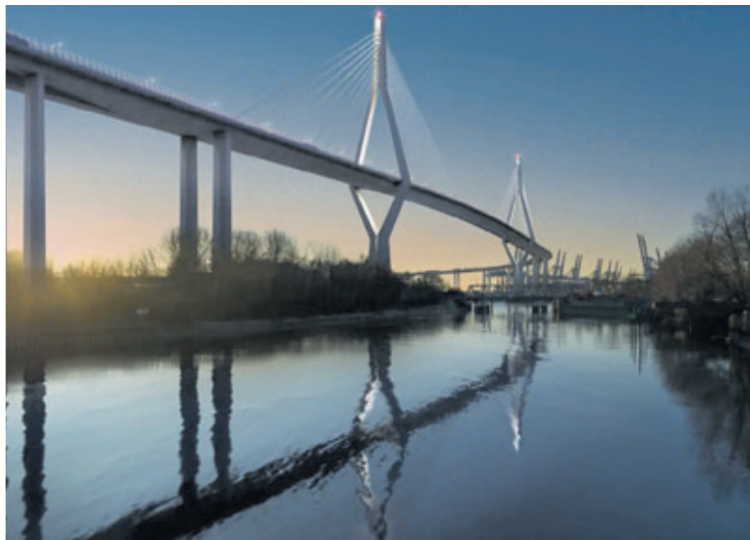
Auch die neue Köhlbrandbrücke soll wieder ein prägendes Hamburger Wahrzeichen werden

Insgesamt soll die Brücke mit 73,5 Metern 20 Meter höher sein als die alte, damit auch größere Schiffe drunter durch fahren können, insgesamt soll die Brücke fünf Kilometer lang werden. Nun soll es schnell weiter gehen mit der Realisierung des Projekts. Ziel sei die Verkehrsfreigabe der neuen Köhlbrandbrücke bis Ende der 2030er-Jahre. Das Projekt verlaufe planmäßig, auch die Kosten