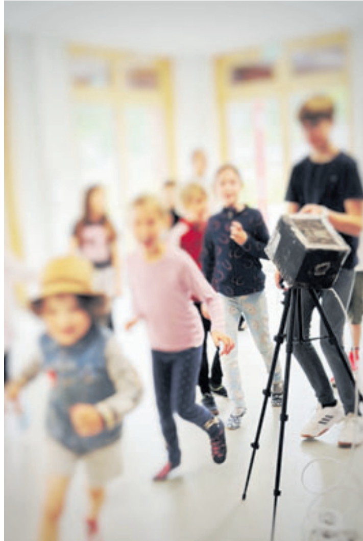
Der Sommerferien-Workshop richtet sich an Kinder und Jugendliche im Alter von 6 bis 15 Jahren

Weitere Informationen und Anmeldung unter www.theaterschuleneugraben.de .