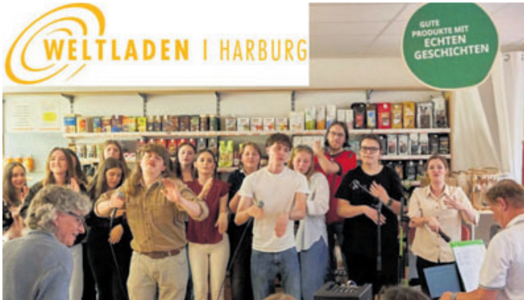
Der Gospel Train begeistert am 19. Juni bereits zum vierten Mal das Publikum im Weltladen Harburg in der Hölertwiete

■ (au) Harburg. Wie kann die Sommersaison besser beginnen als mit frischer Harmonie und Rhythmus?