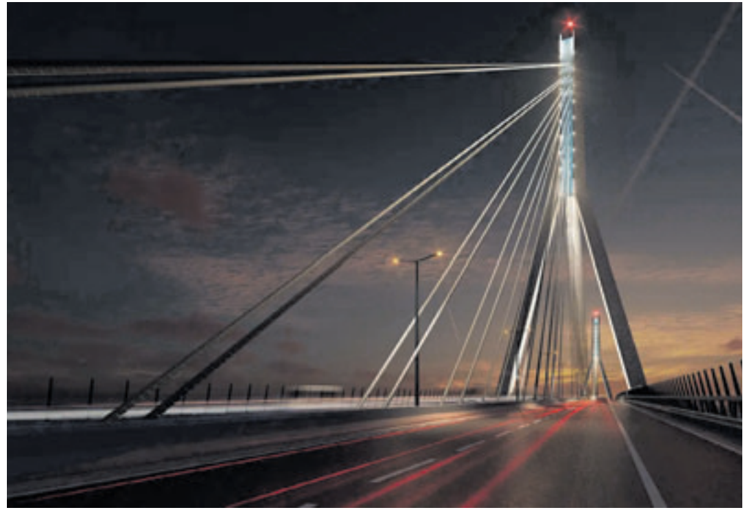
In einer Ausstellung im Hamburger Rathaus können sich Interessierte die Visualisierungen des Siegerentwurfs und weitere eingereichte Konzepte anschauen