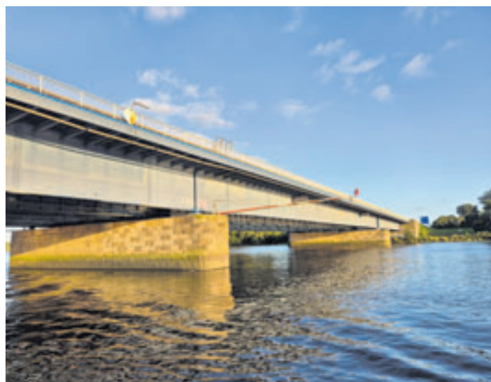
Die Süderelbbrücken sind in die Jahre gekommen, die Vorbereitungen für einen Ersatzneubau laufen

Die Umleitungsstrecke U 76 ist ausgeschildert: Anschlussstelle (AS) Stillhorn – B75 AS Kornweide – AS Neuland – AS A1 Harburg.