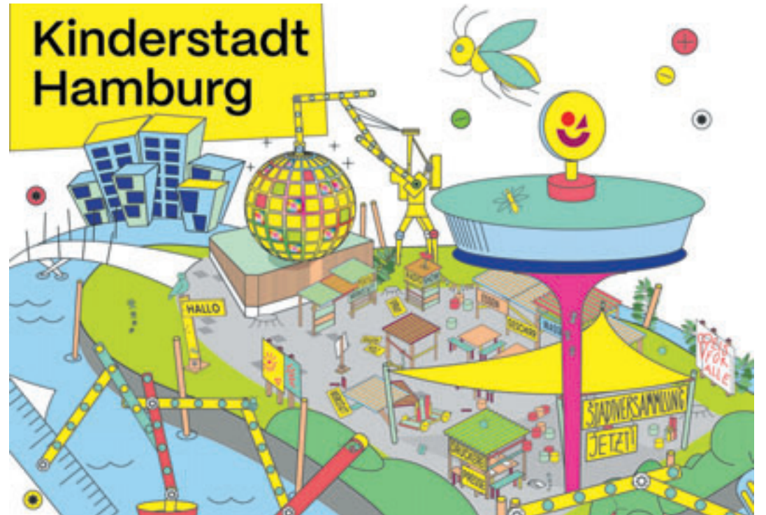
Die Kinder entwickeln Stadtregeln, treffen Entscheidungen, übernehmen Verantwortung und erleben unmittelbar, wie demokratische Prozesse funktionieren

Wissenschaft, Produktion und öffentlichem Leben. Mehr als 30 Arbeitsbereiche laden die Kinder und Jugendlichen dazu ein, gemeinsam mit Expertinnen und Experten ihre Stadt selbst zu gestalten und eigene Ideen umzusetzen. Die Kinderstadt Hamburg wurde 2021 von der Patriotischen Gesellschaft von 1765 initiiert und wird seit 2024 in Kooperation mit dem Bildungszentrum und Träger für Kinder- und Jugendarbeit dock europe e.V. veranstaltet. Weitere Informationen unter https://kinderstadt.hamburg .