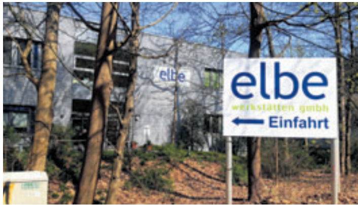
Wird es eine inklusive Gastronomie der Elbe-Werkstätten auch im Kulturhaus Harburg geben?

Zunächst wird Altbekanntes wiederholt: Das Bürgerhaus sei ein besonderer Begegnungsort, der allen Menschen und Personengruppen offen stehe, die kulturell, sozial und/oder stadtteilentwicklungspolitisch aktiv seien oder dies sein möchten. Zudem biete es Vereinen und Initiativen die Möglichkeit, Räume zu nutzen und Kurse oder Veranstaltungen durchzuführen. Eine Gastronomie vorzuhalten oder als Träger inklusiver Arbeitsplätze zu betreiben, sei keine Kernaufgabe eines Bürgerhauses, obwohl diese Angebote grundsätzlich begrüßenswert sind. Zudem sei der Betrieb von Bürgerhäusern wirt-