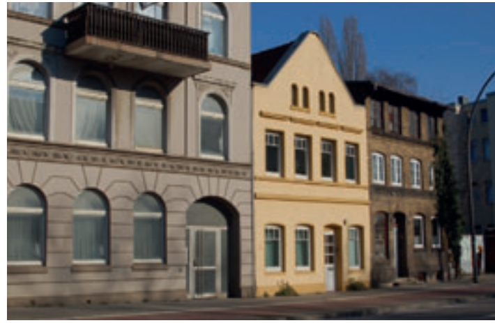
Die ehemalige „Hilke“ Spirituosen- und Likörfabrik (rechtes Haus) in der Straße Karnapp im Harburger Binnenhafen ist ein bedeutendes Denkmal der Harburger Stadt- und Hafententwicklung