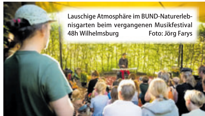
Lauschige Atmosphäre im BUND-Naturerlebnisgarten beim vergangenen Musikfestival 48h Wilhelmsburg

Live-Musik im Rahmen von 48h Wilhelmsburg. Folgende Bands spielen: – 13 bis 14 Uhr Nasmat Hamburg (Orientalische Melodien, Flamenco und internationale Einflüsse) – 15 bis 16 Uhr Awa (Westliche Elemente verschiedener Musikstile mit persischen Motiven) – 17 bis 18 Uhr Jade Lagoon (Indie Folk/Pop/Rock Band mit Mandoline und mehrstimmigem Gesang). „Kommt zahlreich und erfreut euch an Live-Musik in unserem kleinen wilden Naturparadies. Für Kaffee & Kuchen herzhaft Snacks und das erste WiWi-Bier wird gesorgt. In den Umbaupausen könnt ihr mit uns die Wunderwelt in unseren Teichen bestaunen! Kaulquapen, Libellenlarven und Molche hautnah“, so Schaich. Für jedes Alter, Teilnahme kostenlos, keine Anmeldung nötig.