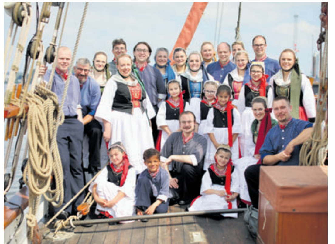
Begeistern weit über die Grenzen Finkenwerders und Hamburgs hinaus die Menschen: Die Finkwarder Speeldeel und die Lütt Finkwarder Speeldeel

heraus. Damit begann eine Zusammenarbeit, aus der über die Jahre eine enge und gewachsene Freundschaft entstanden ist – getragen von gemeinsamer Musik und vielen unvergesslichen Momenten. Rolf Zuckowski, Ehrenmitglied des Vereins, hat zahlreiche Lieder für die Finkwarder Speeldeel geschrieben. Karten gibt es für 20 Euro, ermäßigt 14 Euro, zu kaufen über www.finkwarder-speeldeel.de und über die Bücherinsel.