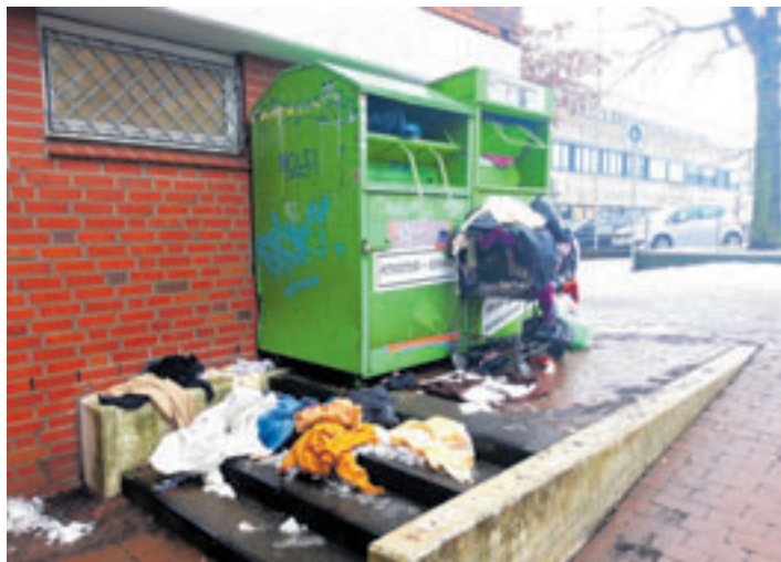
Vermüllung gehöre laut FDP ebenfalls zu den Problemen, die die Bürger bewegen

Platz 4: Sauberkeit und Stadtbild Ein weiteres zentrales Thema ist die Sauberkeit in Harburg. Verschmutzte Straßen, herumliegender Müll und ein insgesamt ungepflegtes Erschei-