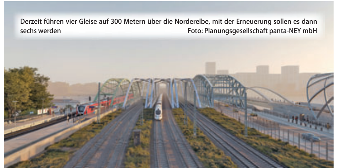
Derzeit führen vier Gleise auf 300 Metern über die Norderelbe, mit der Erneuerung sollen es dann sechs werden

Nicht nur die beiden alten sollen ersetzt, eine dritte, zusätzliche Brücke soll ebenfalls gebaut