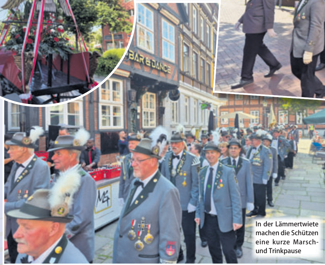
In der Lämmertwiete machen die Schützen eine kurze Marsch- und Trinkpause