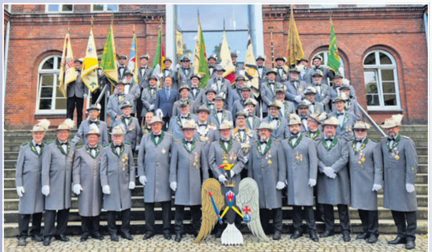
Zum traditionellen Gildefoto vor der TUHH kamen wieder zahlreiche Mitglieder der Harburger Schützengilde zusammen