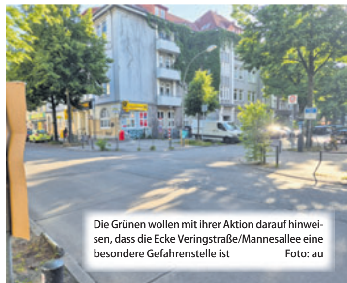
Die Grünen wollen mit ihrer Aktion darauf hinweisen, dass die Ecke Veringstraße/Mannesallee eine besondere Gefahrenstelle ist

■ (au) Wilhelmsburg. Am 20. Juni ist der Tag der Verkehrssicherheit. Aufgrunddessen veranstaltet die Stadtteilgruppe Wilhelmsburg/Veddel der Grünen von 11 bis 14 Uhr ein Straßenfrühstück an der Ecke Veringstraße/Mannesallee. Die Organisatoren wollen darauf hinweisen, dass ihrer Meinung nach dort eine besondere Gefahrenstelle ist. Das Ende der 25-km/h-Zone verleite viele dazu, aufs Gas zu gehen. Zudem rasen viele schnell um die Kreuzung in die Mannesallee, um dort vor anderen einen Parkplatz vor der Bankfiliale zu ergattern. Zudem kreuzt sich dort „der Verkehrsweg von Fußgänger:innen und Radfahrer:innen, die zu Kitas, Schulen,