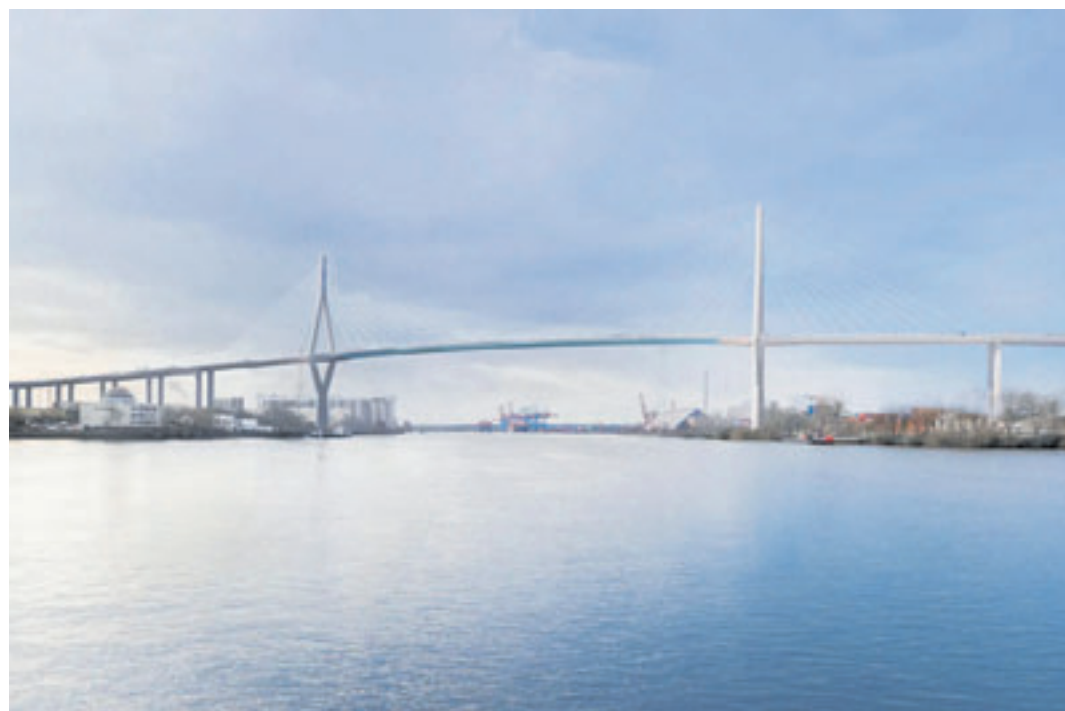
Der Siegerentwurf knüpft an die charakteristische Bestandsform mit zwei Pylonen und Schrägseilen an und führt sie in zeitgemäßer Form weiter Visualisierung: GRASSL, sbp, WTM, gmp, PPL/Rendering Gärtner + Christ

Siegerentwurf für neue Köhlbrandbrücke vorgestellt