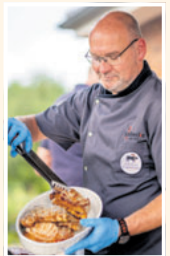
Die Experten vom Geflügelhof Schönecke beraten Ihre Kunden kompetent und professionell

■ (au) Harburg. Die Grillsaison ist in vollem Gange – und die Experten vom Geflügelhof Schönecke haben genau das Richtige, um das geliebte BBQ noch abwechslungsreicher zu gestalten! „Entdecken Sie unsere vielfältigen Geflügelspezialitäten, die perfekt auf den Grill passen – saftig, aromatisch und ideal für laue Sommerabende. Unser Team berät Sie gerne und hilft Ihnen, die passenden Produkte für Ihr Grillvergnügen zu finden. Dazu bieten wir eine große Auswahl an bunten Feinkostsalaten – frisch, leicht und voller Geschmack. Perfekt als Beilage fürs Grillen oder fürs Picknick im Grünen. Besuchen Sie uns auf dem Wochenmarkt am Sand und lassen Sie sich inspirieren – wir freuen uns darauf, Sie bei Ihrem nächsten Grillmoment zu begleiten!“