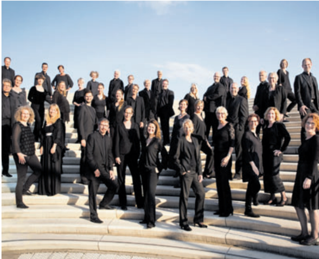
Im Laufe seines Bestehens hat der Harvestehuder Kammerchor bei verschiedenen Wettbewerben Preise gewonnen, nun zeigt er sein Können in der Kreuzkirche

■ (au) Wilhelmsburg. Am Sonntag, 21. Juni, steht um 17 Uhr das nächste Sommerkonzert in der Kreuzkirche Kirchdorf, Kirchdorfer Straße 170, auf dem Plan. Bei den Sommerkonzerten gibt es an ausgewählten Tagen klassische Konzerte à 45 Minuten. Das Konzept dabei: Die Musiker spielen, Besucher kommen, hören zu, verweilen oder aber gehen auch wieder nach ein paar Minuten, frei nach dem Motto „Alles kann, nichts muss!“.