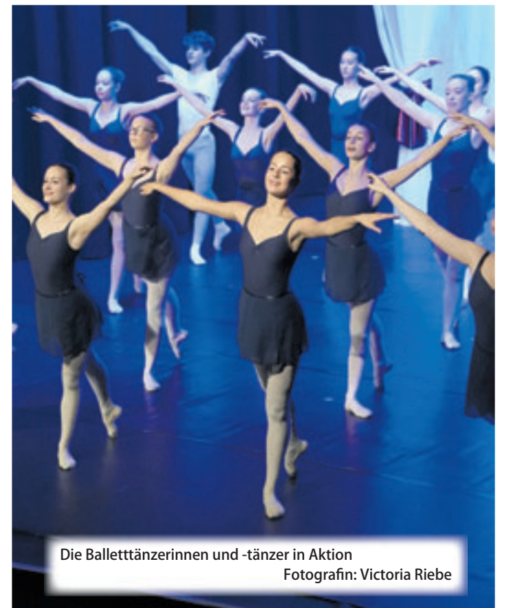
Die Balletttänzerinnen und -tänzer in Aktion