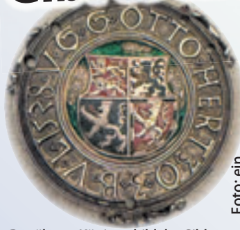
Das älteste Königsschild der Gilde vom Gründer der Gilde, Herzog Otto I.